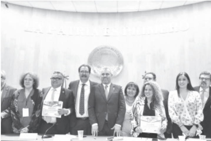
El sector minero aporta más de mil 600 millones de dólares al PIB del estado, donde actualmente hay 116 unidades mineras, 101 son minas que emplean a más de 12 mil trabajadores.

-El gobernador comentó que en el puerto michoacano inicia la única ruta ferroviaria que recorre todos los países del T-MEC.