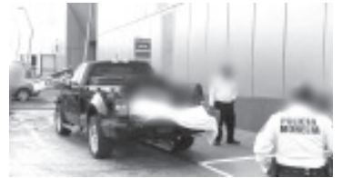
Sus compañeros lo subieron a la bodega de una camioneta y lo llevaron al Hospital Victoria, sin embargo, cuando llegaron el masculino ya no tenía signos vitales.

El caso fue reportado a la Fiscalía General del Estado (FGE), cuyos elementos de la Unidad de Atención Inmediata se encargaron de las investigaciones respectivas y trasladaron el cadáver a la morgue para la práctica de la necropsia de ley. Del hoy difunto solo se supo que respondía al nombre de Edgar X