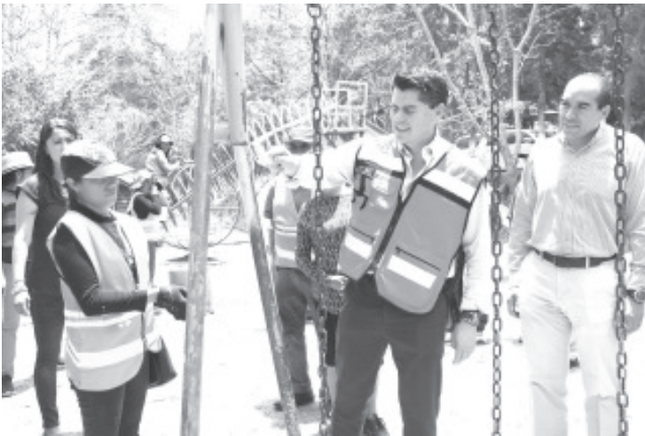
La labor consiste en la recuperación de sus áreas verdes, juegos y convocar a los vecinos a dar mantenimiento al lugar para que los menores de esta zona cuenten con espacio digno.

"Como #CiudadPorLasYLosNiños trabajamos en brindar más y mejores centros de recreación y esparcimiento para la infancia zitacuarenses", destacó el presidente municipal.