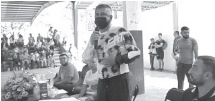
La sede fue la Unidad Deportiva La Joya en esta ciudad y contempló encuentros de fútbol y basquetbol varonil y femenino.

“Con este evento queremos mandar un mensaje de armonía a la población, el magisterio no solo toma oficinas como rentas o las carreteras; también nos gusta trabajar en las aulas, hacer deporte y más”, explicó.