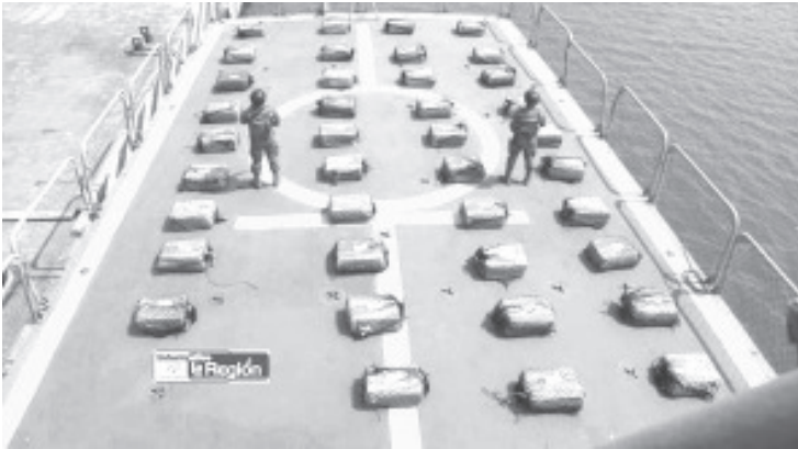
A 54 millas náuticas (100 kilómetros) al sur de las costas de Lázaro Cárdenas se observó a tres embarcaciones que realizaban actividades sospechosas, fueron revisadas y encontraron la droga.

Los civiles, las embarcaciones y el enervante fueron presentados ante el Ministerio Público Federal para que realizara la carpeta de investigación correspondiente.