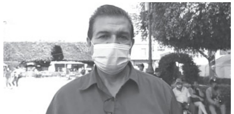
Esta problemática tiene que ver con la actual temporada de estiaje, ya que durante este periodo se registran muy bajos los niveles en los pozos y manantiales.

Invitó a la población que tengan problemas con el suministro de agua, a reportarlo al número 153 1221, o bien mediante la página de facebook de la dependencia, vía WhatsApp y a través de todos los canales de comunicación con los que se cuenta.