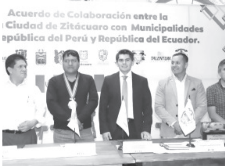
Con el hermanamiento, se estrechan lazos de colaboración para el intercambio de culturas, experiencias y políticas públicas que favorecerán en resolver las demandas de nuestras comunidades.