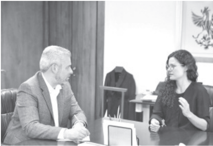
El gobernador reiteró el compromiso de su administración para que los jornaleros agrícolas cuenten con prestaciones de ley y seguridad social.

Ciudad de México, 25 de mayo del 2022.- El gobernador Alfredo Ramírez Bedolla se reunió con Luisa María Alcalde Luján, secretaria del Trabajo y Previsión Social (STPS) del Gobierno de México para avanzar con el proceso de regularización de los derechos laborales de los trabajadores de la industria aguacatera.