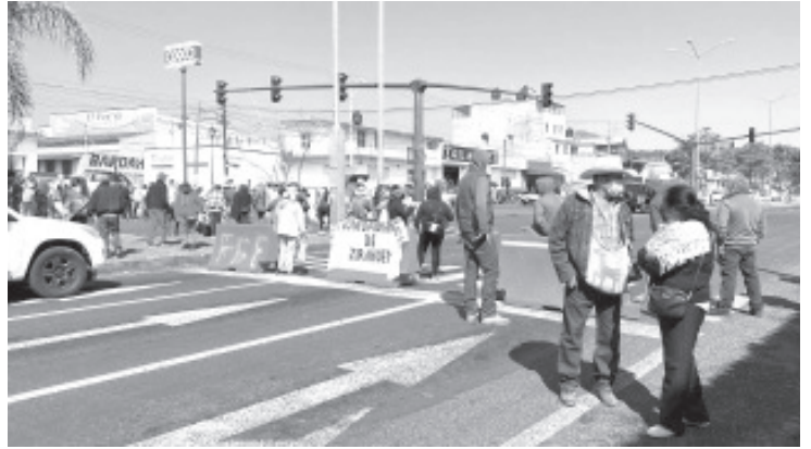
En respaldo de los procesos de autonomía de las comunidades de Jarácuaro, Nuevo Zirosto y San Francisco Peribán, así como en defensa del territorio comunal de Zirahuén, bloquearon 6 carreteras.

3.- El inicio de los trabajos por parte del Instituto Electoral de Michoacán para la consulta libre, previa, informada y vinculatoria de las Comunidades de Nuevo Zirosto y San Francisco Peribán para que en asamblea general, decidan si desean ser autónomos.