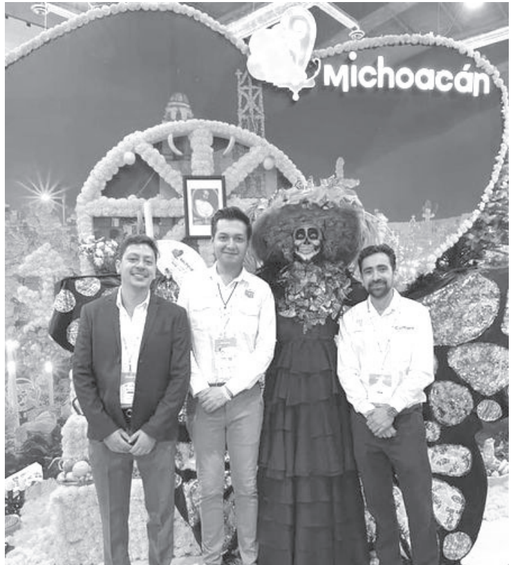
La Secretaría de Negocios, Inversión y Turismo de Zitácuaro está participando en el Tianguis Turístico de México, en el puerto de Acapulco.

El evento es el más grande e importante del país en su tipo, donde exponemos nuestras distintas riquezas históricas, culturales, naturales y gastronómicas, así como capitalizamos alianzas con otros estados y naciones para generar mayor crecimiento y desarrollo del municipio. Como #GobiernoDeSoluciones visualizamos todas las oportunidades de exponer el potencial que representa Zitácuaro para atraer inversión y más visitantes.