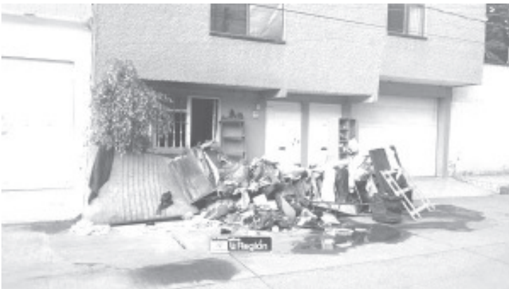
Durante la madrugada se registró un incendio en casa habitación de la colonia Nueva Valladolid, de Morelia, solo causó daños materiales.

Después de algunos minutos, los vulcanos estatales sofocaron las llamas. Hasta el momento se desconoce cómo inició el fuego. En las labores de auxilio también apoyaron policías.