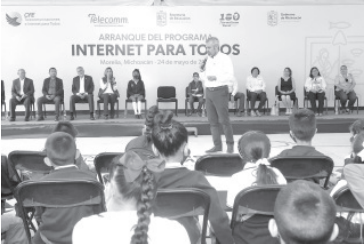
Añadió el mandatario, que se van a instalar mil 600 antenas de Internet, de las cuales ya están habilitadas mil 165 con el objetivo de que las más de 11 mil escuelas cuenten con el servicio gratuito.

-Ya se han instalado antenas que benefician a 400 localidades en 65 municipios