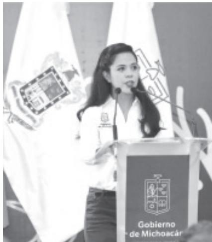
“Las mujeres que salen de los refugios, así como de las mujeres que salen de prisión”. A ellas se les otorgará un crédito de hasta 50 mil pesos con un interés anual del 3%.

Morelia, Michoacán a 23 de mayo del 2022.- Con el fin de lograr la autonomía económica de las mujeres michoacanas, se presentó el Programa Integral de Financiamiento Fuerza Mujer, gestionado por el Sistema Integral de Financiamiento para el Desarrollo de Michoacán (Sí Financia), en coordinación con las secretarías de Igualdad Sustantiva y Desarrollo de las Mujeres Michoacanas (Seimujer) y de Desarrollo Económico (Sedeco), así como el ICATMI.