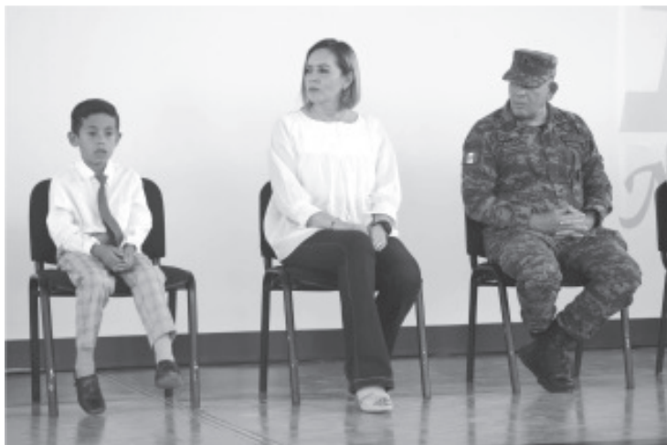
No se tolerará ningún tipo de violencia en los planteles, seremos tajantes ante actos que vulneren a las y los niños, así como a los jóvenes, señaló la secretaria de Educación.

Además, la autoridad educativa hace un llamado a que ante cualquier caso de violencia se denuncie al correo michoacancopreveem@gmail.com, al número 4436883747 o acudiendo directamente al área de Consejo Preventivo de la Violencia Escolar en el Estado de Michoacán (Copeveem) que se ubica en las oficinas centrales de la Secretaría.