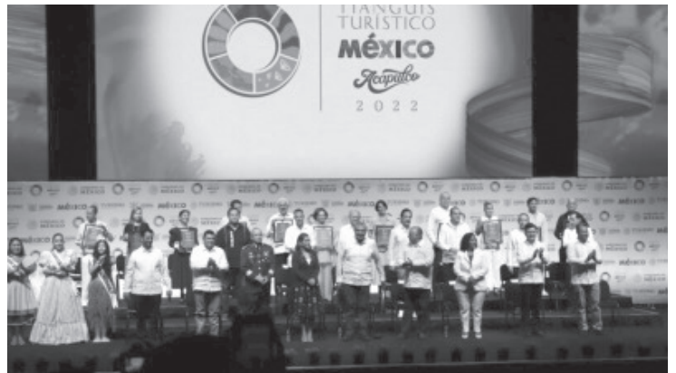
Los prestadores de servicios acudieron a los talleres sobre Generación de Producto Turístico, con la finalidad de obtener el mayor beneficio de las citas de negocios.

En el acto protocolario de inauguración, se anunció que la próxima edición del Tianguis tendrá lugar en Ciudad de México y que el siguiente Tianguis Nacional de Pueblos Mágicos se llevará a cabo en Oaxaca.