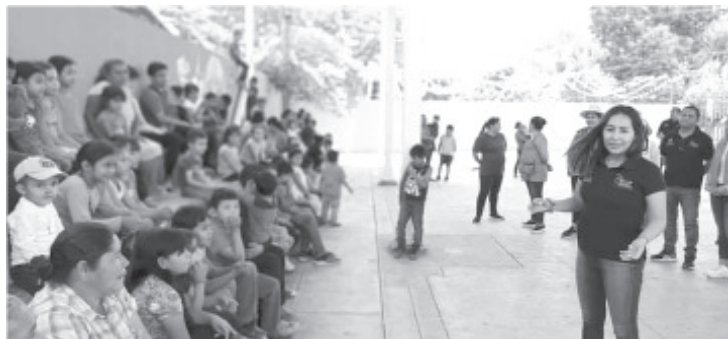
La diputada visitó las localidades de: Las Majadas, Mesas de Enandío, La Palma de Chichimequillas y La Coyota, en la que resolvió diversas gestiones de la población.

Durante estas giras de trabajo para atender las gestiones y hacer equipo con la gente, la diputada local realizó diversas festividades para celebrar a las mujeres y a las madres, a quienes también hizo entrega de apoyos.