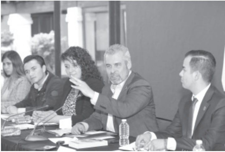
Debemos lanzar una gran consulta a los jóvenes para obtener un punto de partida y trabajar con empresarios, campesinos, jóvenes que ya perciben un salario, pero también en universidades y preparatorias.