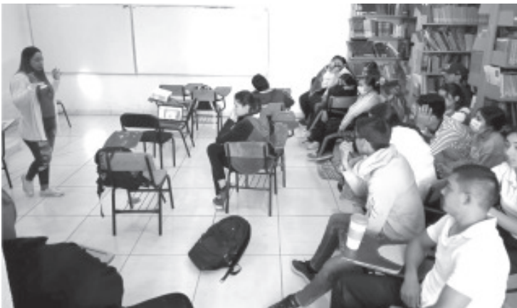
La conferencia “Embarazo de alto riesgo, prevención de embarazo en adolescentes y control prenatal”, impartida por personal de la unidad del Imss.

“En nuestro centro educativo tenemos jóvenes talentosos, pero también queremos jóvenes sanos y vamos a continuar con estas actividades de salud para toda la comunidad del Cemsad”, externó.