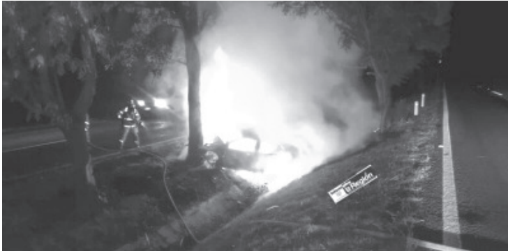
Dos personas fallecieron calcinadas luego de que el vehículo en el que viajaban se accidentó y ardió en llamas a la orilla de la carretera Morelia-Pátzcuaro.

Los agentes y peritos criminalistas de la Unidad de Atención Inmediata se encargaron de las investigaciones correspondientes y trasladaron los cadáveres a la morgue. La identidad de los finados es desconocida.