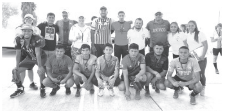
El torneo concluyó con la selección de 10 jóvenes en la rama varonil y 10 en la rama femenil; quienes representarán al estado en el Campeonato Nacional "De la Calle a la Cancha".

La Fundación TELMEX Telcel continuará impulsando acciones permanentes que ayuden a la juventud a mejorar sus condiciones de vida.