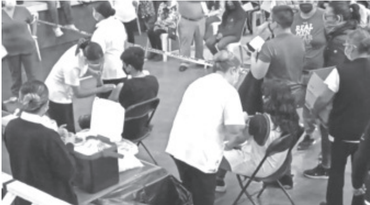
Son dos posibles razones: una, porque desconfían del biológico y dos, porque se han confiado en que no hay casos positivos ni defunciones y al relajamiento de las medidas sanitarias.

- Es el sector que ha tenido menos respuesta