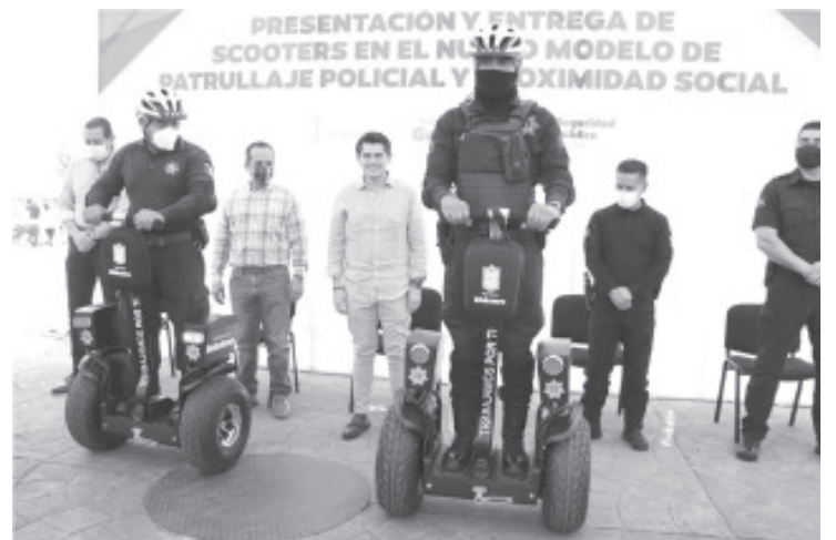
Una ciudad segura empieza desde el centro y sus avenidas, y esto no es posible si desde el centro no hay una estrategia de trabajo coordinado.

Agregó que confía en la Secretaría de Seguridad Pública y en que todos los policías hombres y mujeres son de bien; formados y bien entregados con la camiseta bien puesta por su ciudad, por ello en breve comenzará con la entrega de lotes para sus viviendas.