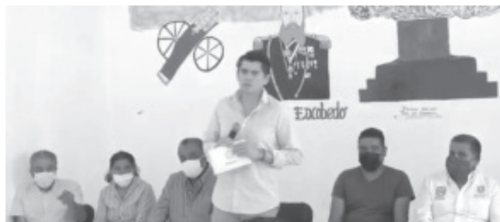
El programa forma parte del gobierno municipal, para apoyar al campo y abarca desde la capacitación para la producción, comercialización y aprovechamiento con la creación de platillos.

“Será una celebración en grande para los más de 48 mil jóvenes que se estima que hay en el municipio”, comentó Eduardo Vázquez