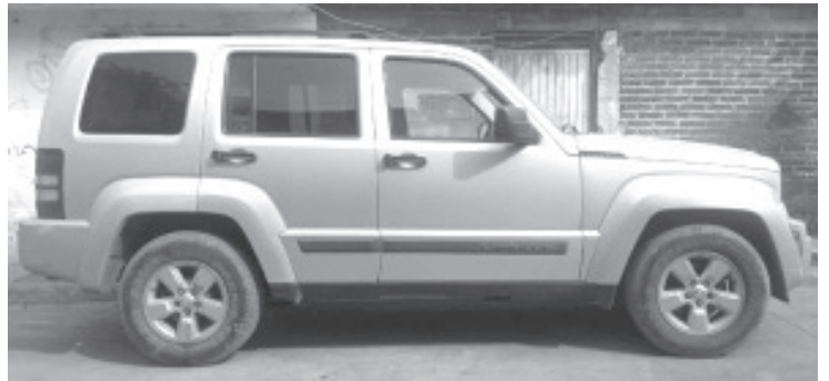
En labores de patrullaje resalta la recuperación de 23 automóviles, de los cuales algunos contaban con reporte de robo y otros que presentaron alteraciones en sus medios de identificación.

La SSP se encuentra al servicio de la población a través de los números de emergencia 911 y 089, para atender sus denuncias y brindar apoyo oportuno en caso de ser necesario.