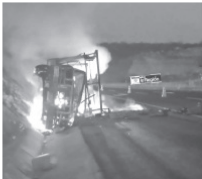
Una camioneta, aparentemente sufrió una falla mecánica al pasar por una curva, se salió control, chocó contra la guarnición central, se volcó e incendió.

Los socorristas auxiliaron a cinco heridos y los llevaron al Hospital Regional.