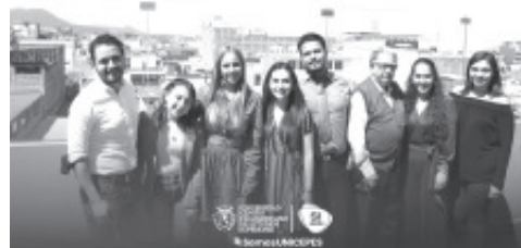
Maestros integrantes de la Universidad de Estudios Superiores del COLEGIO PANAMERICANO "UNICEPES". Que fue Reconocida su labor Educativa este 15 de Mayo. ¡FELICIDADES!