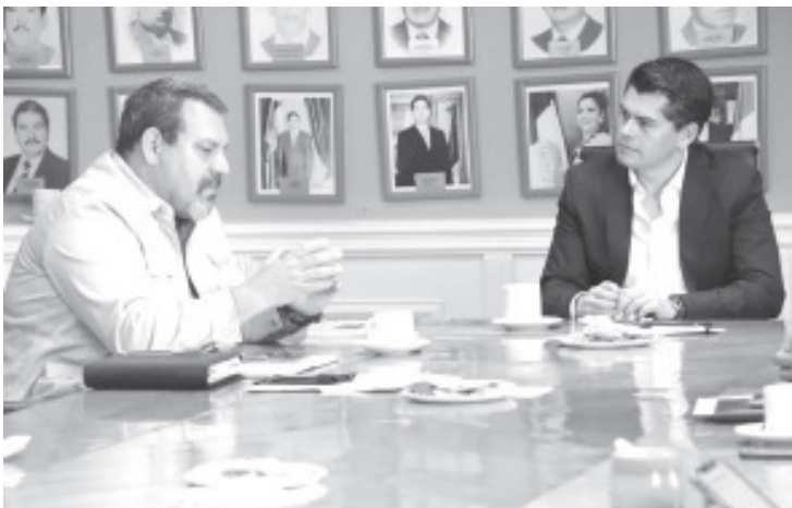
El alcalde se reúne con el titular de Secretaría del Medio Ambiente, para promover actividades para cuidar y fomentar la ecología.

Como parte de nuestra agenda de #SolucionesVerdes, articulamos trabajos y acciones con la Secretaría de Medio Ambiente en Michoacán, con el propósito de impulsar un municipio altamente sustentable. Hoy sostuvimos una importante reunión con el titular de este organismo, con quien venimos trazando una serie de actividades y estrategias para continuar protegiendo las 26 mil hectáreas de bosques que nos rodean y donde se alberga la Mariposa Monarca. Abordamos, además, temas como la optimización de los mantos acuíferos; continuar avanzando en el proyecto del nuevo relleno sanitario que cumpla con los estándares internacionales de manejo de residuos, el desarrollo del vivero municipal, entre otras políticas dirigidas a la preservación de nuestro entorno.