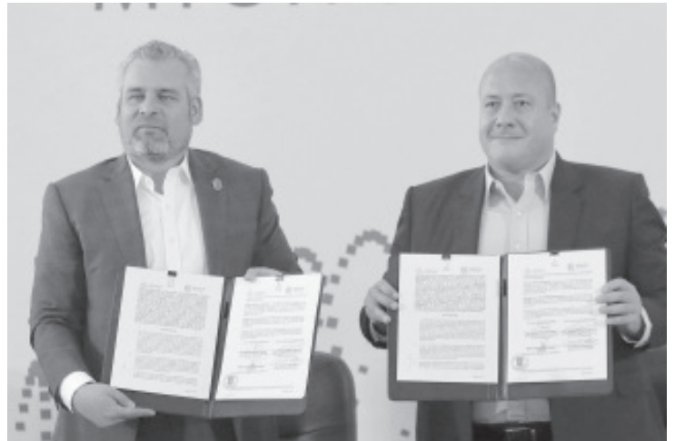
Los gobernadores ratificaron su convicción de trabajar de manera conjunta en el combate a la delincuencia en las zonas fronterizas entre ambos estados.

Finalmente, el acuerdo también promoverá la colaboración institucional en los ámbitos educativo, cultural y artístico; acciones vinculadas a la investigación, identificación y conservación del patrimonio artístico y el