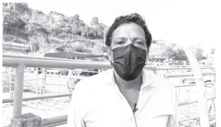
Anteriormente cada jueves en el tianguis se hacían en promedio unas 130 ventas de cabezas de ganado, aves y otros animales; hoy la cifra ha bajado a 100.

Reconoció a las personas que aún se dedican al campo, ya que cada vez es más difícil continuar en la actividad; de antemano consideró que la agricultura y la ganadería no se pueden perder pues son actividades primarias de dónde sale la alimentación de todos los seres humanos.