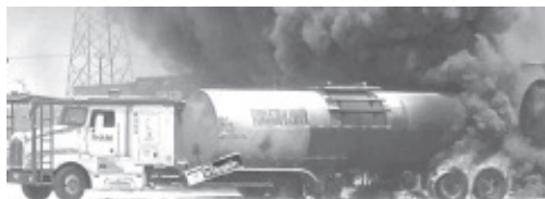
Inició en un estacionamiento. De acuerdo con los testigos el fuego comenzó en los neumáticos del tractocamión y de ahí fue a su remolque.

Lázaro Cárdenas, Mich.- 18 de mayo de 2022.- Un tracto camión que llevaba dos tanques pipas cargadas con combustóleo se incendió en la Isla de La Palma, lo cual causó la movilización de cuerpos de socorros y la evacuación de varios empleados del área. El siniestro ocurrió