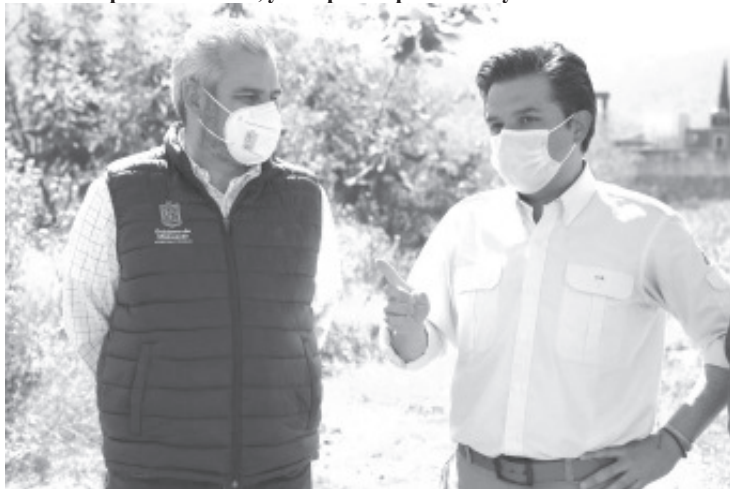
Dicha derrama económica se deberá principalmente por la compra de productos, servicios e impuestos locales, los cuales se ingresarán directamente al estado.

-Por impuestos locales, y compra de productos y servicios