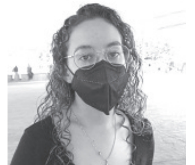
Precisó que ha entrenado mucho de forma estricta y en las últimas competencias le ha ido muy bien, por ello dijo sentirse segura de dar buenos resultados.

Respecto a los costos que implica este tipo