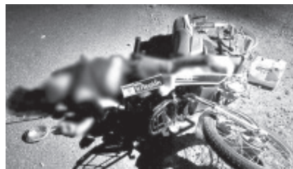
Mujer Policía Municipal fallecida y un elemento de la Policía Michoacán, fue el saldo que dejó el derrape de una motocicleta en el puerto de Lázaro Cárdenas.

Lázaro Cárdenas, Mich.- 19 de mayo de 2022.- Una oficial de la Policía Municipal fallecida y un elemento de la Policía Michoacán, fue el saldo que dejó el derrape de una motocicleta sobre el Boulevard Playero de Lázaro Cárdenas.