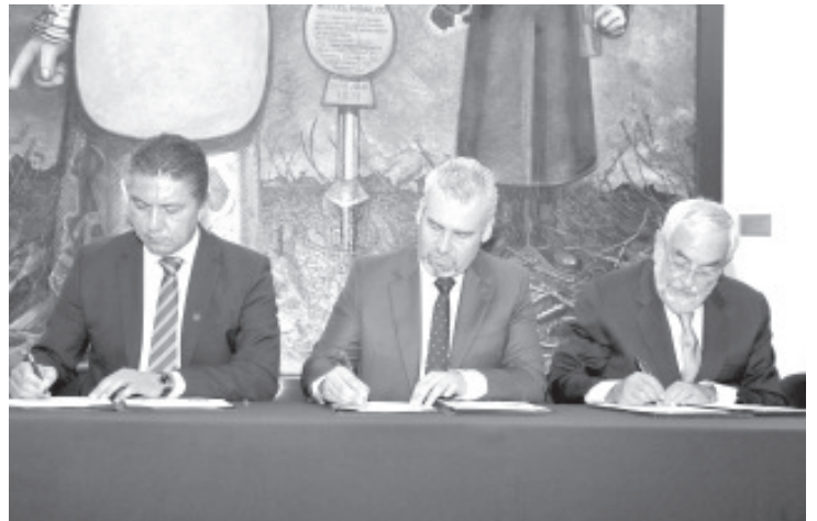
El mandatario estatal coincidió en la necesidad de coordinar acciones institucionales para el fortalecimiento productivo y social del estado.