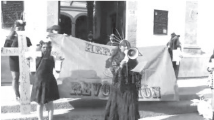
En la entrada del palacio municipal hicieron un posicionamiento por las desapariciones que ha habido de mujeres, así como feminicidios.

- De 32 estados, 28 están en alerta de género