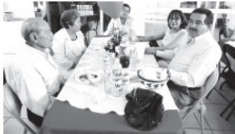
CELEBRANDO y festejando el DÍA DEL MAESTRO JUBILADOS Y PENSIONADOS De la Secretaría de Educación Pública. SNTE. ¡FELICIDADES A TODOS!.