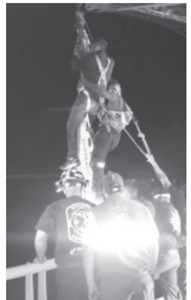
El hombre está en calidad de desconocido y los Bomberos bajaron hasta la madrugada del viernes, apoyados en grúas, para sacar el cuerpo.

Los vulcanos locales, apoyados por una grúa, descendieron hasta el fondo del barranco donde yacía el cadáver y lo sacaron, después peritos criminalistas trasladaron dicho cuerpo a la morgue para la práctica de la necropsia de rigor.