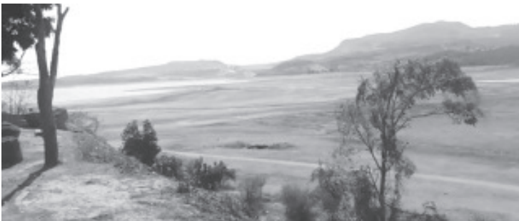
El año pasado, durante esta misma temporada llegó a una tercera parte de su capacidad y durante las lluvias se recuperó de tal forma que llegó al 100%.

Para evitar poner en riesgo la permanencia de este cuerpo de agua, pescadores y campesinos han pedido reiteradamente al Sistema Cutzamala que la extracción de agua que se realice sea de forma responsable, así como un eficiente manejo.