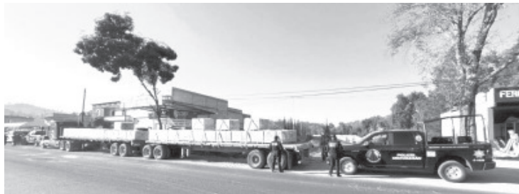
El tráiler estaba cargado de material para baños; la unidad fue inmediatamente localizada a la altura del poblado San Felipe de los Alzati, hay un detenido.

Para denunciar cualquier acto que vulnere la seguridad de las y los michoacanos, las líneas telefónicas de emergencias 911 y 089 atienden las 24 horas del día, los siete días de la semana.