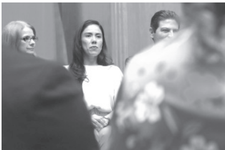
Conforme a los datos de la Fundación Arcoiris, las víctimas por crímenes de odio son en un 47% mujeres trans, 39% hombres, 8% mujeres, 3% hombres trans, y 3% no binarie.

-Apuntó que los crímenes de odio en nuestro país son invisibilizados, pues no se lleva un registro puntual de estos