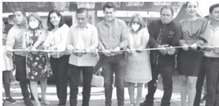
Como un acercamiento entre las culturas, gastronomía y tradiciones de Oaxaca y Zitácuaro, del 13 al 30 de mayo se presenta el encuentro artesanal, en el jardín central.

“Que el hermanamiento con otros lugares, nos impulse a continuar siendo un destino de riqueza y tradición”, expresó el presidente municipal.