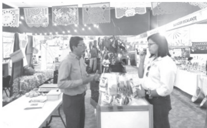
La Secretaría Precisó que dicha convocatoria estará abierta hasta el próximo 20 de mayo y está dirigida a grupos productivos de al menos 8 personas que deseen conformar una cooperativa.