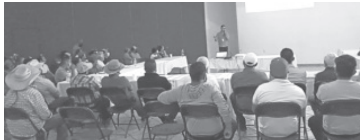
Estas capacitaciones que nacen a partir de una alerta que hizo la APEAM, de huertas que presentan moléculas negativas, por el mal uso y manejo de plaguicidas, entre ellas hay producto de esta región.