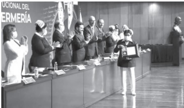
Zoé Robledo, aseguró que el personal de Enfermería “son el corazón de la atención en el IMSS” y agentes de cambio en la promoción, protección y prevención de la salud.