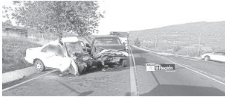
Dos personas murieron e igual número de heridos fue el saldo de un choque de frente entre dos vehículos sobre la carretera Morelia-Quiroga.

Luego, los especialistas de la Fiscalía General del Estado (FGE) arribaron a la escena, hicieron las averiguaciones respectivas y trasladaron los cadáveres a la morgue para la práctica de la necropsia de rigor.