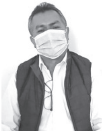
Los interesados deben acudir a las oficinas del SNE, ubicadas sobre la calle Cuauhtémoc, antes del 22 de mayo, para registrarse en la plataforma de la feria.

- 5 empresas participantes y 50 vacantes