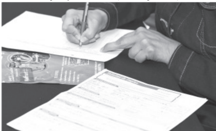
Reclutamientos en Jacona y Pátzcuaro, y cuatro talleres para buscadores de empleo, en su mayoría presenciales, llevarán a cabo la Sedeco y el Servicio Nacional del Empleo, del 16 al 18 de mayo.

Por lo que toca al reclutamiento, en el que participarán seis empresas con más de 50 vacantes, tendrá lugar de 9:00 a 14:00 horas; en ese lapso se efectuará la charla sobre el PTAT. El taller para buscadores será a las 11:30 horas; las actividades se efectuarán en instalaciones del Instituto Tecnológico Superior de Tacámbaro (Av. Tecnológico No. 201).