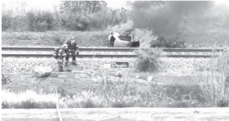
La conductora del auto resultó ilesa, pero su auto quedó con pérdida total al ser consumido por el fuego.

Los elementos de la Guardia Nacional se encargaron del peritaje correspondiente. Al final, los restos del automotor fueron retirados de la escena, unidad de la marca Volkswagen Polo, color blanco, con placa HAY705D.