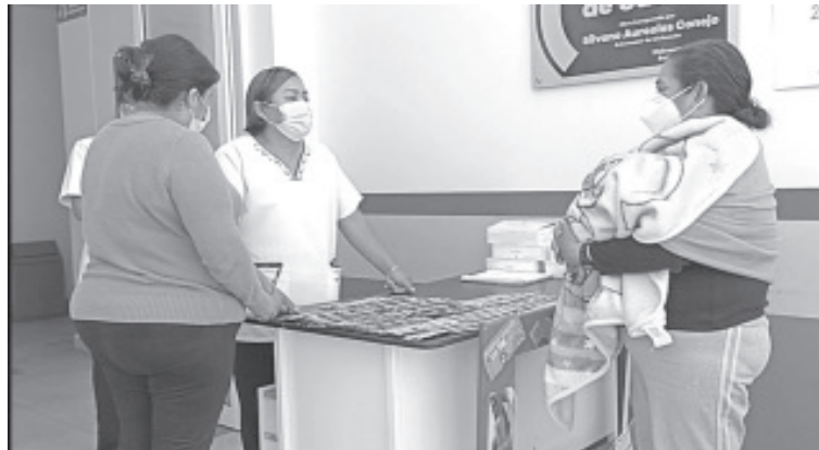
Estos servicios van dirigidos a la población en general desde niños de cero a nueve años, quienes podrán ser vacunados y se les proporcionarán vitaminas en caso de ser necesario.

Invitó a la población en general a acudir al Centro de Salud y aprovechar esta intensificación de las acciones. Las madres de menores de edad deben acudir a los puestos de vacunación, ahí se les estará suministrando: vitamina A de 6 meses a 4 años 11 meses 29 días, albendazol (desparasitante) de 2 años a 5 años de edad y sobre todo se les completará su esquema de vacunación.