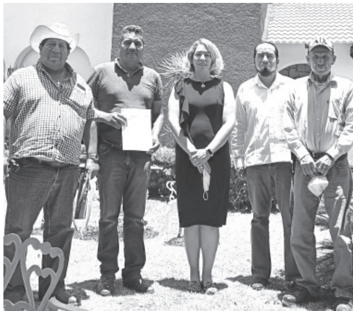
La solicitud de consulta libre, previa, informada y vinculatoria para que toda la comunidad de Nuevo Zirosto decida si desean autogobernarse fue presentada formalmente por sus autoridades.

La comunidad de Nuevo Zirosto del Municipio de Uruapan, fue fundada en el contexto de la erupción del Volcán Parícutín en el año 1951 a instancias del General Lázaro Cárdenas del Río y mantiene sus raíces culturales, históricas y sociales en la Comunidad de Santa Ana Zirosto. El día de hoy, es una comunidad que también inicia su camino de libre autodeterminación. Finalmente, el CSIM declara que saluda y respalda totalmente a la comunidad de Nuevo Zirosto en su proceso de autonomía.