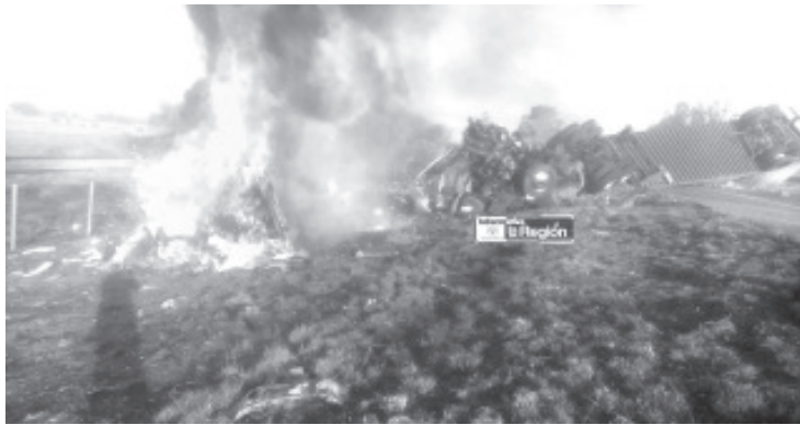
Un tráiler que transportaba productos alimenticios impactó a una camioneta, la cual terminó por incendiarse muriendo calcinados sus dos ocupantes.

Personal del Instituto Jalisciense de Ciencias Forenses Región Ciénega Ocotlán se encargó de realizar las respectivas actuaciones para llevar los restos humanos para que sean reclamados por sus deudos.