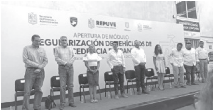
Para regularizar un vehículo las nuevas placas tienen un costo de 1 mil 789 pesos; el holograma de circulación 992 pesos y el aprovechamiento federal 2 mil 500 pesos.

- En visita a Zitácuaro, inaugura Módulo para la Regularización de Vehículos "Chocolate"