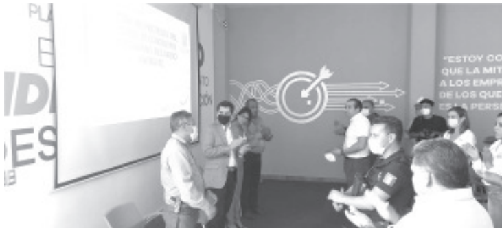
El edil, lamentó que hoy el trabajo que se realiza no se ve reflejado con resultados, esto es porqué e este sector se encuentra en un descuido total, aunado a la falta de conciencia desde las escuelas.

“Los gobiernos municipales no debemos estar cruzados de brazos, pareciera que es poca nuestra facultad y poco el incentivo para poder llevar a la agenda pública y política los temas ambientales y ecológicos”.