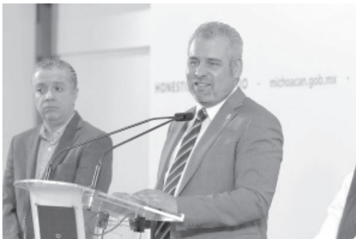
Alfredo Ramírez Bedolla informó que la actual administración ha liquidado adeudos correspondientes al 2021, que ascienden a 2 mil 411 millones de pesos.