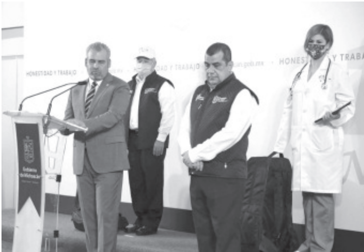
Con base al censo, brigadas de médicos, enfermeras, trabajadoras sociales y odontólogos acudirán a sus hogares para realizar una evaluación y brindar una atención médica integral gratuita.