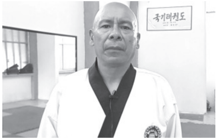
Dijo sentirse satisfecho por todo el trabajo que ha realizado en la formación de generaciones enteras en el Tae Kwan Do, algunos han sido alumnos destacados, seleccionados y han obtenido medallas.

Agregó que aunque su evaluación, será un examen extenuante, está preparado para dar lo mejor, y representar a Zitácuaro, a dónde llegó a vivir hace 36 años.