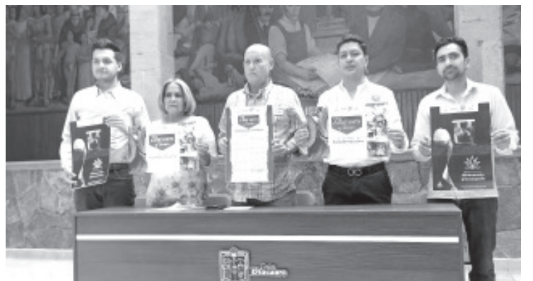
El objetivo de estas acciones es atraer el turismo y generar derrama económica a través de la estancia de visitantes, ya que esto implica hospedaje en hoteles, y alimentación.

De acuerdo al programa en este periodo que Oaxaca estará en Zitácuaro, se tendrán talleres, venta de artesanías, marimba, conferencias, pasarela de trajes michoacanos y oaxaqueños, presentación de la Guelaguetza, así como la presencia de mezcaleros. También se espera la participación de 20 artesanos de la región oriente, los cuales estarán ofertando prendas de lana, ocoshal, alfarería, dulces tradicionales, juguetes de madera, entre otros artículos y productos.