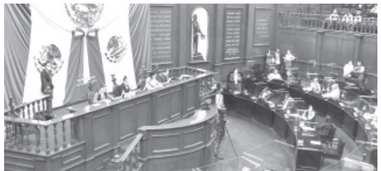
Con esta reforma se marca como parámetro máximo de pena privativa de libertad el de 60 años desde la Constitución del Estado, y así homologarla con el Código Penal de Michoacán.

Conforme a lo manifestado en la exposición de motivos, la incidencia delictiva en Michoacán fue de 46 mil 877, lo que ubica al Estado el décimo quinto lugar a nivel nacional, por lo que la intervención del Estado tiene como fin el buscar la convivencia pacífica y la solución de conflictos sociales, tiende a crear mecanismos que constituyan la tipicidad y penalidad para limitar la conducta agresiva de la persona frente al peligro inminente de afectación del bien jurídico tutelado, por lo que se constituyen garantías jurídicas, políticas y sociales por parte de la autoridad para que sea garantizado el respeto a las libertades y los derechos humanos.