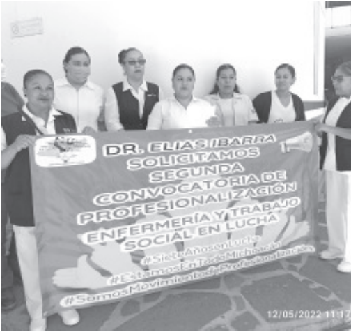
Han pasado 7 años desde la primera convocatoria y desde entonces seguimos buscando la continuidad del programa de profesionalización, hemos hecho de todo: marchas, manifestaciones, y sin respuesta.

- Piden continuidad al Gobernador del Estado Alfredo Ramírez Bedolla