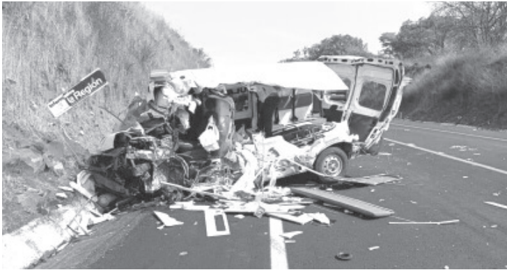
Un camión de carga colisionó la unidad de emergencia, misma que terminó destruida y dentro quedaron gravemente sus dos ocupantes.

La zona fue resguardada por uniformados, en tanto que de los respectivos peritajes se hicieron cargo las autoridades competentes, mismas que habrán de determinar responsabilidades sobre lo ocurrido.