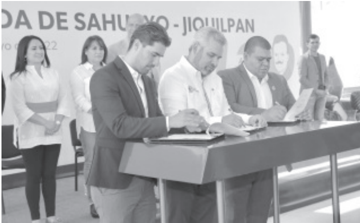
El mandatario destacó la relevancia de este acuerdo para trabajar unidos por la atracción de recursos federales en beneficio de 120 mil habitantes.

Sahuayo, Michoacán, 12 de mayo del 2022.- El gobernador Alfredo Ramírez Bedolla firmó convenio de coordinación con los ayuntamientos de Sahuayo y Jiquilpan para impulsar proyectos sustentables y sostenibles para el fortalecimiento de la infraestructura, movilidad, medio ambiente, servicios públicos y desarrollo ordenado de la zona conurbada entre ambos municipios.