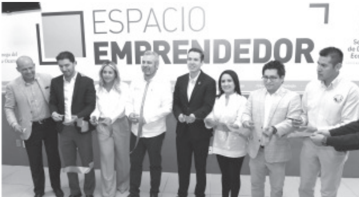
El nuevo Espacio Emprendedor brindará atención, asesoría y acompañamiento técnico a proyectos de naturaleza empresarial a estudiantes de dicha universidad, así como a emprendedores.

A la fecha, operan Espacios Emprendedores en Morelia, Uruapan, Zitácuaro y a partir de este jueves, el ubicado en la Universidad de la Ciénega, en Sahuayo.