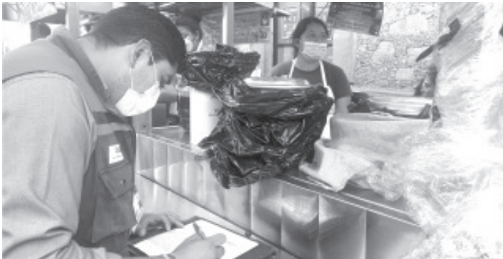
Con los resultados obtenidos en este operativo, van a retomar las capacitaciones hacia quienes se dedican a la venta y preparación de alimentos.

Invitó a los que se dedican a esta actividad, a capacitarse para dar un mejor servicio, de hacerlo esto se verá reflejado en mejores ventas.