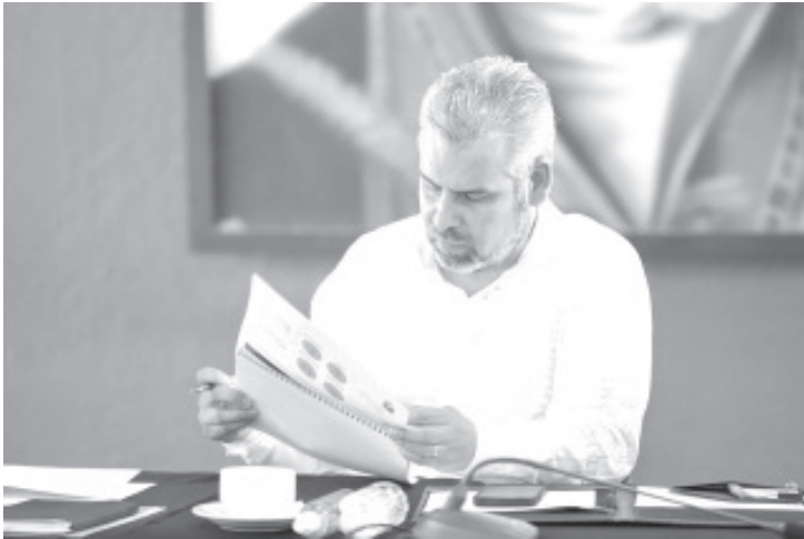
Se mostraron los diez componentes del programa que ya inició en Zamora, con la integración de comités vecinales y la red de mujeres constructoras de paz.

-Dependencias expusieron acciones de prevención y participación ciudadana para disminuir índices delictivos