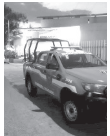
La corporación de rescate, acudió al apoyo para el traslado de las personas, interceptando a otro vehículo a la altura de Laguna Seca, donde venían las y los intoxicados.

Ante cualquier emergencia, favor de reportar a los teléfonos 715 153 87 42, 715 108 02 73 y 715 100 84 19.