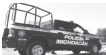
En 24 horas los oficiales de la Secretaría de Seguridad Pública, lograron recuperar 85 vehículos, de los que algunos contaban con reporte de robo.

Policía Michoacán trabajan para asegurar el orden público, ya que cuenta con diferentes agrupamientos y mandos especializados para tener una mejor cobertura en lo que respecta a los trabajos de seguridad pública del estado.