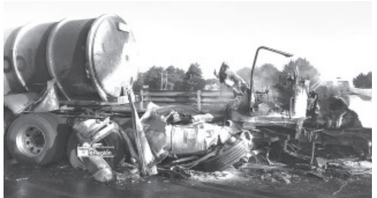
Un tráiler que transportaba combustible ardió en llamas durante la mañana de este jueves en la región de Pátzcuaro, no hubo víctimas personales.

Se apreció que la cabina del referido tractocamión terminó totalmente calcinada. Los vulcanos enfriaron los contenedores para evitar un incidente de mayor peligrosidad. Al final, el vehículo fue retirado de la escena y se reabrió el paso a los automotores.