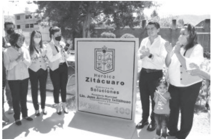
El presidente municipal destacó que su gobierno gestiona incansablemente recursos para seguir invirtiendo en la educación, tanto en infraestructura como en becas.