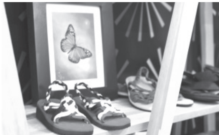
Pinturas, balones, zapatos, bolsas, cinturones, pulseras, collares, sillas, juguetes y una gran variedad de artículos de madera, cuero, papel, plástico e hilo, están a la venta en el Festival.

Ubicado en la zona donde más de 60 municipios exponen sus productos, el stand del Sistema Penitenciario ofertará los artículos provenientes de los centros penitenciarios de La Piedad, Zamora, Lázaro Cárdenas, Sahuayo, Apatzingán, Tacámbaro, Maravatío, Zitácuaro, Uruapan, Alto Impacto y David Franco Rodríguez de Morelia, durante los 16 días en que miles de familias acudirán a este evento para disfrutar de la cultura y gastronomía del estado.