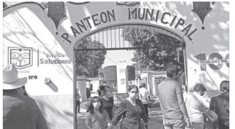
En días previos se tuvo un ingreso de 2 mil personas, mientras que en el día central de la celebración la afluencia fue masiva, parecida a la de Día de Muertos.

En las diferentes filas y pasillos durante todo el día se vio a personas de todas las edades, acudieron con ramos de flores; otros se dieron la oportunidad de llevar coronas, algún músico o incluso hasta alguna bebida para permanecer durante un tiempo junto a su ser querido.