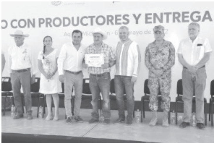
Vamos a trabajar muy de la mano aquí, en seis meses de mi gobierno, dos veces hemos estado en Aquila y vamos a volver para estar permanentemente en esta región.

Se trabaja en la sanidad y ampliación del mercado: Bedolla.