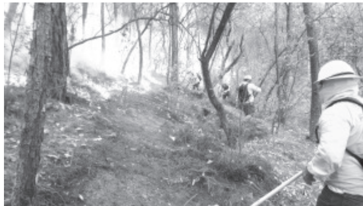
Siguiendo el protocolo para la atención de incendios forestales, los brigadistas realizan brechas cortafuego para evitar que las llamas se propaguen y poder controlar el fuego.