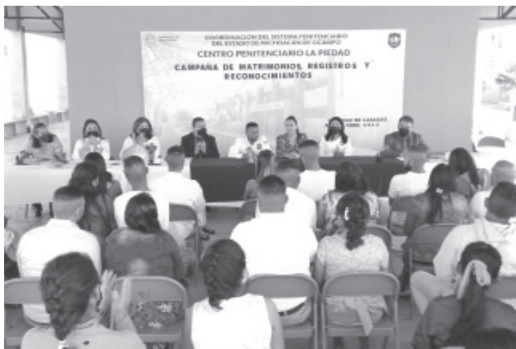
La Coordinación del Sistema Penitenciario y Dirección del Registro Civil, realizó la regularización de 13 matrimonios de personas privadas de la libertad en el Centro Penitenciario de La Piedad.