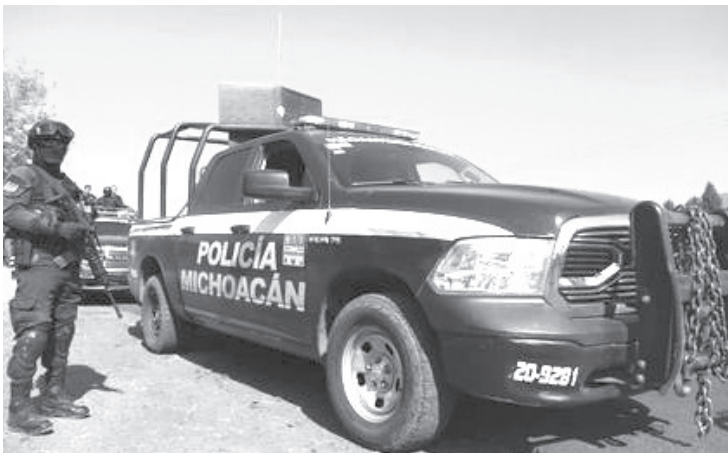
Mediante los arcos carreteros con apoyo del C5i, así como de filtros y puestos de control, los uniformados verifican antecedentes de vehículos para detectar unidades con reporte de robo.

Las labores de prevención y vigilancia en carreteras, calles y colonias de mayor incidencia delictiva continúan. En caso de ser víctima de algún ilícito, se puede denunciar a las líneas telefónicas de emergencias 911 y 089.