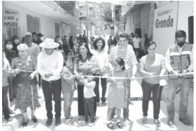
"Continuamos cumpliendo nuestros compromisos con las y los zitacuarenses". Refirió que visitará todas las colonias y comunidades para resolver parte de sus principales demandas.

Durante este periodo de atención de incendios de bosques, la Brigada de Zitácuaro ha apoyado el combate de intensos fuegos en bosques de Tuxpan y Benito Juárez.