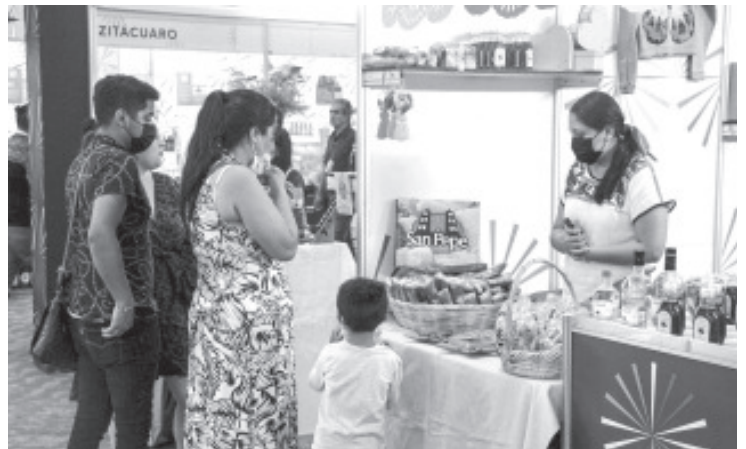
Continúan las Cocineras Tradicionales con su exquisita comida; en el corredor artesanal encontraremos hermosa artesanía hecha con las mágicas manos de las y los artesanos michoacanos.

Continúan las Cocineras Tradicionales con su exquisita comida; en el corredor artesanal encontraremos hermosa artesanía hecha con las mágicas manos de las y los artesanos michoacanos; los juegos mecánicos y el Pabellón Comercial te esperan, ¡ven y disfruta este sábado del Festival Michoacán de Origen!.