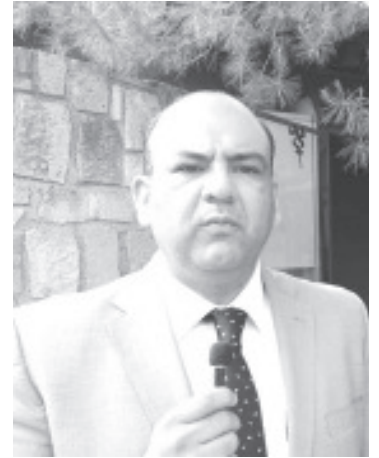
Desde que se presentó la demanda se determinó permitir al joven que ingresara a clases, dado que el tema central de la denuncia era el acceso a la educación.

También señaló que no hubo sanción para el director de la escuela donde ocurrió el incidente, dado que este fue capaz de llegar a un acuerdo con los representantes del menor para permitirle continuar con su proceso educativo.