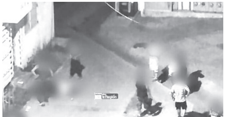
El hombre falleció debido a las graves lesiones que sufrió al caer, según mencionaron fuentes cercanas al tema.

El caso fue reportado a la Fiscalía General del Estado (FGE), cuyos especialistas se encargaron de las investigaciones correspondientes y trasladaron el cadáver a la morgue para la práctica de la necropsia de ley.