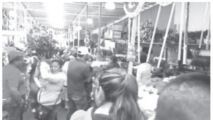
Una vendedora lamentó que hay mucha competencia desleal, ya que a las afueras del mercado se colocan muchos otros a vender el mismo producto y vienen de fuera, no son locales.

“Nosotros damos los mejores precios para que la gente venga a comprar con estos precios que son accesibles”