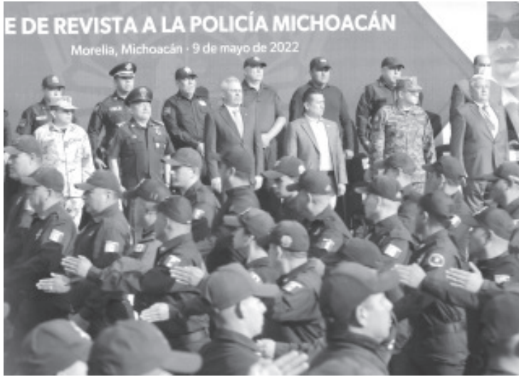
En su discurso, el gobernador hizo un reconocimiento a los elementos de la Policía Michoacán, por su respaldo, lealtad y servicio a los michoacanos.

-Encabeza pase de revista de las corporaciones de la SSP.