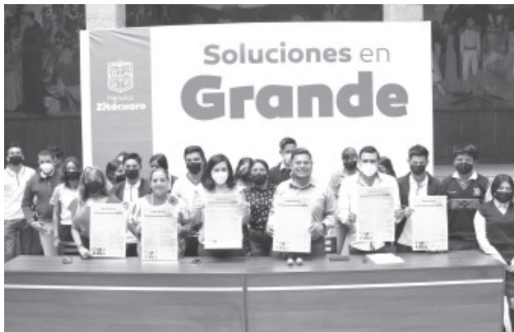
Podrán participar mujeres y hombres de entre 15 a 29 años de edad y ser originario de Zitácuaro o residente. La convocatoria tiene vigencia hasta 13 de mayo.