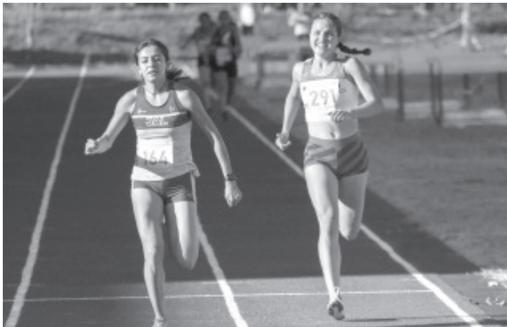
La selección del estado purépecha amarró veintiún boletos directos a los Juegos Nacionales Conade 2022, a estos michoacanos se podrían sumar alrededor de veinte elementos más.

A estos michoacanos se podrían sumar alrededor de veinte elementos más, que por sus posiciones en rankins al finalizar los Macros-Selectivos en el país avanzarían a la fase nacional a disputarse en el estado de Sonora entre los meses de mayo y junio del presente año.