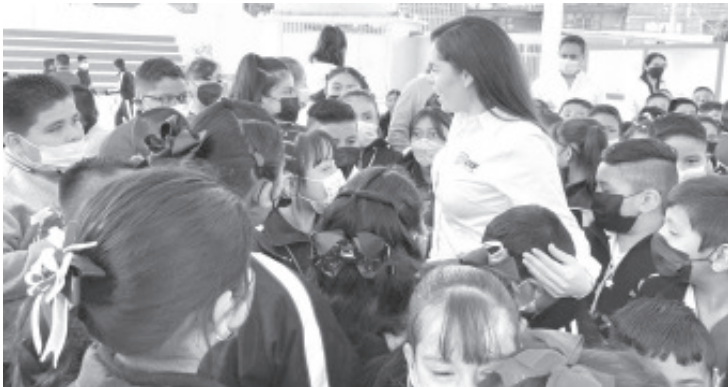
Más de 4 mil boletos serán obsequiados por el DIF en escuelas preescolares y primarias del municipio para que los menores disfruten de la película Sonic, en las fechas programadas.

Refirió que como #CiudadPorLosNiños la encomienda del alcalde Toño Ixtláhuac es generar actividades que promuevan una sana infancia y el desarrollo de la niñez zitacuarensis.