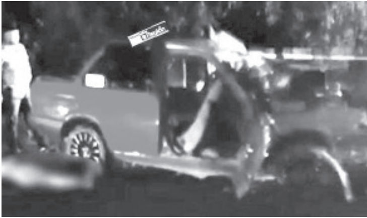
Varios de los ocupantes de dichas unidades salieron disparados, siendo confirmado en el lugar el deceso de 4 personas.

La vialidad fue cerrada a la circulación y más tarde se presentó el personal de la Fiscalía General del Estado, cuyos peritos emprendieron los correspondientes peritajes y el levantamiento de los cuerpos. Siendo aseguradas las unidades siniestradas.