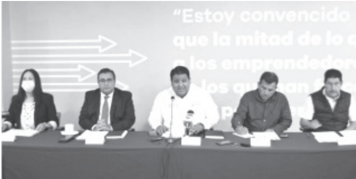
Entre las nuevas disposiciones están: la operación de Centros de Conciliación, así como Juzgados Laborales, además de nuevas reglas para la organización y la vida orgánica de los sindicatos.

Morelia, Michoacán, 26 de abril del 2022.- Ante la inminente entrada en vigor de las nuevas disposiciones en materia laboral en la entidad, el Gobierno de Michoacán, a través de la Secretaría de Desarrollo Económico (Sedeco), y los Poderes Legislativo y Judicial realizarán cinco "Foros de Difusión del Nuevo Sistema de Justicia Laboral".