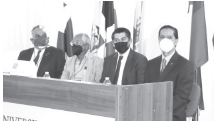
Ante la presencia de catedráticos y universidades del país e internacionales, refrenda el alcalde su alianza para impulsar la educación en el municipio.