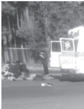
En el lugar falleció uno de los tripulantes de la moto, mientras que su acompañante fue atendido y trasladado a un hospital, en estado grave.

El personal de la Fiscalía General del Estado, se hizo cargo de emprender los respectivos peritajes y el levantamiento del cuerpo. Siendo iniciada la correspondiente carpeta de investigación.