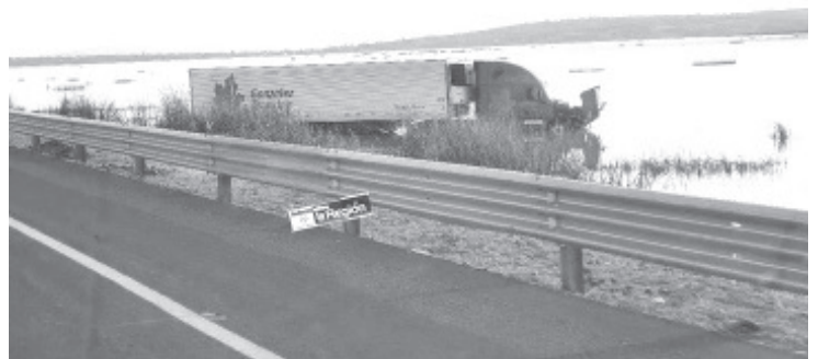
Pesado tráiler se salió de la carretera y cayó al Lago de Cuitzeo, donde quedó atascado, su ocupante resultó ileso,

En el sitio se presentaron policías, quienes vieron que el incidente no dejó lesionados ni fallecidos, solo afectaciones en el automotor, el cual es de cabina roja y remolque blanco con la leyenda "González Trucking".