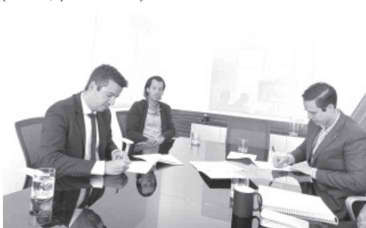
En esta primera etapa estarán disponibles mil 400 millones de pesos para industrias y comercios con consumos superiores a 500 MW mensuales.

Para mayores informes sobre este beneficio, las MiPyMes pueden comunicarse al correo electrónico sedeco.code@gmail.com, o al Departamento de Energía y Soluciones Sustentables de la Dirección de Inversiones de la Sedeco; la convocatoria estará abierta de manera permanente, a partir del mes de mayo.