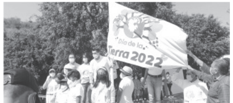
Indicó que el programa de Soluciones Verdes este disponible para ejidos, comunidades, instituciones educativas y para todos aquellos que lo requieran.

En el marco de la celebración los presentes participaron en una jornada de plantación de árboles alrededor de la planta de tratamiento de aguas residuales, además junto con niños llevaron a cabo una dinámica de separación de basura.