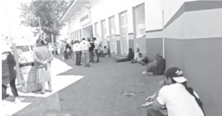
Los boletos ya están a la venta en las sucursales de la paletería La Michoacana en 50 pesos, y el día del evento tendrá un costo de 100 pesos.