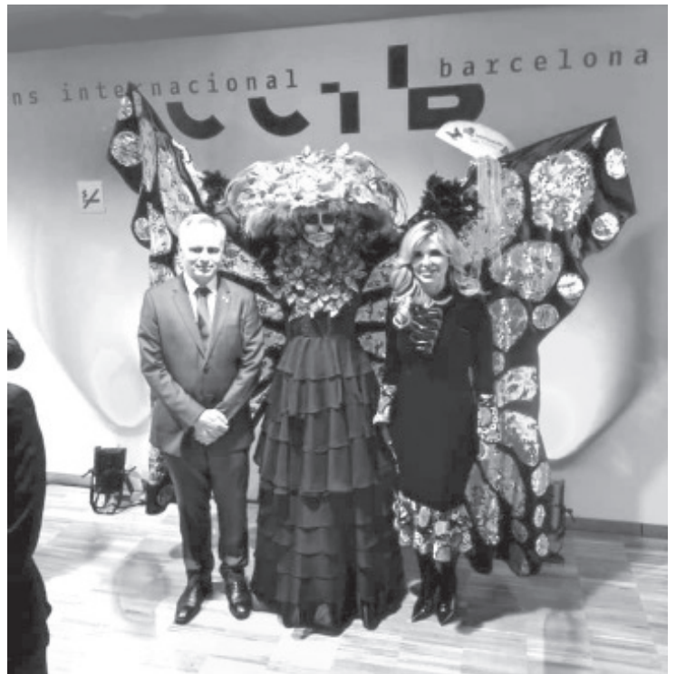
El personaje de "La Catrina", de las Mariposas Monarca, se hizo presente en una cena que ofreció a los participantes y a las autoridades anfitrionas, el Gobernador del Estado de Hidalgo.

Si bien de manera formal inicia este viernes el 1er Tianguis Internacional de Pueblos Mágicos, las primeras imágenes muestran a la Catrina en compañía del Secretario Federal de Turismo, Miguel Torruco Marquez, de la Cónsul de México en Barcelona, Ministra Claudia Pavlovich Anguiano y autoridades del Departamento de Acción Exterior Gobierno Abierto de la Generalitat de Cataluña.