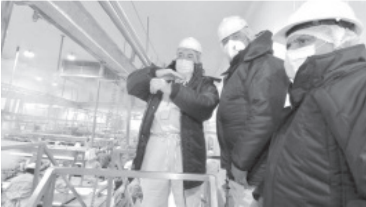
Indicó que con este fertilizante orgánico se apoyaría, de manera inmediata, a productores de grano de temporal, aunque el objetivo es dar cobertura a todo el sector campesino del estado.