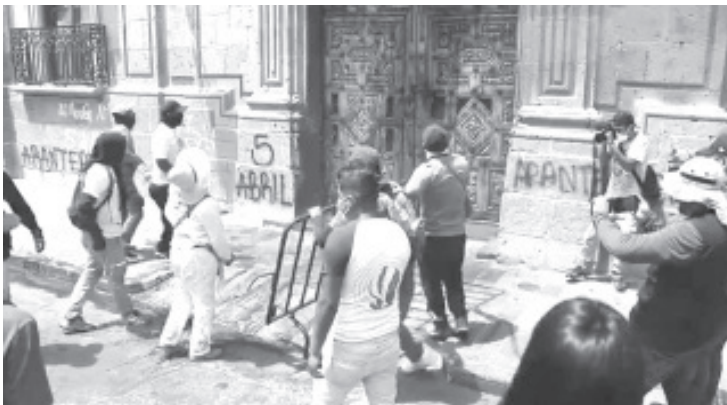
El expediente, es derivado de una denuncia interpuesta por el INHA, por la pinta de grafitis, carteles adheridos y manchas de pintura, en el Palacio de Gobierno, Catedral Metropolitana y otros edificios.

Los inmuebles fueron inspeccionados por peritos y elementos de la Policía Federal Ministerial (PFM), quienes aportan al Ministerio Público Federal (MPF) en Morelia, los dictámenes correspondientes a fin de integrar la carpeta de investigación, en contra de quien o quienes resulten responsables.