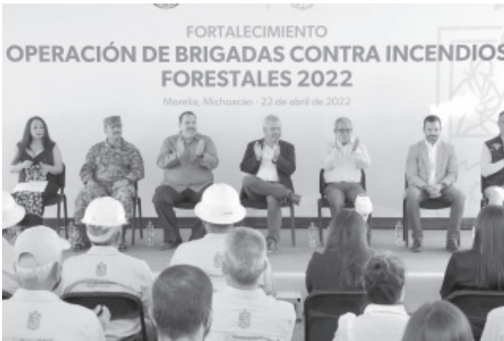
Se cuenta con mil 90 brigadistas en operación del gobierno federal, estatal, municipal y comunales, así como el uso de la alerta temprana de incendios forestales.

-El gobernador informó que esa cantidad representa un incremento del 80 por ciento con relación al 2021 en temporada de estiaje