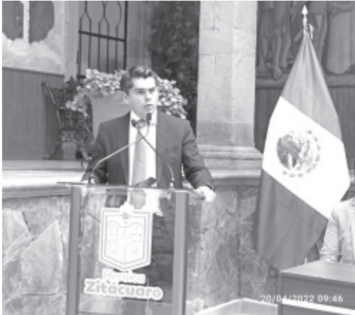
Nos hemos levantado luego de que esta tierra ha sido quemada y atrasada, echaron hasta sal para que no crecieran las plantas ni las hierbas, pero aquí está Zitácuaro de pie.

- Recuerdan reconocimiento de Zitacuaro como Ciudad Heroica