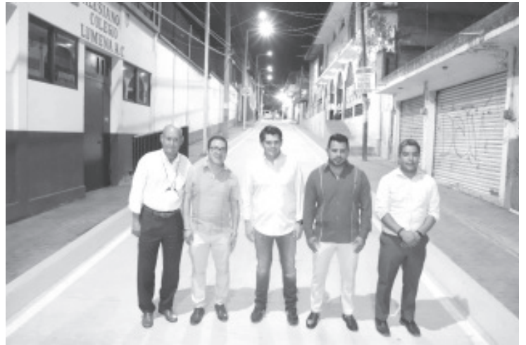
El trabajo consiste en la pavimentación de 371 metros lineales, instalación de una nueva línea de conducción de agua y renovación de todo el drenaje.

Cabe destacar que la actual administración municipal lleva realizadas distintas obras en el poniente de la ciudad, como las edificaciones de las calles