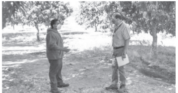
El Gobierno de Michoacán llama a las empresas de aguacate a acatar la norma emanada de la Ley Federal del Trabajo y brindar seguridad social a sus trabajadores.

El Gobierno del Estado continuará con las labores de inspección de manera permanente por parte de la Subsecretaría de Trabajo y Previsión Social, cuyo objetivo es lograr la formalización laboral de las decenas de miles de trabajadores agrícolas que laboran en la industria aguacatera.