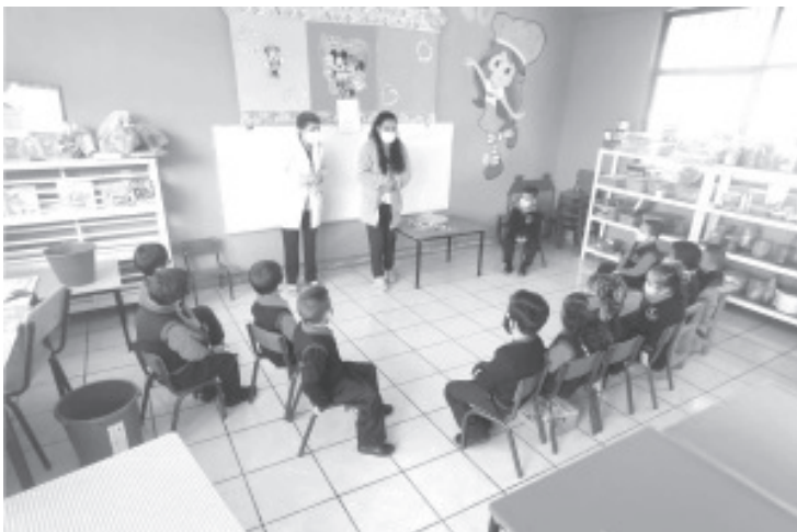
Este tipo de acciones van orientadas a promover entre padres de familia que los menores de edad sean criados bajo un ambiente positivo, lleno de amor, dónde se sientan acogidos.

Recomendó a padres de familia cuidar bien a sus hijos, si creen que tienen algún problema emocional como depresión, ansiedad u otro padecimiento, que se atienda ya que de no hacerlo, esto va a repercutir en la crianza de los niños.