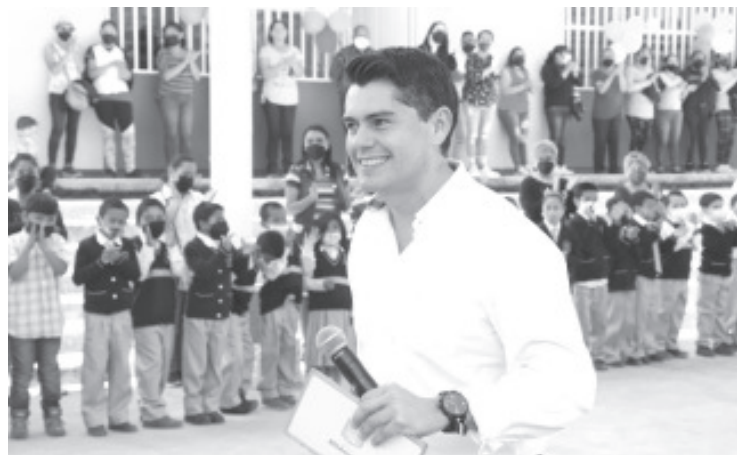
Este domo permitirá a la comunidad educativa contar con un patio cívico y una cancha protegida, evitando que padezcan de las inclemencias del tiempo.

-Cumple alcalde compromiso educativo de mejorar las condiciones del plantel.