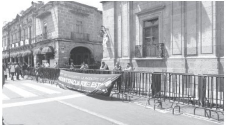
Los manifestantes salieron de Casa Michoacán hacia la FGE, donde con palos y piedras rompieron vidrios ingresaron a las oficinas, donde lanzaron cohetones, y dañaron el mobiliario.

Posteriormente se acordó una mesa de diálogo con miembros de gobierno del estado y se realizó un mitin político sobre la avenida Francisco I Madero.