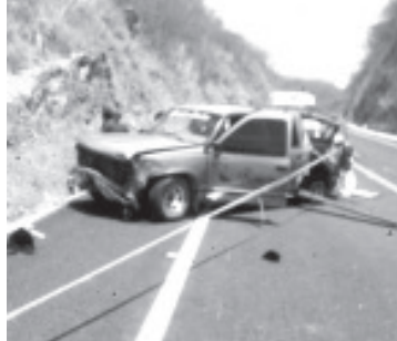
La camioneta funeraria fue proyectada contra el paredón, una persona perdió la vida, en tanto que el cadáver de la carroza salió disparado del ataúd.

Para atender la situación acudieron elementos de la Guardia Nacional de la División Seguridad en Carreteras e Instalaciones, mismos que abanderaron el área para evitar otro accidente. De igual forma se