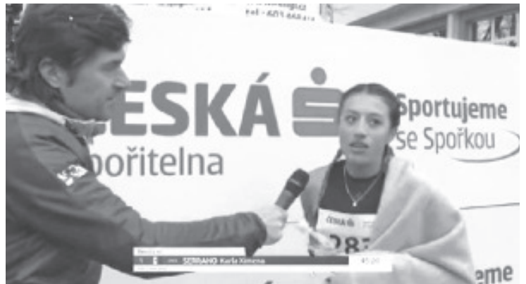
La joven zitacuarenses logró el primer lugar en caminata, en la república Checa