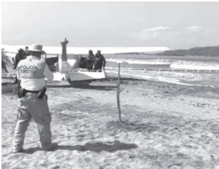
En la avioneta se transportaban el piloto y un pasajero, ambos resultaron ilesos, el aterrizaje fue de emergencia.

Al momento se desconoce cuales fueron detalles sobre el accidente y serán las autoridades en aeronáutica las que se encarguen de dichas revisiones.