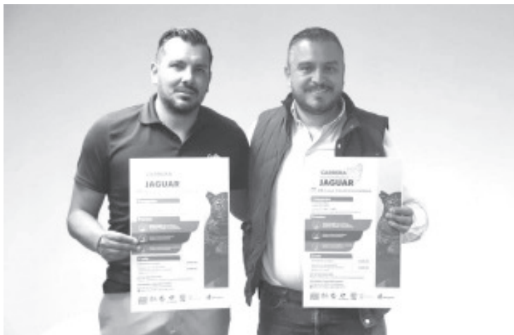
“Los fondos serán empleados para construir un nuevo recinto para los jaguares, buscando que cuenten con diversas condiciones similares a los de sus hábitats naturales”.

De igual forma, refirió que la carrera se desarrollará el próximo domingo 24 de abril a las 8:00 horas con las categorías de caminata de un kilómetro dentro del parque y carreras de 3 y 5 kilómetros, que se desarrollarán en las inmediaciones del parque.