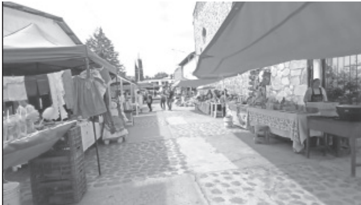
Inicialmente comenzaron 50 personas, pero debido a la buena aceptación de la actividad, ya son 100 personas las que salen a ofertar algún producto.