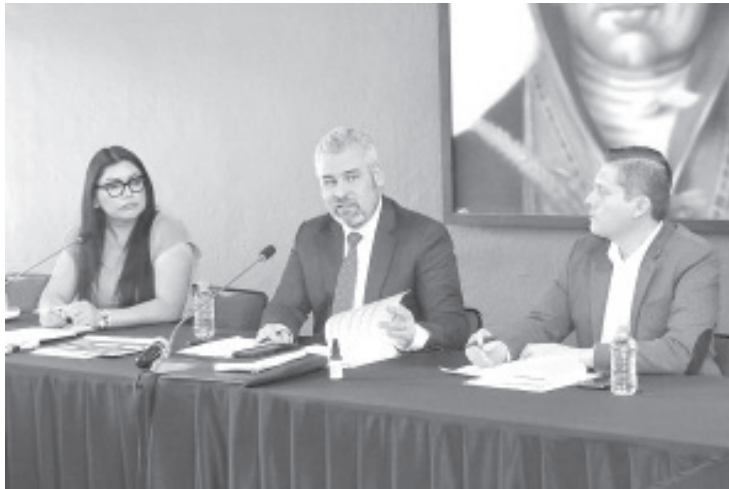
La comisión interinstitucional acudió a Tijuana para levantar una base de datos sobre personas oriundas de Michoacán que se encuentran en albergues de la ciudad fronteriza.