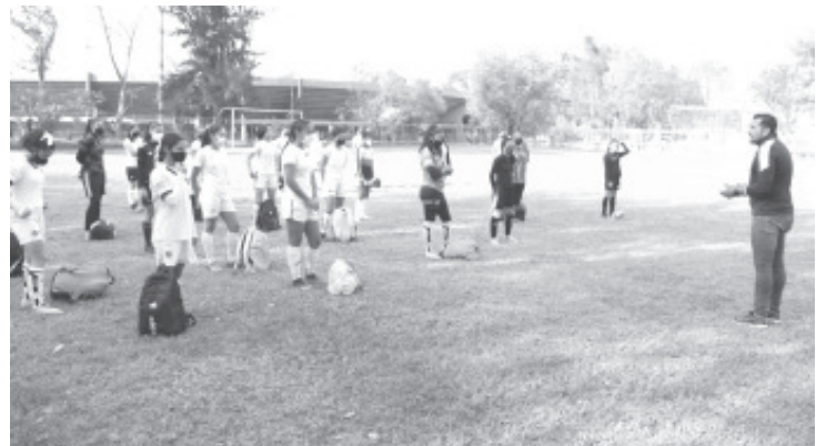
Las 8 entidades presentes de la Región III: Nuevo León; Tamaulipas, Coahuila y San Luis Potosí, mientras de la Región IV: Colima, Jalisco, Nayarit y por supuesto, el anfitrión, Michoacán.