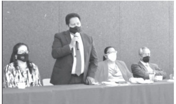
Es importante que los maestros de educación básica sepan que la UPN es una institución aliada de ellos y estamos buscando la manera de acercarnos a ellos.

Recordó que originalmente la calle 5 de mayo era el lugar para vendedores de conserva, por lo que se espera rescatar esto y además dignificar su actividad, pues es bien reconocida por la población de Zitácuaro, de otros municipios y hasta de turistas que vienen específicamente a comprar este dulce alimento.