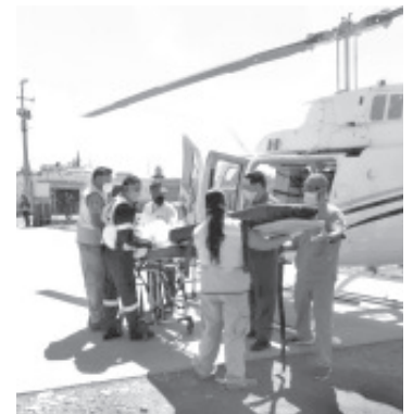
clínicas o desastres naturales, se pone a disposición de la población los números de emergencias 911 y 089 para el reporte de cualquier siniestro.

SSP traslada vía aérea: Los paramédicos de vuelo dieron la asistencia médica durante el traslado para canalizar a la paciente al nosocomio de Charo.