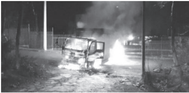
Grupo de normalistas que se oponen a que se reduzca la matrícula educativa, incendió dos camiones de reparto de empresas refresqueras.

La protesta coincide con el anuncio del gobernador de que se blindará el examen de admisión de las normales.