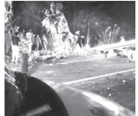
Un auto compacto y una camioneta se impactaron sobre la autopista Siglo XXI, dejando un saldo de cinco personas sin vida y dos más gravemente heridas.

Las aeronaves pertenecientes a la SSP se encuentran de forma permanente al servicio de las y los michoacanos con la finalidad de salvaguardar vidas, en caso de emergencias