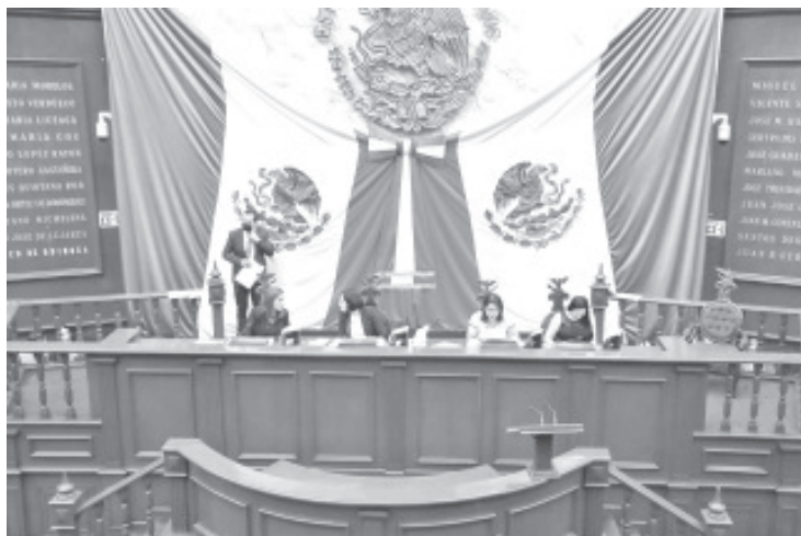
Se reconoce a los animales no humanos como seres sintientes, dotados de un sistema nervioso central que les permite experimentar distintas sensaciones físicas y emocionales.

Cabe destacar, que la reforma prevé, que las autoridades estatales, municipales, así como de la Fiscalía Especializada, deberán promover campañas de esterilización, vacunación, concientización y fomento de la denuncia en contra del maltrato y crueldad animal, en el “Día Estatal de los Derechos, el Bienestar y la Protección de los Animales”, que celebrarán de manera conjunta, el día hábil más próximo al 4 de octubre de cada anualidad.