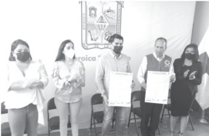
El Gobierno Municipal no escatimará recursos ni esfuerzos para hacer alianzas que garanticen la atención de los ciudadanos en todos los aspectos.

- Objetivo: eficientizar servicios de este cuerpo de auxilio