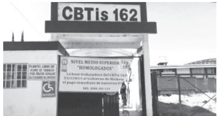
Se cuenta con minutos donde el estado reconoce el adeudo que se tiene con los 6,000 trabajadores del sistema homologado, pero han hecho caso omiso a las demandas.

Insistió que los trabajadores del nivel medio superior y superior tienen bien ganados los bonos de compensación pendientes porque imparten una buena educación a los jóvenes, además no es un recurso extra sino un complemento del aguinaldo, ya que a los de la educación básica les dan 60 días de aguinaldo y a los del sistema homologado solo 40.