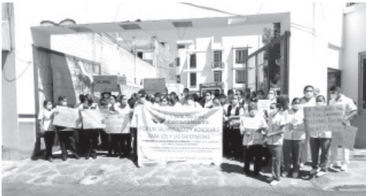
Queremos mejorar el código para que podamos crecer, yo por ejemplo soy maestra en salud pública y tengo sueldo de auxiliar de enfermería, dijo una de las manifestantes.

Demandaron a los gobiernos que haya contrataciones de personal de enfermería, ya que si lo hacen estarán haciendo una inversión en salud y al mismo tiempo esto tendrá impacto en una mejor atención de los ciudadanos.