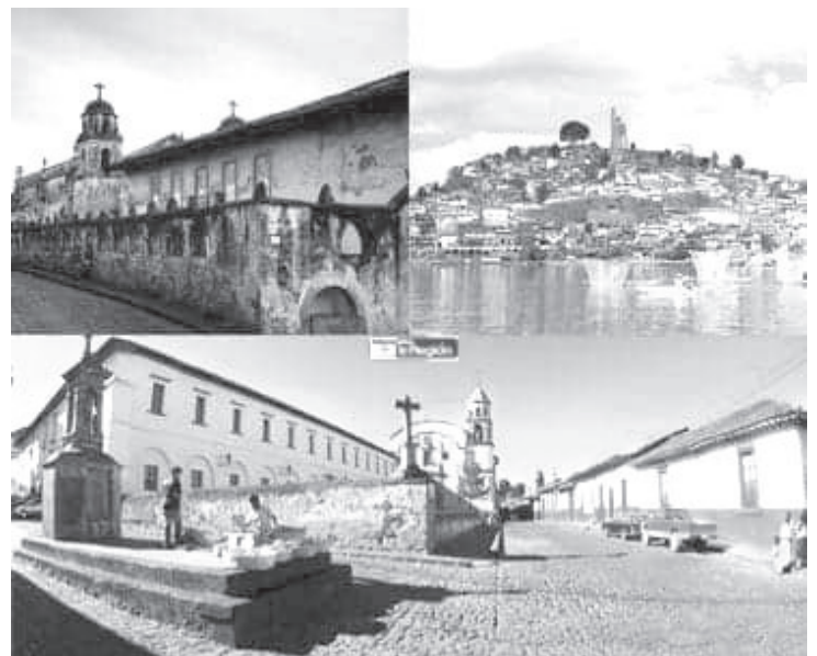
El programa de Pueblos Mágicos, se ha convertido en una marca distintiva que influye en las decisiones de viaje de millones de turistas que buscan opciones tierra adentro.

Para obtener el nombramiento, los destinos interesados deben cumplir una serie de parámetros distintivos como, contar con arquitectura tradicional, poseer atractivos turísticos, arquitectónicos, gastronómicos, artesanales o históricos notables, ubicación cercana a algún destino mayor, contar con infraestructura de servicios y el compromiso de las autoridades locales y de la ciudadanía para realizar inversión en diversas mejoras en temas como imagen urbana, entre otras.