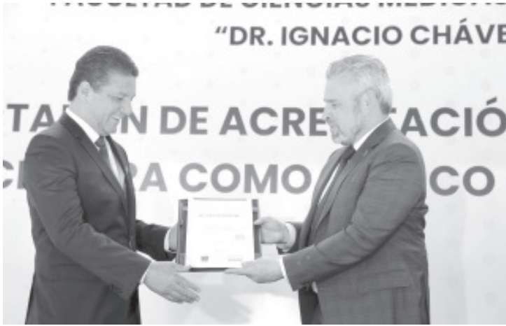
El mandatario destacó la calidad educativa y visión humanista para la formación de las y los alumnos matriculados en la Universidad Michoacana.

“Es un logro que supera el espacio universitario y tiene una relevancia para todos los michoacanos”, afirmó el gobernador