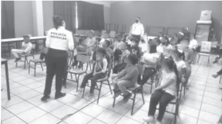
A través del Teatro Guiñol, los elementos fomentaron la cultura vial y medidas de seguridad a infantes de la Escuela Primaria "Emiliano Zapata", en Morelia.

Mantener una cultura preventiva evitará situaciones de riesgo y accidentes que podrían costar incluso la vida humana. Ante cualquier emergencia las líneas telefónicas 911 y 089 brindan atención inmediata.