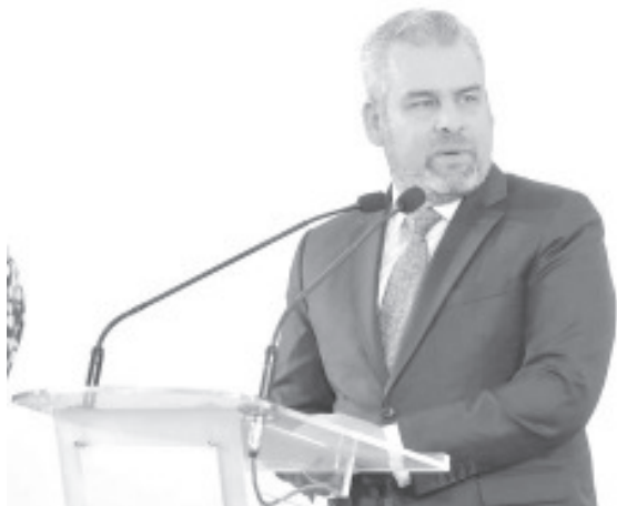
El gobernador Bedolla dijo que la administración estatal procederá conforme a la ley para evitar que continúe la corrupción por venta de espacios.

Superior y Superior en Michoacán, llamó a la población a no caer en engaños y fraudes toda vez que está por iniciar el proceso de admisión para el ciclo escolar 2022-2023.