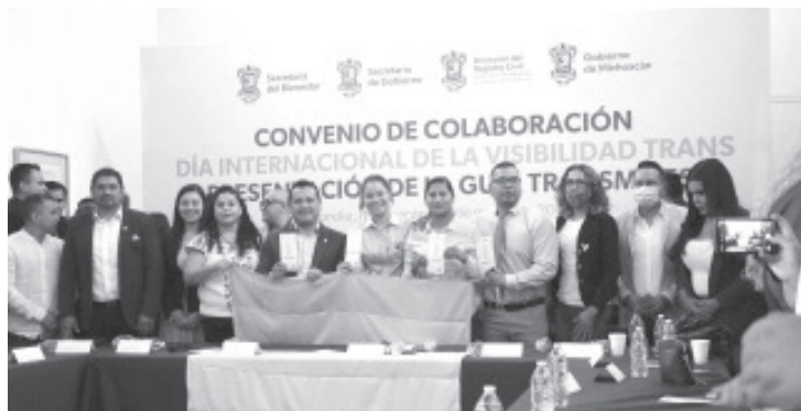
La población LGBTTTIQ+ se verá favorecida, ya que contarán con una atención adecuada, libre de prejuicios y discriminación, enfocada en el respeto por los derechos humanos.