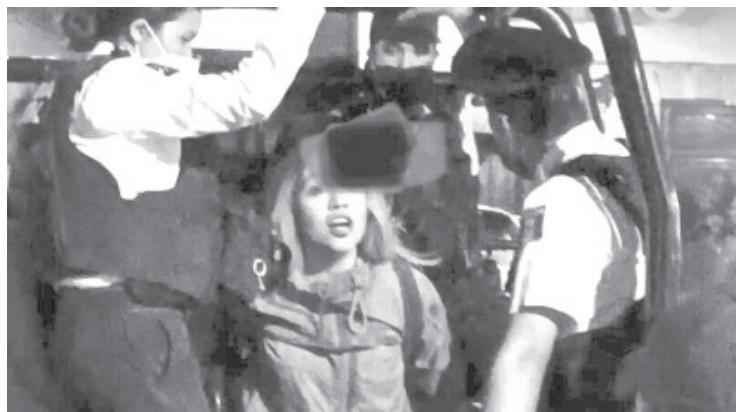
Entre los manifestantes hubo quienes utilizaron palos, piedras, martillos y otros objetos, así como bombas de fabricación casera.

"La Policía de Morelia reitera su respeto a la libre manifestación y a las legítimas demandas de las mujeres; asimismo no será omisa ante actos de alteración del orden con los que se busca desvirtuar estas expresiones".