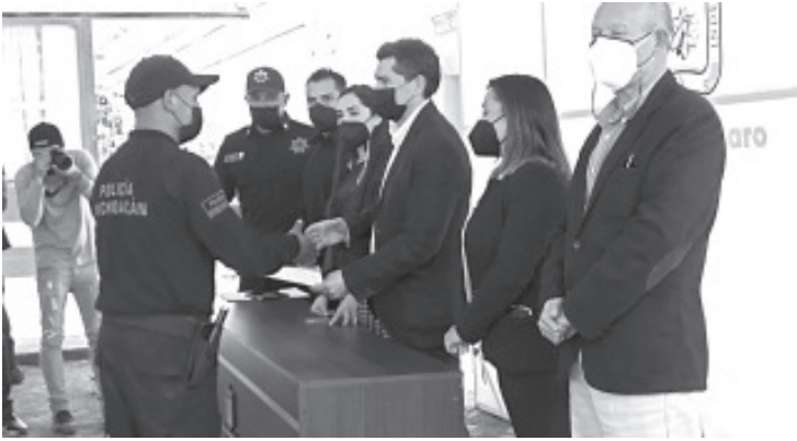
La seguridad es uno de los rubros en los que se ha trabajado de forma incansable, es así que se han dado pasos importantes en sus distintas áreas y continuarán.

- Reciben certificados de exámenes psicológicos