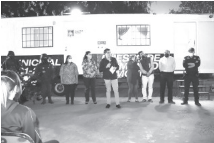
En la competencia del fuero federal, seguirá gestionando la participación de la Fuerza estatal y federal para que la salvaguarda de la población sea integral.

-El alcalde pone en marcha el segundo puesto de Comando Móvil en la colonia Las Palmas.