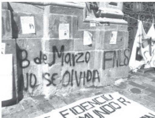
INHA interpuso denuncia por la pinta de grafitis, carteles adheridos y manchas de pintura, hechos ocurridos en el Palacio de Gobierno, localizado sobre la Avenida Madero No. 63.

De acuerdo con el expediente, derivado de una denuncia