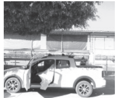
El alcalde presentaba al menos dos lesiones de proyectil de arma de fuego en el pecho y cuello, su cuerpo yacía en el asiento de la camioneta.

Una vez que se solicitó la respectiva orden de aprehensión, personal de la institución detuvo al investigado, quien posteriormente fue presentado ante el órgano jurisdiccional que valoró cada uno de los datos de prueba expuestos por la Fiscalía para resolver su vinculación a proceso, fijar prisión preventiva oficiosa y establecer un plazo para de un mes para el cierre de la investigación.