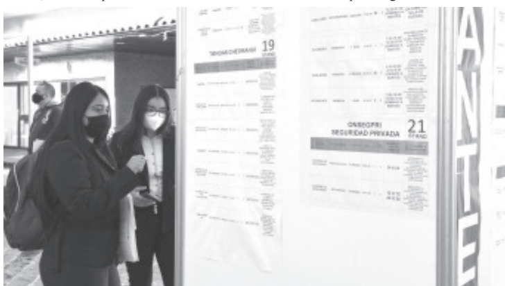
La Sedeco considerando los empleos perdidos en el mes de enero de 2022, en Michoacán se tiene un registro de 467 mil 596 trabajadores asegurados.