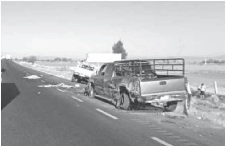
El accidente ocurrió alrededor de las 8 de la mañana del lunes, cuando un tráiler embistió a un grupo de personas que viajaban en bicicleta sobre la carretera.

Extraoficialmente se informó que el conductor de trailer se estacionó metros adelante del lugar del accidente y fue detenido por elementos de la Guardia Nacional.