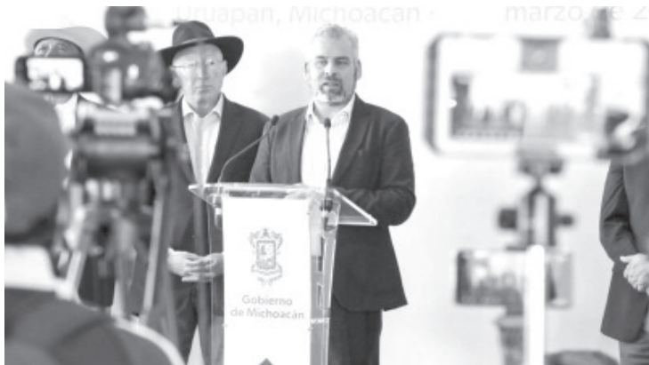
La seguridad para toda la cadena de producción, el impacto ambiental y la seguridad social para todos los trabajadores agrícolas se atenderán de manera integral.

-Se trabaja en una ruta ambiental sostenible en conjunto con productores michoacanos.