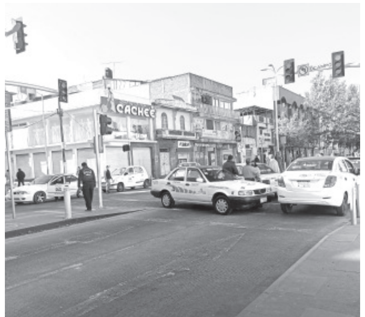
Sobre las unidades colocaron algunas leyendas, entre ellas: "no más muertes y más retenes sin extorsión", "paz en zitacuaro" y "queremos paz".

Como resultado de dicho encuentro, minutos antes de la 1:00 de la tarde el bloqueo se retiró y la circulación de Avenida Revolución en todos sus puntos volvió a la normalidad.