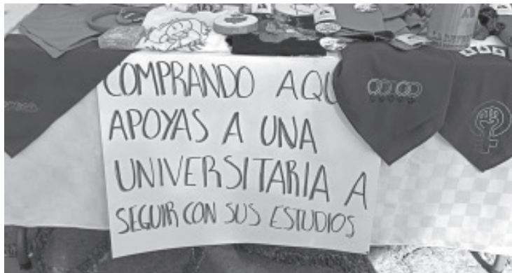
El mercadito fue para buscar el apoyo en el emprendimiento de este sector, pues muchas de las mujeres del colectivo feminista trabajan, tienen un negocio o estudian.