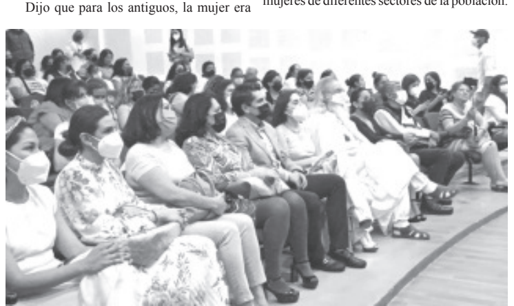
Para los antiguos, la mujer era sagrada porque daba vida, pero lamentablemente tras la conquista española, como fue el caso de América, la mujer fue sometida.