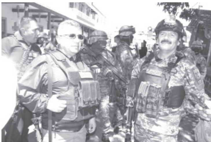
Hay 32 detenidos, también 5 fallecidos, se presume que pertenecían a una célula delictiva, lo cual es investigado por la Fiscalía General de Estado.

En el lugar quedó vigilancia interinstitucional que se coordinará con la comunidad para evitar sucesos de violencia. Ante cualquier hecho delictivo, la línea 911, se encuentra disponible las 24 horas del día.