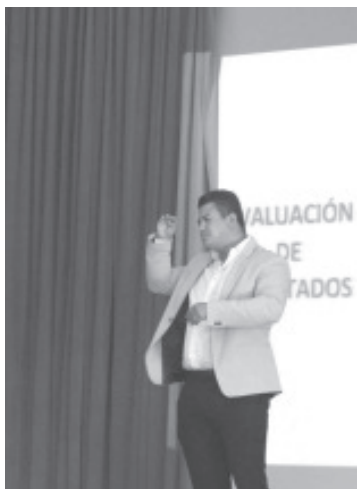
En el reconocimiento pleno de los derechos de los discapacitados, se deben emplear todos los esfuerzos posibles y generar con acciones efectivas mejores condiciones de desarrollo.

-El legislador busca propiciar una mayor sensibilización sobre la importancia de la inclusión