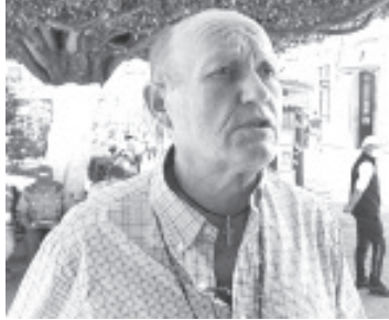
Dejó claro que a pesar de los reclamos, prevaleció la comunicación y esto generó buenos resultados en este acercamiento que se tuvo con el gremio de los taxistas.

En ese sentido, la SEE reitera que el diálogo seguirá abierto con todos los grupos y por ende la apertura para mesas de trabajo, en las que se tomen acuerdos apegados a la norma, recordando que las plazas automáticas y las negociaciones fuera de la ley no tienen cabida en la presente administración.