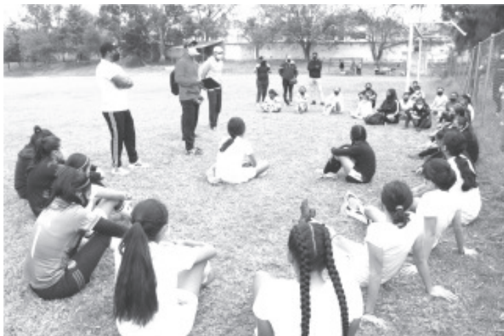
Para seleccionarlos se dieron cita un total de 131 adolescentes en los municipios de Apatzingán; Lázaro Cárdenas, Morelia, Uruapan, Zamora y Zitácuaro.

Ahora, ambos representativos sostendrán entrenamientos en la capital michoacana, durante cada fin de semana con la mirada puesta en los boletos a los Juegos Nacionales Conade 2022, los cuales buscarán en la etapa Macro-Regional a celebrarse en Michoacán, del 7 al 10 de abril.