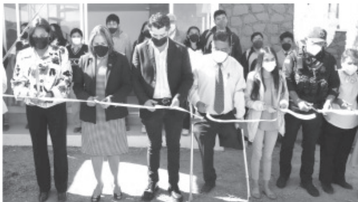
Sumamos 4 espacios como éste, a través de los cuales se simplifican y descentralizan los servicios municipales, además se despliega mayor seguridad.

-Llama Toño Ixtláhuac a la participación ciudadana para establecer un vínculo cercano con los operadores de este módulo.