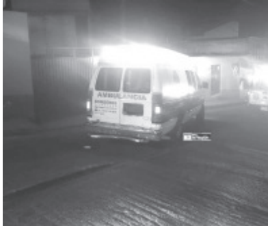
Los fallecidos están en calidad de desconocidos y se desconoce a los autores, así, como sucedieron los hechos.

De lo sucedido tuvo conocimiento la Fiscalía General del Estado, cuyos agentes y peritos se hicieron cargo de iniciar con las correspondientes diligencias para integrar la correspondiente carpeta de investigación.