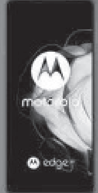
MOTOROLA 1 EDGE 20 5G