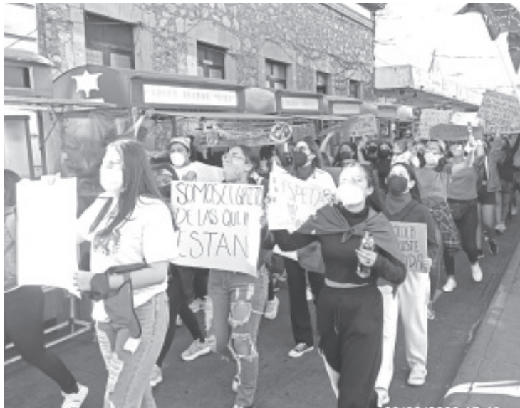
Frente la presidencia, representantes del colectivo hicieron un posicionamiento alusivo a esta fecha, donde destacaron que no se olvidan las luchas que se han hecho por mujeres.

También se brindó la oportunidad a las mujeres que tienen algún familiar desaparecido a expresarlo en el megáfono y dar un mensaje a todas las mujeres.