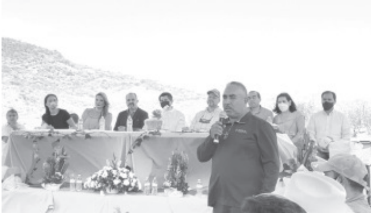
Con la clausura del relleno sanitario, a la par iniciarán los trabajos de una unidad de producción en Coyota y Timbineo de los Contreras.

- Hasta que la empresa tomó en sus manos el tema de clausura, fue que se vio avance