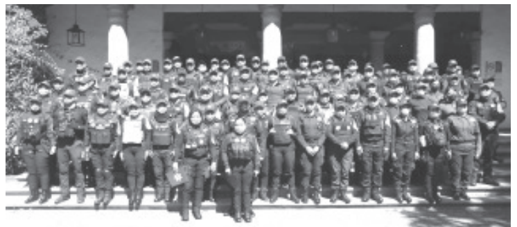
El gobierno de Michoacán y la SSP conmemoraron esta fecha con la entrega de reconocimientos al Mérito Social, la Perseverancia y el Valor a las elementos de la Policía Michoacán.

Durante el evento también se hizo la entrega de las constancias al grupo de Alerta de Género por su participación en la capacitación nacional sobre el Protocolo Nacional de Actuación Policial para la Atención de la Violencia de Género contra las Mujeres en el Ámbito Familiar, preparación que les permitirá fortalecer el desempeño de sus funciones en beneficio de la ciudadanía.