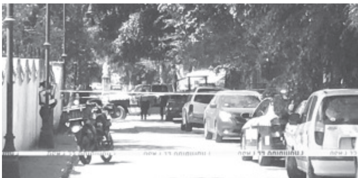
El hallazgo lo realizaron empleados del DIF cuando detectaron el coche de su compañero, a quien no habían visto desde el pasado 5 de marzo.

Hasta la comentada dirección llegaron patrulleros locales y paramédicos, quienes confirmaron el fallecimiento del individuo y delimitaron el perímetro, entonces alertaron a la Fiscalía General del Estado (FGE), cuyos especialistas se encargaron de las investigaciones respectivas y trasladaron el cadáver a la morgue para la práctica de la necropsia de ley, a efecto de determinar el origen de la defunción.