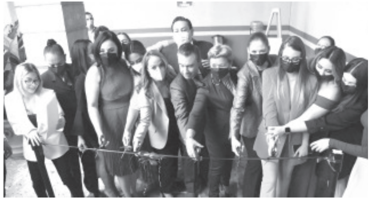
El movimiento feminista ha sido imprescindible para la participación no sólo política de la mujer, sino en el ámbito económico, social y por supuesto cultural.