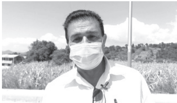
Invitamos a los ciudadanos a no desperdiciar el agua, que tomen en cuenta que para que llegue a su casa se hace un proceso de mucho trabajo.

Por el momento, comentó que algunas fuentes de abastecimiento comienzan a bajar sus niveles y se espera que está tendencia siga. Por ejemplo hay pozos que tienen 40 litros por segundo, mientras que en esta temporada disminuye hasta 31 litros por segundo y esto