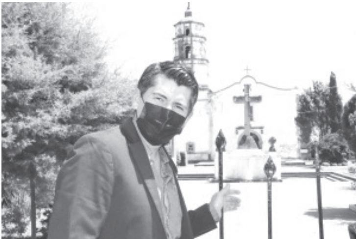
"Estamos haciendo equipo con San Felipe para que sean parte de la agenda educativa, cultural e histórica que promovemos en nuestra administración".

El edil reconoció a la tenencia como un importante centro cultural y productivo, "por eso, los ayudaremos a impulsar sus espacios históricos, su Universidad Intercultural y fomentar el turismo en esta localidad tan emblemática de Zitácuaro", resaltó.