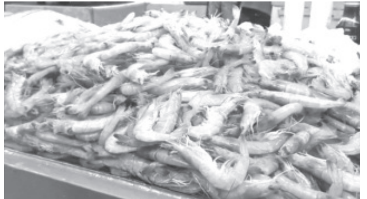
El operativo consiste en hacer visitas de supervisión en las que se checa que los puntos de venta cumplan con la norma oficial de salud como una adecuada red de frío.