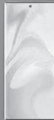
ZTE LTE AXDN 30 5G