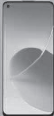
OPPO LTE RENO6 5G