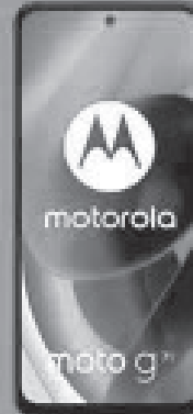
MOTOROLA MOTO G71