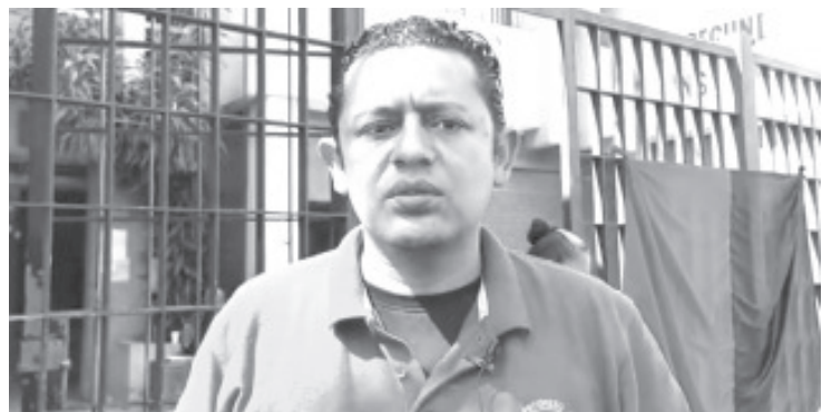
El estallamiento de la huelga fue porque no les suministran lo necesario para que ellos como trabajadores cumplan con sus funciones y piden aumento de sueldos.

Agregó que al menos en Zitácuaro, son 34 personas las que están en huelga, esto ha resultado pesado para ellas por las guardias que tienen que hacer en el lugar por el movimiento. Sin embargo reiteró que van a resistir porque sólo están pidiendo mejores condiciones de trabajo.