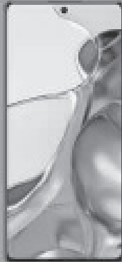
XIAOMI 11T PRO