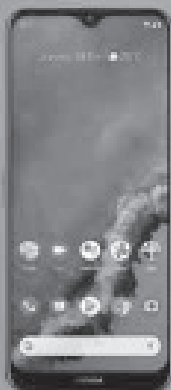
NOKIA 4.5GTA G50 5G