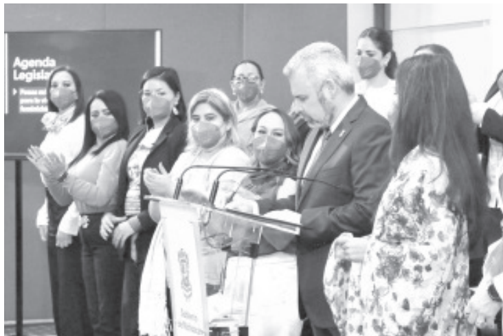
Esta reforma pretende homologar el feminicidio con la legislación federal, con el propósito de ampliar la pena que será de 50 a 60 años de cárcel por feminicidio.

-El movimiento de las mujeres para hacer valer sus derechos es el más relevante del presente siglo_