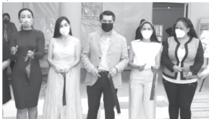
El presidente municipal destacó que el tema de la igualdad es prioritario en su gobierno, no solamente en una fecha conmemorativa, sino todos los días.