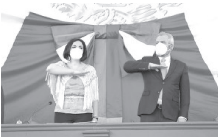
Los servidores públicos deben comprometerse con la historia para alcanzar la igualdad económica, social y de género que requieren las y los michoacanos.

Ario de Rosales, Michoacán, 07 de marzo del 2022.-* El gobernador Alfredo Ramírez Bedolla hizo un llamado a cerrar filas para superar los grandes retos del país, anteponiendo los intereses sociales y practicando una política a la altura de los tiempos actuales.