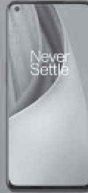
ONEPLUS NORD N10 5G