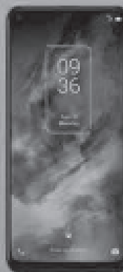
TCL 10 5G