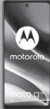
MOTOROLA MOTO G51