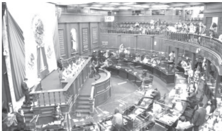
La Comisión de Jóvenes y Deportes dictaminó que durante ese ejercicio, no hubo elementos suficientes, para concluir que se realizaron acciones para ayudar a la juventud durante la pandemia del Covid19.

Finalmente, la Comisión de Ciencia Tecnología e Innovación dictaminó que no encontraron en el informe presentado la información suficiente para verificar todo lo que se expresa en el resumen ejecutivo, esto derivado de la falta de datos duros pertinentes.