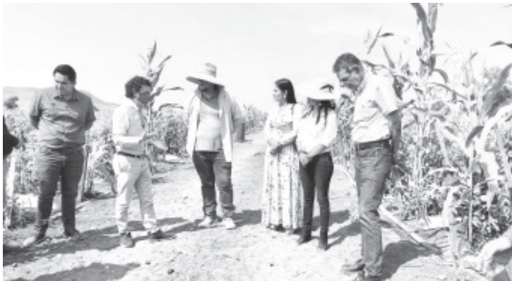
Los representantes de esta asociación, comentaron que es de suma importancia atender la problemática entorno al precio de la fruta, la plaga y los altos costos de los insumos.