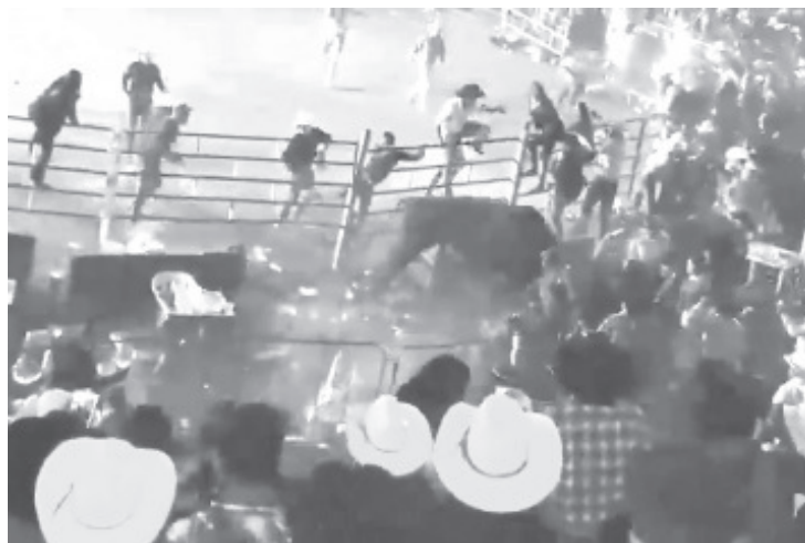
Los asistentes corrieron para ponerse a salvo, sin embargo, a su paso el toro fue destrozando mesas y embistiendo a varias personas.

Los organizadores del evento, lograron controlar al animal, y lazarlo para llevarlo de nuevo al centro del ruedo. A pesar de lo impactante de las imágenes de dicho evento afortunadamente no se reportaron heridos graves ni fallecidos.