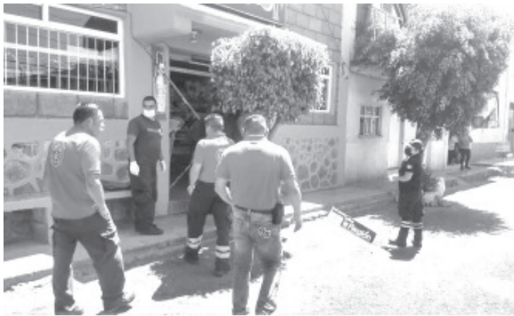
Un hombre no identificado perdió la vida al recibir varios impactos de arma de fuego, por desconocidos, ocurrió dentro de un comercio en la calle Almada.

Mas tarde los expertos de la Fiscalía General del Estado llegaron hasta el área de intervención, donde peritos se hicieron cargo de la recolección de indicios, mientras que los Policias Investigadores comenzaron con las respectivas averiguaciones sobre el caso. Del ahora occiso no fue revelada su identidad.