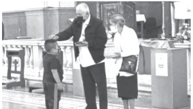
La ceniza que se utiliza este día es de la quema de las ramas de olivo del Domingo de Ramos del año anterior; son bendecidas por los sacerdotes y colocadas sobre la frente de los fieles.