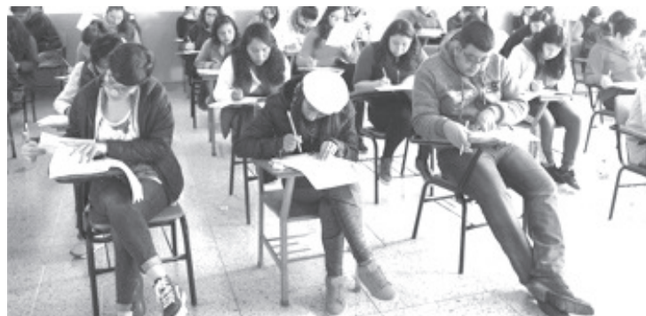
La SEE recuerda que por ley no se pueden asignar plazas automáticas, es necesario que los interesados cumplan con el perfil y participen en las convocatorias que se hacen públicas.

De igual forma, se tiene la disposición al diálogo con los diferentes grupos, incluidos los jóvenes normalistas; bajo el entendido de que no podrán existir acuerdos que violen la normativa.