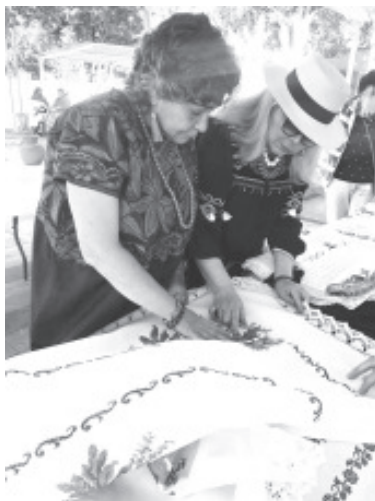
En esta actividad se van a entregar en total 28 premios, este tipo de actividad reconoce el trabajo y dedicación que hacen quienes se dedican a esta actividad.

De acuerdo al registro, participaron 92 artesanos de distintas comunidades de Zitácuaro, además de San Cristóbal y El Paso, perteneciente al municipio de Ocampo con un total de 168 piezas.