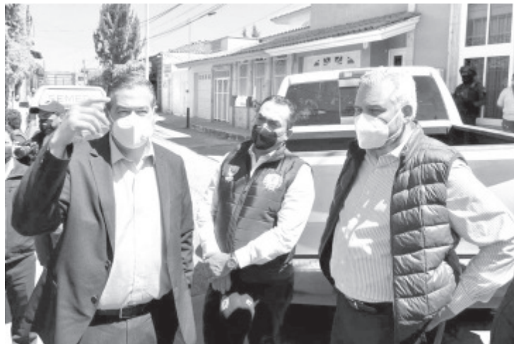
Derivado del operativo, en la comunidad de La Estancia fue asegurado un inmueble que era utilizado presumiblemente para la fabricación y almacenamiento de explosivos.

Finalmente, los servidores públicos acordaron mantener la comunicación abierta