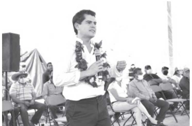
Toño dijo que la clausura formal del espacio es un importante logro, ante un problema heredado, el cual no podía postergarse más.

Reconoció a la empresa Colecta Zi, por el trabajo en conjunto en beneficio del entorno para la cancelación. Señaló que como hasta ahora, las acciones en conjunto de los tres niveles de gobierno continúan, a fin de establecer el lugar apropiado para los desechos del municipio.