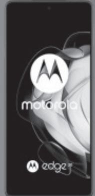
MOTOROLA 1 EDGE 20 5G