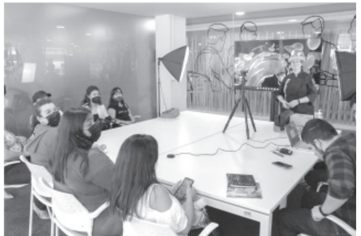
Se recomienda para quienes operan puestos ambulantes; estudios han comprobado que la contaminación se encuentra incluso en los trapos de cocina, alertó la especialista.

La charla de este jueves forma parte de la cartelera de capacitación que ofrece la Secretaría de Desarrollo Económico (Sedeco), a través de Espacio Emprendedor, con el apoyo de sus aliados estratégicos como es el ICATMI.