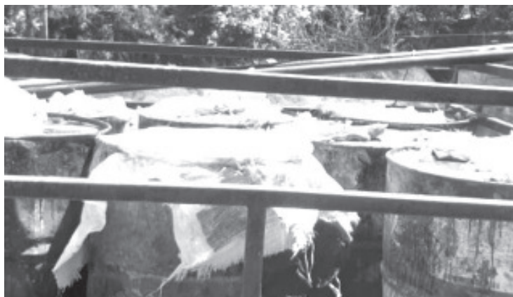
Elementos detectaron una camioneta de la marca Chevrolet, misma en la que transportaban siete tambos, cada uno con 200 kilos del producto forestal.

Los operativos destinados a salvaguardar la integridad de las áreas naturales, seguirán vigentes en las reservas del territorio estatal, para denunciar cualquier delito marca a las líneas telefónicas de emergencias 911 y 089.