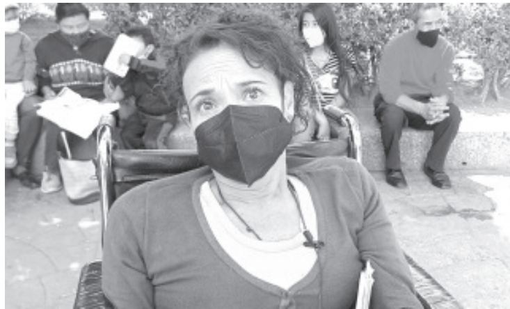
“No hay cultura de la discapacidad, y eso es diario, todas las rampas y espacios están invadidos, a nadie la importa y nadie hace nada por mejorar este problema”

Gómez Maya, exhortó a particulares, comerciantes y a los propios funcionarios públicos, a respetar las áreas destinadas a personas con discapacidad, ya que con la invasión que hacen, empeoran más la movilidad de este sector de la población.