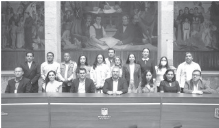
Ayuntamientos deben hacer labor de convencimiento para el uso de fertilizantes orgánicos, es una alternativa ambiental, económica y geopolítica.

Zitácuaro, Michoacán, 1 de marzo del 2022.- El gobernador Alfredo Ramírez Bedolla llamó a las autoridades municipales a alentar, en el sector campesino y agrícola, el uso de fertilizantes