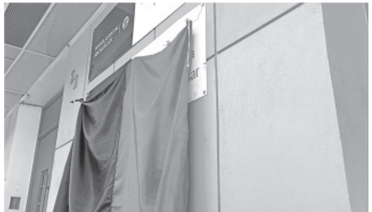
Sindicalizados colocan banderas rojinegras en juzgados y salas de juicios orales, titulares y personal de confianza siguen trabajando.

Exhortó a las autoridades a ser conscientes de que las demandas que los trabajadores han hecho son justas y que se deben atender