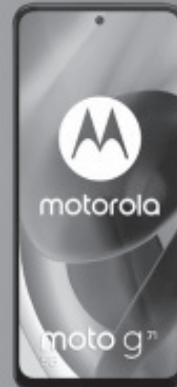
MOTOROLA MOTO G71