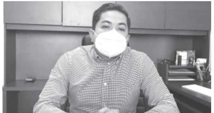
Se ha difundido un oficio a todos los funcionarios, respecto de la forma como deben conducirse y lo que no deben hacer durante el periodo de veda.

Agregó que hasta ahora no hay ninguna investigación de este tipo, pero si hay un mal comportamiento de algún servidor público la oficina a su cargo está abierta para recibir el reporte o queja correspondiente.