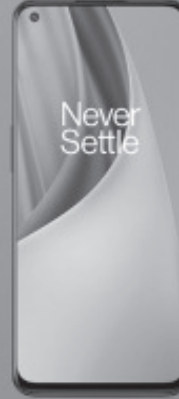
ONEPLUS NORD N10 5G