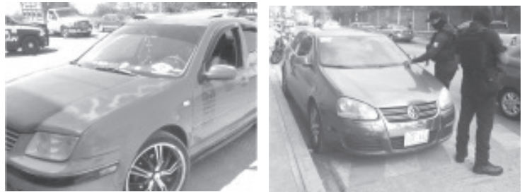
Jacona, Morelia y Tangancicuaro, los uniformados recuperaron los siguientes vehículos: uno de la marca Ford, cuatro Volkswagen y una motocicleta MB Motors.

Para reportar cualquier actividad delictiva las líneas telefónicas de emergencias 911 y 089 operan las 24 horas del día.