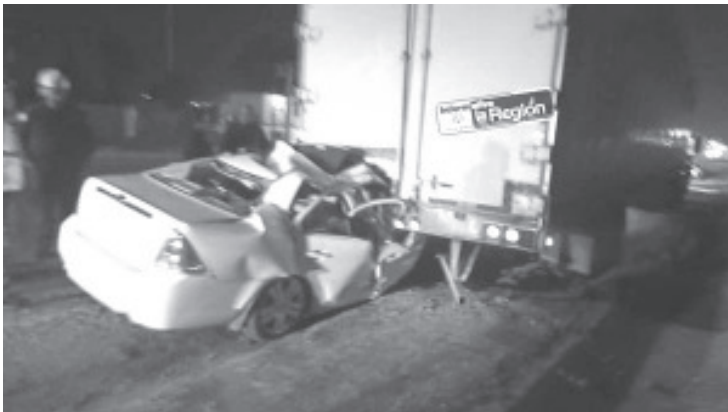
Un automóvil compacto chocó contra la retaguardia de un camión de carga, hecho que dejó dos muertos, el auto quedó incrustado en la parte trasera.

Por último, los cadáveres fueron trasladados a la morgue para la práctica de la necropsia de ley. La identidad de los finados es desconocida, ellos tenían entre 35 y 45 años de edad, comentaron contactos allegados al tema.