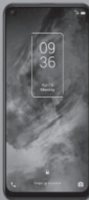
TCL 10 5G