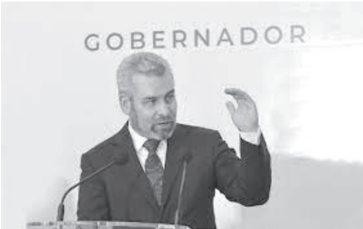
“Hay funcionarios del gobierno anterior que metieron la mano y las siguen metiendo, ya los estamos investigando, ya se están haciendo las auditorías”, dijo Bedolla-

Morelia, Michoacán, 27 de febrero del 2022.-* Con el compromiso de erradicar la corrupción de fondo, el Gobierno de Michoacán investiga a altos exfuncionarios que tienen “las manos metidas” en el conflicto magisterial.