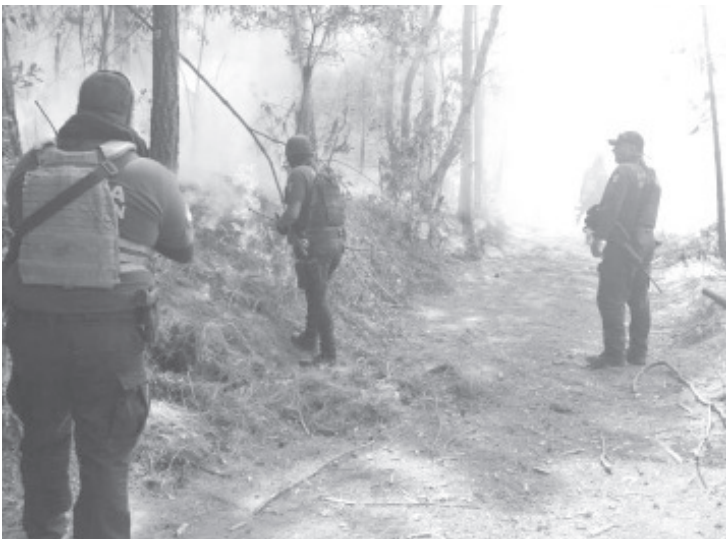
Policía Michoacán en coordinación con brigadistas de la Comisión Nacional Forestal (CONAFOR) mantienen monitoreo en el área ejidal dónde se reportó un incendio, ya controlado.

Ante cualquier emergencia, las líneas telefónicas 911 y 089 se mantienen abiertas para la atención ciudadana.