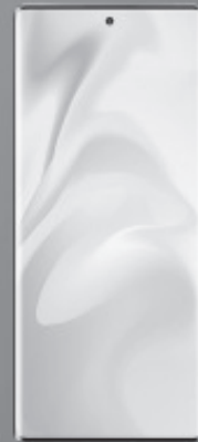
ZTE LTE AXON 30 5G