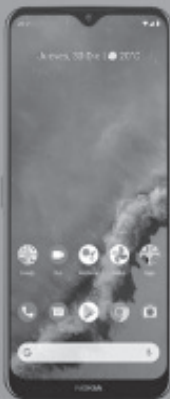
NOKIA 4.5GTA G50 5G