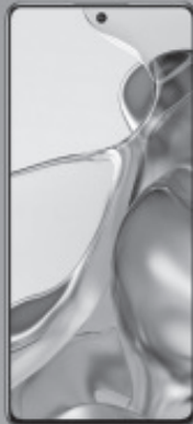
XIAOMI 11T PRO