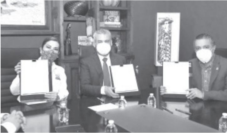
Son acciones precisas y establecidas que nos dan garantía de buenos resultados con esa colaboración de parte del Seguro Social, indicó el gobernador.

-Se realizará intercambio de padrones para fortalecer y eficientar la recaudación