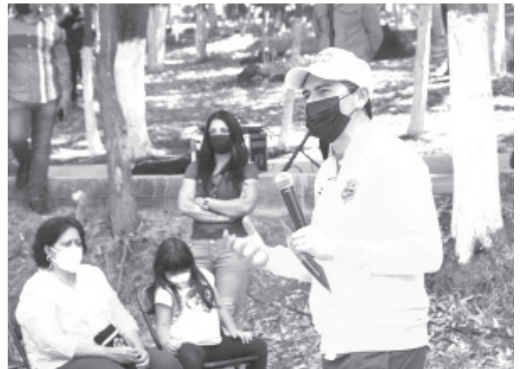
Recuperamos un espacio más para los zitacuarenses, dignificamos un sitio para la práctica de actividades deportivas, recreativas y de sana convivencia.

Agradeció a la Iglesia Pentecostal Unida de México, por sumarse al rescate de este espacio, con actividades dirigidas a la niñez y juventud que se estarán llevando a cabo en el parque.