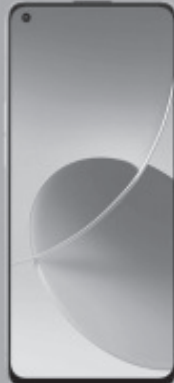
OPPO LTE RENO6 5G