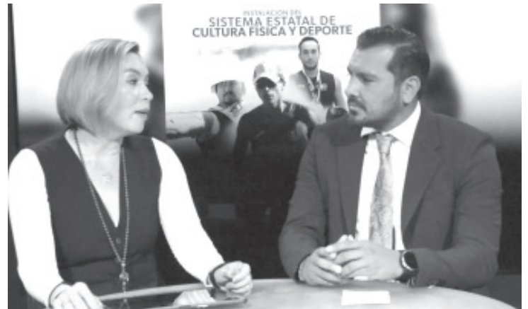
Participaron 140 personas del ámbito deportivo michoacano, a través de una sesión virtual, la Cecufid, realizó la instalación del Sistema Estatal de Cultura Física y Deporte (Siecfide).