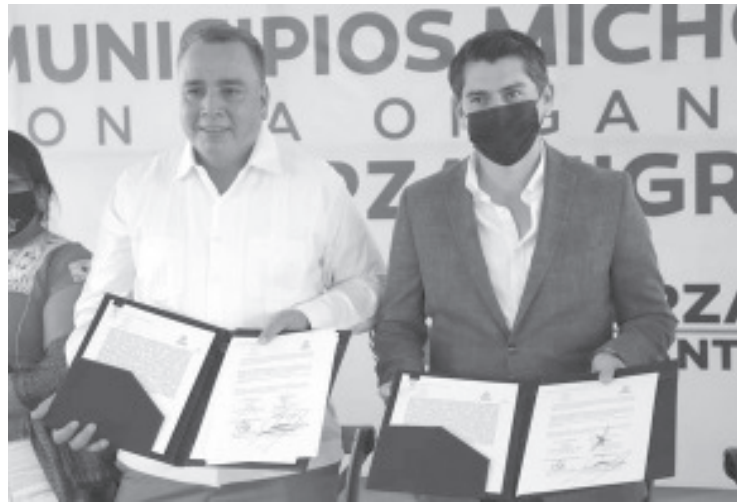
Este acuerdo es parte de los esfuerzos que el Ayuntamiento articula para acrecentar y ampliar el trabajo en favor del empoderamiento económico, social y político de las comunidades connacionales.

“No hay producto que no haya subido 1 peso, 5, 10 pesos o hasta más; y como consecuencia nosotros también hemos dejado de surtir algunas mercancías que no se venden