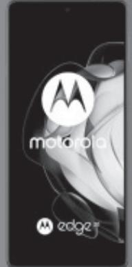
MOTOROLA 1 EDGE 20 5G