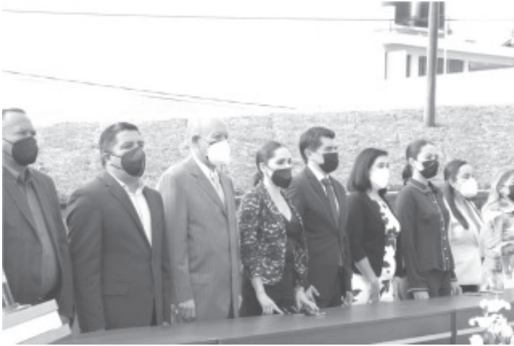
Su uso implica el respeto y conocimiento a su origen, representa la identidad de los mexicanos es un símbolo que se respeta y venera porque es nuestro México.

- La conmemoración se realiza desde 1940