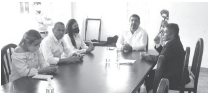
La Policía Michoacán realiza labores coordinadas con la corporación de seguridad municipal para garantizar la seguridad en la demarcación y sus alrededores.

La SSP y las autoridades locales coincidieron en que las labores de acompañamiento en materia de seguridad dan certeza de recuperación de espacios de paz en toda la geografía michoacana.