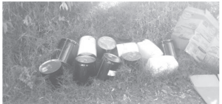
Se corroboró que los químicos asegurados al parecer estaban destinados para la fabricación de sustancias ilícitas, por lo cual fueron asegurados.

Para denunciar cualquier delito que atente en contra del bienestar de las y los michoacanos, marca a las líneas telefónicas de emergencias 911 y 089, mismas que operan las 24 horas del día.