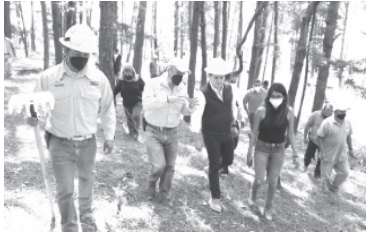
Se coordinarán acciones con los distintos niveles de gobierno y con la voluntad de las comunidades, para evitar la propagación de fuego durante esta época.

Los trabajos operativos y de inteligencia de la Policía Michoacán en la región Oriente son permanentes, por lo que se invita a la sociedad a reportar toda conducta ilícita a las líneas de emergencias 911 y 089.