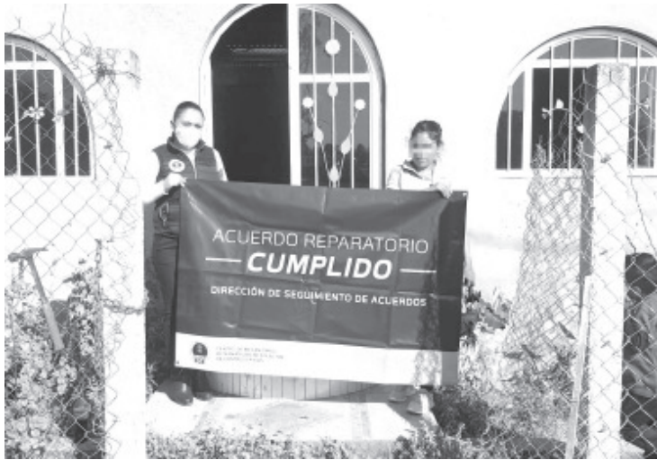
FGE a través del Centro de Mecanismos Alternativos de Solución de Controversias restituyó un inmueble a una mujer víctima del delito de Despojo, en tenencia de Zitácuaro.

Este día, personal del Centro se constituyó en el domicilio donde se realizó la firma de un acuerdo reparatorio, dándose por terminada la acción penal.