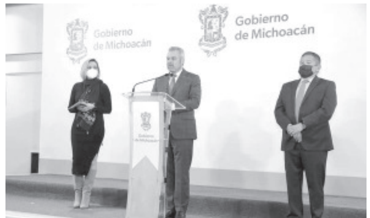
Esta información forma parte de las investigaciones que se realizan en las dependencias donde se encontraron inconsistencias en el gasto público.

A mediados de diciembre de 2021, Pfizer admitió que dos dosis, que se componen de una décima parte de la dosis para adultos, no lograron producir una respuesta inmunológica adecuada en niños de 2 a 4 años. Por lo que ahora están realizando ensayos para determinar si tres dosis logran producir los resultados