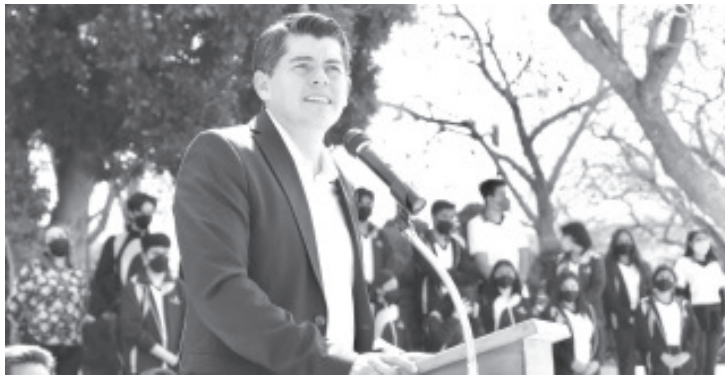
"Mantenemos nuestra decisión de impulsar la educación, como uno de los principales mecanismos para propiciar el desarrollo de nuestro municipio", indicó el alcalde.

El presidente Ixtláhuac, además de anunciar que su gobierno ayudará en las solicitudes planteadas para mejorar las instalaciones del plantel, entregó sanitizante y gel anti-bacterial, a fin de continuar mitigando los contagios por COVID-19.