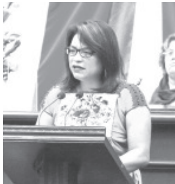
Buscamos reformar las atribuciones del Auditor Superior, con el objeto de evitar abusos de funciones y generar contrapesos de poder al interior de la ASM.