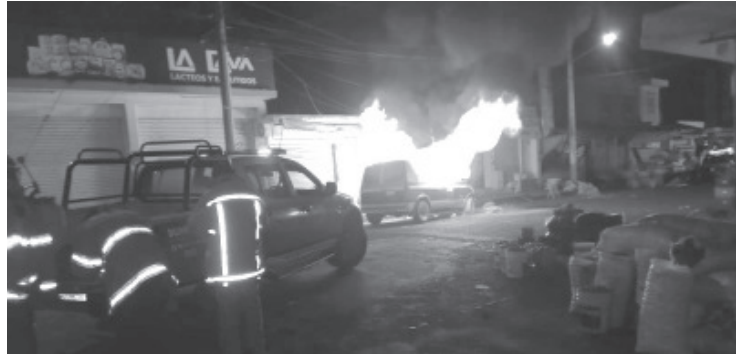
El cuerpo de auxilio recibió una llamada telefónica dónde les reportaron un vehículo incendiándose en la calle Cuauhtémoc, esquina con Pueblita.

El propietario del vehículo indicó a los rescatistas que escuchó que tronó algo en el interior de la máquina y luego esta comenzó a incendiarse, con los resultados ya referidos