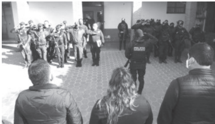
Durante la toma de protesta se exhortó a los nuevos mandos policiales a trabajar con ímpetu, profesionalismo y responsabilidad para hacer cumplir la Ley.