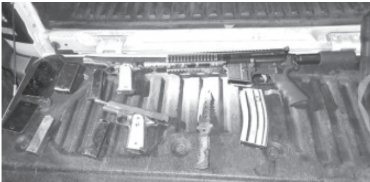
A los implicados, al realizarles una inspección, les fueron encontrados dos pistolas, un fusil, así como 162 cartuchos útiles y tres equipos de comunicación.

Las líneas de emergencias 911 y 089 se encuentran activas las 24 horas del día, para denunciar todo hecho delictivo que atente en contra de la tranquilidad de las y los michoacanos.