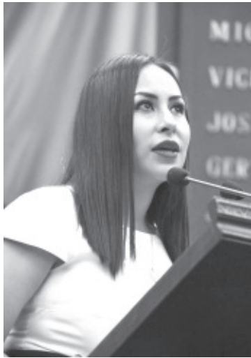
La firma de convenio entre el CEDEMUN e INAFED, es una herramienta que traerá beneficios, como lo es la capacitación constante y acciones que aporten al desarrollo municipal.

Para fortalecer el desarrollo de los municipios michoacanos, a propuesta de la diputada Gloria Tapia Reyes, vicecoordinadora del Grupo Parlamentario del Partido Revolucionario Institucional, el Pleno de la LXXV Legislatura Local aprobó el punto de acuerdo por el que se exhorta al titular del Poder Ejecutivo del Estado, para que, gire instrucciones al Vocal Ejecutivo del Centro Estatal para el Desarrollo Municipal (CEDEMUN), a fin de que, realice las gestiones y procedimientos para la firma del convenio con el Instituto Nacional para la Federalización y Desarrollo Municipal (INAFED).