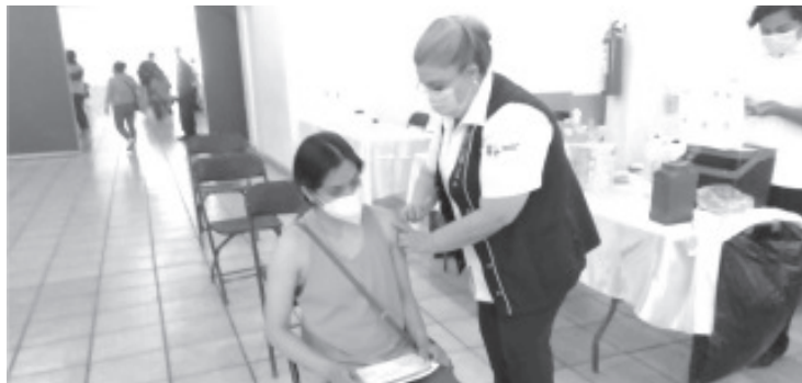
Para el caso de la aplicación del refuerzo al rango 30-39 es la vacuna Astra Zeneca, mientras que para los rezagados que no han recibido ninguna dosis o deben reiniciar su esquema es la Cansino.

Agregó que la vacunación es un instrumento para preservar la salud, y ha quedado demostrado que evita cuadros graves de covid-19, así como defunciones a causa de este virus. En este sentido invitó a las personas que aún no reciben ninguna dosis a registrarse para recibir la vacuna, lo que es un derecho universal.