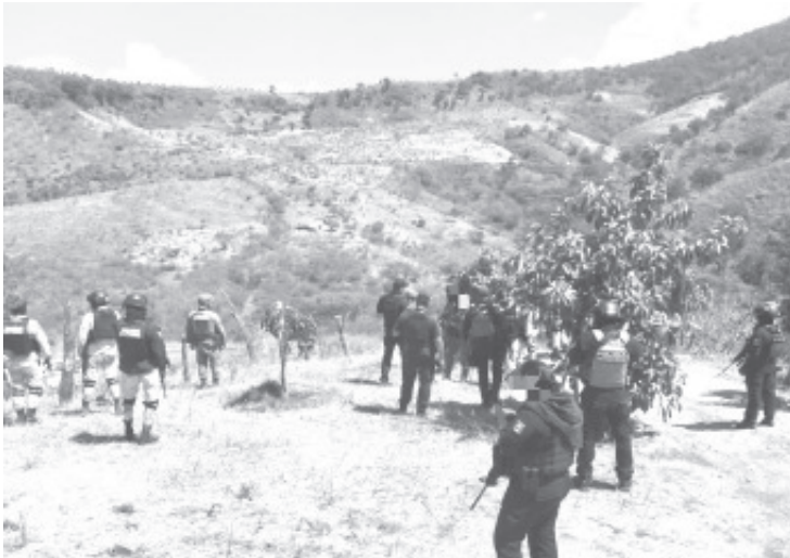
Resultado de estas labores, dos supuestos agresores murieron. De igual manera, se rescató a dos mujeres, quienes al parecer estaban privadas de la libertad.

Las tareas de seguridad desplegadas en este municipio y toda la región oriente seguirán vigentes para preservar el orden público y garantizar el bienestar de los pobladores. Para denunciar cualquier delito marca a la línea telefónica de emergencias 911 o bien de manera anónima al 089.