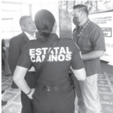
Los elementos de la Policía Michoacán darán un acompañamiento físico y de patrullajes permanentes a lo largo de los caminos, las carreteras y las huertas del municipio.

Nuevo Parangaricutiro, Michoacán, 19 de febrero del 2022.- A fin de brindar seguridad en el proceso productivo del aguacate, los titulares de la Secretaría de Seguridad Pública (SSP) encabezaron una reunión de trabajo en este municipio con las autoridades municipales, empresarios de la Asociación de Productores y Empacadores de Aguacate en Michoacán (APEAM) y funcionarios del Departamento de Agricultura de los Estados Unidos (USDA).