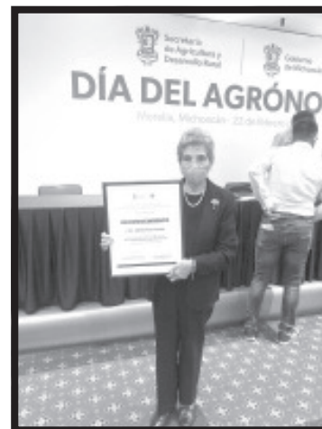
la Secretaría de Agricultura y Desarrollo Rural entregó el reconocimiento post mortem, que representa un orgullo para su esposa e hijos.