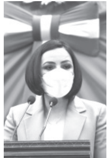
La iniciativa pretende que se realicen estudios de impacto social, previo a la publicación de una convocatoria para la licitación de un contrato de obra pública.

En su participación en Tribuna, durante la