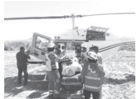
Luego del aterrizaje de la aeronave en Morelia, se realizó la canalización en el Hospital Infantil donde será valorada por el personal médico y especializado.

La línea 911 está disponible las 24 horas del día para brindar apoyo a quienes requieran una emergencia de salud y actuar oportunamente.