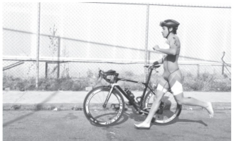
35 atletas seleccionados en la disciplina del triatlón, quienes representarán a Michoacán en la fase Regional de los Juegos Nacionales Conade 2022, tras la celebración del selectivo estatal.