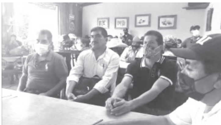
Los integrantes del nuevo Consejo exigieron al Gobierno del Estado, y al IEM determine cuál de los dos Consejos es el más viable para la comunidad y determine lo mejor.

- Se hizo durante asamblea este domingo y señalan ser los que sí representan a la comunidad