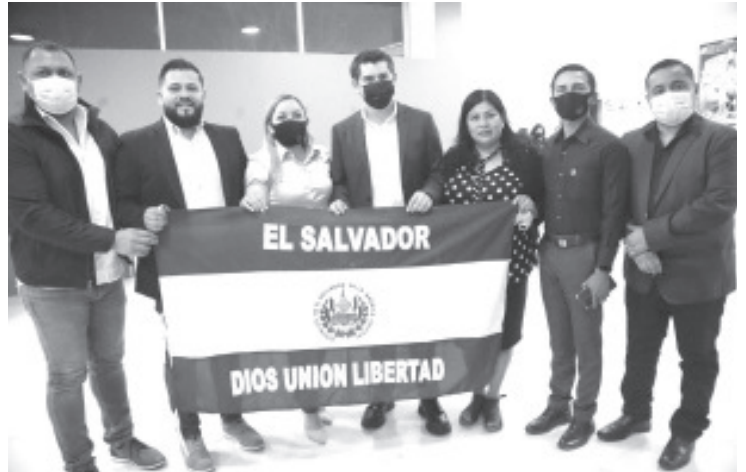
A través del trabajo bilateral hemos de fortalecer los lazos internacionales entre nuestro municipio y la República de El Salvador en la cooperación en áreas de mutuo interés.

Como parte de el itinerario turístico recorrimos la zona Arqueológica de Zirahuato-San Felipe, joya cultural de gran jerarquía en nuestro municipio.