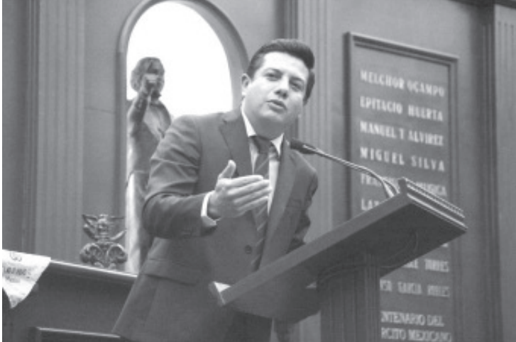
Es un galardón que nos debe llenar de orgullo, el poder reconocer el trabajo de quienes se dedican a eliminar las desigualdades y garantizar la libertad de la ciudadanía.

-La Presea se entregará en el municipio de Ario de Rosales el 07 de marzo de cada año por representantes de los tres poderes.