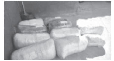
Elementos de La Guardia Nacional localizaron y aseguraron entre la maleza 180 kilos de marihuana, distribuida en 10 costales de yute, en La Palma, de este municipio.

El enervante fue puestos a disposición del Ministerio Público Federal en Zitácuaro, para que peritos y elementos de la Policía Federal Ministerial (PFM), aporten al Ministerio Público Federal (MPF) los dictámenes e investigaciones correspondientes a fin de integrar la carpeta de investigación, en contra de quien o quienes resulten responsables.