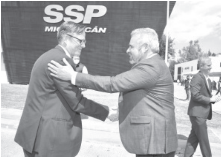
Bedolla presentó una propuesta de mecanismo de seguridad para garantizar el libre tránsito, cosecha, empaque y exportación del producto michoacano con destino al país del norte.