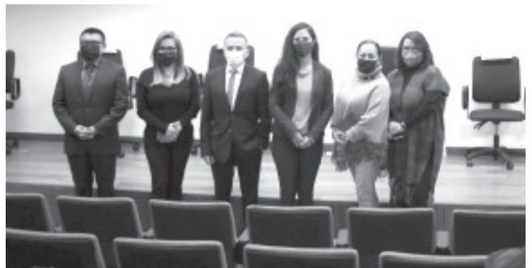
Inició la capacitación del Protocolo Nacional de Actuación Policial para la Atención de la Violencia de Género contra las Mujeres en el Ámbito Familiar.

Al evento también asistieron la subsecretaria de Derechos Humanos y de la Secretaría de Gobierno, la directora del Centro Estatal de Prevención del Delito y Participación Ciudadana, la titular de la Casa de la Cultura Jurídica de la Suprema Corte de Justicia de la Nación y el director de Desarrollo Policial de la Secretaría de Seguridad Pública.