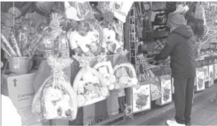
Comerciantes del Día del Amor y la Amistad se instalaron este 13 y 14 de febrero en las calles de Lerdo de Tejada y Dr Emilio García, en el centro de la ciudad.