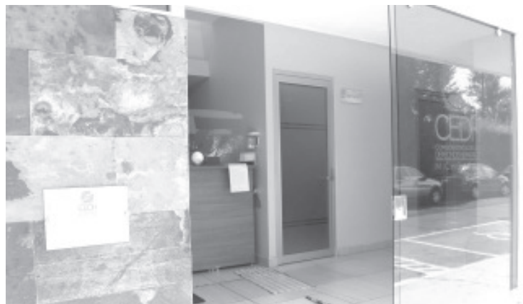
CEDH: En coordinación con su homóloga del estado de Jalisco realizó el Taller Virtual: Análisis contextual para la defensa de los derechos humanos en los casos de desaparición de personas.

En esta actividad participaron servidoras y servidores públicos de las distintas áreas del organismo, comprometidos en la eficiencia y eficacia de los servicios que se ofrecen en la institución.