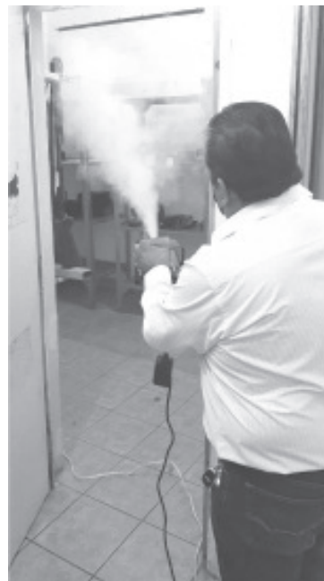
Se espera contar con el respaldo de familiares en este nuevo aplazamiento de visitas que pasa del 13 al 28 de febrero, con la finalidad de cortar la cadena de contagios.

El incremento de filtros sanitarios en el ingreso de todas las áreas y sanitización permanente en los penales y oficinas administrativas del sistema Penitenciario, así como la continuidad en el proceso de aplicación del refuerzo de la vacunación a personas privadas de la libertad, son medidas enmarcadas en el protocolo que se estableció para contar la cadena de contagios en la población penitenciaria.