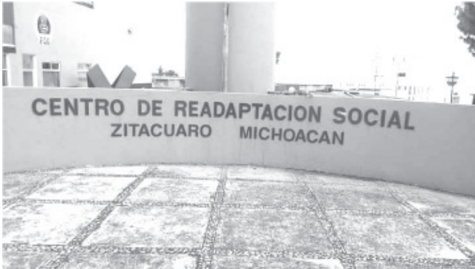
Ortega Santana, expuso que el contagio ocurrió porque todavía hay muchas personas sin recibir ninguna vacuna o porque tienen su esquema incompleto.

- Posible 18 sospechosos, entre quienes no se han vacunado