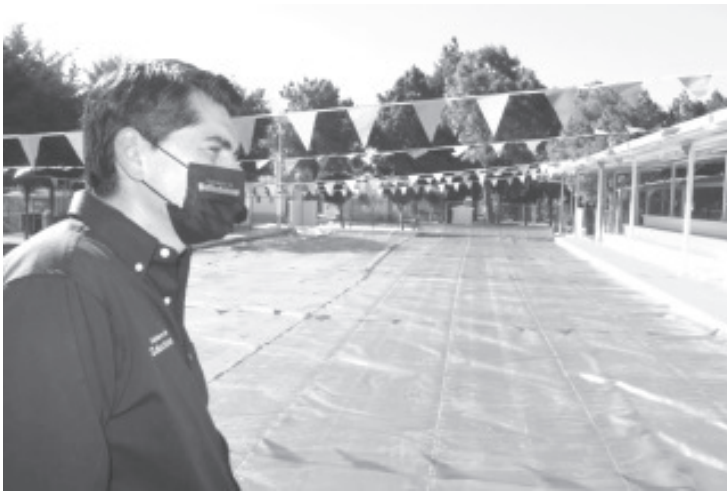
Hoy la alberca de la unidad de Pueblo Nuevo, está lista para recibir a niñas, niños, jóvenes y atletas de alto rendimiento.