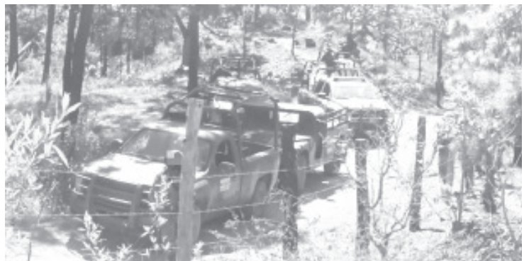
En El Manguito los militares fueron atacados por civiles armados, por lo cual repelieron la agresión y los criminales huyeron; no hubo agentes lesionados.

Una vez realizadas las labores correspondientes, se procedió a la destrucción del lugar; asimismo, se dio vista a la autoridad competente, la cual llevó a cabo las diligencias establecidas. Se exhorta a las y los michoacanos a denunciar cualquier ilícito a las líneas telefónicas de emergencias 911 y 089.