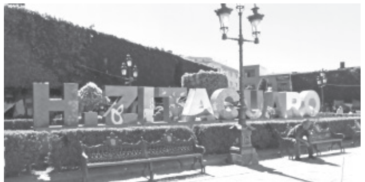
En las letras están imágenes que representan el aguacate, la guayaba, la zarzamora, la trucha, la mariposa monarca, la iglesia de San Pancho, los Cerros Cacique y La Coyota.