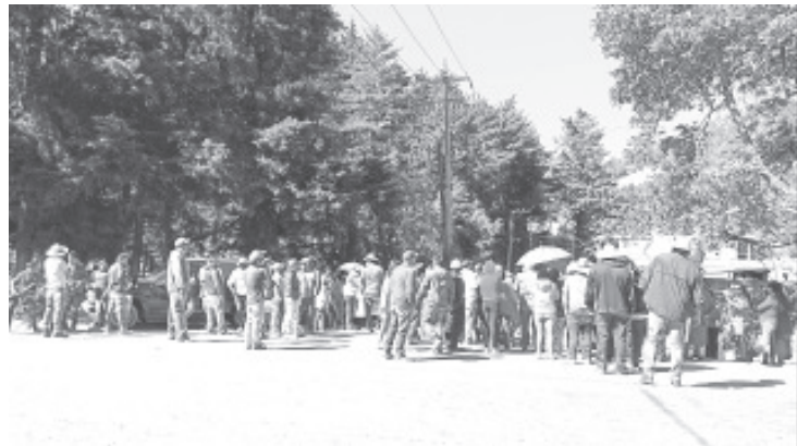
Los inconformes recalcaron que no permitirán que en este lugar se deposite basura, pues serían afectadas todas las comunidades cuyo vital líquido proviene de este pulmón natural.