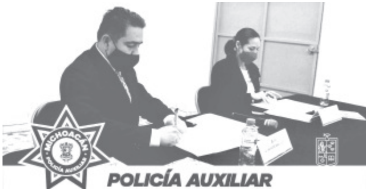
Con este convenio los elementos de la Policía Auxiliar pondrán recibir capacitación del Icatmi en todos los planteles que cuenta a lo largo del Estado.