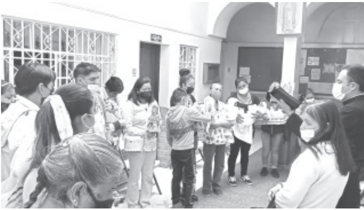
El Día de la Candelaria se festeja cada 2 de febrero y es una festividad que representa la purificación de la Virgen y la presentación del niño Dios en Jerusalén.

- Decenas de católicos acuden a iglesias a bendecir a sus niños Dios