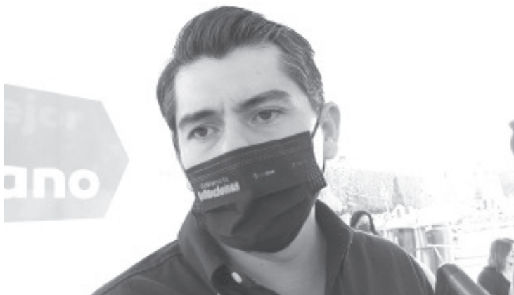
El tema del relleno sanitario tiene que ser una solución del gobierno y por el momento no hay nada, toda la información que se ha manejado es falsa.

Recordó que originalmente, estas letras fueron colocadas en este lugar con apoyo de empresarios locales, con la condición de que el ayuntamiento le diera mantenimiento. Ahora después de un tiempo se ha realizado y los zitacuarenses y visitantes pueden disfrutar de la vista, además de tomarse una foto en el lugar y con ello motivar a otros a venir a Zitácuaro.