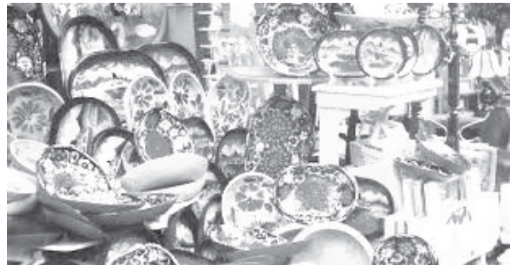
En la galería de esta dependencia, estará la exposición y venta de las más de 100 piezas ganadoras y participantes, del XLVI Concurso "Gran Premio Nacional de Arte Popular".

Agregó que el Instituto del Artesano Michoacano, se ubica en el Centro histórico de Morelia, frente a la plaza Valladolid, a un costado del templo de San Francisco, con horario de 9:00 a 18:00 horas.