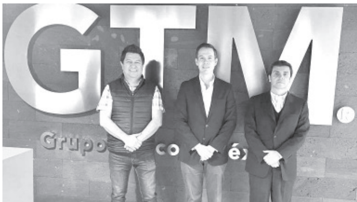
Se habló de la necesidad de ampliar la red de fibra óptica en Michoacán, especialmente en aquellas zonas donde aún no se cuenta con el servicio de Internet.

Los directivos de Grupo Telecom de México (GTM), informaron que estarán en Michoacán en menos de un mes para avanzar en su plan de inversión en la entidad.