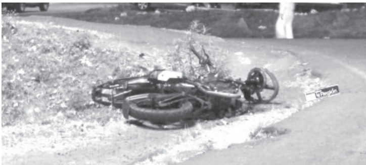
Al momento del impacto los tripulantes salieron proyectados y sufrieron graves heridas que les causaron la muerte en el lugar.

Trascendió de manera extraoficial que el conductor de la camioneta fue detenido por los guardianes del orden y presentado ante la instancia correspondiente para que le determine su situación jurídica.