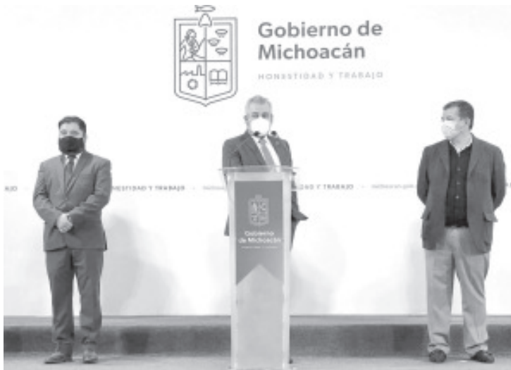
Con esta modalidad, se agilizan los servicios para los usuarios, se reducen los tiempos de espera para expedir el documento y se evitan gastos de traslado hacia las oficinas estatales.

-Está nueva modalidad agilizará procesos de trámite y entrega del documento