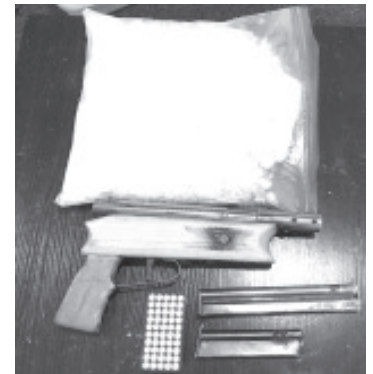
Sobre una moto estaba una mochila que contenía más de un kilo de metanfetamina, un arma hechiza calibre .22, así como 50 cartuchos útiles y dos cargadores.