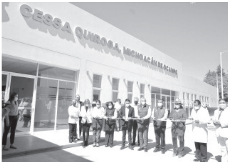
El gobernador aseguró que esta unidad de salud tendrá medicamentos y personal suficiente para garantizar los servicios médicos a las y los pacientes.