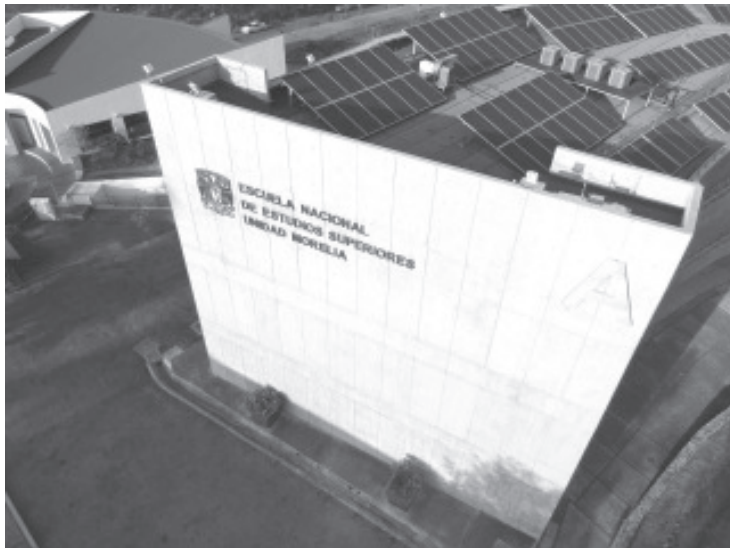
En la ciudad de Morelia se podrá presentar el examen de ingreso únicamente para las trece licenciaturas que se ofertan en la Escuela Nacional de Estudios Superiores (ENES) Unidad Morelia.

En archivo adjunto enviamos el comunicado completo, agradecemos de antemano su apoyo en la difusión de su contenido.