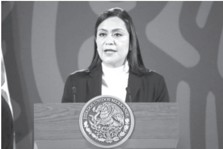
En esta semana concluirá el pago del bimestre enero-febrero para que las pensiones para adultos mayores y personas con discapacidad, y el de apoyo hijos de madres trabajadoras, queden cubiertos al 100%.

La Pensión para el Bienestar de las Personas Adultas Mayores actualmente atiende ya a 10 millones 259 mil 861 derechohabientes, los cuales podrán ejercer este importante derecho constitucional cada bimestre por el resto de su vida. Así lo informó la secretaria de Bienestar, Ariadna Montiel Reyes, al participar en la conferencia matutina en Palacio Nacional este lunes.