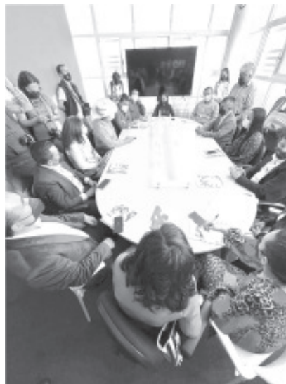
En la firma de convenio de colaboración, se estableció que se apoyará a todo aquel ciudadano interesado en capacitarse y autoemplearse.

Señaló que además del impulso de varios proyectos, también se busca que se impartan