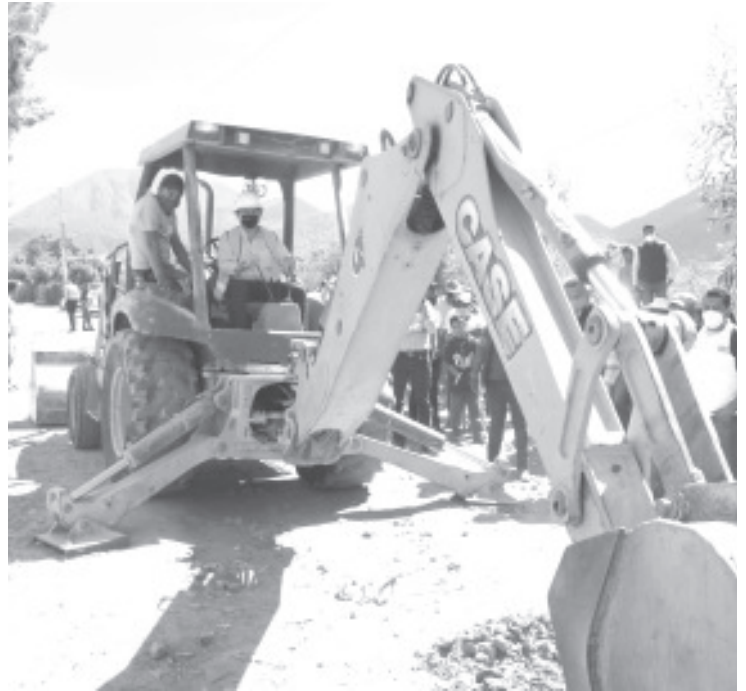
La obra consta de 500 metros lineales de pavimento a base de concreto hidráulico y que incluye guarniciones, banquetas, así como alumbrado público.

durante el periodo de nuestro #GobiernoDeSoluciones, hoy iniciamos la primera parte de su camino y cuenten con todo nuestro respaldo para seguir avanzando en esta obra, hasta que la concluyamos", informó el edil.