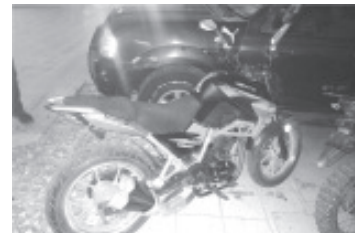
La Policía Michoacán localizó motocicletas de la marca Vento, en un estacionamiento ubicado en la avenida Revolución Norte, quizá relacionadas con el crimen de Roberto Toledo

Una vez realizadas las actuaciones correspondientes, las unidades fueron aseguradas y puestas a disposición de la autoridad competente a efecto de llevar a cabo las diligencias que marca la ley. De igual