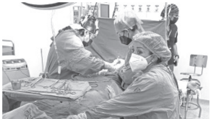
Un joven de 23 años que tuvo muerte encefálica producto de traumatismo craneoencefálico, por a un accidente de motocicleta y cuya familia accedió a la donación de los dos riñones.

Finalmente, la doctora García Gamiño comentó que cualquier persona puede ser donador voluntario; asimismo, invitó a visitar la página del IMSS en el enlace http://www.imss.gob.mx/salud-en-linea/donacion-organos en la cual se pueden registrar como donadores voluntarios, los interesados también pueden consultar la página de internet del Centro Nacional de Trasplantes: https://www.gob.mx/cenatra/ .