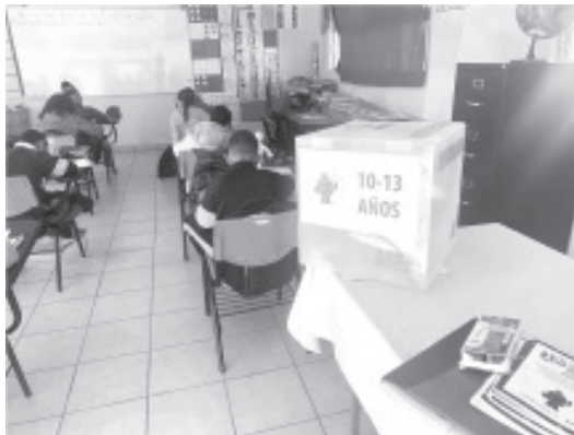
Este distrito contó con 142 casillas que se instalaron en Anganguero, Caracuaro, Juárez, Jungapeo, Huetamo, Ocampo, San Lucas, Tzitzio y Zitácuaro.

H. Zitácuaro Michoacán, 01 de febrero de 2022.- Por: Guadalupe Solache Rebollo. En la novena edición de la Consulta Infantil y Juvenil del INE, realizada en el pasado mes de noviembre, participaron 18 mil 744 menores de edad, por lo que este ejercicio supera a los que se han realizado anteriormente.