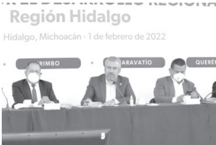
Además del turismo y medio ambiente, destacó que con el Fondo FAEISPUM, se contempla una inversión de 87.2 millones de pesos para los 10 municipios.

-Se invertirán 785.4 mdp para potenciar el desarrollo de esta región en materia de seguridad, bienestar, salud, turismo y obras públicas