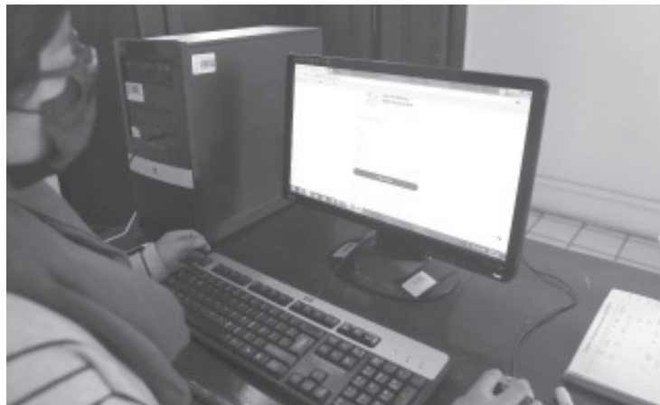
Se trata de un medio seguro, al que ya han accedido y registrado sus datos 33 mil 262 ciudadanos, desde su implementación.

Los funcionarios de la Secretaría de Finanzas y Administración, refrendaron el compromiso institucional de facilitar a la sociedad los medios funcionales para el cumplimiento del trámite, con los beneficios que significa hacerlo oportunamente e ir hacia el Gobierno Digital de una forma fácil, ágil y sin corrupción.