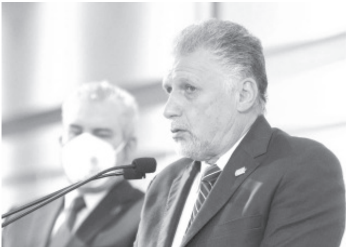
El gobierno de Michoacán reactivó tres obras viales de gran impacto en Morelia y La Piedad, luego de que las empresas constructoras suspendieran los trabajos.

-Se trata de los distribuidores viales de Mil Cumbres y de salida a Salamanca, en Morelia, y del Boulevard Lázaro Cárdenas, en La Piedad.