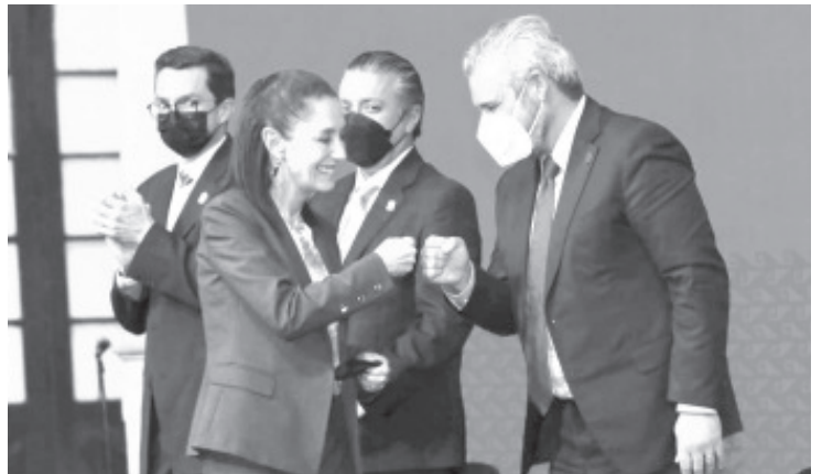
"Michoacán realiza esfuerzos, la brecha digital es enorme y el gran reto que se viene es la adecuada aplicación de la ley para que no se quede en letra muerta".

En este evento participaron funcionarios del gabinete legal del estado, diputados locales y federales.