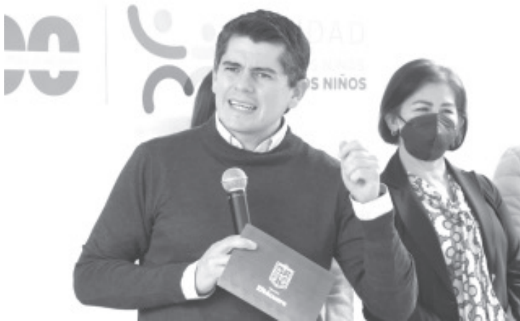
Toño Ixtláhuac destacó que uno de los principales ejes de su administración es la educación, por lo cual seguirá trabajando con todas las escuelas de Zitácuaro.