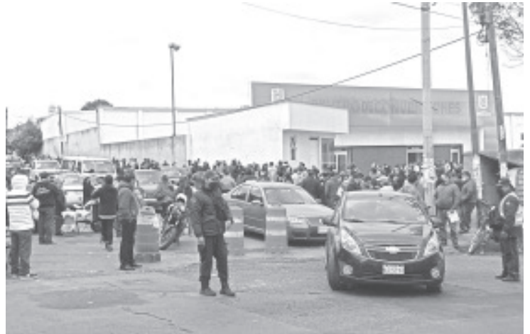
Zitácuaro este martes y miércoles se aplicaron más de 8,500 vacunas Astra Zeneca como refuerzo para personas del rango de edad 40-49 años.

Aseguró que continuará apoyando a esta institución que hoy se beneficia con la obra. En este sentido, anunció que en el próximo #DíaCiudadano hará entregar a la Secundaria Tres, de una pantalla para fines didácticos que le fue solicitada.