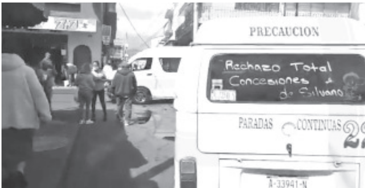
Desde semanas atrás, trabajadores de esta ruta en repetidas ocasiones han hecho este tipo de acciones para exigir a la autoridad correspondiente atención en este tema.

Al lugar acudieron representantes de la Comisión Coordinadora del Transporte, así como Tránsito Municipal, tras un breve diálogo acordaron reunirse en los siguientes días para dar solución al problema. Acto seguido las combis se retiraron y retomaron su trabajo normal de todos los días.