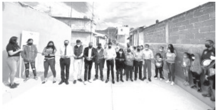
Son las y los vecinos de las distintas colonias y comunidades, quienes deciden en su #GobiernoDeSoluciones las obras y acciones que se realizan en sus colonias y localidades.

"Nuestro gobierno considera prioritario mejorar las condiciones de vida de los zitacuarenses; sigamos trabajando juntos para lograr progreso en todo el municipio. La participación ciudadana es fundamental en la presente administración", agregó el edil.