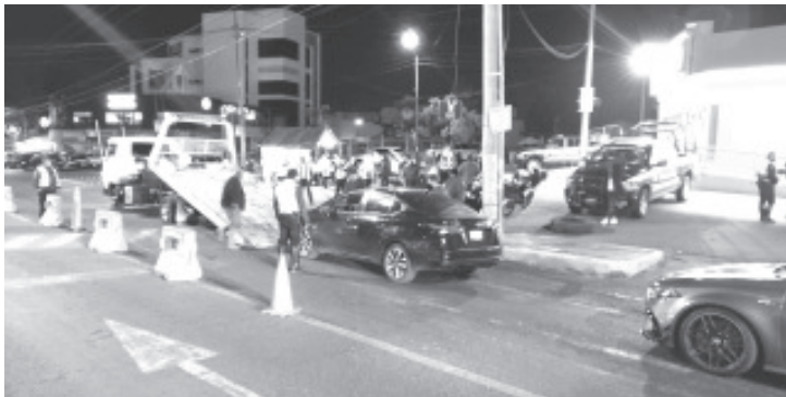
El personal de seguridad exhortó a los ciudadanos a respetar los límites de velocidad, usar siempre el cinturón de seguridad, no usar el celular mientras conduce y evitar distractores.

• Las infracciones derivaron de 95 pruebas de alcoholemia realizadas en diversos filtros de inspección vehicular.