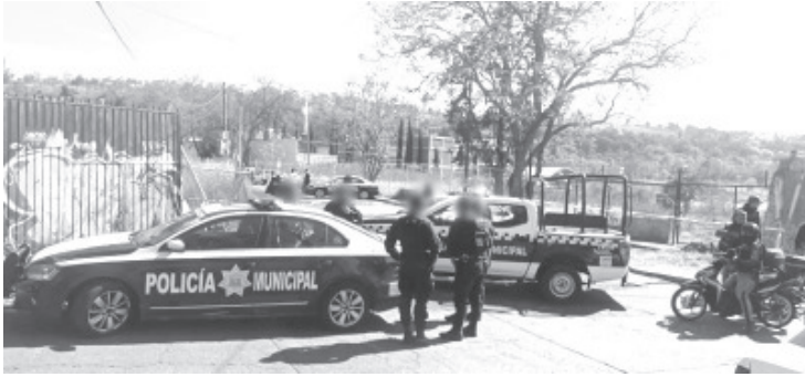
Las víctimas yacían al interior de un Nissan Tsuru, con rótulos de Taxi y placa PMU140A. El hallazgo lo hicieron unas personas e inmediatamente avisaron al número de emergencias 911.

Morelia, Mich.- Lunes 24 de enero de 2022.- Dos hombres sin vida y con impactos de proyectil de arma de fuego fueron encontrados dentro de un vehículo que estaba aparcado en la vía pública de la colonia moreliana Josefa Ortiz de Domínguez.