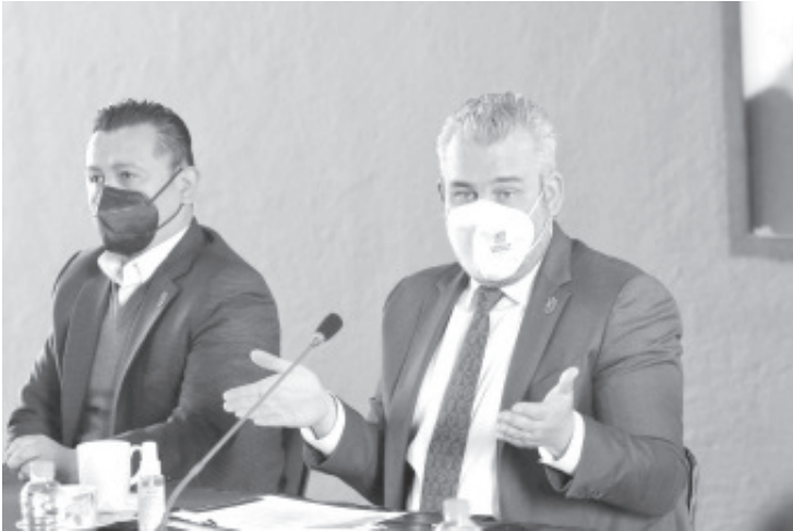
Nosotros nunca hemos propuesto ni solicitado que Michoacán ya no tenga responsabilidad en materia educativa, eso es imposible, la Constitución es muy clara.