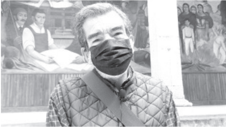
Pidió a los deportistas, tener paciencia, y comprender la situación, no abandonar la actividad deportiva y practicarla desde casa en caso de que se pueda.

- También los horarios se reducen por la mañana