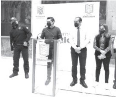
Las multas ya se comenzarán a aplicar y el monto dependerá de la situación de abandono que presenta, así como por el daño que haya ocasionado a la ciudad.

- Espacios del Panteón Municipal en estado de abandono serán reutilizados