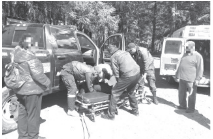
Los oficiales de la División Caminos desplegaron las labores en ayuda a la agraviada, quien se había accidentado al caer de un caballo en el santuario de Sierra Chincua, en Angangueo.

Los elementos de la SSP reiteran su compromiso de velar por el bienestar de las y los michoacanos, ante cualquier emergencia, solicita apoyo a la línea telefónica 911 donde ayudarán oportunamente.