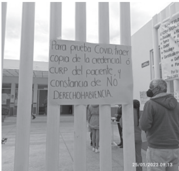
Al día se entregan 40 fichas, solo se cuenta con dos médicos para realizar las acciones. El horario de entrega de fichas es en punto de las 8:00 de la mañana.

En laboratorios particulares que realizan este estudio, el costo supera los 600 pesos.