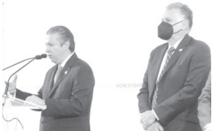
La dependencia estatal dará a conocer el mecanismo de entrega de placas a las personas que ya cumplieron con los trámites y pagos correspondientes.

Finalmente expuso que en el interés de responder a los michoacanos con hechos y de transparentar los recursos públicos, “somos a licitación la manufactura de las placas, con lo que obtuvimos ahorros significativos, sin perder calidad en las láminas y con todas las normas oficiales integradas en las mismas”, explicó.