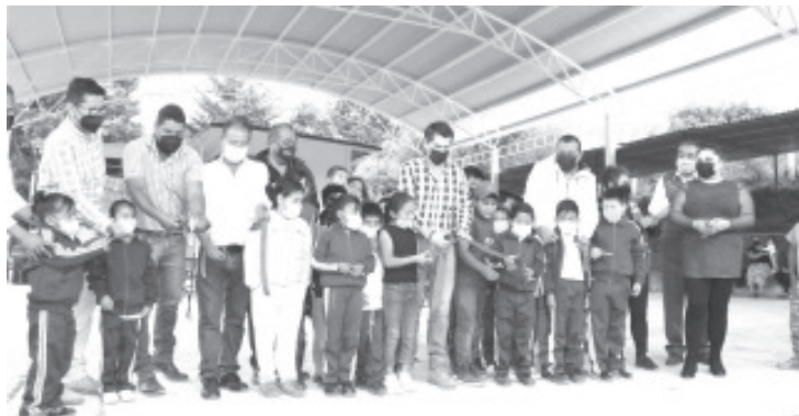
Toño refrendó que el proyecto es convertir a Zitácuaro como referente en materia educativa y alcanzar el primer lugar en inversión a este rubro, dentro del estado.

-También se habilitó una cancha de usos múltiples para beneficio de 300 alumnos de esta comunidad, perteneciente a Aputzio de Juárez.