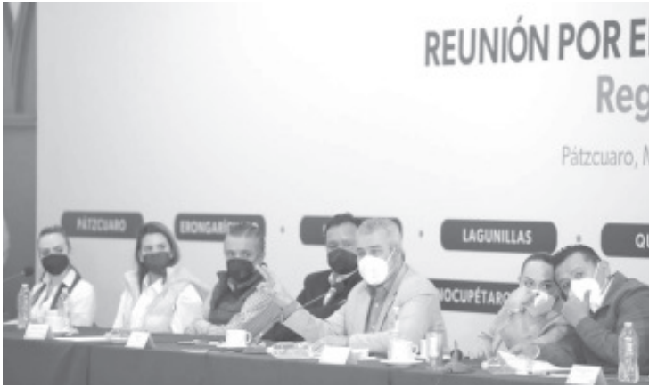
También estamos pensando en eventos que atraigan turismo, como la K'uinchekua, para que poco a poco se vaya consolidando hasta ser una experiencia como es la Guelaguetza en Oaxaca.

-Se destinarán más de mil millones de pesos para obras y acciones en la región