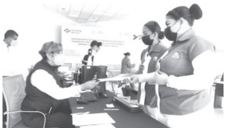
Conalep, logró entregar plazas de servicio social, a la totalidad de egresados de la carrera técnica en Enfermería.

Los egresados, cuya promoción inicia este próximo 1 de febrero del 2022, serán asignados a los Hospitales Generales de la Secretaría de Salud y Clínicas del ISSSTE en las ciudades de La Piedad, Lázaro Cárdenas, Pátzcuaro, Uruapan y Zitácuaro.