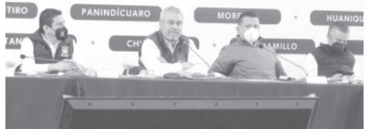
Del Fondo de Aportaciones a Infraestructura Social, las localidades de esta región dispondrán de hasta 299 millones de pesos para atender, prioritariamente, zonas de alta y muy alta marginación.

La Piedad, Michoacán · 21 de enero de 2022