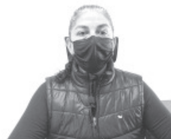
Los costos de cada terapia se mantienen igual que el año pasado, además son simbólicas y solo se cobran para mantener en operación el Centro.