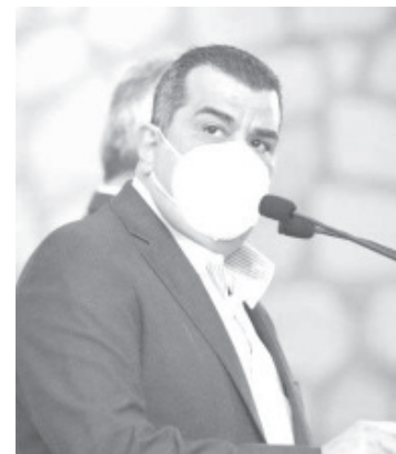
Michoacán registra una tasa de letalidad del 6.15%, y una ocupación hospitalaria del 13%, mientras que a nivel nacional, la media es del 25%.

Con estos indicadores, la Secretaría de Salud exhorta a la población a continuar con las medidas de prevención como el uso de cubrebocas, tanto en espacios abiertos como cerrados, la distancia social de 1.5 metros, el lavado de manos y acudir a vacunarse en las sedes asignadas en su comunidad o municipio.