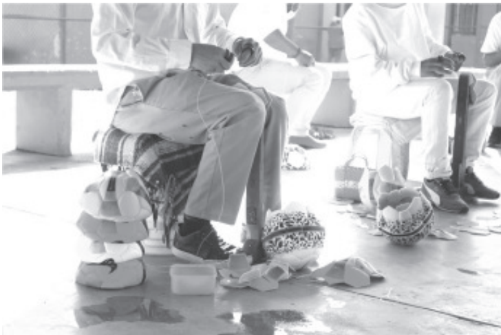
El Sistema Penitenciario mantiene con cinco empresas deportivas, un empleo seguro, a través de la manufacturación de 800 a mil 500 balones semanalmente.