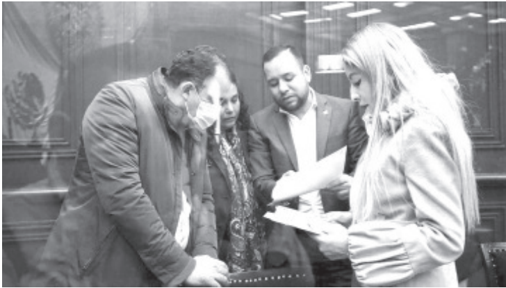
El GPPT acompañará todas las acciones legislativas que se implementen por parte de la federación y el estado que abonen a frenar la nueva ola de contagios de Ómicron.