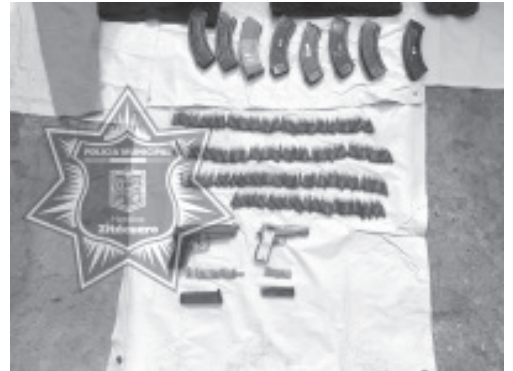
Fueron detenidos cinco sujetos, con armas, cargadores, uniformes y dos vehículos, los cuales fueron puestos a disposición de la autoridad correspondiente.