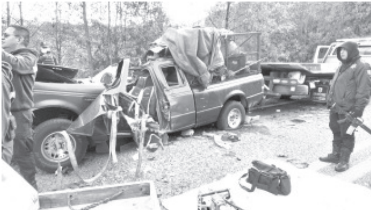
El accidente se registró sobre la autopista Zitácuaro – Toluca, cuando una camioneta Ford Ranger de color azul chocó por alcance contra un camión cargado con rollos de madera.

De lo sucedido tomaron conocimiento agentes de la Policía Municipal, así como los oficiales de Tránsito y Movilidad, quienes efectuaron los correspondientes peritajes, a fin de determinar responsabilidad