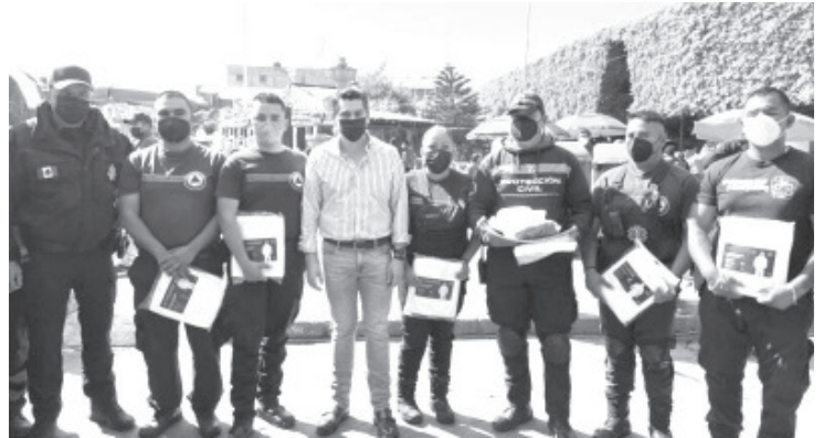
El alcalde @ToñoIxtláhuac donó equipos de protección personal al Cuerpo de Bomberos y Protección Civil de Zitácuaro.

El edil anunció que se sanitizarán todos los mercados, espacios públicos y aquellos hogares donde existan personas infectadas que lo soliciten. Enfatizó que la vacuna ha fortalecido y aminorado la tasa de letalidad; sin embargo, no deben relajarse las medidas, por lo contrario, es inminente adoptar hábitos de salubridad que prevengan la enfermedad