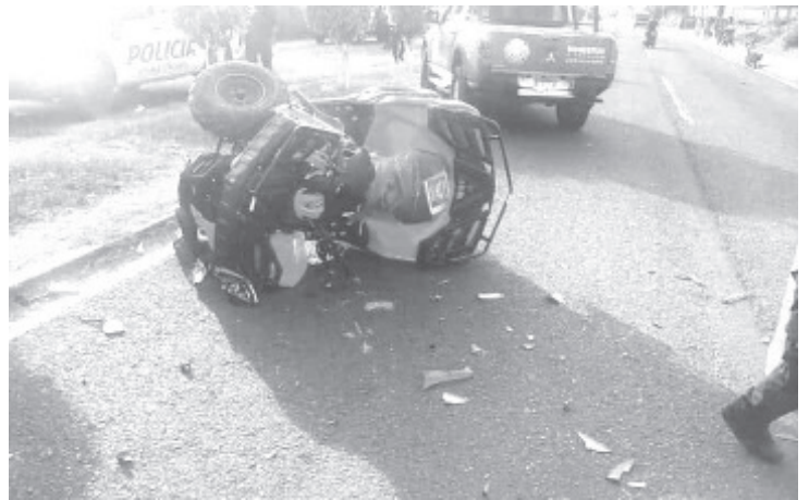
Un menor presentaba traumatismo craneoencefálico más exposición de orbicular lado derecho y otro con traumatismo craneoencefálico grado uno.

Personal de tránsito y vialidad fue notificado del hecho para que se encargara del peritaje y el aseguramiento de las unidades.