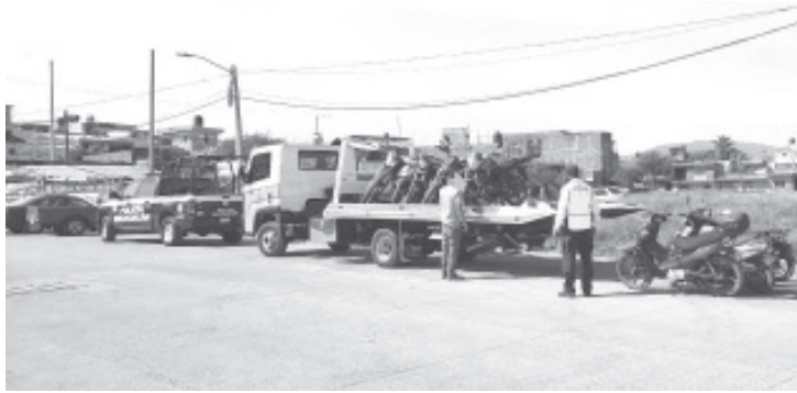
Bailleres Mendoza, desplegó desde el pasado viernes el operativo Relámpago, que permitió incautar el primer día 53 unidades más 28 de este sábado para dar un total de 81 motocicletas.

Con estas acciones, la SSP da pasos fuertes en su tarea de frenar la comisión de conductas delictivas. Las movilizaciones de verificación de automóviles seguirán vigentes en los municipios y todo el territorio estatal, para garantizar el bienestar de las y los michoacanos.