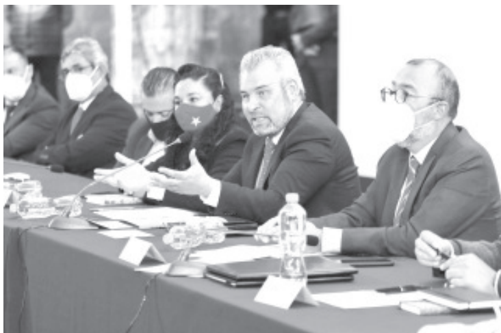
El presupuesto directo es una forma de ejercer el autogobierno y la autonomía indígena, implica que los Ayuntamientos transfieran a las comunidades indígenas recurso proporcional al número de habitantes.

Morelia, Michoacán, 11 de enero del 2022.- El gobernador Alfredo Ramírez Bedolla encabezó la reunión de presentación de protocolo para la transición de comunidades indígenas al autogobierno y ejercicio del presupuesto directo.