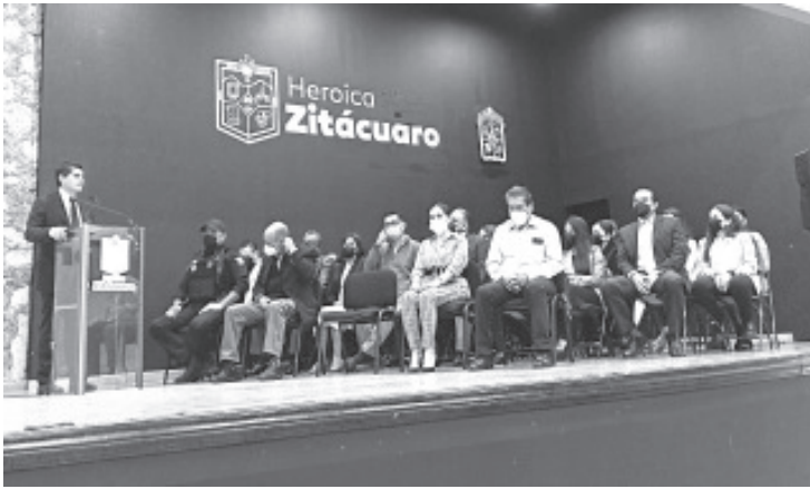
El alcalde invitó a quienes asumen un cargo o son ratificados en el que ya estaban, a no dirigirse según intereses de partidos, sino tener como prioridad al ciudadano.

- La acción es para dar seguimiento a la reestructuración del organigrama