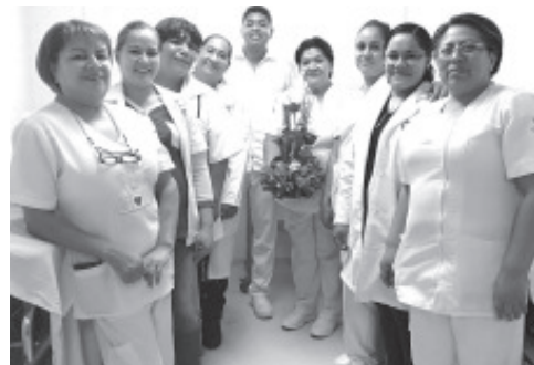
En el DÍA DE LA ENFERMERA Fueron felicitadas Las Enfermeras ISSSTE Por Autoridades de la Institución. ¡FELICIDADES A TODAS!