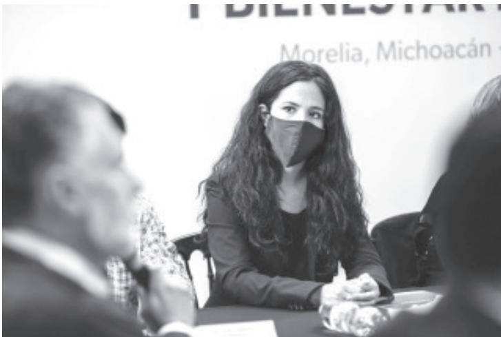
La secretaria de Igualdad Sustantiva y Desarrollo de las Mujeres Michoacanas (Seimujer), anunció que se creará el Fondo para las víctimas indirectas.