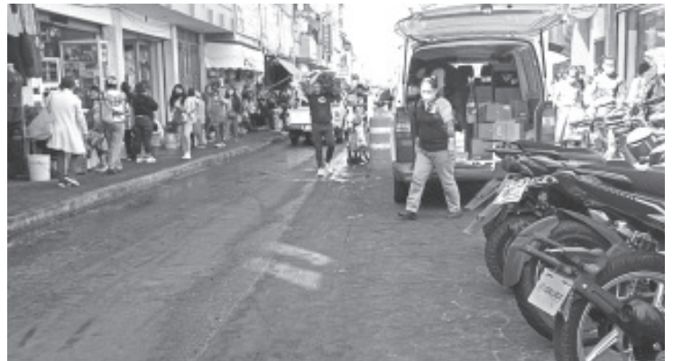
Otras medidas que se van a reforzar es la prohibición de estacionamiento en lugares prohibidos por automovilistas y motociclistas.

Recalcó que en los últimos días se ha visto un crecimiento paulatino en los casos confirmados del virus, ante tal panorama, destacó que es vital que ninguna persona deje de cuidarse, la pandemia no ha pasado y dependerá de todos que se controle.