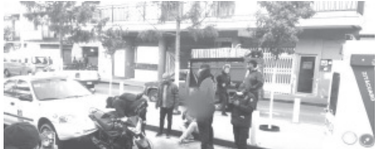
El sitio exacto del siniestro fue la Avenida Revolución Norte entre las calles Hidalgo y Santos Degollado, de la colonia José María Morelos y Pavón.

El chofer del taxi era un hombre de 44 años de edad que se quedó a comparecer con las autoridades en tanto estas definen la cinemática oficial del choque.