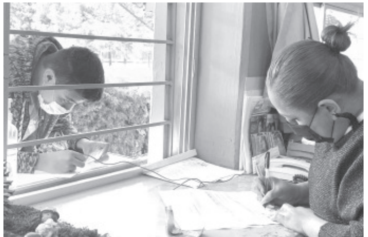
Se estarán impartiendo más de mil cursos referentes a 41 especialidades, mismas que arrancarán el próximo 17 del presente mes y tendrán un duración de cuatro meses.