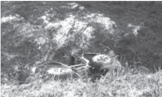
En el lugar conocido como El Culpumpio, donde quedó muerto el clérigo, porque aparentemente perdió el control de su unidad y terminó al fondo un desnivel.

Tancitaro, Mich.- 06 de enero de 2022.- Un sacerdote perdió la vida en un accidente en el que volcó la cuatrimoto que conducía sobre una brecha cerca de la carretera Tancitaro - Condébaro, dentro de la demarcación de Tancitaro.