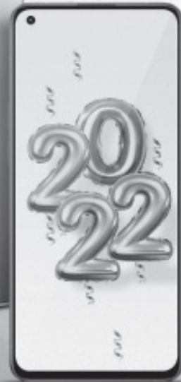
OPPO Reno6 5G