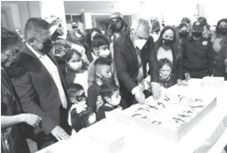
Se entregaron 5 mil juguetes, de los cuales, dos mil se repartieron en Morelia y 3 mil se distribuyeron en las distintas regiones del estado.

Morelia, Michoacán, 6 de enero del 2022.- Con un evento magno por el Día de Reyes, el gobernador Alfredo Ramírez Bedolla y la presidenta honoraria del Sistema DIF Michoacán, Grisel Tello Pimentel, compartieron con hijas e hijos de elementos de la policía estatal, juguetes,