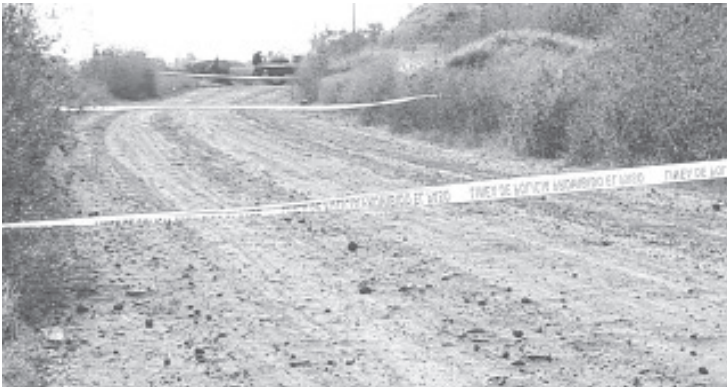
Estaba maniatado y tenía el rostro cubierto con cinta industrial, persona que vestía una playera y pantalón de color negro y un par de botas cafés.

De las correspondientes diligencias se hizo cargo el personal de la Fiscalía General del Estado, cuyos peritos procesaron la escena del crimen y realizaron el levantamiento del cuerpo, mismo que fue trasladado al Semefo de la región, donde permanece en calidad de no identificado.