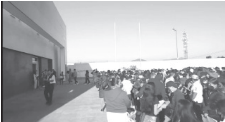
La jornada de vacunación tuvo lugar los días 5 y 6 de enero, con una sola sede: el Centro de Convenciones Suprema Junta Nacional Americana.

Rivera Camacho, agregó que es vital que toda la población este vacunada, se ha demostrado que el biológico evita cuadros graves de Covid-19 e incluso la muerte.