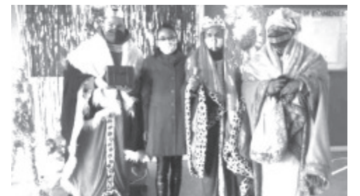
LLEGARON Este 6 DE ENERO AZITÁCUARO LOS SANTOS REYES. MELCHOR, GASPAR Y BALTAZAR Y Entregaron JUGUETES A LOS NIÑOS. ¡FELICIDADES!