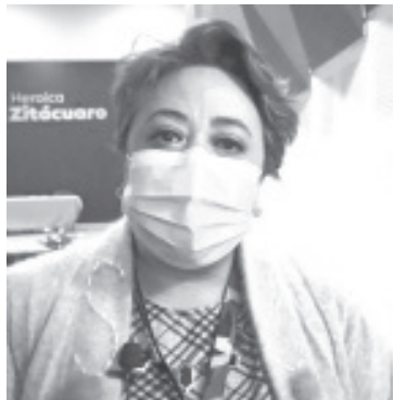
Se intensifican las visitas de supervisión a los establecimientos para vigilar el cumplimiento de las medidas sanitarias.

- Se retoman las visitas de supervisión a los establecimientos para vigilar el cumplimiento de las medidas sanitarias.