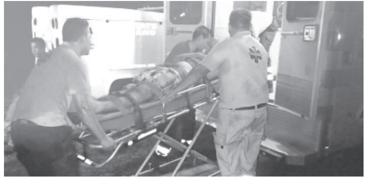
Vecinos reportaron al sistema 911 sobre la localización de hombre sobre la vía pública de colonia del puerto quien presentaba diversas lesiones por ataque de perro.

Al momento no hay reportes del paradero de los canes.