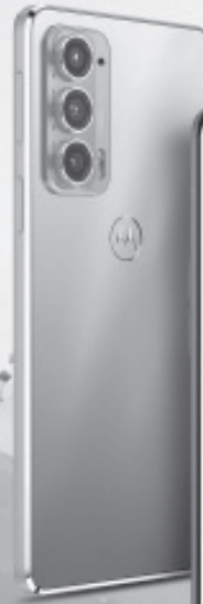
Motorola Edge 20