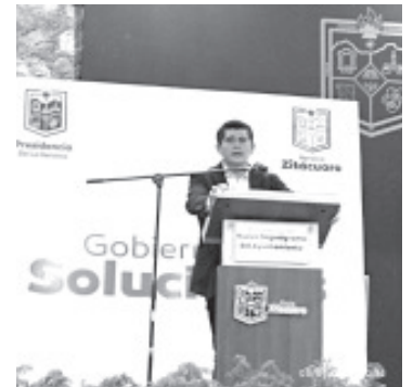
Está reestructuración nace a partir de qué de ha visto un organigrama acotado, saturado en las distintas áreas y responsabilidades, tareas excesivamente centralizadas.

Entre la nueva organización se contemplan dos áreas para los zitacuarenses, como atención ciudadana y participación ciudadana, además una nueva figura que es la del juez cívico. Consideró que en los tiempos actuales es necesario que constantemente haya cambios que estén a la altura de las circunstancias.