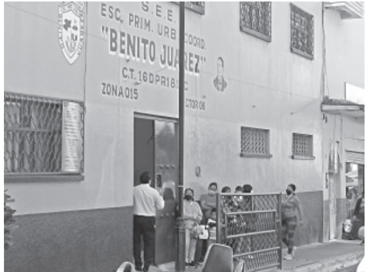
Ante el aumento de contagios y dado el periodo de incubación de la enfermedad, durante la primera semana de enero las clases serán virtuales mediante trabajos y otras tareas.

El inicio de este operativo comenzó en la calle Miguel Carrillo, Avenida Revolución, Cerrito de la Independencia y el Infonavit, donde se organizaron en grupos de trabajo, para limpiar las bancas, barandales de las jardineras, banquetas y los contenedores de basura.