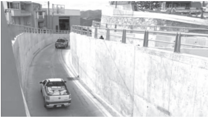
Un accidente se debió precisamente a qué los que vienen del libramiento Samuel Ramos, rumbo al sur, no saben cuál de los dos carriles tomar.

- Es un riesgo para peatones cruzar el tramo de Artillería