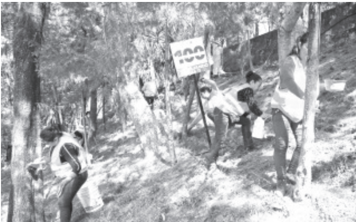
La campaña se efectuará durante todo el año, promoviendo la participación de la población en cuidar y mantener su entorno.