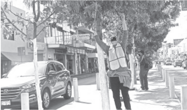
Se pretende dar atención a todos los árboles que se encuentran en el tramo de Miguel Carrillo hasta el monumento a La Bandera.

H. Zitácuaro Michoacán, 03 de enero de 2022.- Por: Guadalupe Solache Rebollo. Para prevenir accidentes en ciclistas que circulan por la ciclo vía de Avenida Revolución, trabajadores de la oficina de Parques y Jardines comenzaron la poda de árboles que se encuentran en este lugar.