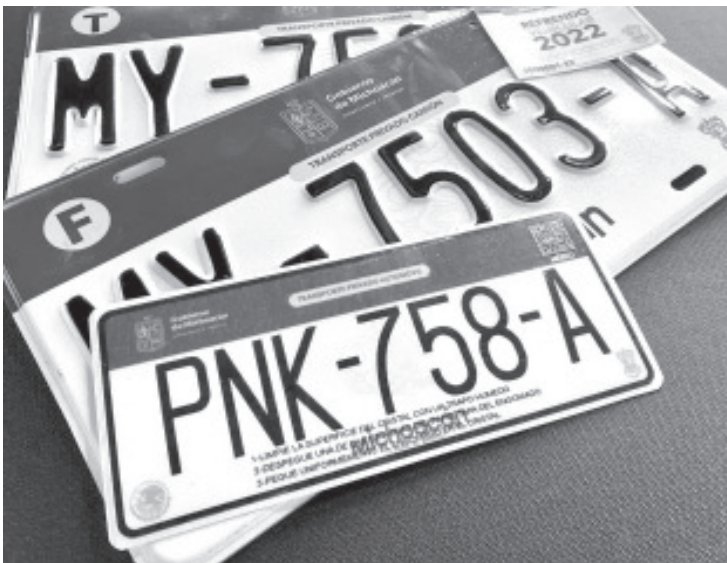
Dentro del proceso de transparencia, el Gobierno de Michoacán sometió a licitación la manufactura de las placas, con un ahorro significativo y sin perder calidad en las láminas.

Destacó que, por primera vez, los ciudadanos podrán acceder, desde su casa, su negocio, oficina o equipo, a una plataforma en la que se registrarán y, en un término de 24 a 48 horas, se les enviará un visto bueno para que efectúen el pago de placas, con lo que evitarán molestias de permanecer formados en los módulos; además de que señaló que podrán recibir en su domicilio las láminas si así lo prefieren, con el respectivo costo de envío.