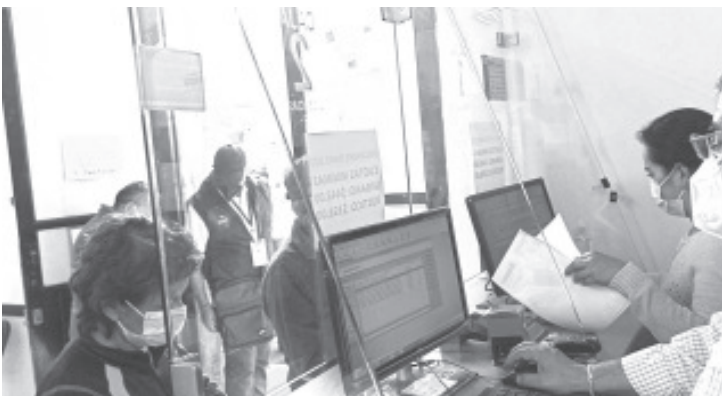
En enero se aplica el 50% de descuento a las personas discapacitadas, jubilados, y pensionados, así como de la tercera edad, siempre y cuando su valor no rebase los 700 pesos.

Recordó que el horario de atención es de 8:00 de la mañana a 6:00 de la tarde en horario corrido, y cualquier caso que requiera atención especial, pueden recurrir personalmente con el director, seguramente hay opción de generar una estrategia de pago para ir al corriente. Por el momento hay 12 cajas habilitadas para el cobro, por lo que el tiempo de espera es breve.