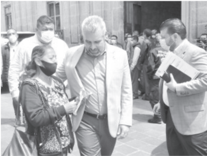
Su administración implementará diversos mecanismos de participación ciudadana para que las michoacanas y michoacanos puedan trabajar de la mano del Gobierno del Estado.

• El Gobierno de Michoacán reestablecerá la colaboración con sectores sociales, pueblos indígenas y ciudadanos, subrayó el gobernador