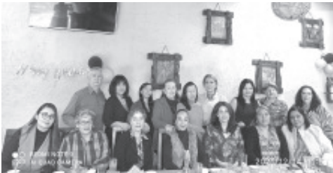
MUJERES EMPRESARIALES DE ZITÁCUARO Celebran con un desayuno las fiestas navideñas y próspero Año Nuevo 2022. Descendándose todas una ¡FELIZ NAVIDAD 2021!.