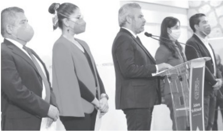
El mandatario informó que se se hizo el compromiso de destinar 140 millones de pesos en 2022 para ampliar el número de beneficiarios con discapacidad en Michoacán.

Morelia, Michoacán, 20 de diciembre del 2021.- El gobernador Alfredo Ramírez Bedolla acordó con el presidente Andrés Manuel López Obrador extender la pensión universal a michoacanos y michoacanas con algún tipo de discapacidad que tengan de 30 a 64 años de edad.