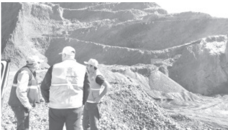
La exploración, extracción, aprovechamiento y procesamiento de minerales de competencia estatal son actividades sujetas a la valuación de impacto ambiental.

En este sentido, destacó la buena disposición de los propietarios por buscar la regularización de sus actividades, ya que la extracción de material pétreo una actividad fundamental para el desarrollo de infraestructura urbana de una región y por ende debe ser parte de un desarrollo sostenido, por lo que puntualizó que a través de procedimientos administrativos de inspección y vigilancia se garantizará que la operación de los bancos de materiales pétreos se lleve a cabo dentro del marco legal ambiental procurando la protección al ambiente.