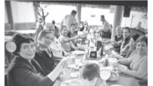
Se reunieron Trabajadores de la Clínica del ISSSTE Para felicitarse y celebrar con una comida las fiestas navideñas y desearse un ¡FELIZ AÑO NUEVO 2022!.