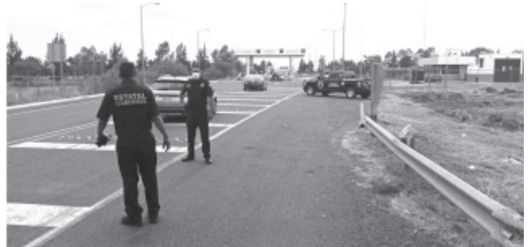
Los elementos mantienen los patrullajes en las brechas, las carreteras y varias localidades de los municipios de la Región Morelia en los que hay ductos de Pemex.

La SSP pone a disposición de las y los michoacanos, las 24 horas del día, las líneas telefónicas 911 y 089, a fin de brindar apoyo a la gente de manera inmediata ante alguna emergencia y reitera su compromiso de garantizar la tranquilidad de la ciudadanía.