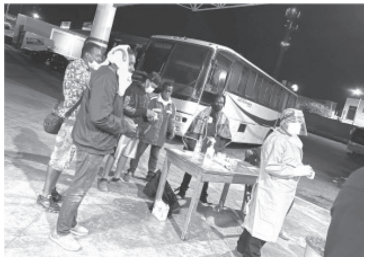
De la mano de la Secretaría de Gobierno y Protección Civil se les han otorgado cobijas, alimento y pruebas para detectar Covid, pues algunos migrantes presentaban cuadros de resfriado.

Además, recordó que la instrucción puntual del gobernador Alfredo Ramírez Bedolla ha sido la de atender tanto a los 4 millones de migrantes michoacanos que viven en Estados Unidos, como a las migraciones internas, apegándose al respeto de los derechos humanos y las garantías individuales.