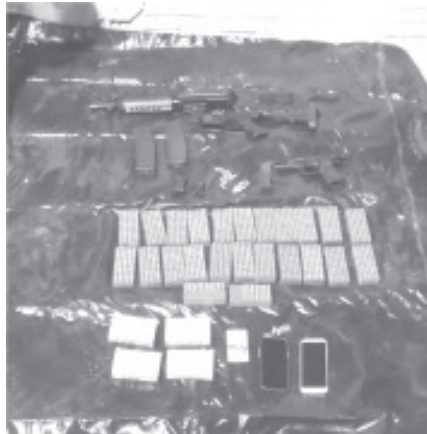
Dentro de un auto fueron encontrados un fusil y una pistola, dos cargadores, seis casquillos percutidos, dos miras, así como diversas cajas que contenían mil 253 cartuchos útiles.

La SSP mantiene acciones en favor de la sociedad michoacana para garantizar su bienestar y seguridad. Ante todo hecho delictivo se exhorta a la población a reportar a las líneas telefónicas de emergencias 911 y 089.