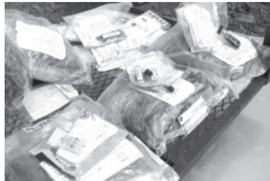
Del total de narcóticos, 17 kilogramos corresponden a marihuana y 800 gramos a metanfetaminas, el resto, a sustancias como cocaína, heroína, dimetрил triptamina y metilendioximetanfetamina.

Morelia, Michoacán, a 17 de diciembre de 2021.- Con el objetivo de generar certeza en la ciudadanía en la investigación y persecución de delitos que atentan contra la salud, la Fiscalía General del Estado de Michoacán (FGE) realizó la quema de 18 kilogramos de narcóticos, que fueron asegurados en distintas acciones operativas realizadas en la Región Morelia.