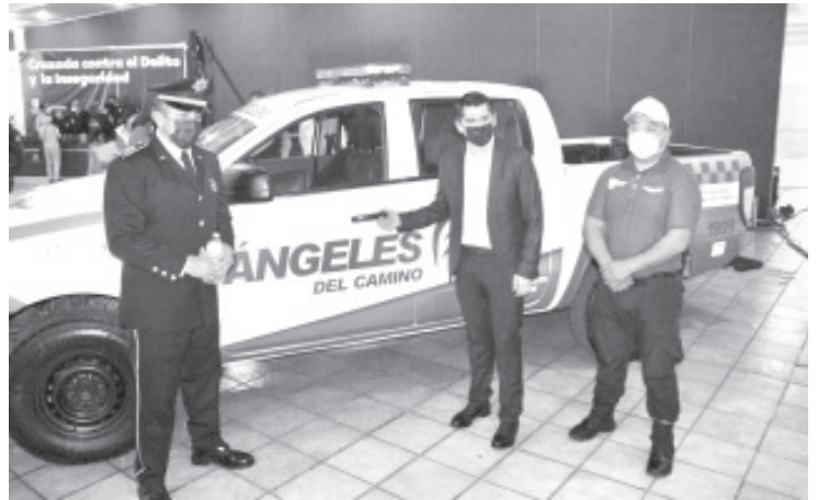
Los Ángeles del Camino, habrán de coadyuvar en la seguridad de los turistas que visitan el municipio, siendo el primero en el estado en presentar un programa de este tipo.

Durante el encuentro, informaron a los asistentes que en enero se presentará el primer escenario de lo que será la distritación, este vendrá siendo una propuesta, luego se someterá a las comunidades indígenas para que hagan sus observaciones, posteriormente se les hará una consulta para atender sus opiniones, luego se presentará un segundo escenario y quizá el definitivo; éste dirá cómo será la distribución de distritos locales y federales para que haya el equilibrio esperado.