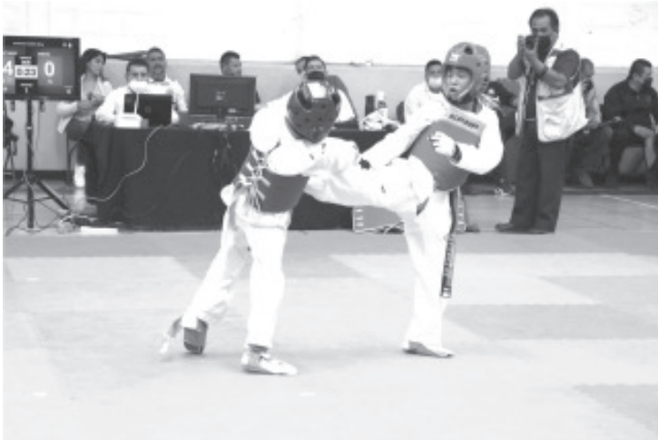
De acuerdo a la Unión Michoacana de Taekwondo, en este primer selectivo se dan cita un total de 255 artemarcialistas en la modalidad de combate, mientras en formas, son 45 exponentes.

Participan 300 atletas en el primer selectivo del 20 al 22 de diciembre