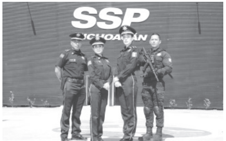
Los primeros días de enero del 2022 se darán a conocer las bases y los requisitos a través de los canales oficiales de comunicación de esta dependencia, para el registro del proceso de selección.

Para la SSP contar con agentes policiales con la capacidad de reacción necesaria para salvaguardar la paz en todo el territorio estatal, es un eje fundamental en la estrategia de seguridad, por ello, a través de la convocatoria de reclutamiento 2022 se buscará incrementar el estado de fuerza con sentido humano y estándares de calidad formativa de alto nivel.