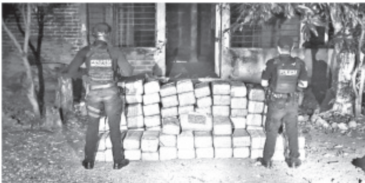
A las afueras de una casa en "obra negra" los elementos encontraron varios paquetes envueltos en cinta canela, que contenían hierba verde y seca, con las características propias de la marihuana.

La SSP mantiene activas las labores operativas en todo el territorio estatal y pone a disposición de la ciudadanía los números telefónicos de emergencias 911 y 089 para denunciar cualquier ilícito que altere la estabilidad social.