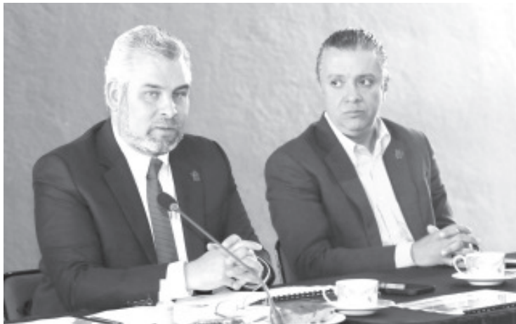
El gobierno digital ofrecerá, en una primera fase, citas en línea y la generación de folios para agendar los servicios a las y los ciudadanos.

Morelia, Michoacán, 15 de diciembre del 2021.- A partir del 2022 con la nueva Ley de Gobierno Digital, los diferentes órganos del Estado implementarán el uso y aprovechamiento de tecnologías de la información para la simplificación, eficacia y eficiencia de los servicios y trámites que se generan a la ciudadanía, afirmó el gobernador Alfredo Ramírez Bedolla.