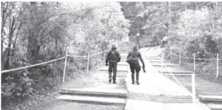
Los agentes mantienen presencia a través de patrullajes en zonas aledañas y comerciales a fin de proporcionar apoyo ante cualquier emergencia o incidente.

La SSP reitera su compromiso de trabajar por preservar la paz y garantizar con ello la seguridad de la población, por lo que exhortan a denunciar cualquier acto ilícito que vulnere la tranquilidad social y ambiental a los números telefónicos de emergencias 911 y 089.