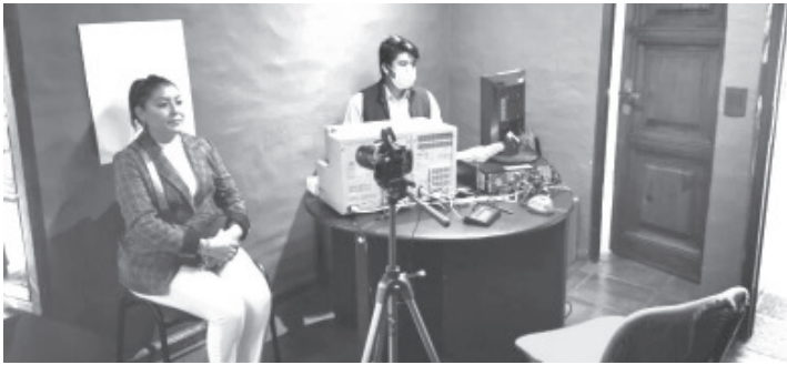
El trámite de licencias permanentes continuará vigente hasta el 31 de diciembre de este año, lo cual es una oportunidad para solicitarla en los módulos correspondientes.

El horario de atención a la ciudadanía es de 9:00 de la mañana a 16:00 horas.