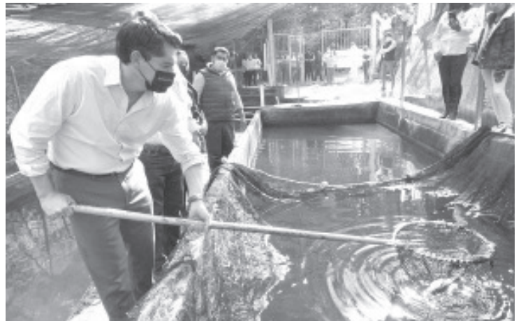
Toño dijo que se proyecta la organización de una importante Feria Regional, donde se exponga y oferte la riqueza y variedad de este platillo.

“Este sector agroalimentario, cuenta con todo el respaldo de nuestro #GobiernoDeSoluciones”, subrayó Toño Ixtláhuac. Durante la reunión, el alcalde entregó Certificados de Buenas Prácticas Acuícolas, como parte del cumplimiento de los óptimos estándares en el manejo sustentable de dicha actividad.