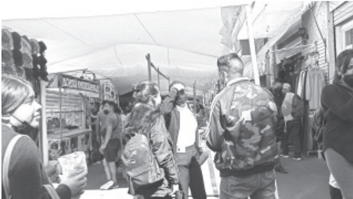
El problema radica en que no se acatan las medidas sanitarias como han recomendado las autoridades de salud, entre ellas la sana distancia, el uso obligatorio y correcto del cubrebocas.

- Imposible mantener la sana distancia y cumplir con medidas sanitarias