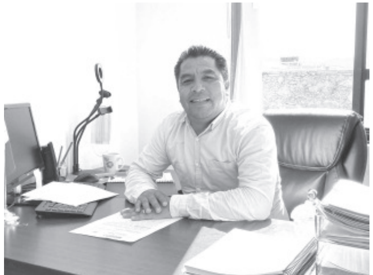
De enero a septiembre nuestros connacionales han enviado remesas por más de 85 millones de dólares, lo que se traduce en más de mil ochocientos millones de pesos.