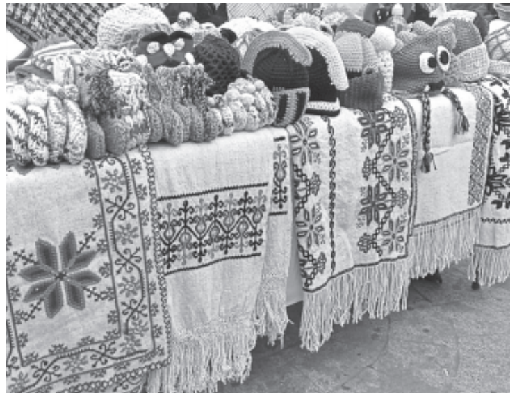
La dirigente invitó a visitantes a acudir al centro de la ciudad y conocer la variedad de artículos que están a la venta; hay muchas esperanzas en que sea una buena temporada para ellos.

Entre los artículos que están a la venta, tienen productos de ocoshal, juguetes de madera, alfarería de San Felipe los Alzati y de San Juan, dulces tradicionales, prendas de lana, vinos de frutas, joyería, medicina tradicional, entre otros mas.