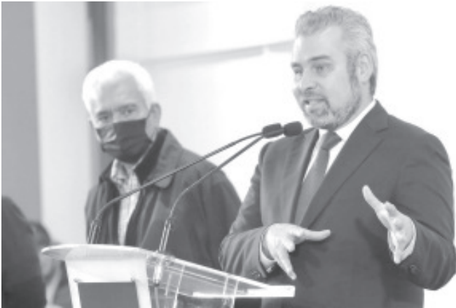
Para Sader se estiman 630 millones de pesos que se busca incrementar a 810 millones de pesos con la participación de la federación, municipios y beneficiarios.

En ese sentido, detalló que se impulsarán programas como AgroSano con 132 millones de pesos, mejoramiento genético de maíces criollos con 5 millones de pesos, así como 6 millones en producción de semilla, 166 millones para entrega de fertilizante a mitad de precio, 1.9 millones para la construcción de 113 biodigestores, 1.5 millones para módulos de producción de alimentos y 6 millones para un sistema silvopastoril y forraje verde hidropónico.