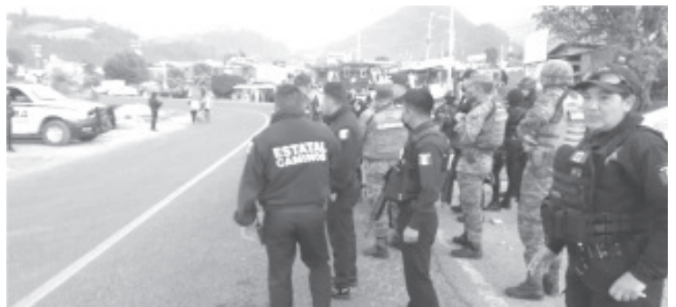
Elementos estatales y federales, brindaron apoyo a los policías municipales heridos con arma blanca por agresores en la localidad Macho de Agua y fueron trasladados al Hospital Regional.

Al momento se continúa con los patrullajes en la zona y se refuerza la movilización policial de los tres ordenes de gobierno, además se realizan labores de proximidad social para tranquilizar a los ciudadanos y dar certeza de seguridad.