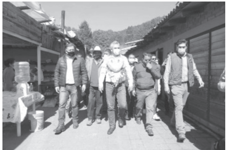
"Se respaldará, se impulsará y promoverá que se visiten los santuarios Rosario, Senguio y Sierra Chincua, con responsabilidad", expuso el mandatario.

Agregó que será necesario ponerse a trabajar de inmediato con cada uno de los contribuyentes, para ver cuánto se pagaba y con la modificación de la ley, cuando se pagará.