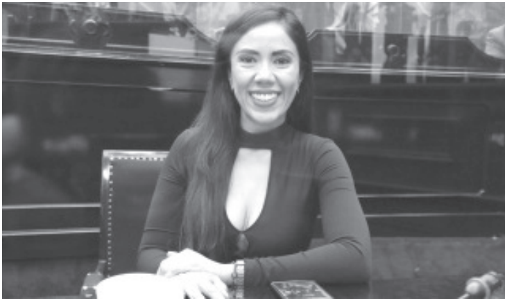
Llevamos ya dos meses de caos absoluto, en donde las movilizaciones, la toma de calles, los excesos que se esconden bajo la máscara del derecho a la manifestación, son la constante.

Apuntó que es urgente que el Gobierno Estatal asuma sus responsabilidades, que opere con las herramientas que le confiere la Ley, y que garantice la gobernabilidad, pues las y los michoacanos no pueden seguir pagando el costo de la incompetencia y el desinterés de sus autoridades para atender las problemáticas que se le presentan.