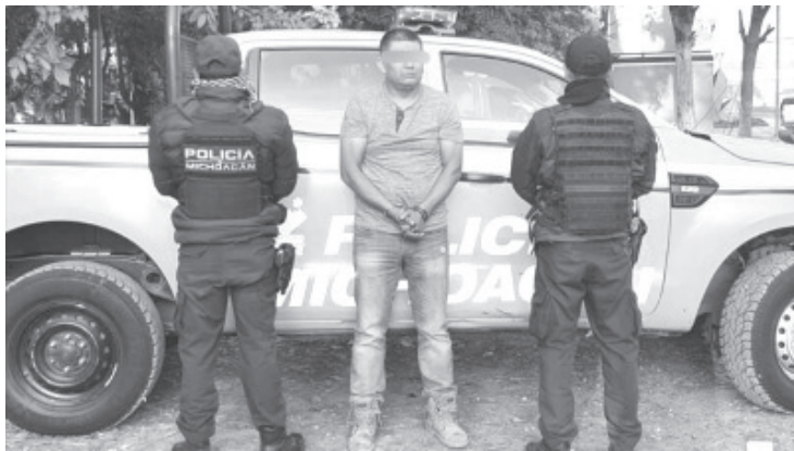
Elementos de la Secretaría de Seguridad Pública Municipal aseguraron a un sujeto, señalado por golpear a su pareja en la Colonia Poetas.

Con ello, la Secretaría de la Policía Municipal reitera su compromiso e intolerancia a la violencia en contra de las mujeres y demás personas desprotegidas.