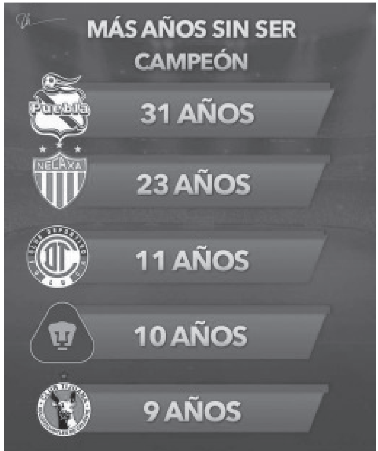
Tabla de equipos de futbol

Con el título conseguido por el Atlas, ahora estos son los equipos de la Liga MX que más tiempo tienen sin ser campeón de liga.