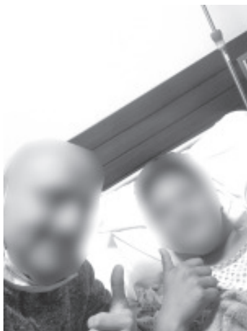
Se logró dar atención de primeros auxilios telefónicos que permitieron salvar la vida de una persona del sexo masculino de 17 años de edad.

Morelia, Michoacán, a 11 de diciembre del 2021.- Gracias a la atención oportuna y las constantes capacitaciones del personal de la Secretaría de Seguridad Pública (SSP) que atiende los números de emergencias, se logró dar atención de primeros auxilios telefónicos