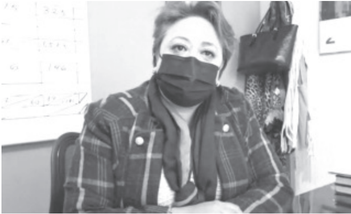
Reflexionó, que durante esta etapa del año, al municipio vienen muchos visitantes de otros estados e incluso del extranjero; regresan a casa aquellos que salieron para irse a trabajar.

- Exhorta COEPRIS a la población a no relajar las medidas sanitarias