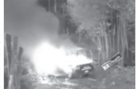
Elementos estatales y federales, brindaron apoyo a los policías municipales, heridos con arma blanca por agresores en Macho de Agua y fueron trasladados al Hospital Regional.

•Intervienen SSP, GN, Sedena, FGE y Seguridad Municipal, ayuntamiento informa que hay dos detenidos. •Se brindó apoyo para el traslado de seis policías municipales heridos al Hospital Regional.