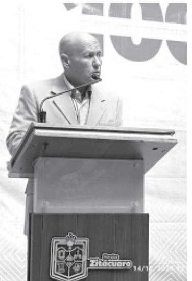
Los elementos fueron golpeados con piedras y palos, dos unidades fueron incendiadas y como resultado se tuvo 6 policías lesionados.

destacó que la Policía Municipal continuará realizando los recorridos de vigilancia en esa zona, esto será con apoyo de otras corporaciones policiacas como