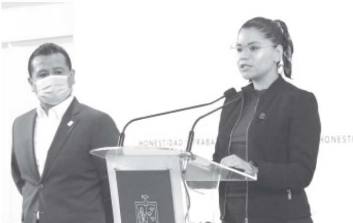
El reemplacamiento, va a contribuir a que el Gobierno tenga capacidad para apoyar los programas a personas con discapacidad mayores de 30 años, y pensión para familias que tienen a niñas o niños con cáncer.

particularidad de que es un reemplacamiento con causa; es decir, al cambiar su matrícula vehicular, las y los ciudadanos apoyan a otras personas que necesitan de nuestro respaldo, concluyó la secretaria del Bienestar.