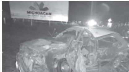
En el auto VW tipo Golf, quedó prensado su conductor de 36 años, sin vida, otro herido de 18 años, presentaba traumatismo craneoencefálico y otro joven sufrió mutilación de la lengua.

El hecho se notificó al personal de la Fiscalía General del Estado que realizaron el peritaje correspondiente y solicitaron a bomberos que con equipo hidráulico sacaran el cuerpo para su traslado a la morgue para la práctica de la necropsia de ley.