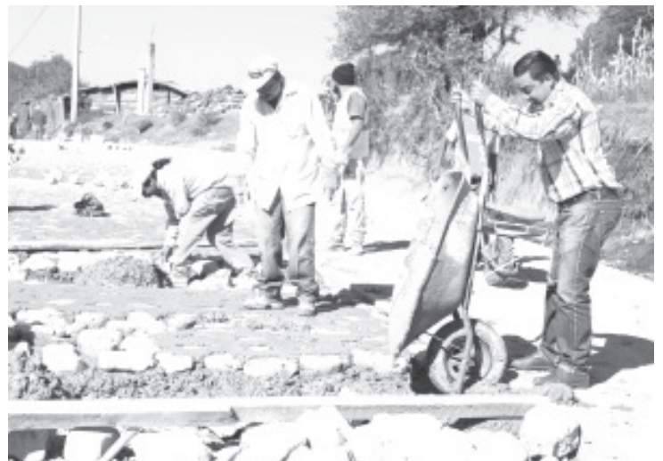
Las obras del Rincón de San Luis, Las Palmas, El Asoleadero, Rancho Escondido y Ocampo; fueron algunas de los lugares donde existen obras en proceso, supervisadas por el edil.

En las localidades de Las Palmas y Rincón de San Luis —señaló el edil— se lleva un avance de más del 80%, esto gracias a las personas de las localidades, a las cuales se les ha generado trabajo temporal.