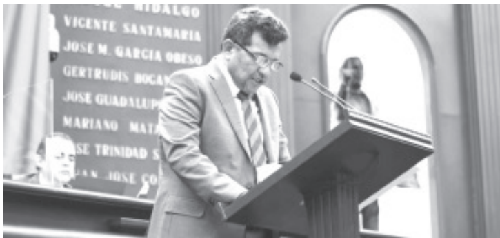
Se pretende la inclusión de al menos el 5 % de la plantilla laboral en las instituciones públicas esté compuesta por personas con discapacidad.

Cabe mencionar, en Michoacán un total de 826 mil 874 personas corresponden a la población con discapacidad, mismas que se verán beneficiadas con la aprobación de este decreto, garantizando su inclusión en el mundo laboral y siendo parte de la transformación de nuestro estado.