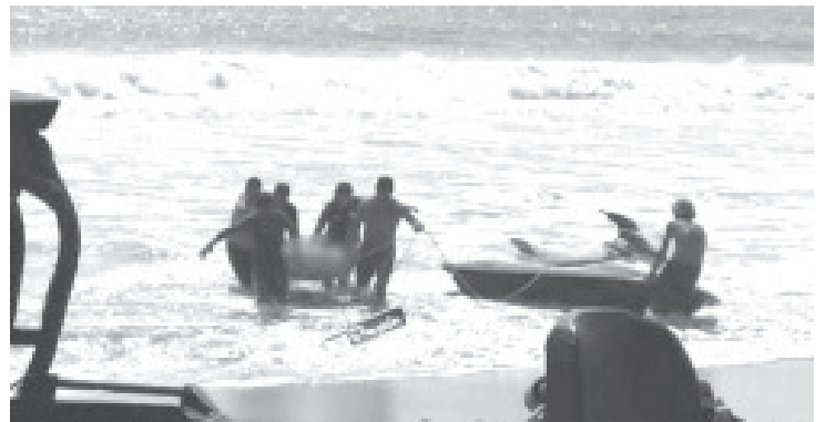
Tras 6 días de trabajos coordinados con la @SEMAR_mx, Autoridades Municipales, Corporaciones de Auxilio y Cuerpos de Salvavidas, se logró la localización del cuerpo de la menor de 8 años.

Al respecto la Coordinación Estatal de Protección Civil Michoacán informó mediante su cuenta oficial de Twitter que “Tras 6 días de trabajos coordinados con la @SEMAR_mx, Autoridades Municipales, Corporaciones de Auxilio y Cuerpos de Salvavidas de las Enramadas de la Región, se logró la localización de la menor de 8 años reportada como desaparecida en la Enramada Los Arrecifes”.