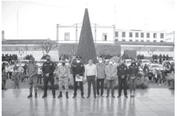
Zitácuaro es el primer municipio en Michoacán, en incrementar significativamente, el parque vehicular de la Policía, para brindar mayor cobertura en todas las comunidades y colonias.