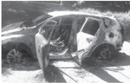
Delincuentes le prendieron fuego a un vehículo, al revisar la unidad motriz la policía localizó en la parte trasera los cuerpos calcinados de tres personas.

Ario de Rosales, Mich.- 08 de diciembre de 2021.- La tarde de este miércoles, delincuentes le prendieron fuego a un vehículo en una brecha del municipio de Ario de Rosales, al revisar la unidad motriz la policía localizó en la parte trasera los cuerpos calcinados de tres personas.