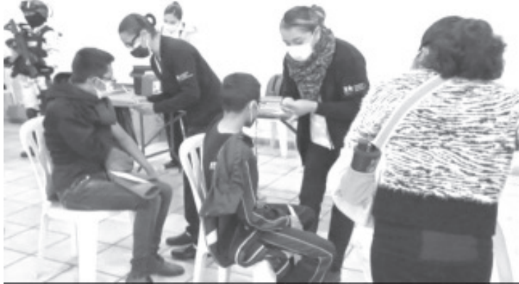
El día 6 la vacuna estuvo destinada para jóvenes de la zona urbana, el 7 para los de las tenencias y comunidades y finalmente el 8 para quienes no alcanzaron los primeros dos días.