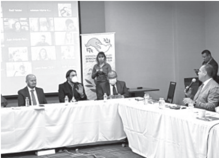
El Manual permitirá a las y los servidores públicos, brindar una atención con enfoque de inclusión y de derechos humanos, en igualdad de oportunidades y sin discriminación.

La Comisión Estatal de los Derechos Humanos (CEDH) en Michoacán, para la Atención de las Personas con Discapacidad, como una contribución para promover, proteger y garantizar el pleno