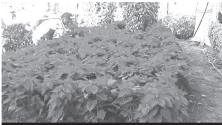
Con esta imagen, se pretende despertar el sentimiento navideño, así como promover la alegría entre la población y se invita a todos a cuidar las flores.

Asimismo desaparecieron alrededor de 150 plantas de nochebuenas, no se sabe quién fue ni con que fin lo hicieron. En este sentido, recalcó que es vital que entre todos se cuide la buena imagen de la ciudad, pues durante este periodo del año es común que vengan muchos visitantes, asimismo zitacuarenses que salen a trabajaren otras ciudades, vuelven para pasar las fiestas navideñas con sus familiares.