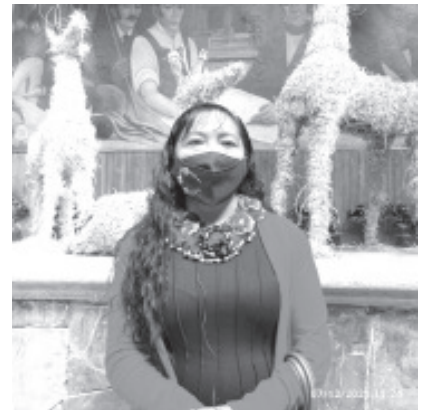
Hay varias dependencias destinadas a brindar acompañamiento a las mujeres para que salga de ese círculo de violencia, se les ayuda hasta donde ellas lo permiten.

Al igual que otras oficinas, nosotros estamos para ayudar, cualquiera que sea el problema no se deben desanimar, para todo existe una solución, dijo.