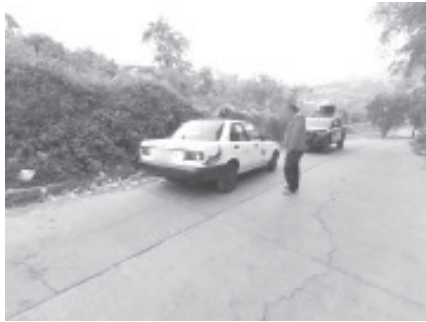
El taxi estaba desvalijado, no contaba con el radio, carátula y bocinas traseras, horas antes dos sujetos habían abordado al chofer y lo despojaron del vehículo.