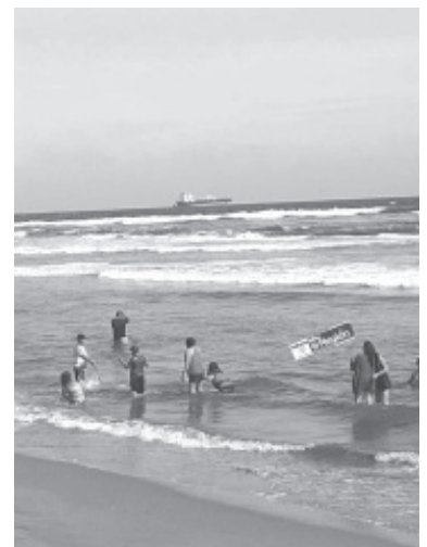
Un menor alertó a sus familiares, que sus dos hermanos habían desaparecido en mar abierto, de inmediato se inició la búsqueda, encontrando solo al niño.

Por lo anterior, se solicitó la intervención de la Fiscalía General del Estado para efectuar las diligencias de ley, mientras que el operativo de búsqueda de la pequeña continúa en la zona, de manera coordinada entre las autoridades, lugareños y familiares.