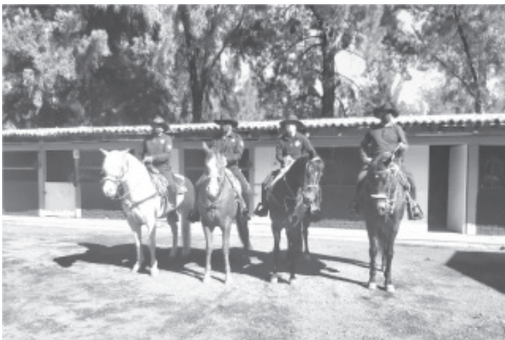
Los binomios de la Policía Michoacán efectúan tareas de vigilancia en las diferentes tenencias de Morelia, con la finalidad de abarcar espacios públicos, brechas y caminos.

La SSP continúa con el despliegue policial en toda la entidad para garantizar el bienestar de la sociedad. De igual manera se pone al servicio de la población las líneas de emergencias 911 y 089 para reportar cualquier hecho delictuoso.