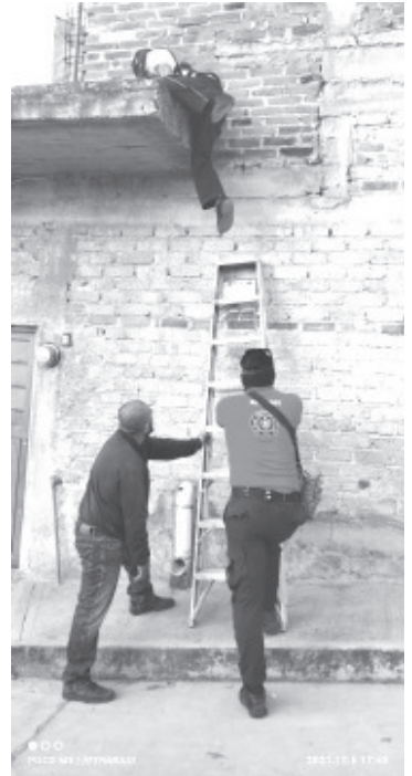
Al ingresar al domicilio los rescatistas encontraron a un masculino de 95 años de edad que se encontraba sobre el piso de su cuarto en posición decúbito dorsal y maloliente.

Al momento se desconoce cuáles fueron las causas del deceso, pero se espera que los estudios forenses lo determinen.