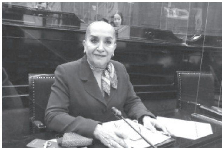
Recordó que en nuestro Estado casi la mitad de las y los michoacanos están en pobreza, el porcentaje en 2020 fue de 44.5 por ciento, es decir, 2 millones 133 mil michoacanos están en esa situación.