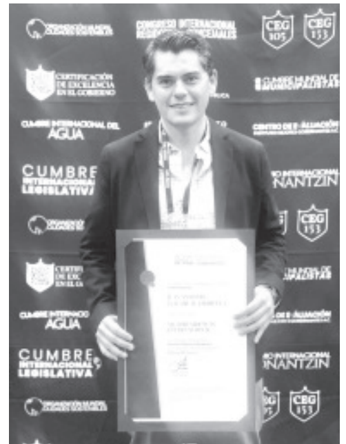
El presidente zitacuareño señaló que la distinción lo convoca a cumplir el compromiso de brindar soluciones a las y los zitacuarenses en sus demandas más apremiantes.

brindar soluciones a las y los zitacuarenses en sus demandas más apremiantes. Aseguró que redoblará esfuerzos para lograr que haya progreso y bienestar en el municipio. Agradeció a los integrantes del Instituto por esta condecoración.