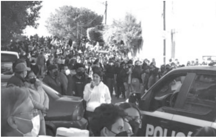
Para esta jornada se destinaron los días 6, 7 y 8 de diciembre con una sola sede, el Centro de Convenciones Suprema Junta Nacional Americana.

- Filas en el exterior y en el interior casi vacío