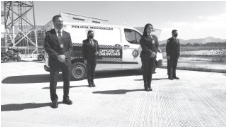
A través de la denuncia abatimos la impunidad y la cifra negra, por ello es tan importante para nosotros impulsar y fomentar en los ciudadanos la cultura de denunciar los hechos ilícitos.

A través de las líneas de emergencias 911 y 089, la población pueden pedir auxilio ante un delito y solicitar a la División Especializada en Investigación y Denuncias que acuda al lugar para realizar el trámite de su querrela.