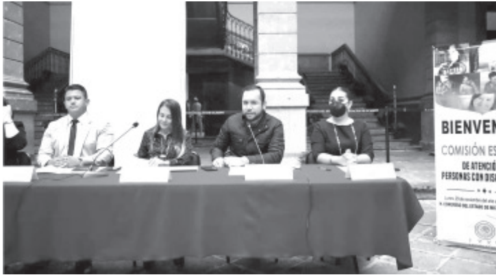
“Se impulsarán acciones a favor de las personas discapacitadas y que lo que se encuentra en el marco administrativo, se traslade a una obligatoriedad en el marco de la Ley”.

Participó en la instalación de la Comisión Especial de Atención a Personas con Discapacidad