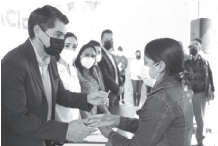
El alcalde explicó que el objetivo de este esquema es combatir la deserción escolar, contribuyendo con las familias en el traslado de quienes estudian fuera de Zitácuaro.