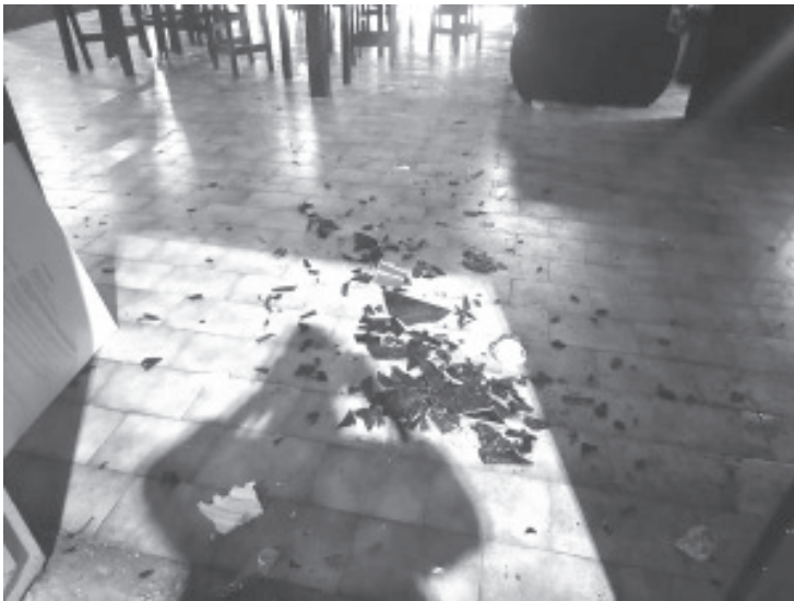
En el bar Alebrije, cuatro personas, tres hombres y una mujer, ocasionaron daños materiales y fueron detenidos.

Por lo que los detenidos son trasladados a la Fiscalía para ser puestos disposición del Ministerio Público en turno.