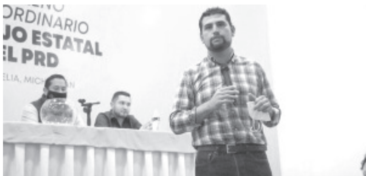
El PRD hoy sale unido, fortalecido, sale fuerte y con toda la claridad de ir a construir un gran partido rumbo al 2024.