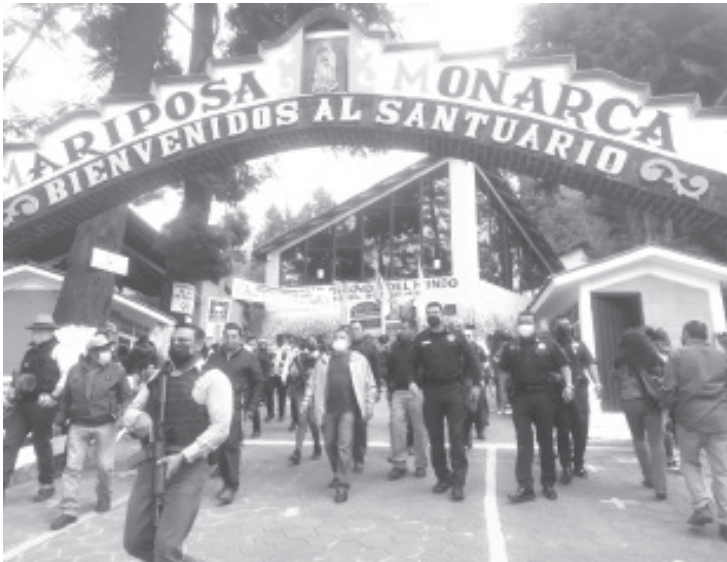
"Queremos que los visitantes se sientan tranquilos, ese es nuestro objetivo, que vean la presencia continua de nuestros elementos, una Policía cercana a la gente, que les brinde confianza".