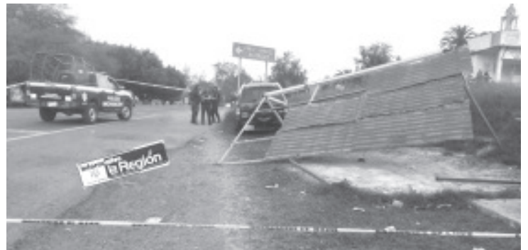
El cuerpo quedó en el asiento del conductor de una camioneta Suzuki de color gris oscuro, que presentaba múltiples impactos de proyectil de arma de fuego en la puerta delantera izquierda.

El área fue acordonada por los uniformados y mas tarde el personal de la Unidad de Servicios Periciales y Escena del Crimen se encargó de emprender una minuciosa recolección de indicios y de testimonios para iniciar la correspondiente carpeta de investigación. Siendo ignorado el probable móvil del asesinato.