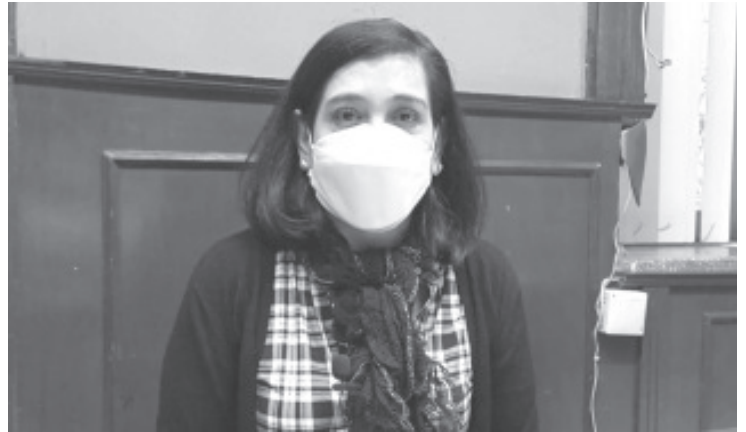
Desde hace cinco años nos habían prometido que se iba a construir un hospital de segundo nivel, pero todo indica que ya es un hecho que los trabajos van a arrancar este mismo año”