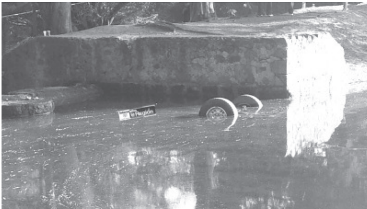
En la Presa Brokman, en los límites de Tlalpujahua y estado de México, volcó una camioneta dentro del automotor fueron hallados los cuerpos sin vida de dos hombres y una mujer.

Mas tarde, agentes y peritos de la Fiscalía General del Estado acudieron al área de intervención, para emprender las actuaciones de ley, dando por iniciada la correspondiente carpeta de investigación.