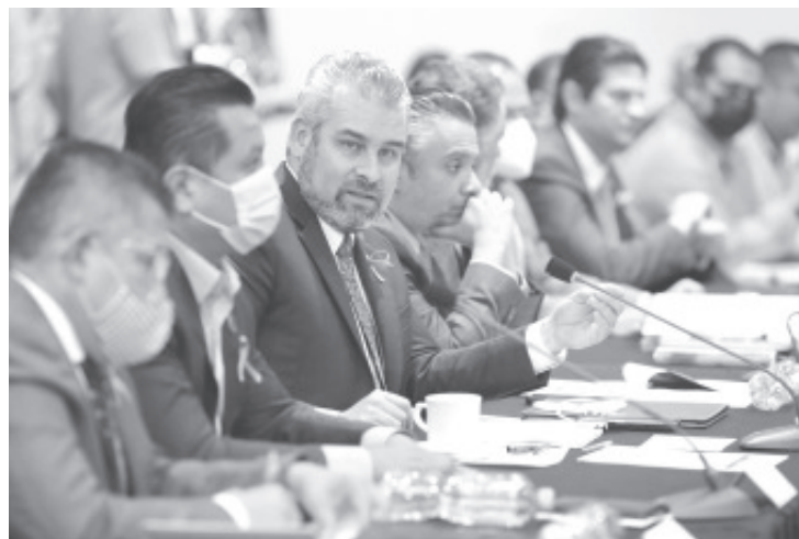
Este programa contempla un fondo por mil 200 millones de pesos, lo que representa un incremento de 557 millones para obra pública respecto a lo autorizado para 2021.

El mandatario detalló que, del total de recursos contemplados para ese programa, 300 millones de pesos los aportaría la federación y cantidades iguales el estado, los municipios y los