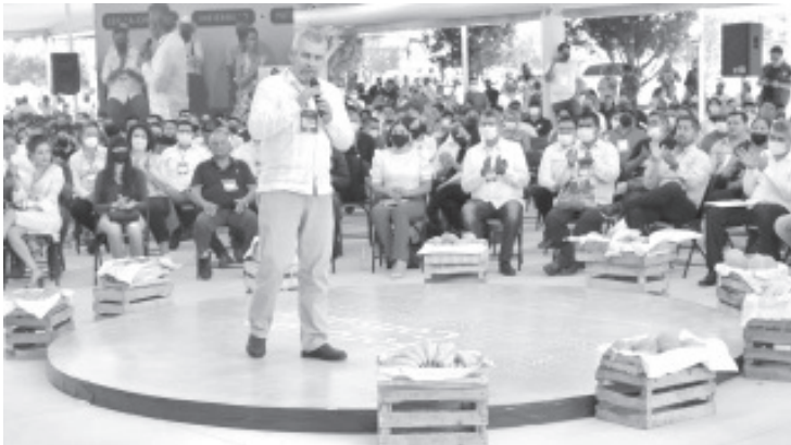
"Se debe apoyar la inversión y a los productores y consumir local, comercializar a corta distancia y cuidar el medio ambiente, de eso trata la economía solidaria y popular".

Apatzingán, Michoacán, 30 de noviembre del 2021.- Durante el Foro de Consulta "Desarrollo económico, social e incluyente", el gobernador, Alfredo Ramírez Bedolla refirió que junto con las secretarías de Desarrollo Económico (Sedeco) y del Bienestar del estado, se retomará el proyecto de incubadoras de empresas en los institutos tecnológicos y el Icatmi para fomentar la formación de empresas locales y culturales.