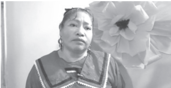
En 2020, esta casa de la mujer indígena, corrió peligro de desaparecer, debido a que el recurso que les correspondía se lo quitaron y lo destinaron al tema de Covid-19.

"Podemos decir que hay garantías para continuar con nuestra tarea, tenemos conocimiento que el próximo año se nos destinará una partida especial para las 34 casas de la mujer indígena que existen en todo el país".