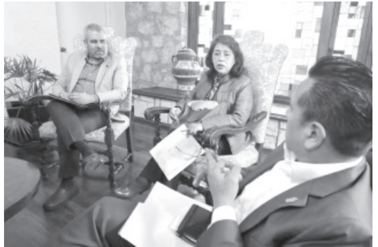
“Ya no podemos otorgar plazas directas por dos motivos: porque lo prohíbe la normatividad federal, y para no poner en riesgo la federalización de la nómina educativa”.

Finalmente, aseguró que las plazas que se han asignado a la fecha han sido bajo la normatividad, con registro ante Usicamm y con la debida integración del expediente correspondiente.