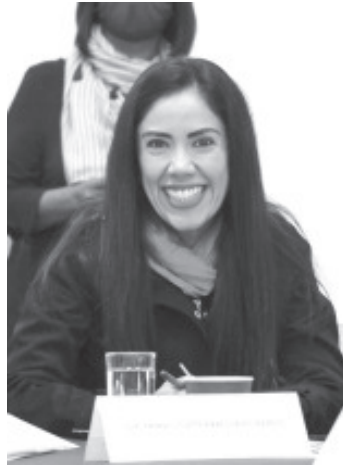
El gobierno de Silvano Aureoles Conejo gestionó y cumplió cada uno de los requisitos establecidos por el Gobierno Federal para concretar la federalización de la nómina educativa.

“Hoy que están en Gobierno las cosas son diferentes, se enfrentan a la realidad, pero no tienen la talla política para aceptar los errores de su patriarca y pretenden endosar culpas a quienes en su momento hicieron todo lo que estuvo a su mano para generar mejores condiciones económicas para Michoacán”, recalcó.