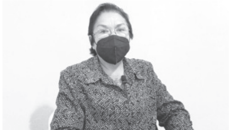
La Presidenta de la Unión de Contribuyentes Grupo Dos, destacó que se espera una alta cantidad de personas que se den de baja ante la SHCP o que dejen de trabajar.

Este año, esta actividad económica se realizó del 10 al 16 de mes de noviembre y los participantes que oficialmente fueron parte se registraron mediante una