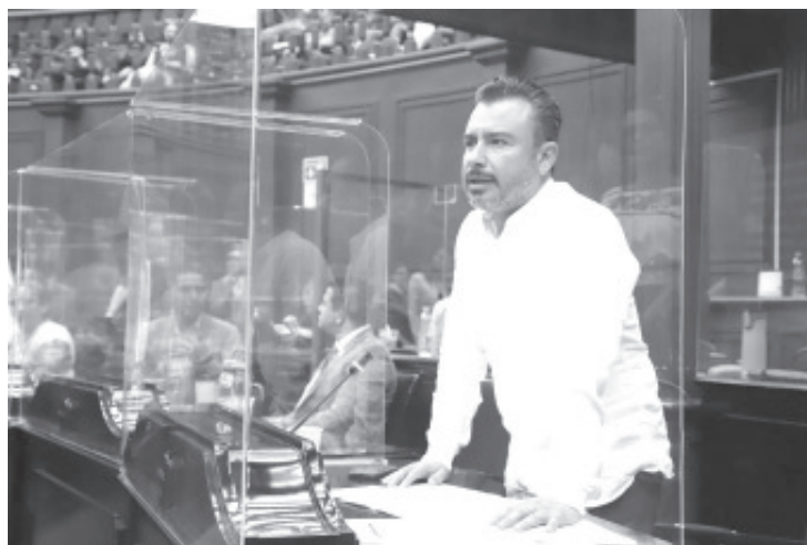
El empleo en el país ya se encuentra en cifras superiores a las de la contingencia sanitaria, y en nuestro estado estamos a poco de conseguir este repunte.