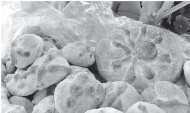
Ya está a la venta de "Pan de Muerto" en el primer cuadro de la ciudad y están listos para vender este rico alimento a quienes viven en el municipio y visitantes.

“Los invito a que prueben ya que motiva a los panaderos a seguir innovando y sigan sabiéndose que son los mejores y poder seguir comiendo mucho pan”, dijo.