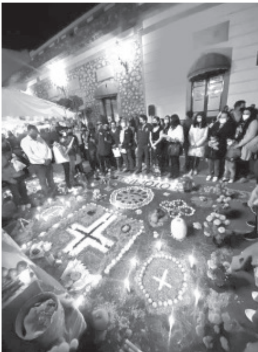
Se regaló pan de muerto a miles de familias que se dieron cita en la plaza Benito Juárez para disfrutar de la festividad.

Los ganadores del concurso de ofrendas fueron: CONALEP, primer lugar; IMCED, segundo; servicio social del DIF, tercero y Universidad Intercultural, cuarto lugar.