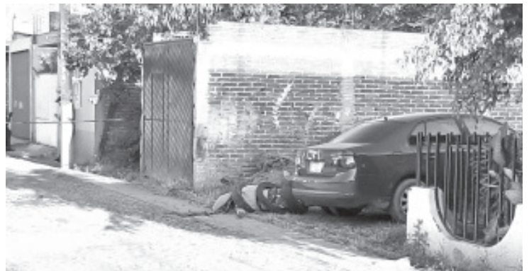
Entre varias llantas encontraron el cuerpo de un hombre, su cuerpo presentaba huellas de violencia.

Al lugar llegaron los agentes y peritos de la Unidad de Servicios Periciales y Escena del Crimen, quienes realizaron el procesamiento del área e iniciaron la carpeta de investigación correspondiente. Siendo trasladado el cadáver o a la morgue local para los estudios de ley.