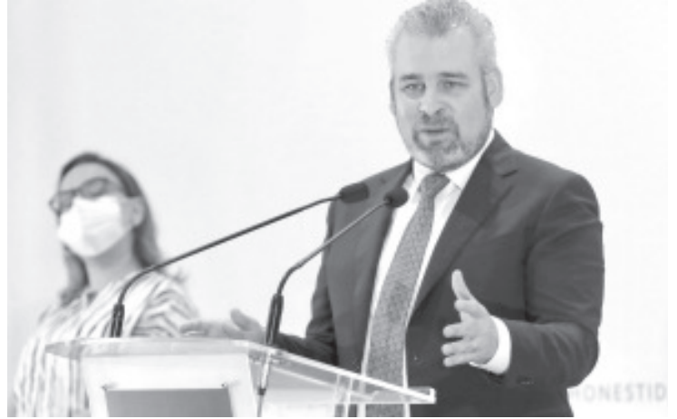
Hemos hecho un gran esfuerzo para el pago de estos mil 525 millones de pesos, de los cuales, fueron extraordinarios de la federación 500 millones de pesos.

Finalmente, el gobernador dijo que una gran motivación que tuvo su gobierno para pagar la deuda con el magisterio, es generar las condiciones para que niñas y niños vuelvan a las aulas, por lo que reiteró el llamado a maestras y maestros a volver a las aulas.