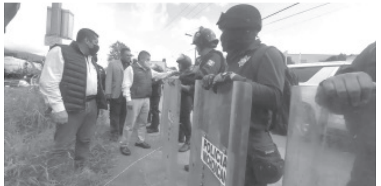
Para garantizar el tránsito del ferrocarril, los agentes de la Policía Michoacán y de la Guardia Nacional (GN) están desplegados en esta localidad y evitar un nuevo bloqueo.

Cabe destacar que, este dispositivo interinstitucional que se efectúa en dicha localidad, será de manera permanente a fin de garantizar el desarrollo económico en el territorio michoacano.