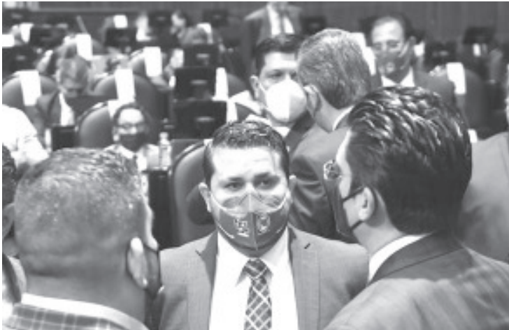
Reconocemos la intervención del secretario federal de SCT quien escuchó la solicitud de los integrantes de la AIEMAC y se inició la liberación de las vías del tren.