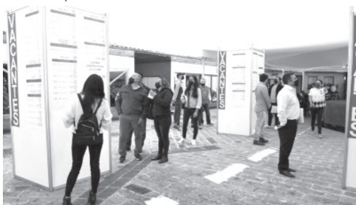
Sedeco, En coordinación con el SNE, ha atendido a más de 50 mil personas buscadoras de empleo, con una tasa de colocación al momento del 42.5 por ciento.

Es de destacar que, a inicios de octubre, la Dirección de Empleo de la Sedeco y el SNE llevaron a cabo un reclutamiento con una empresa dedicada al corte de jitomate, con sede en el estado norteamericano de Florida, en la que se logró la contratación de 120 personas de diversos municipios michoacanos.