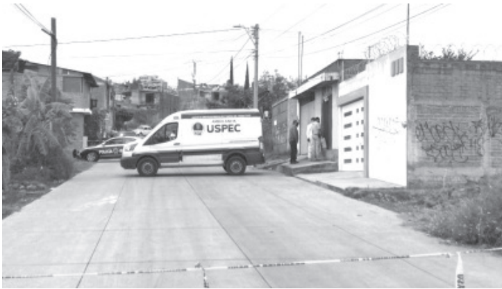
El hombre recibió varios disparos de arma de fuego y después arrojado al interior del aljibe, en un domicilio de la colonia Flores Magón, de Morelia.

Los expertos de la Unidad de Servicios Periciales y Escena del Crimen (USPEC), dependientes de la Fiscalía General del Estado (FGE), arribaron a la mencionada dirección y comenzaron las investigaciones correspondientes. Por último, el difunto fue trasladado a la morgue para la práctica de la necropsia de rigor.