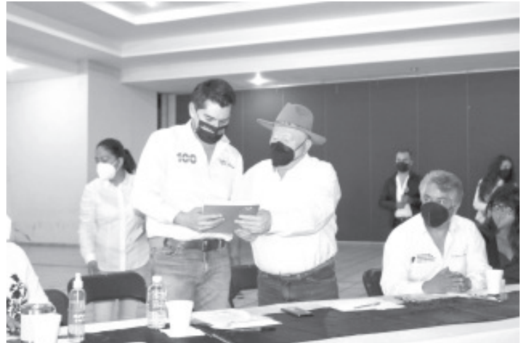
Proyectamos trabajar en conjunto con ejidatarios, productores y autoridades de los tres niveles Zitácuaro.de gobierno, en el rescate y saneamiento del canal hídrico más importante

que desde sus distintas jurisdicciones se sumen al rescate y recuperación de la cuenca de este río, aunado a un trabajo integral sostenible del cuidado y eficaz distribución del agua que genera el municipio.