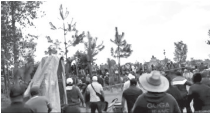
Aunque la votación se realizó a mano alzada por usos y costumbres, los datos oficiales serán proporcionados por el IEM, una vez que valide la consulta de este jueves.

- El IEM proporcionará datos oficiales, adelantan que ganó el autogobierno.