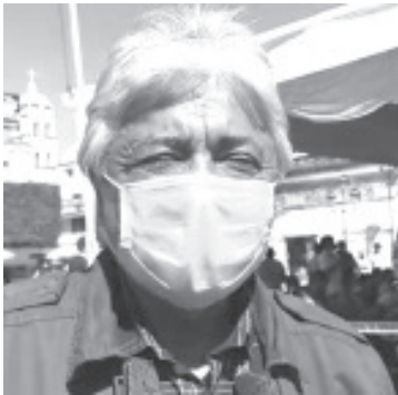
El titular de Desarrollo Económico, precisó que la idea de ambos mandatarios es de echar a andar este lugar y que sea parte de la reactivación económica de toda la región.

- 50% de las bodegas están en buenas condiciones