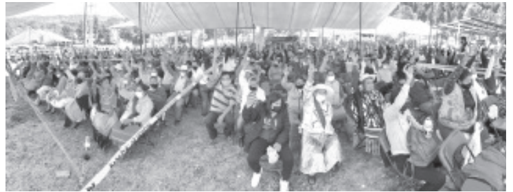
En la consulta que desarrolló el IEM ante la solicitud hecha por representantes de la población indígena; se presentaron 667 personas quienes ejercieron su decisión con base en sus usos normativos propios.