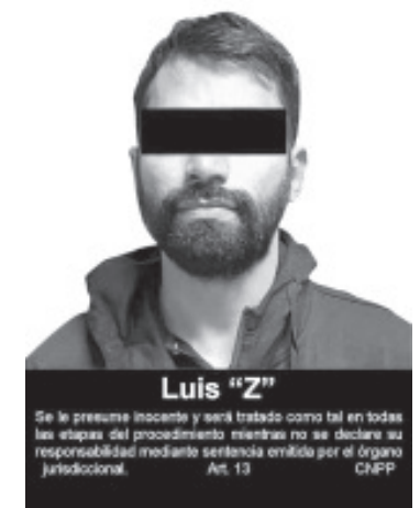
La FGR inició el proceso en contra de Luis "Z", por su probable responsabilidad en la comisión del delito de contra la salud.

denuncia de manera inmediata a las líneas de emergencias 911 y 089 donde se te brindará el apoyo oportuno.