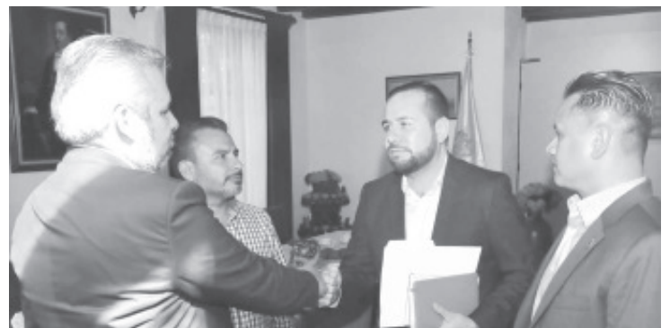
Borrón y Cuenta nueva, habrá de resolver algunos de los problemas más graves en materia económica; entre ellos el pago completo al magisterio.

situación financiera; así como que se resuelva por completo la falta de pago al magisterio para que se reanuden clases presenciales en su totalidad y se reactive el tránsito en las vías férreas.