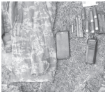
Los representantes de la ley encontraron los uniformes referidos, 7 cartuchos útiles de diferentes calibres, dos cargadores, un celular y un radio de comunicación.

Uruapan, Michoacán, a 29 de octubre de 2021.- En atención a una denuncia ciudadana emitida a una línea de emergencias, los elementos de la Secretaría de Seguridad Pública (SSP) en conjunto con los agentes de la Guardia Nacional (GN) desplegaron un dispositivo de seguridad en un predio de este municipio, a través del cual lograron asegurar diversos uniformes pixelados, equipo táctico, cartuchos y cargadores.