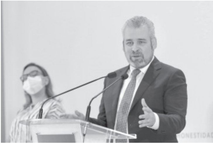
Se tiene que impulsar de manera coordinada con la federación y el sector salud y educativo, la capacitación docentes y centros de trabajo sobre el tema, indicó el gobernador.