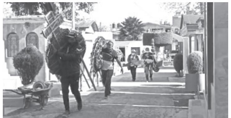
Los días 31, 1 y 2, la entrada de personas será por bloques cada hora, comenzando a las 8:00 y a las 3:00 de la tarde el último; máximo 4 personas por cada espacio.

Invitó a las personas que acuden a visitar la tumba de sus difuntos, a respetar las medidas sanitarias, ya que una vez que están adentro se retiran el cubrebocas y esto no debe ocurrir, porque es una de las principales indicaciones.