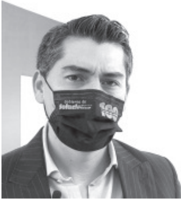
Con la designación directa de recursos, la comunidad deberá pagar su agua, su luz, sus drenajes, sus policías, y todos sus servicios,

- Recalca que el gobierno municipal no intervino de ninguna manera en consulta - En Francisco Serrato y Crescencio Morales, el IEM tendrá que valorar la situación