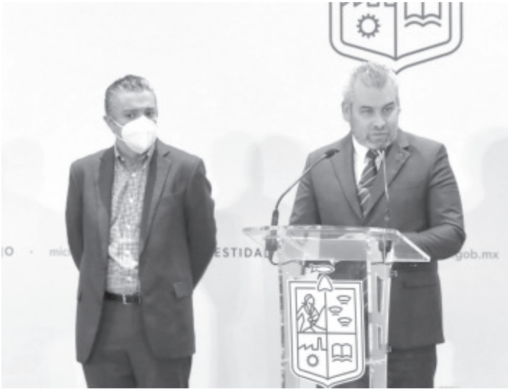
Con el respaldo del Gobierno de México, la Secretaría de Finanzas y Administración del estado cubrió las nóminas del sector educativo correspondientes a los meses de agosto y septiembre.