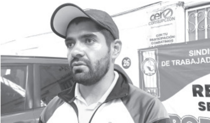
Restaría una quincena, así como todas las prestaciones, reconocemos a la administración su esfuerzo por generar estos pagos, pero no vamos a soltar ningún punto de presión.

El representante de la CNTE, exhortó a las autoridades estatales a cumplir los acuerdos y generar los mecanismos para que se liquiden por completo los adeudos con el magisterio y otros rubros.