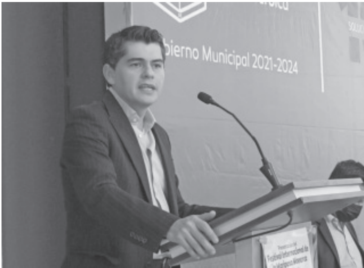
Entre las sedes que tiene el festival está la Casona de la Estación, el Teatro Juárez y la plaza cívica Benito Juárez. Contempla eventos artísticos, culturales, conferencias, así como el nombramiento de la embajadora de la Mariposa Monarca.

Agregó que a este festival se ha invitado a personajes importantes, entre ellos a la embajada de Estados Unidos y Canadá, para que sepan que en Zitácuaro hay presencia de la mariposa