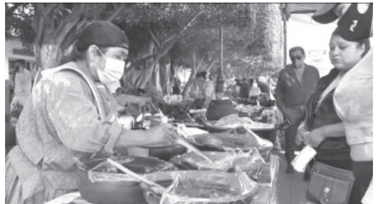
Tienen a la venta: papas a la mexicana, mole rojo y verde, espinazo, carne de puerco, tinga de pollo, setas, nopales, quelites, tortillas de color azul, salsa de molcajete, atole blanco y café de olla.

Por la pandemia de Covid-19, refuerzan todas las medidas como el uso obligatorio del cubrebocas, gel antibacterial, cubrepelelo y extreman la higiene en la preparación de los alimentos.