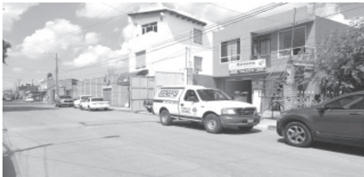
Pintor perdió la vida debido a una descarga eléctrica, mientras laboraba junto a unos cables de alta tensión.

No se proveyeron los generales del difunto, pero vecinos reportaron que era una persona joven de entre 20 y 25 años de edad.