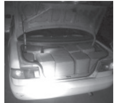
El enervante estaba empaquetado en bloques con cinta canela, listos para su venta y distribución en el mercado de las drogas ilegales.

Una vez hechas las labores correspondientes, se dio vista a la autoridad respectiva para que hiciera las diligencias competentes. En caso de presenciar o ser víctima de delitos,