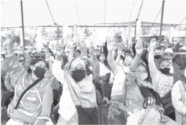
La fase final fue la parte consultiva y consistió en levantar la mano, para votar a favor o en contra.

- Hasta este jueves la misma actividad se realizará en la tenencia de Crescencio Morales