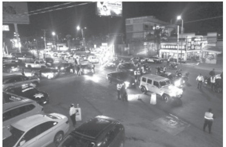
Tras efectuar 147 pruebas de alcoholemia, 13 unidades fueron trasladadas al corralón, 33 personas fueron infraccionadas y una más fue trasladada al área de Barandilla.

La SSP continúa trabajando con acciones preventivas que permiten garantizar la integridad física de la sociedad michoacana. Para solicitar algún servicio de emergencia, es necesario marcar a la línea telefónica 911, disponible las 24 horas del día.