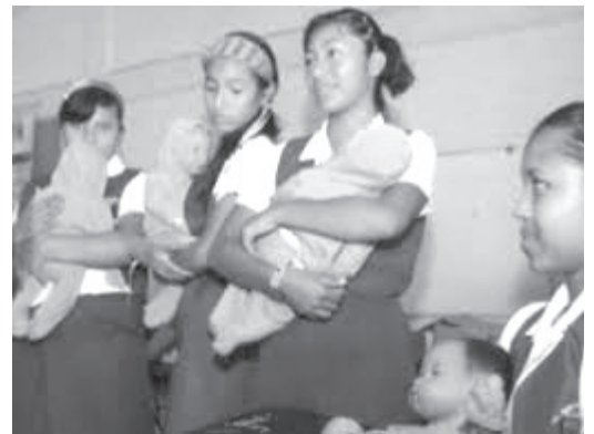
Cuando una niña de 15 años o menos se embaraza, tiene una probabilidad cuatro veces mayor de mortalidad materna, comparado con el grupo etario de 20 a 24 años.

El embarazo adolescente se considera un problema social y económico. Organon trabaja para contribuir en el fortalecimiento de acciones y programas que permitan mayor conocimiento del uso de métodos anticonceptivos, su acceso y elección libre e informada por parte de los y las usuarias.