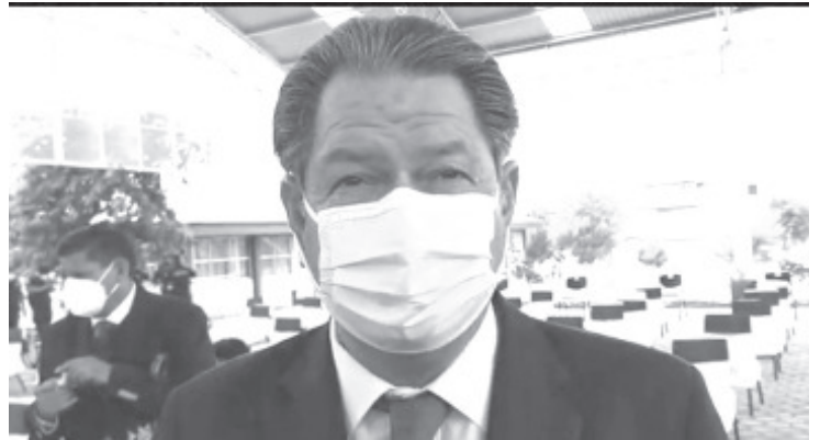
En los casos específicos de preescolar, primaria y secundaria, la situación que ha motivado más el no regreso a clases presenciales, ha sido la falta de pago de maestros estatales.

Añadió que en estos días se captará la información de todos los centros educativos, sobre la forma en que trabajan y modalidad; ésta será enviada a la Ciudad de Morelia para que se establezcan las acciones a seguir y que aumente el regreso a clases presenciales.