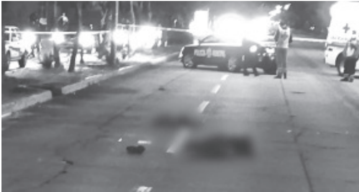
Fuentes policiales y de rescate comentaron que el transeúnte no está identificado, y al parecer se trató de una persona en situación de calle, misma que vestía chamarra y pantalón negro.

El lugar fue acordonado por patrulleros municipales, luego arribaron los elementos de la Fiscalía General del Estado (FGE), adscritos a la Unidad de Atención Inmediata, quienes realizaron las averiguaciones pertinentes y trasladaron el cadáver a la morgue para la práctica de la necropsia de rigor.