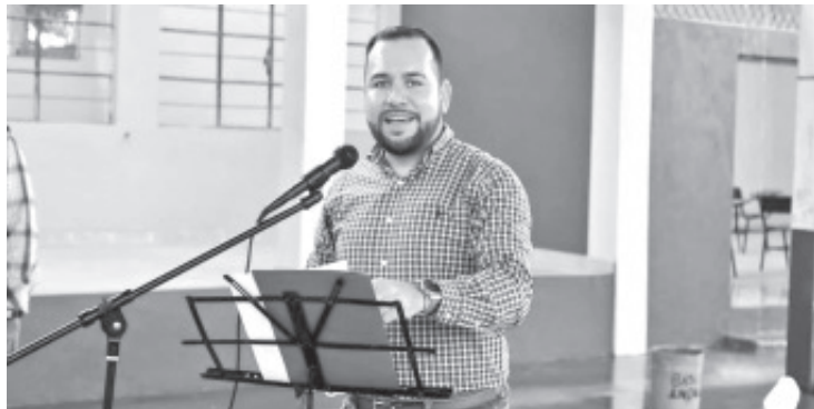
El diputado dijo que se aprovechará que para el 2022 habrá un incremento de más del 6 por ciento de presupuesto para la entidad en comparación con el presente año.

-PT buscará mayores recursos para infraestructura física en la entidad, aseguró el legislador