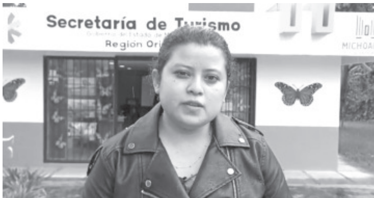
La Delegada Regional de Turismo, precisó que estos módulos estarán en las plazas públicas de los municipios representativos de la región: Tlalpujahuá, Ocampo, Angangué, Zitácuaro, Ciudad Hidalgo, entre otros.

Para aquellos que deseen acudir a la zona lacustre en Pátzcuaro, los exhortó a acatar las medidas sanitarias y recordar que la visita es rotativa, esto para motivar que la estancia en cada lugar sea breve.