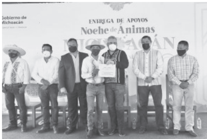
El gobernador Alfredo Ramírez Bedolla y el secretario de Turismo, Roberto Monroy, entregaron 2 millones 450 mil 300 pesos a representantes de los beneficiarios.

Los municipios que participaron en el evento fueron Pátzcuaro, Tzintzuntzan, Erongaricuaru, Uruapan, Jiquilpan, Salvador Escalante, Morelia, Quiroga, Copándaro, Zamora, Tacámbaro y Tangancicuaru; además de 31 jefes de tenencia, comisariados y encargados del orden, así como cooperativas, patronatos y el Instituto del Artesano.