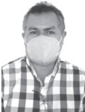
A nivel local participarán 10 empresas, las cuales van a ofertar aproximadamente 60 vacantes de distintos niveles operarios. Van desde gerente hasta empleada de piso o mostrador.

El representante del SNE, precisó que es una temporada complicada en el tema del empleo, sin embargo esta dependencia no ha dejado de trabajar y en todo momento ayuda a los buscadores de empleo a buscar un trabajo y a empresarios a colocar al mejor perfil en la vacante existente.