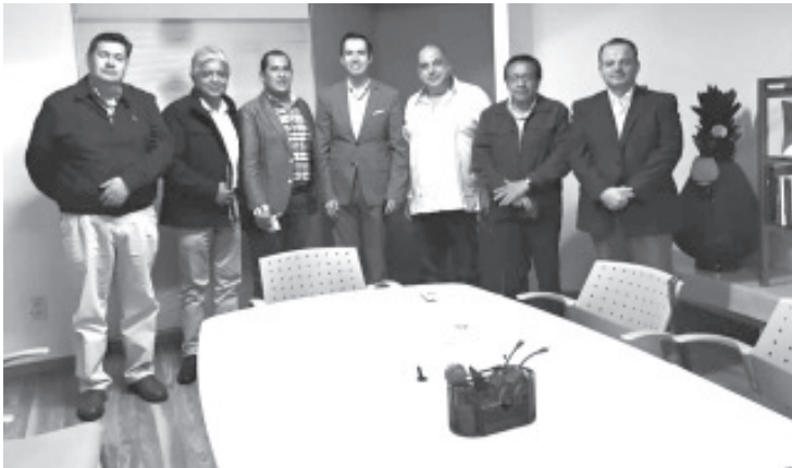
Los principales proyectos son la rehabilitación de la Central de Abastos, posicionar al municipio como la nueva ruta económica, entre otros planes expuestos por el edil zitacuarenses.

-Sostiene reunión director de la dependencia municipal con el titular de la Secretaría de Desarrollo Económico en el Estado.