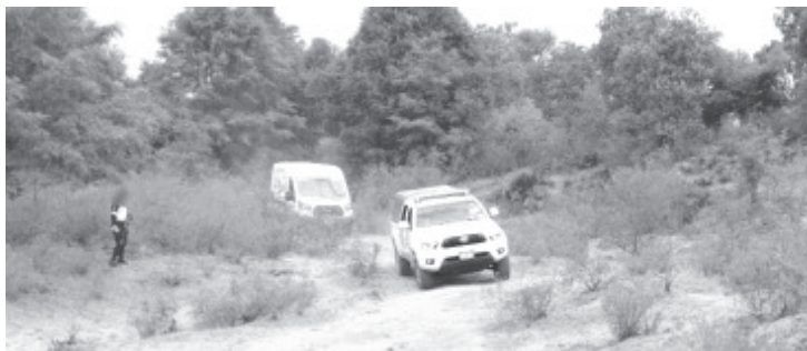
En el sitio fueron descubiertos uniformes apócrifos de la Guardia Nacional y del Ejército Mexicano, así como equipo táctico, armas y sustancias ilícitas.

La situación fue alertada a la Fiscalía Regional, cuyos especialistas se encargaron de las averiguaciones correspondientes y trasladaron los restos humanos a las instalaciones del Servicio Médico Forense.