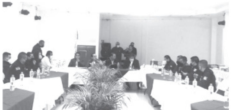
Los dispositivos de seguridad se realizarán en toda esta parte de la entidad por medio de patrullajes y filtros de inspección vehicular en los tramos carreteros y en los sitios de mayor afluencia.

La SSP no baja la guardia en su tarea de garantizar el bienestar de los michoacanos, en caso de ser víctima o presenciar algún delito, denuncia a las líneas telefónicas de emergencias 911 y 089.