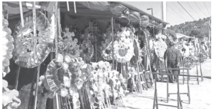
Aunque los insumos han subido un poco, ellos dan buenos precios, hay de todos los tamaños, por ejemplo la corona más grande no pasa de 400 pesos.

Agregó que desde hace varios años la actividad ya no deja buenos ingresos, esto se debe a que hay mucha competencia. “Antes era diferente solo los coroneros las vendían, ahora donde hay ropa venden coronas, donde hay plásticos venden coronas y todos tratan de meter estos productos en esta temporada”, dijo.