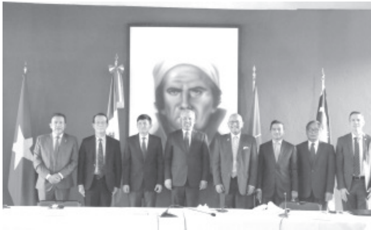
Alfredo Ramírez Bedolla presentó las ventajas competitivas de Michoacán y sus potencialidades productivas a embajadores de la Asociación de Naciones del Sureste Asiático.

Morelia, Michoacán, 26 de octubre del 2021*.- El gobernador Alfredo Ramírez Bedolla presentó las ventajas competitivas de Michoacán y sus potencialidades productivas a embajadores de la Asociación de Naciones del Sureste Asiático (ASEAN), a quienes manifestó: "deseo que el crecimiento económico de nuestros países sea mutuo, y podamos compartir el desarrollo".