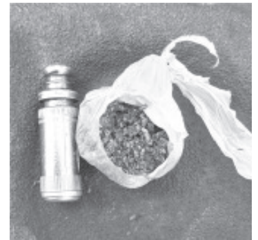
En Valle Verde, de la tenencia de curgungueo, la SSP detuvo a un sujeto que llevaba marihuana.

La SSP invita a la ciudadanía a reportar todo hecho ilícito a las líneas telefónicas de emergencias 911 y 089, donde se brindará atención inmediata a la gente por parte de los tres niveles de gobierno.