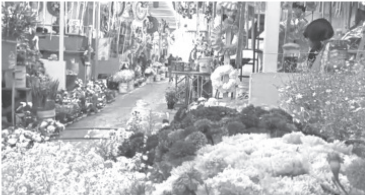
Solicitó al Ayuntamiento que no permita que se instalen camionetas con venta de flor a las afueras de este mercado, ya que cada año pasa esto y representa una competencia desleal.