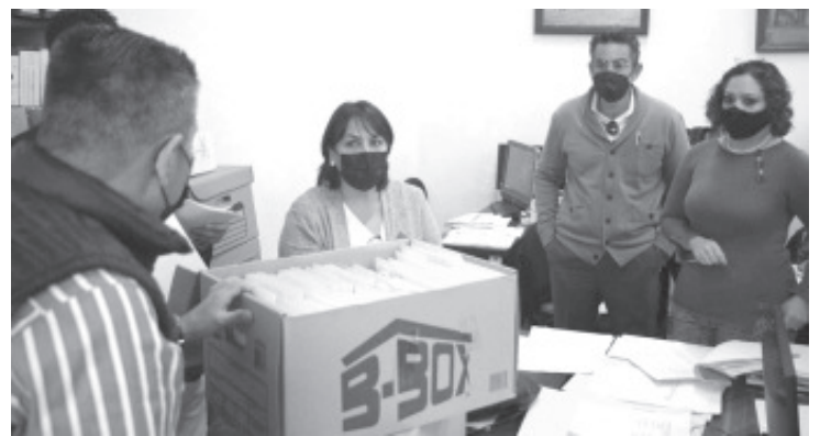
Al recibir las 5 cajas que contienen los asuntos pendientes de trámite, la diputada del PAN se comprometió a trabajar para dar una respuesta oportuna a las diferentes comunicaciones.

"Tenemos varios asuntos pendientes entre ellos se encuentran desde comunicaciones de presidencias municipales, hasta el nombramiento de órganos de gobierno, por eso la importancia de reunirnos en el menor tiempo posible con todas las diputadas integrantes de la Comisión para hacer la revisión correspondiente y dar respuesta a los pendientes".