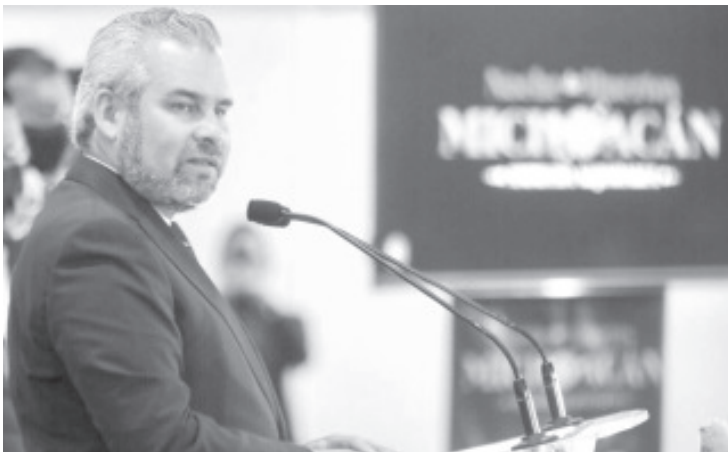
La intención es que, del 15 de noviembre al 17 de diciembre, se abra el periodo para la regularización de los trámites y con ello, obtener ingresos de hasta 466 millones de pesos.

Por otra parte, el gobernador agregó que se solicitará a la Secretaría de Hacienda y Crédito Público incluir a Michoacán en la regularización de automotores usados procedentes del extranjero, luego de que el pasado 18 de octubre se publicó en el Periódico Oficial de la Federación el acuerdo de importación definitiva.