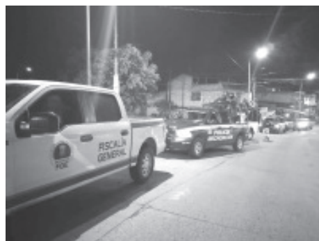
Los elementos de seguridad de los tres niveles de gobierno, transitan calles y plazas públicas de los diferentes municipios, con el fin de inhibir toda conducta de carácter delictivo.

Asimismo, se siguen fortaleciendo los dispositivos de vigilancia en los tramos carreteros y toda esta área oriente del estado, a través de la instalación de los puestos de