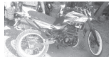
Se ubicaron dos motocicletas de la marca Italika, una con reporte de robo, se localizaron cinco cargadores y dos chalecos balísticos, los cuales fueron asegurados.