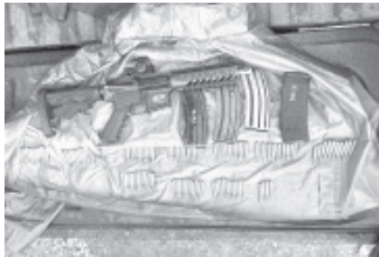
Los uniformados localizaron un fusil junto a 101 cartuchos útiles, cuatro cargadores y equipo táctico, dentro de un auto siniestrado en la colonia El Mirador.

Luego de llevar a cabo las actuaciones correspondientes, lo decomisado fue puesto a disposición de la autoridad correspondiente para realizar las diligencias de ley. La SSP pone al servicio de la ciudadanía las líneas telefónicas 911 y 089, para reportar toda acción que requiera apoyo.