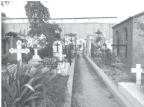
El horario al público en los días principales de la conmemoración, será de 8:00 de la mañana a 4:00 de la tarde. Se prohibirá el ingreso de músicos o bandas y bebidas embriagantes.

El horario en que estará abierto el cementerio en los días principales de la conmemoración, será de 8:00 de la mañana a