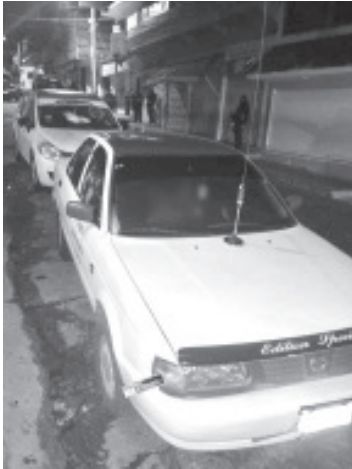
Durante la noche del miércoles y la madrugada de este jueves, situaciones de violencia dejaron como saldo 6 personas asesinadas y una más herida.

-Tres de las víctimas fueron asesinadas en un sitio de taxis