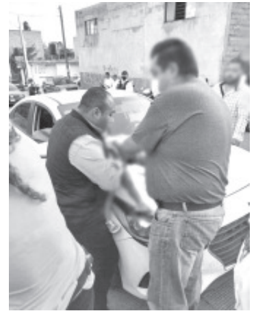
La menor, de aproximadamente 1 año de edad, sufrió convulsiones y se estaba ahogando, sus padres pidieron ayuda y fue cuando intervino el elemento, quién también es paramédico.

Por último, la menor fue llevada a un hospital para su adecuada atención.