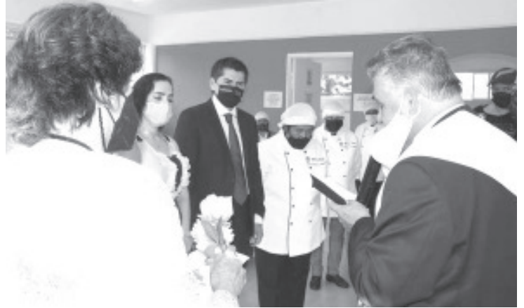
El alcalde señaló que no solo se trata de un programa de gobierno, sino de un tema sensible, humano y de solidaridad con los sectores que más necesitan del respaldo de su gobierno.

En el evento inaugural estuvieron presentes regidores, funcionarios municipales, empleados de la administración municipal y ciudadanía en general.