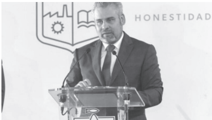
En nuestro gobierno queda atrás la idea de que el gobernante es un ser muy superior y por eso debe estar rodeado de cientos de personas armadas que impiden acercarse a él.

Morelia, Michoacán, 20 de octubre de 2021.-* El Gobernador Alfredo Ramírez Bedolla informó que los elementos que se encontraban como escoltas en la administración anterior pasarán a realizar diversas acciones de seguridad en beneficio de las y los michoacanos.