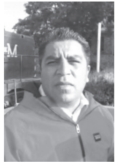
En la primera parte el grupo parlamentario de Morena y PT votaron en contra por el 6%, pero en la ley de ingresos vota a favor de ese mismo 6%, mismo que se aplicara a los ciudadanos.

“Yo creo que con el 6 por ciento es más o menos diez pesos de aumento, esto permitirá que el SAPA deje de colapsar económicamente”.