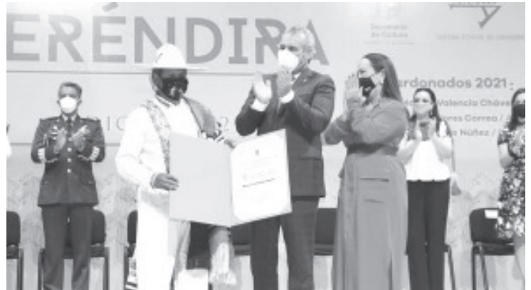
Todos debemos darnos el espacio para las expresiones artísticas y desde temprana edad inculcar en los niños el gusto por la cultura, dijo al entregar los premios.

Este año se postularon 26 candidatos, de entre lo cuales fueron seleccionados cinco finalistas, y de esos los tres galardonados mencionados.