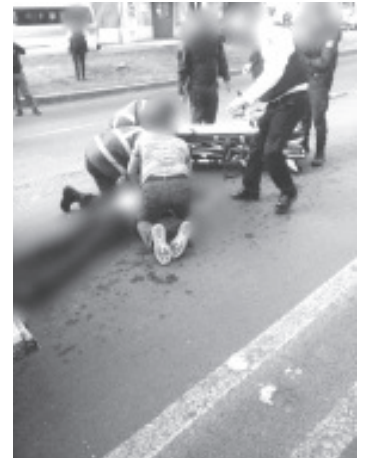
El hombre, de aproximadamente 32 años de edad, subió a la citada estructura para el paso de transeúntes y logró aventarse hacia el arroyo vehicular.

Los socorristas le otorgaron las primeras curaciones y canalizaron al paciente a un hospital para su adecuada valoración médica.