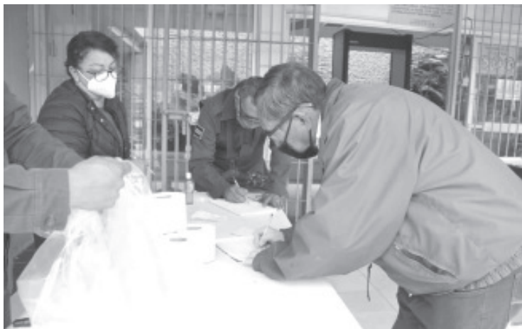
Los Centros de Apatzingán, Zamora y Zitácuaro, tienen un aforo permitido del 75% y como requisito mínimo necesitan comprobante de la primera dosis de vacunación, adultos hipertensos y diabéticos no pasan.