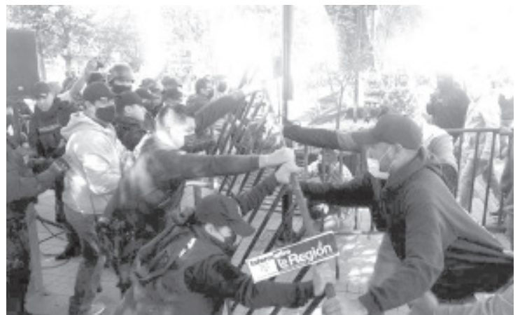
A pesar de la vigilancia, las barreras de contención y los filtros sanitarios, los profesores llegaron hasta la plaza Mártires de Uruapan, donde gritaron consignas en contra del gobernador.

El Gobernador y la comitiva, lograron salir de la explanada, en medio de un fuerte cerco policías y guardias de seguridad, hasta llegar a la Casa de la Cultura.