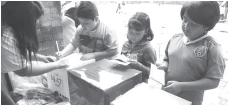
La Consulta infantil y juvenil 2021, este año se realizará durante el mes de noviembre en espacios escolares, itinerantes y en la sede de este órgano electoral.

Este año, los temas que se abordarán, serán: la pandemia, el cuidado del medio ambiente y nuestros derechos.