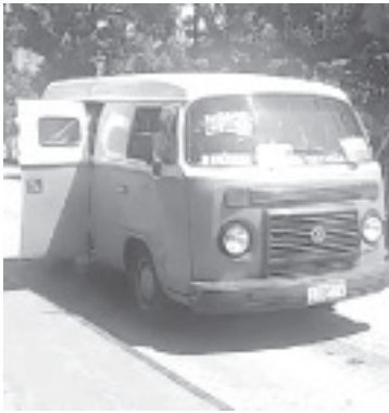
COCOTRA pide a usuarios de colectivos a denunciar a conductores que no cumplan con el uso de cubrebocas y todas las medidas sanitarias.