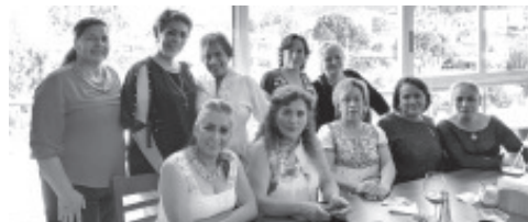
¡MUCHAS FELICIDADES! En su DÍA A Trabajadoras de la Clínica del ISSSTE. En Este PRIMERO DE Octubre del Año 2021.