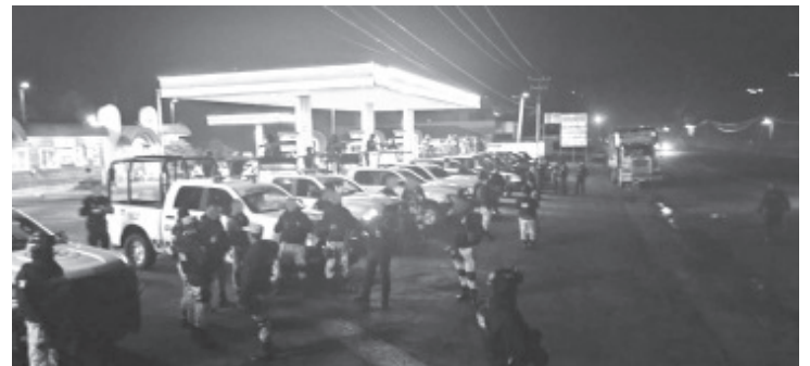
En municipios como Zitácuaro, Tlalpujahua, Hidalgo, Aporo y Ocampo, los agentes de la Policía Michoacán y de la GN, intensificaron las acciones operativas, preventivas y de vigilancia.

Dentro de las acciones preventivas, los agentes recorren las carreteras, las brechas, las calles y las colonias. La SSP pone a disposición de las y los michoacanos las 24 horas del día las líneas telefónicas 911 y 089, a fin de brindar apoyo de manera inmediata ante alguna emergencia.