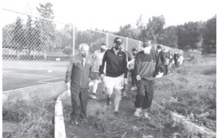
Invitó a las ligas, clubes, atletas destacados y ciudadanía en general a presentar proyectos para la conformación de un Plan del Deporte Municipal.

El edil acompañó a un equipo de atletismo en su entrenamiento matutino; asimismo, dio a conocer que las unidades deportivas, con base en lo emitido por la COEPRIS, se apertura de 6:00 Am a 8:00 Pm., bajo las medidas sanitarias establecidas.