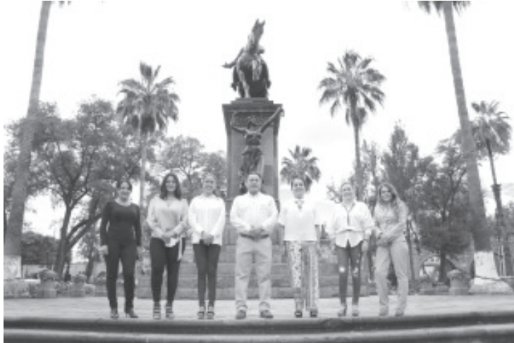
Como diputados estarán atentos a los trabajos de investigación que realicen las autoridades, y reiteraron su llamado a los gobiernos Estatal y Federal para que generen condiciones de seguridad.

-Condenan ataque al domicilio del alcalde de Tuxpan