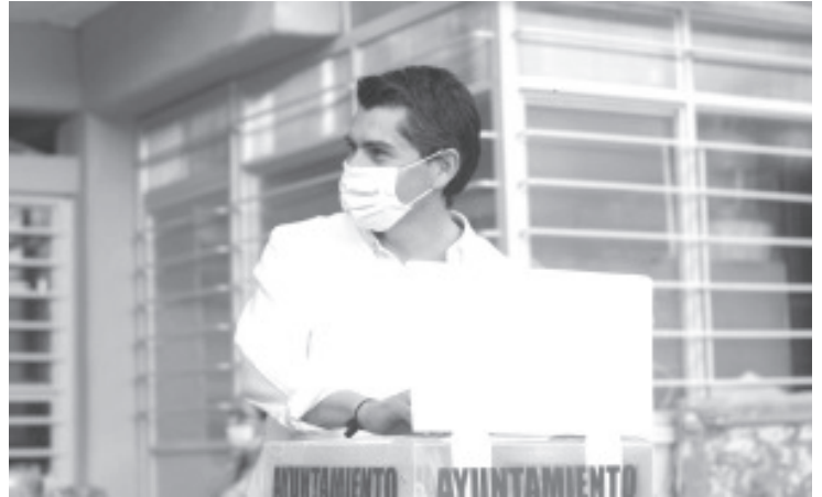
El presidente municipal informó que trabajará coordinado con los gobiernos Federal y Estatal, para garantizar la tranquilidad y seguridad de los zitacuarenses.