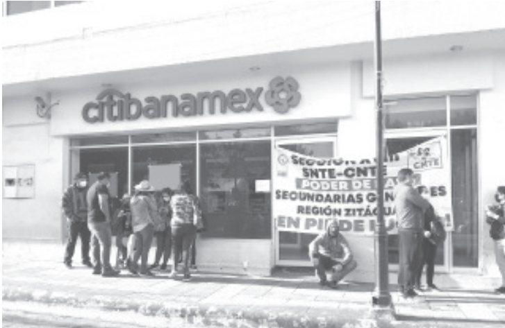
A cada uno de los 30 mil maestros estatales, se les adeudan en promedio 25 mil pesos, que incluye tanto las 4 quincenas, así como varios bonos.

- Maestros estatales no han recibido su pago de 4 quincenas