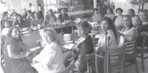
Celebrando y festejando con una comida en conocido Restaurante Trabajadores de la Clínica ISSSTE. En su ANIVERSARIO. ¡FELICITACIONES!