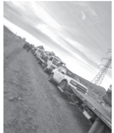
Las unidades automotrices estaban abandonadas en predios con maleza y arbolados, pues los infractores de la ley pretendían ocultarlos de las autoridades.

La SSP pone a disposición de la ciudadanía los números telefónicos 911 y 089 (éste último de denuncia anónima) para que la gente se comunique para reportar cualquier conducta ilegal y se pueda atender el llamado de manera oportuna.