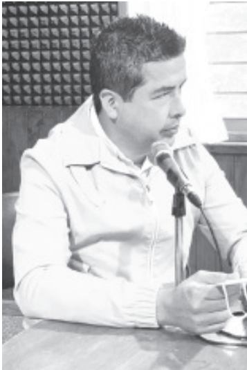
La casa donde vive el presidente municipal de Tuxpan, Carlos Paredes Correa, fue balaceada por desconocidos durante la madrugada del jueves.

Tuxpan, Mich.- Jueves 07 de octubre de 2021.- Durante la madrugada de este jueves, unos sujetos desconocidos accionaron armas de fuego contra el domicilio del alcalde de Tuxpan, Carlos Alberto Paredes Correa, quien por fortuna resultó ileso, ya que al momento de los hechos no estaba en la casa, comentaron fuentes allegadas al tema.