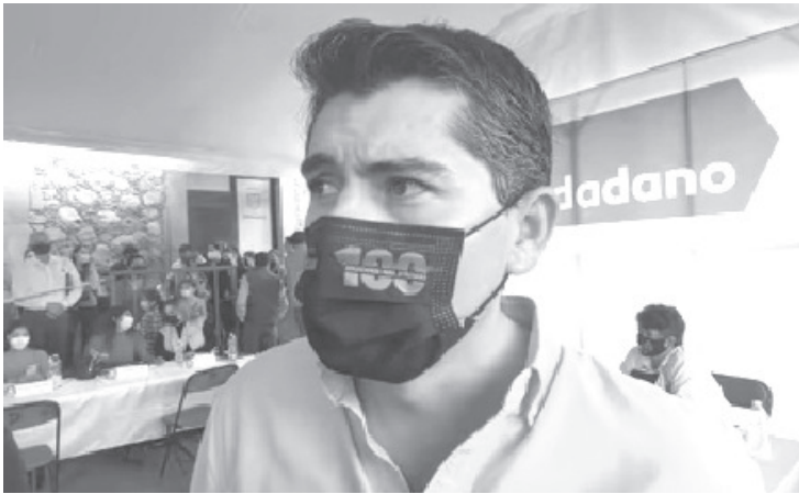
Durante los hechos violentos que tuvieron una duración de casi 45 minutos, hubo una buena reacción de la Fiscalía, Guardia Nacional, Policía Michoacán y de la propia policía municipal.

- Condena hechos violentos ocurridos en Zitácuaro