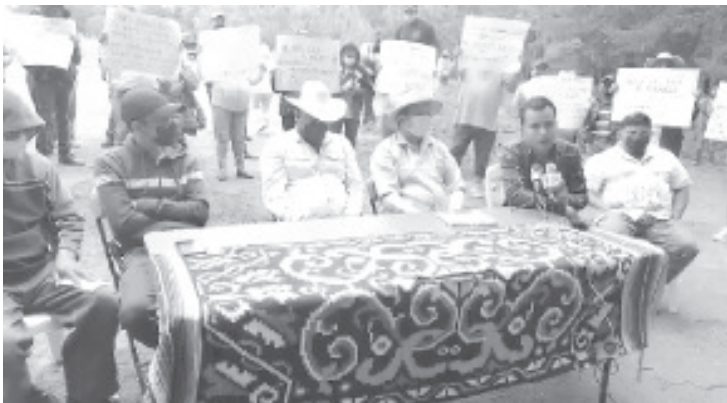
Prueba de que buscan el bienestar de sus comunidades y de dejar un buen futuro para las nuevas generaciones, es que han trabajado con Guardia Nacional para parar la tala y recuperar tierras con vocación forestal.

Dejaron claro que no necesitan del ayuntamiento para tener un programa ambiental, las comunidades son dueñas de una superficie importante de bosque y además tienen especialistas para estos temas. Sin embargo están dispuestos a trabajar con las autoridades que si quieren hacerlo, no con quien utilice la bandera de las comunidades para continuar su carrera política.