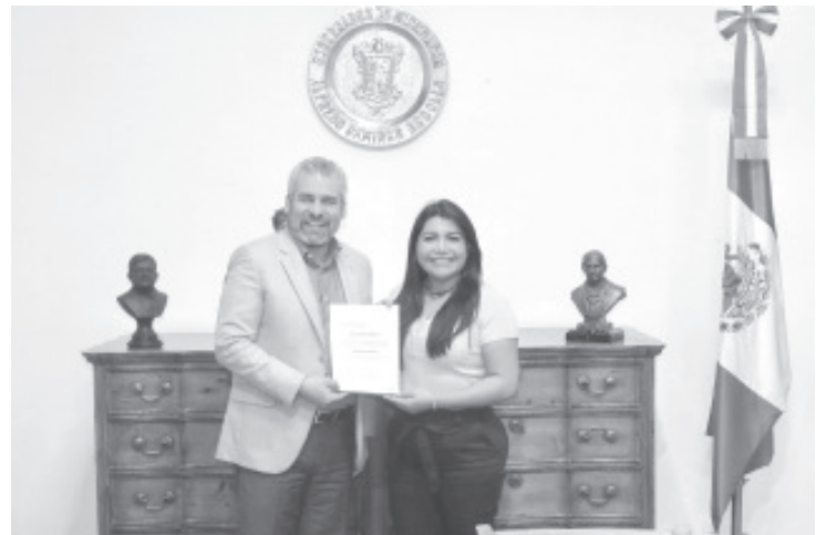
Por iniciativa del gobernador Alfredo Ramírez Bedolla se solicitó considerar en la nueva ley, mantener la dependencia estatal y fortalecer las acciones de política migratoria.

Es de mencionar que este miércoles los integrantes de la LXXV Legislatura votaron a favor de la nueva ley tras decreto presentado ante el Congreso del Estado para su revisión y respectiva aprobación.