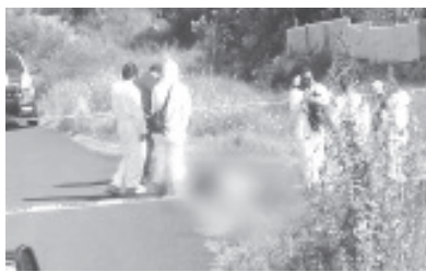
La policía confirmó el hallazgo del cadáver de una femenina de 25 años que vestía un pantalón de mezclilla azul, blusa color gris, calzaba tenis negros y tenía cabello oscuro.

El hecho fue notificado al personal de la Fiscalía General del Estado, cuyos expertos se encargaron de realizar el peritaje correspondiente y el levantamiento del cuerpo para su traslado a la morgue para la práctica de la necropsia de ley.