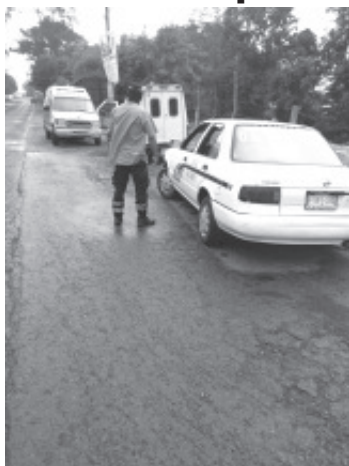
Dos taxistas del municipio de Ocampo, fueron muertos a tiros en Curungueo, dentro de sus propios autos, estaban a unos cien metros uno del otro.

Zitácuaro, Mich.- Miércoles 06 de octubre de 2021.- Un hombre asesinado a tiros fue encontrado dentro de un vehículo de alquiler que estaba aparcado a la orilla de la carretera Zitácuaro-Morelia. A 100 metros del mencionado sitio, las autoridades policiales hallaron a otro masculino ejecutado, quien también yacía al interior de un taxi trascendió en la labor noticiosa.