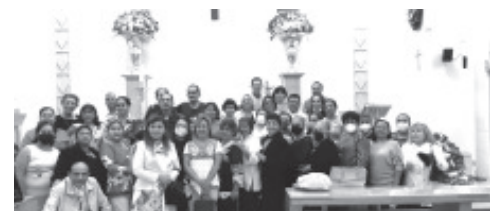
MISA DE ACCIÓN DE GRACIAS Este PRIMERO DE OCTUBRE Por los Trabajadores de la Clínica del ISSSTE. AL CUMPLIR UN ANIVERSARIO Más. ¡FELICIDADES!-