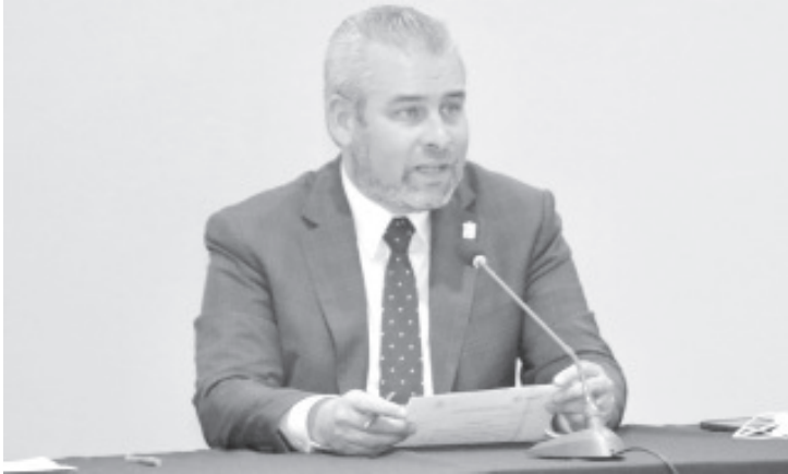
El próximo lunes 11 de octubre regresarán a las aulas las y los estudiantes del nivel medio superior y superior y el 18 del mismo mes, los alumnos del nivel básico (primaria y secundaria).

-El 11 de octubre vuelven a las aulas en el nivel medio superior y superior, y el 18 de octubre para nivel básico.