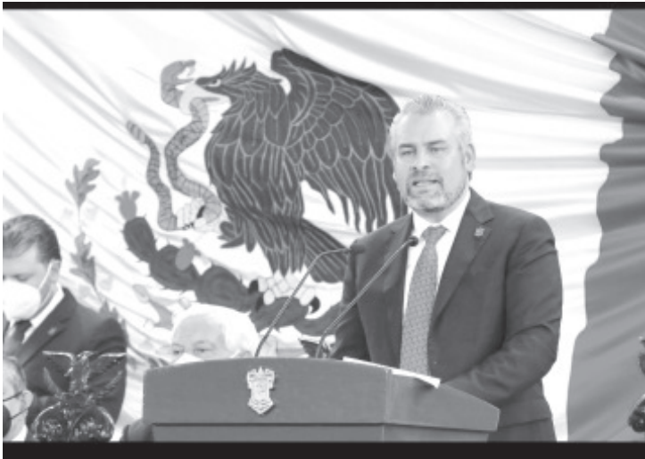
Insistirá en las gestiones para que la Casa de Hidalgo sea reconocida por el Gobierno de México como universidad nacional, y en consecuencia pueda acceder a mejores aportaciones económicas.

-El gobernador solicitará apoyo a la federación para mejorar las condiciones financieras de la institución nicolaíta_