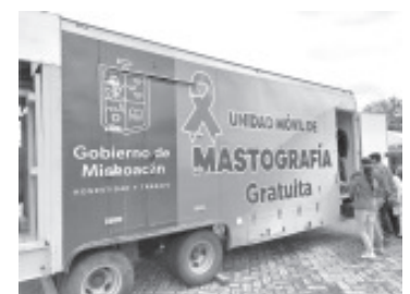
La mastografía está indicada para mujeres de 40 a 69 años de edad, en caso de salir positivo el resultado, se les canaliza a oncología en Morelia, para que les den seguimiento.

Agregó que el mastógrafo, que es el aparato con que se hace el estudio, permite hacer una proyección a detalle de la glándula mamaria, y el responsable de su operación es un radiólogo.