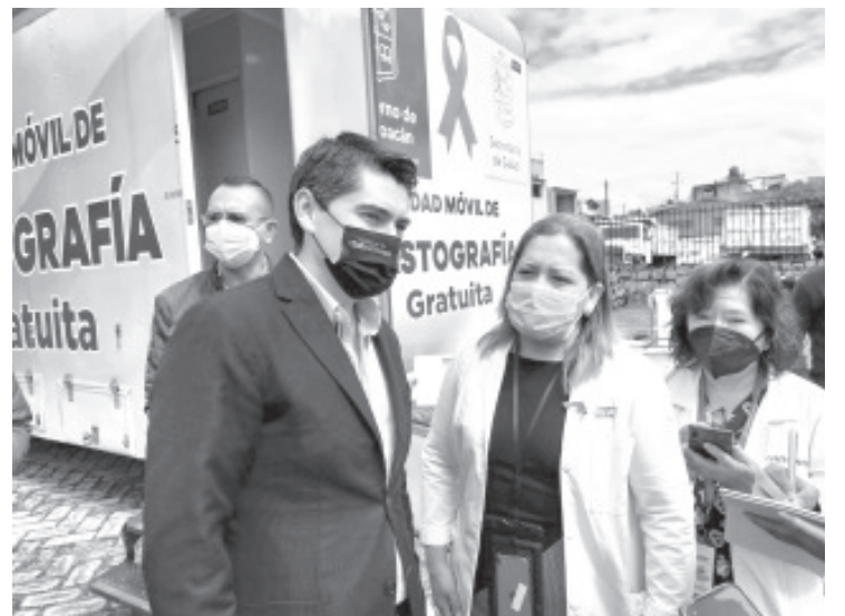
Esta labor se lleva a cabo en el marco del Mes de Concientización del Cáncer de Mama, de manera coordinada en las unidades de salud en Michoacán y el apoyo del DIF municipal.