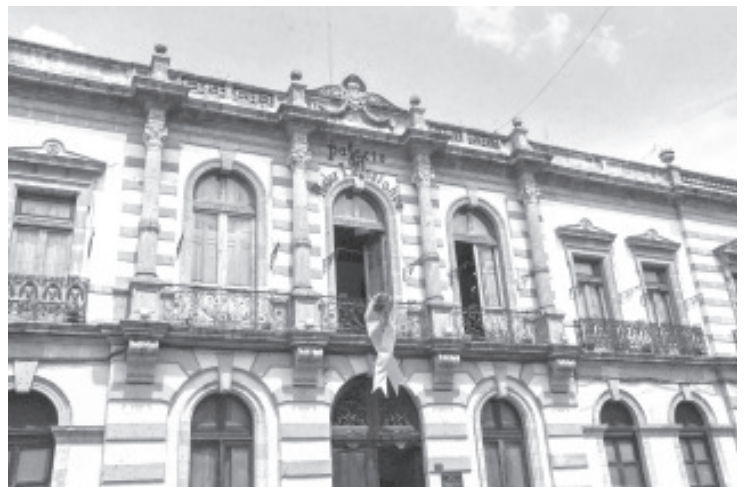
La legisladora hizo un llamado tanto a las autoridades de los distintos niveles de gobierno como a la sociedad en general a fin de cerrar filas en torno al cáncer.