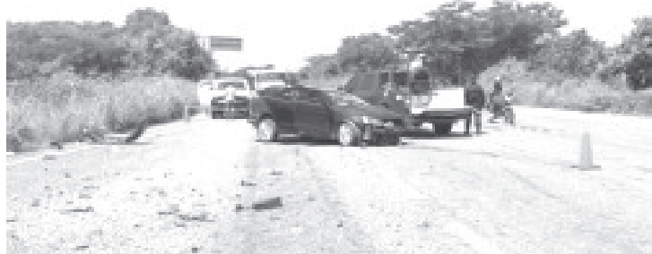
La volcadura fue en un Jetta, con placas del Estado de Guerrero, que tripulaba el sacerdote que venía de la comunidad de Jolula luego de celebrar misa en aquella comunidad.

El finado sacerdote era Vicario desde hace un año en la Parroquia de San Felipe de Jesús, iglesia ubicada en la cabecera municipal de La Unión en la Parroquia de San Felipe de Jesús, y varios años de manera previa en la comunidad de Papanoa en Tecpan de Galeana. Asimismo era originario del municipio de Cuitzeo Michoacán.