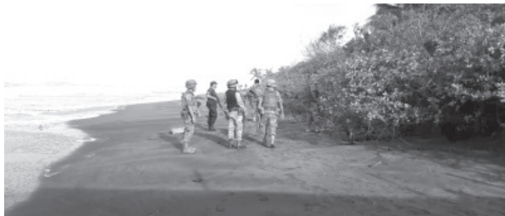
Los cuerpos de tres hombres con lesiones de bala y signos de tortura fueron encontrados tirados en una brecha de la población de Barra de Pichi.