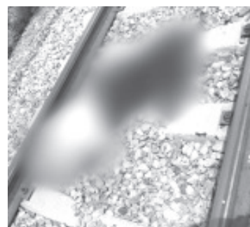
El hombre perdió la vida al ser mutilado por la pesada máquina, estaba en calidad de desconocido.

Asimismo se notificó al personal de la Fiscalía de Michoacán, que realizó el peritaje correspondiente y el levantamiento del cadáver para su traslado al Servicio Médico Forense.