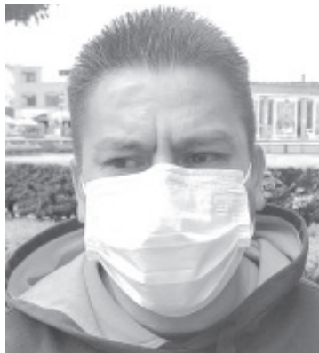
El Comandante ejemplificó, que esta semana se atendió a un joven que no se podía ni sostener y así agarro la moto, minutos más tarde sufrió un lamentable accidente.

Lamento que hoy en día jóvenes de 15 años ya anden manejando este tipo de vehículos.