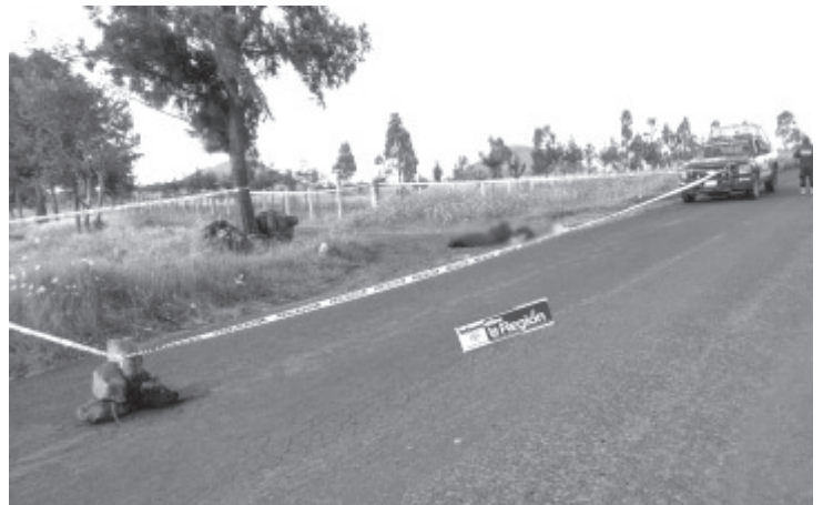
Dos cuerpos de hombres desconocidos fueron arrojados a un lado de la carretera Irimbo-Aporo, presentaban sobre la frente las siglas CJNG.

Los ahora occisos están en calidad de desconocidos, así lo mencionaron a este reportero fuentes allegadas al tema. Igualmente, trascendió en la labor noticiosa que los difuntos tenían escritas en la frente las siglas del CJNG. Cabe mencionar que en la región se han registrado varios hechos de violencia relacionados con la pugna entre grupos delincuenciales rivales.