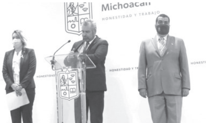
Ramírez Bedolla señaló que la SEE y la SSM presentarán una nueva propuesta de protocolos de regreso a clases.

Morelia, Mich.-04 de Octubre de 2021.- El gobernador de Michoacán, Alfredo Ramírez Bedolla señaló que la Secretaría de Educación del Estado (SEE) y la Secretaría de Salud de Michoacán (SSM) presentarán una nueva propuesta de protocolos de regreso a clases, durante la siguiente junta de la Mesa de Seguridad de Salud programada para el próximo viernes.