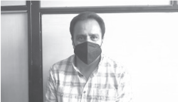
En años pasados, en el primer mes de los nuevos ayuntamientos, se llegaban a celebrar hasta 150 convenios de terminación de relación laboral, esta vez no se ha realizado ninguno.

- En años pasados hasta 150 convenios se hacían en el primer mes