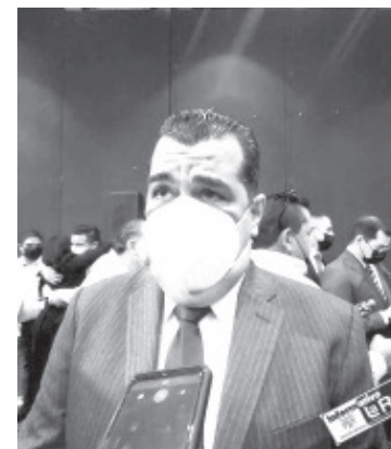
El manejo de la pandemia en el estado ha sido adecuado, la enfermedad se ha contenido mucho, sin embargo se deben reforzar las estrategias para evitar más contagios.

"Se puede presentar la cuarta ola, si bien la más mortal fue la segunda, la más explosiva en número de casos ha sido la tercera y las medidas hay que extremarlas para evitar