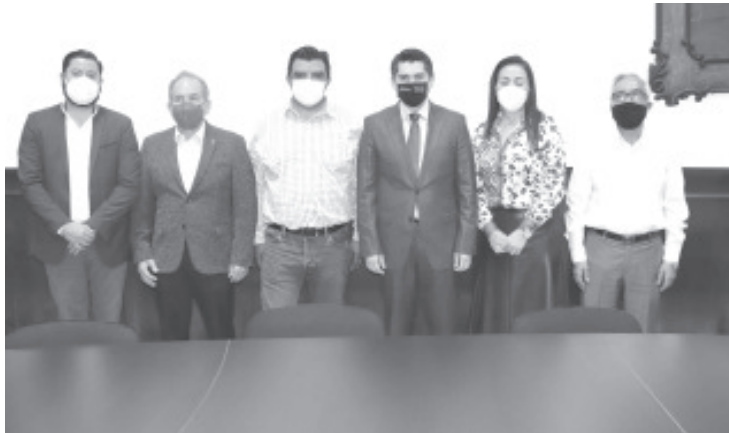
El presidente municipal hizo nuevos nombramientos en su equipo de gobierno, son nuevos cargos que anteriormente no existían.

El edil convocó a los funcionarios a que la prioridad de su #GobiernoDeSoluciones, es brindar un servicio a la altura a los zitacuarenses, porque durante los siguientes tres años, el municipio debe mejorar su imagen y que sus habitantes tendan una vida más agradable y segura.