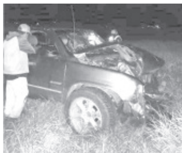
Por exceso de velocidad, dos jóvenes murieron, al impactar su camioneta Silverado contra un poste de concreto.

Zamora, Mich.- 30 de septiembre de 2021.- Dos jóvenes perdieron la vida, debido a las múltiples lesiones que sufrieron al impactar su camioneta contra un poste de concreto, en esta municipalidad de Zamora. A decir de las autoridades policiacas estos la unidad aparentemente era conducida a exceso de velocidad.