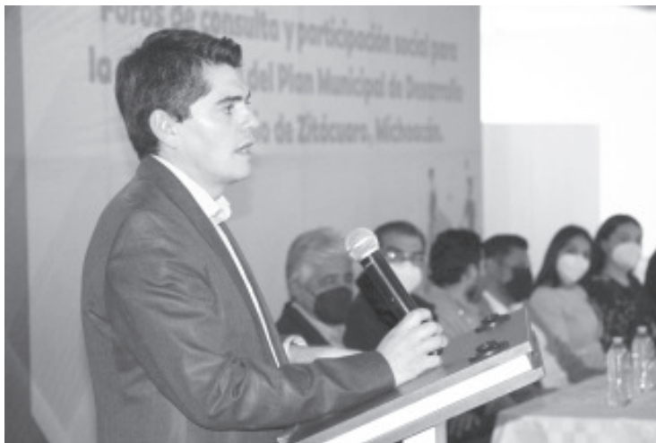
Este tipo de ejercicios que toman en cuenta las decisiones sociales, seguirán siendo la directriz que abandere su administración pública durante los próximos tres años.

-Presenta alcalde Foros de Consulta que involucra a la ciudadanía en proyectos para el desarrollo del municipio.