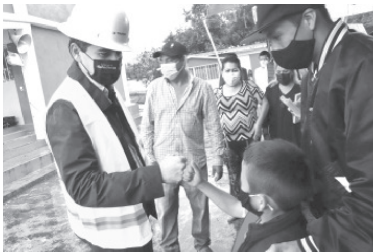
El presidente municipal dijo que trabajará intensamente para que todos los espacios educativos de Zitácuaro cuenten con mejores condiciones.

-Inicia construcción del domo de la primaria de la colonia Emiliano Zapata. - 1 millón 350 mil pesos será la inversión.