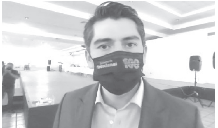
A un mes de haber asumido la Presidencia Municipal, reconoció que ha sido un periodo difícil en el que se ha conocido a detalle la situación del municipio.

Ante las adversidades que se presentan en todos los rubros, señaló que hay decisión de mejorar los servicios públicos, afrontar la crisis económica, de salud, continuar con el rescate de espacios que han sido perdidos y de mejorar la vida de los zitacuarenses mediante las 100 soluciones inmediatas.