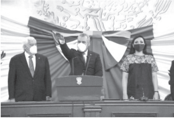
Como gobernador Constitucional del Estado, Alfredo Ramírez Bedolla, rindió protesta ante el pleno de la LXXV Legislatura, en el Palacio Clavijero.