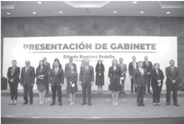
Mi equipo tiene la responsabilidad de servir al pueblo de Michoacán con honestidad y trabajo para sacar adelante a Michoacán.

Serviremos a Michoacán con honestidad y experiencia