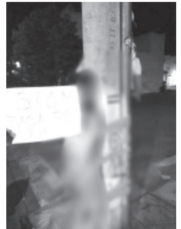
El presunto ladrón fue atado a un poste con un letrero: "Esto me pasa por rata", después fue entregado a la policía.

El individuo duró varios minutos en el referido lugar y luego de un rato las autoridades correspondientes se encargaron de él.