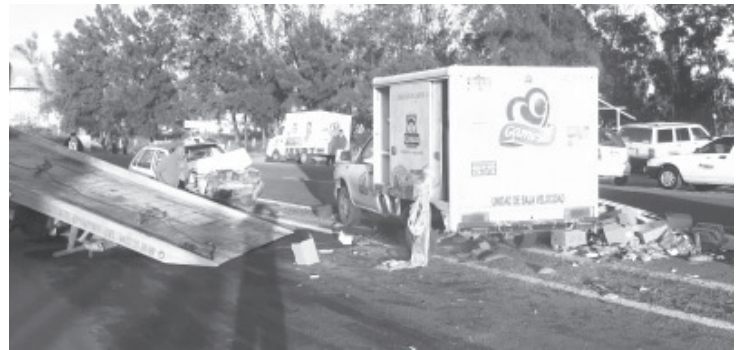
Cuatro enfermeras heridas cuando el taxi en el que viajaban protagonizó un choque-volcadura contra una camioneta repartidora de galletas.

Morelia, Mich.- Jueves 30 de septiembre de 2021.- Cuatro enfermeras resultaron con heridas menores luego de que el taxi en el que viajaban protagonizó un choque-volcadura contra una camioneta repartidora de galletas, el cual sucedió este día en la salida de esta ciudad hacia Charo, de acuerdo con la información recabada por esta agencia de noticias.