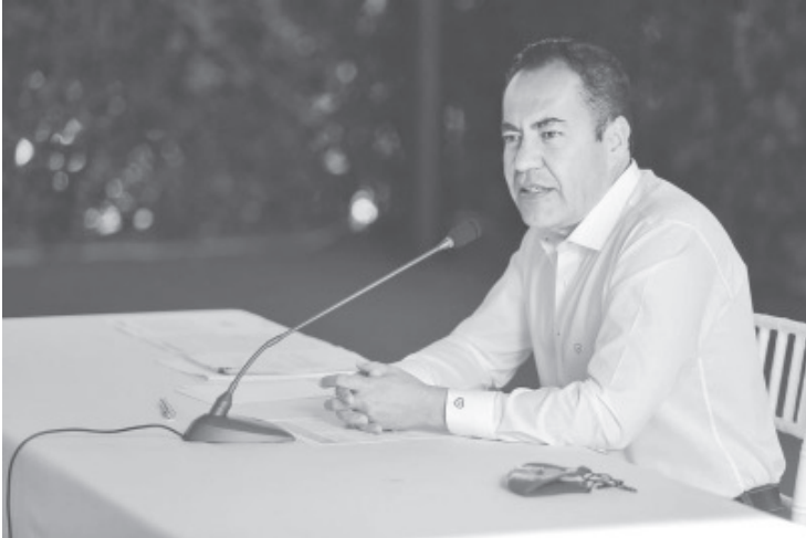
La resolución final de la Sala Superior del TEPJF siembra la duda en el futuro de Michoacán, tras una elección marcada por la violencia, las amenazas e irregularidades.