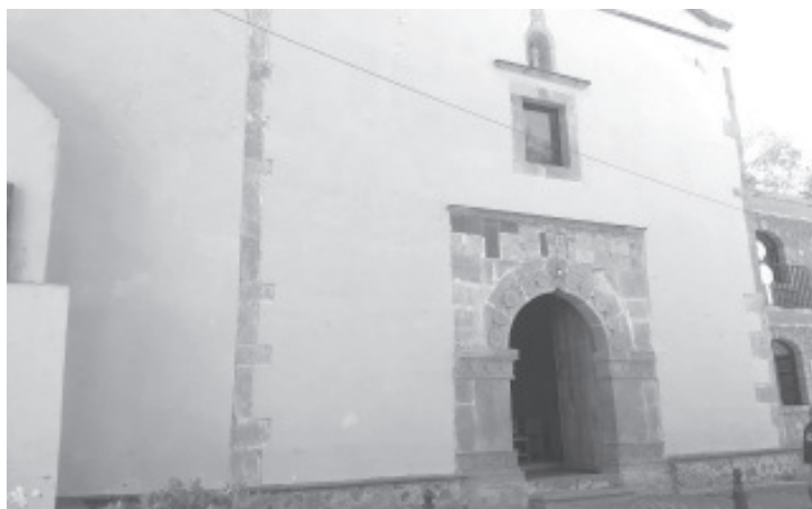
No habrá Feria del Mole, que este año estaría cumpliendo 25 años de su existencia, confían en que el próximo año la pandemia ya no sea un problema.

Respecto a los juegos mecánicos y puestos en la calle principal de esta tenencia, aseguró que no se sabe si cuentan con autorización; por parte de la iglesia no tienen prevista la feria a fin de evitar contagios.