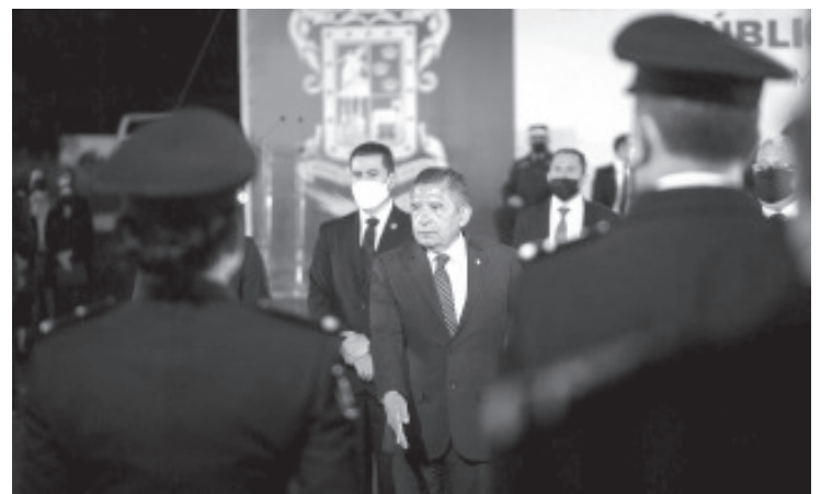
El General destacó que la seguridad pública del estado estará orientada en salvaguardar la vida, las libertades, la integridad y el patrimonio de las personas.

Añadió que se dará marcha a estrategias y mecanismos apegados al Plan Nacional de Seguridad 2018-2024, al programa sectorial de protección ciudadana, y a la estrategia nacional de Seguridad Pública, alineando el actuar del estado con la federación.