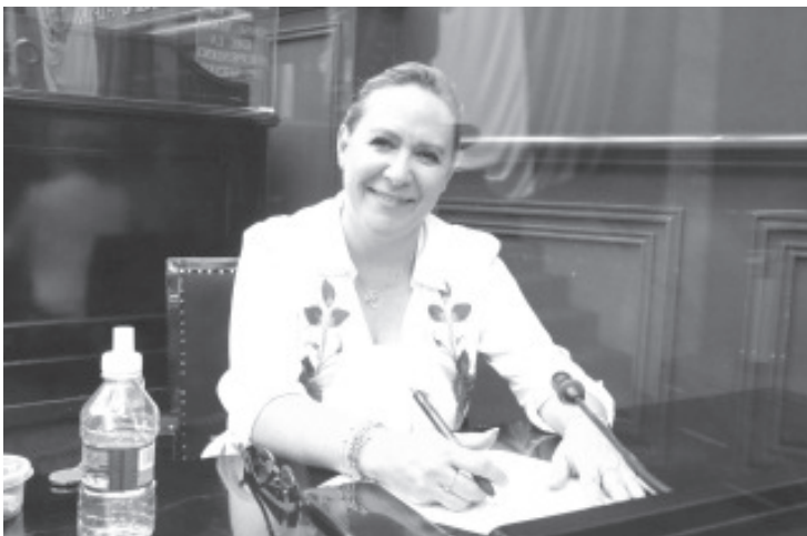
El interés debe ser Michoacán, por lo que es primordial que la gobernabilidad que se consolidó a lo largo de seis años mantenga su curso.