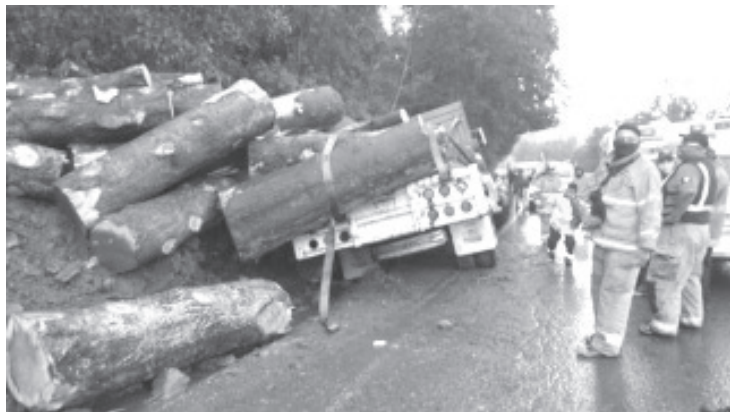
El conductor decidió dirigir el camión contra el talud, aunque muchos trozos de madera cayeron sobre la carretera y el accidente obstruyó parcialmente el paso de vehículos, no hubo desgracias personales,

El camión es marca International, con placas de esta entidad federativa