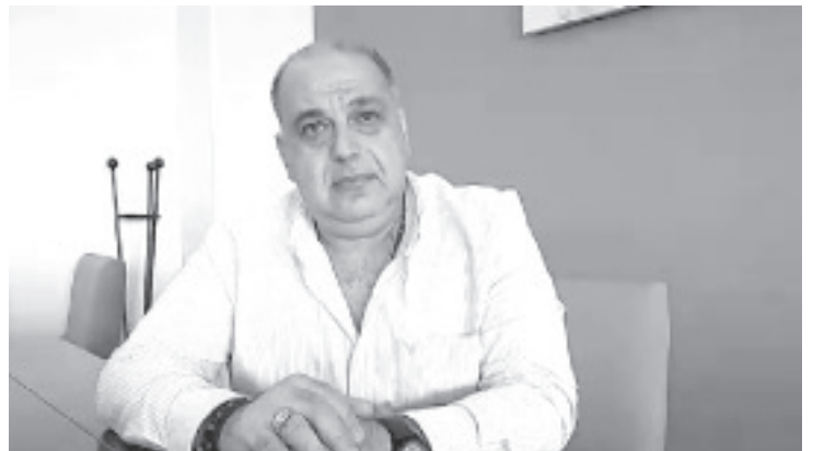
Podemos decir que hay mucho por hacer, pero nos estamos reorganizando, y vamos a terminar con ese distanciamiento que había con empresarios y comerciantes.

“Muchos me conocen y saben que soy una persona que trabaja, me gusta innovar, construir y estamos en el mejor de los ánimos”, indicó.