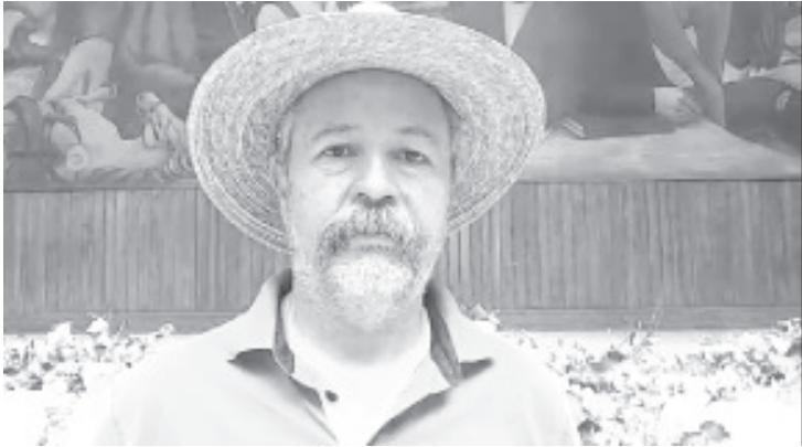
Se viene una crisis igual de fuerte por el desabasto de fertilizantes y agroquímicos, porque llegan los contenedores a los puertos, pero no los dejan entrar o tardan mucho para hacerlo.

- Se preve grave crisis por desabasto de fertilizantes y agroquímicos.