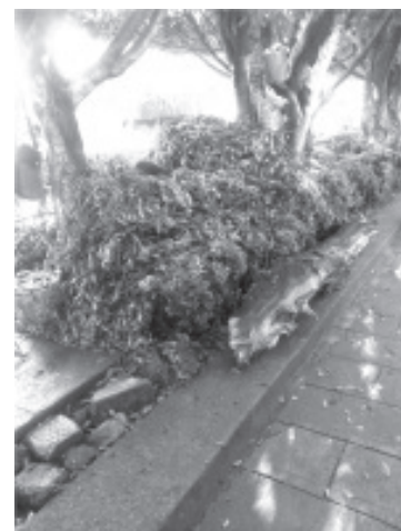
Uno de estos árboles, que se ubican sobre la calle Lerdo de Tejada, uno de sus ramajes se vino abajo la mañana de este lunes, afortunadamente no causó ningún accidente.