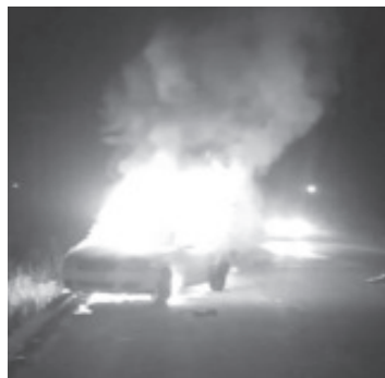
la pareja de la moto salió disparada, los ocupantes del auto lograron salir antes de comenzar a arder en llamas.

Al tener conocimiento de la emergencia al lugar se movilizaron los paramédicos de Protección Civil Municipal y Bomberos Voluntarios, estos últimos de inmediato comenzaron a sofocar el incendio, hasta que lograron extinguirlo por completo.