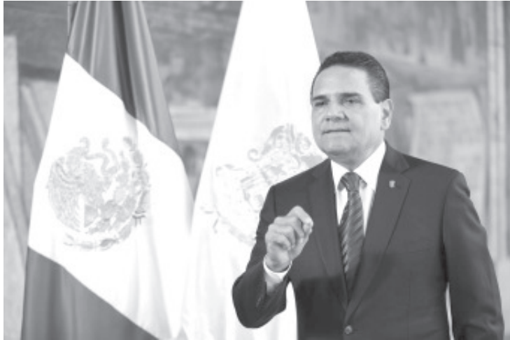
Hoy el Estado puede enfrentar con estrategia al crimen; si bien falta que el Gobierno de la República asuma las competencias y responsabilidades que por ley le corresponden.

Morelia, Michoacán, a 27 de septiembre de 2021.- Hoy Michoacán es un estado confiable, que rompió el pacto de impunidad, donde se acabaron las escuelas de palitos, se dignificaron y modernizaron los servicios de salud y las áreas de seguridad pública, y se sentaron las bases para detener el derrumbe financiero que se tenía, afirmó el Gobernador Silvano Aureoles Conejo.