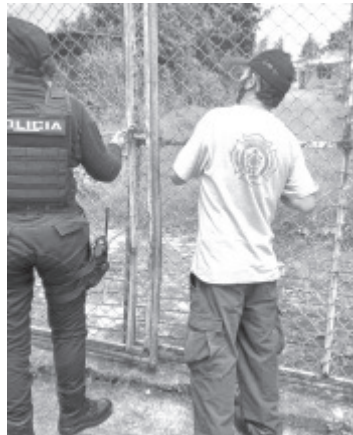
Vecinos informaron a la policía que una mujer, vecina, hacía como un mes que no la veían, al romper un candado, entraron y la encontraron sin vida

La femenina fallecida en vida respondía al nombre. X de aproximadamente 30 años de edad.