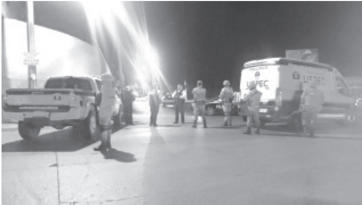
El fallecido quedó en el asiento del chofer, su auto es marca Chevrolet Chevy, de color guinda, con placas de circulación PFA528B.

Al concluir las diligencias de ley, el cadáver del afectado fue trasladado a las instalaciones del Servicio Médico Forense, para la práctica de la necropsia de rigor, para luego ser entregado a sus seres queridos. Voces policiacas dijeron a esta redacción que el difunto está plenamente identificado, pero no revelaron sus generales. Asimismo, el personal castrense, los municipales y los Guardias Nacionales hicieron diversos patrullajes por la zona, sin embargo al final de los recorridos no hubo detenciones relacionadas con el caso.