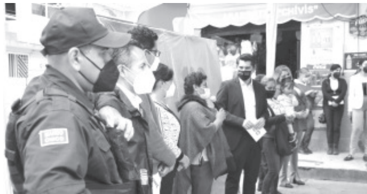
En esta colonia se instalará la red de Internet para que los estudiantes cuenten con esta alternativa tecnológica que les facilite su desempeño escolar.

Acompañaron al presidente municipal, Ixtláhuac Orihuela, en la celebración del acto, los demás integrantes del Cabildo, así como funcionarios de su equipo de trabajo.