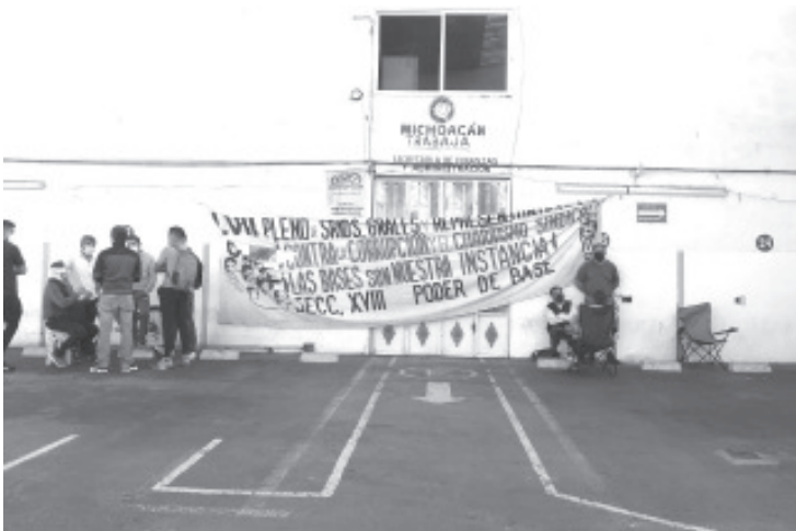
Habrà toma de Rentas toda la semana, además martes y miércoles la liberación de la autopista, jueves un bloqueo de la carretera Zitácuaro-Toluca a la altura de Conalep.

- Jueves bloqueo de la carretera Zitácuaro-Toluca