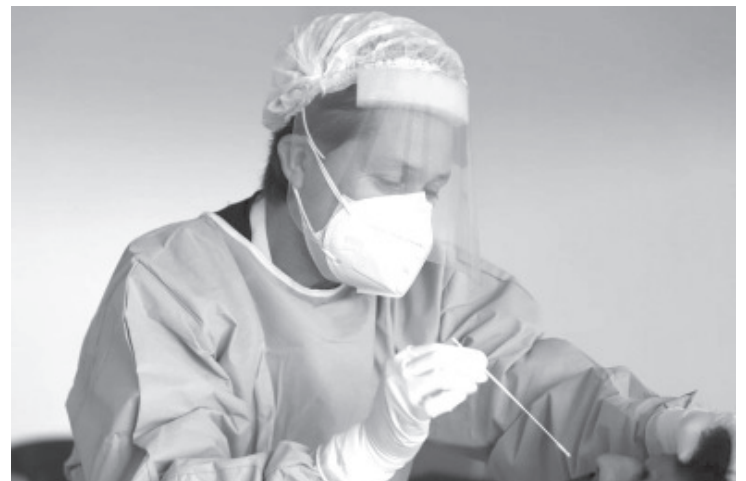
De 111 mil 497 casos confirmados de COVID-19 en el estado, en todos los grupos de edad, 9 mil 916 casos (8.8%) corresponden a menores de 20 años durante toda la pandemia.

Con la llegada de la temporada invernal, cada municipio toma las medidas correspondientes, de acuerdo con el comportamiento del virus en los mismos para prevenir una cuarta ola de contagios, junto a otras enfermedades respiratorias como influenza.