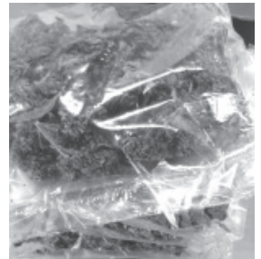
Personal de la SSP detuvo a 10 personas en Morelia, Uruapan, Zamora y Zitácuaro

La SSP hace un llamado a la población michoacana a reportar a las líneas de emergencia 911 y 089, toda acción ilícita que atente contra la seguridad de la ciudadanía.