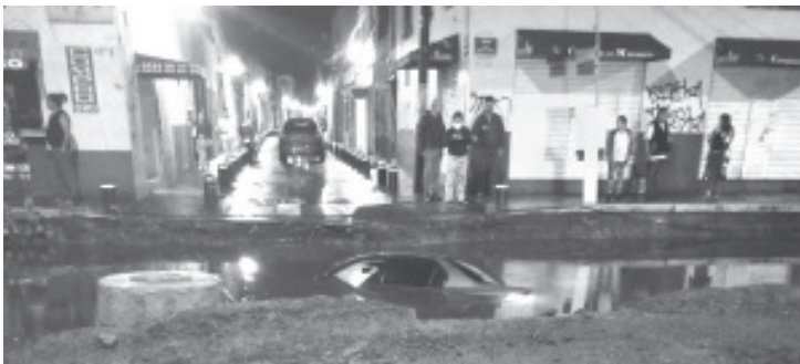
El coche en el que iba la dama terminó sumergido en el agua acumulada a consecuencia de las recientes lluvias. Ella sufrió una lesión en el cuello.

Morelia, Mich.- Domingo 26 de septiembre de 2021.- Una mujer resultó con una lesión leve en el cuello después de que el automóvil en el que viajaba cayera a la zanja que está en la Avenida Lázaro Cárdenas en esta ciudad de Morelia, la cual se hizo por las obras de construcción que se realizan en la zona. El coche en el que iba la dama terminó sumergido en el agua acumulada a consecuencia de las recientes lluvias.