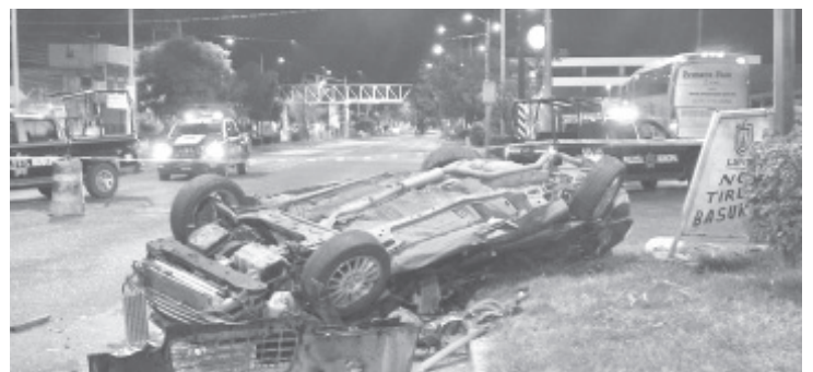
El coche circulaba sobre boulevard Lázaro Cárdenas, momento en que el camión dio vuelta al parecer para ingresar a la terminal de autobuses.

El área del incidente fue resguardado por personal de Seguridad Pública y de las correspondientes averiguaciones se hicieron cargo los agentes y peritos de la Fiscalía General del Estado. Siendo todos los datos anteriores recabados en la cobertura noticiosa.