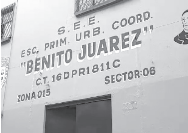
El director destacó que la prueba de antígeno nasal se hizo en un laboratorio particular, y se sabe que el alumno sólo presenta fiebre, pero se encuentra estable.

- La prueba se hizo en un laboratorio particular, el niño presenta fiebre, pero estable.