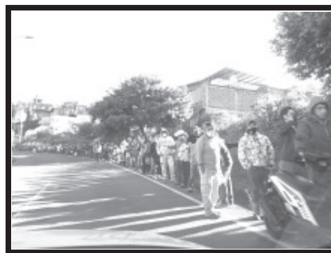
En el Centro de Convenciones, la fila iniciaba sobre Morelos, puerta de la unidad deportiva, boulevard SJNA y Héctor terán, al Centro de Convenciones.