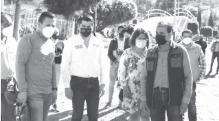
Mejorar los espacios públicos, es una demanda de la población y mi deber es corresponder con eficiencia, indicó.

-Participa alcalde en acciones de limpieza y rehabilitación de áreas públicas.