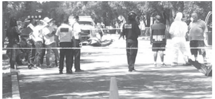
El ahora occiso está en calidad de desconocido, es de aproximadamente 30 años de edad; vestía camisa azul, pantalón de mezclilla azul y tenis negros

Los elementos de Seguridad Pública acordonaron la zona en apego a la cadena de custodia y para evitar algún otro accidente vial. Posteriormente, los peritos y los agentes investigadores de la Unidad de Atención Inmediata de la Fiscalía General del Estado de Michoacán realizaron la recolección de evidencias y de testimonios y al concluir las actuaciones el fallecido fue llevado a las instalaciones del Servicio Médico Forense de la región.