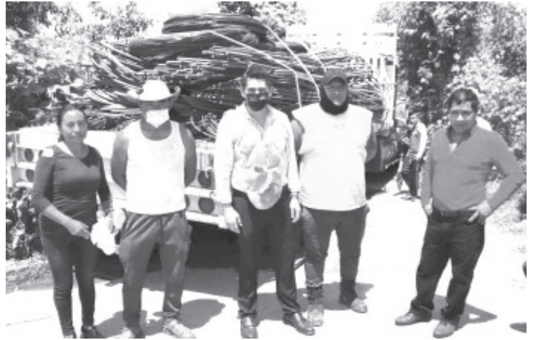
Es necesario crear una política que dé respuestas más rápidas, las soluciones en mi administración serán inmediatas.

Añadió que todos los comerciantes del mercado se sienten abandonados, ya que tampoco acuden inspectores de Servicios Públicos Municipales a vigilar que se cumplan las normas establecidas.