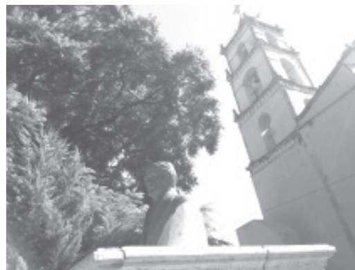
Estamos conscientes que siguen casos de Covid 19 y vamos a actuar de manera responsable, seremos congruentes con las disposiciones de las autoridades de salud.

Agregó que aunque no habrá festejo el 30 de septiembre, ya se ha solicitado a las autoridades municipales la mejora del centro de la tenencia como su quiosco, su jardín y sus principales calles. Esto para honrar a Don José María Morelos.