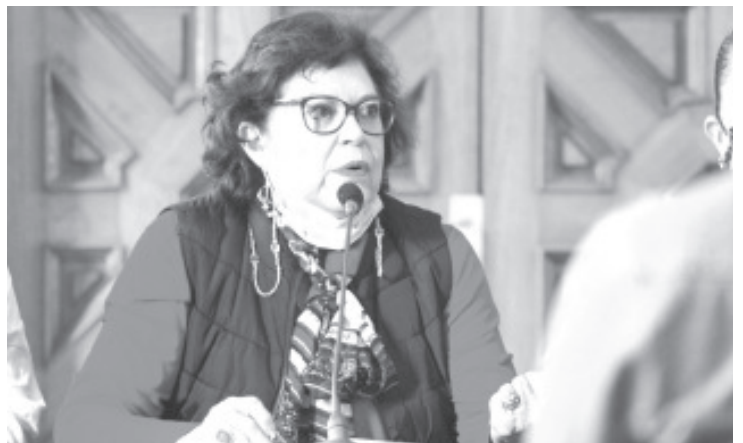
Familias en todo México se han organizado en colectivos para buscar en campo, instituciones, cárceles y calles, a sus seres queridos desaparecidos.

Las diputadas y el diputado presentes expresaron unánimemente la voluntad de apoyar a la Brigada de manera individual y colectiva, y la ferviente intención de acompañar a todos los colectivos, por encima de militancias partidistas, en su lucha por encontrar a sus familiares desaparecidos, pero también en la búsqueda por encontrar la sensibilidad desaparecida de muchos actores políticos y funcionarios públicos insensibles y ajenos a una de las problemáticas más delicadas y sensibles de la sociedad mexicana.