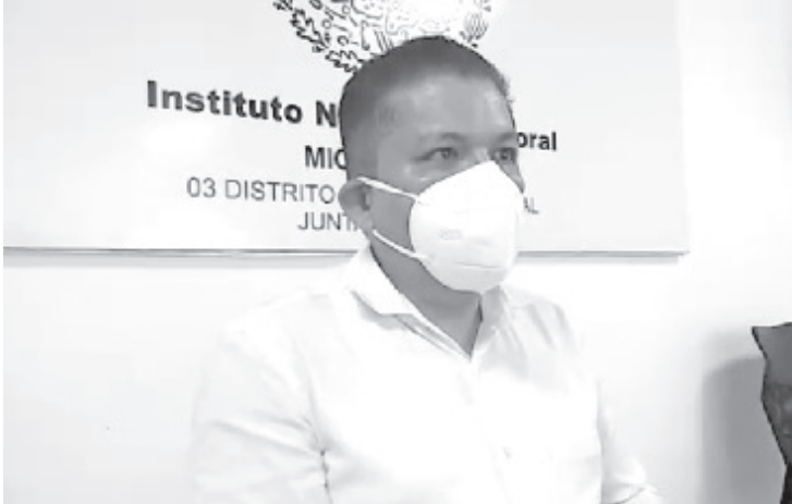
Michoacán, al igual que la Ciudad de México, Estado de México y Tamaulipas, son entidades que observan un menor ritmo de crecimiento poblacional, por lo que perderán distritos.

- Se definirá en el mes de noviembre durante una consulta