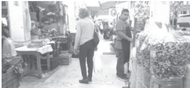
Un ladrón le arrebató la bolsa a una joven y se echó a correr, gracias a la intervención de locatarios, fue alcanzado sobre Avenida Revolución.