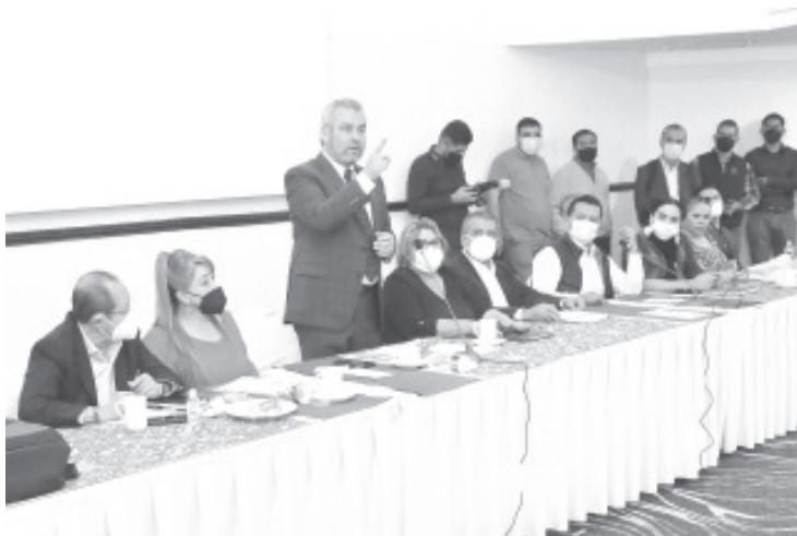
Ramírez Bedolla subrayó a liderazgos del partido que si bien gobernará para todo el pueblo de Michoacán, seguirá siendo militante de Morena, y se guiará bajo los principios del obradorismo.

Morelia, Michoacán, 24 de septiembre del 2021.- El gobernador electo de Michoacán, Alfredo Ramírez Bedolla, firmó la Alianza popular para continuar la transformación de México, documento emanado de la dirigencia nacional de Morena, con el cual se busca consolidar al partido como la principal fuerza electoral del país.