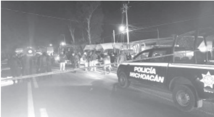
El tiroteo se registró la madrugada de este jueves en Valle Verde, cuando los uniformados realizaban un recorrido de vigilancia y repentinamente fueron atacados.

El área de los hechos fue acordonada y los especialistas de la Fiscalía Regional se encargaron de las investigaciones correspondientes, luego trasladaron los cadáveres a la morgue para la práctica de la necropsia de rigor. Los finados están en calidad de desconocidos.