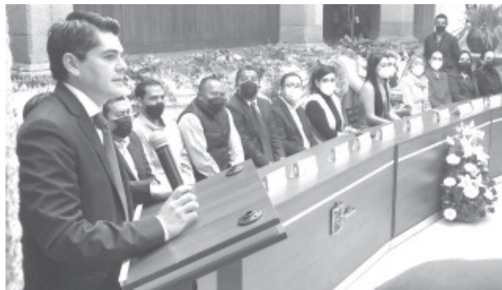
La Independencia de México no debe ser solo un recuerdo de la historia, sino debe vivir en cada corazón de los hombres y de las mujeres.

Originalmente en esta celebración, luego del acto se realiza en la Avenida Revolución el tradicional desfile del 16 de septiembre, al igual que el año pasado, este 2021 también fue suspendido.