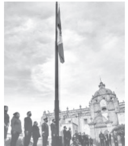
En punto de las 8:00 horas en la plaza Melchor Ocampo de la capital michoacana, alzaron la Bandera a media asta en compañía de los familiares de las víctimas del atentado.