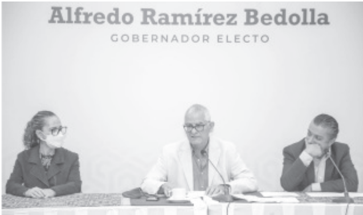
El presupuesto pasará de 65 mil 640 millones de pesos aprobados en el 2021 a 72 mil 120 millones de pesos propuestos para el 2022,