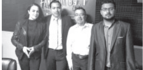
¡MUCHAS FELICIDADES! En el DÍA DEL LOCUTOR A Integrantes de RADIO FANTASÍA MUSICAL ZITÁCUARO Región Oriente.