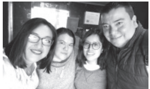
Fueron ¡FELICITADOS! En el DÍA DEL LOCUTOR El Equipo de Trabajo de las Estaciones de RADIO ZITÁCUARO Del Oriente de Michoacán.