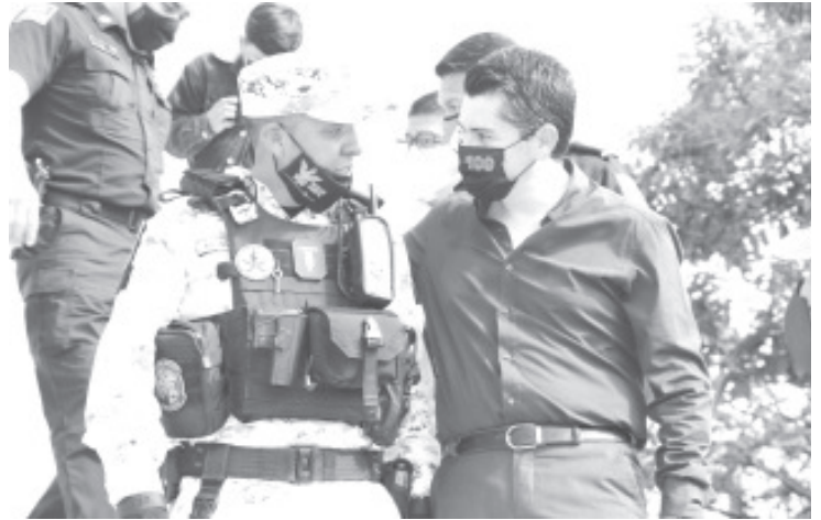
En este espacio, los vecinos de La Joya podrán realizar pagos municipales, solicitar servicios públicos y contarán con seguridad las 24 horas.