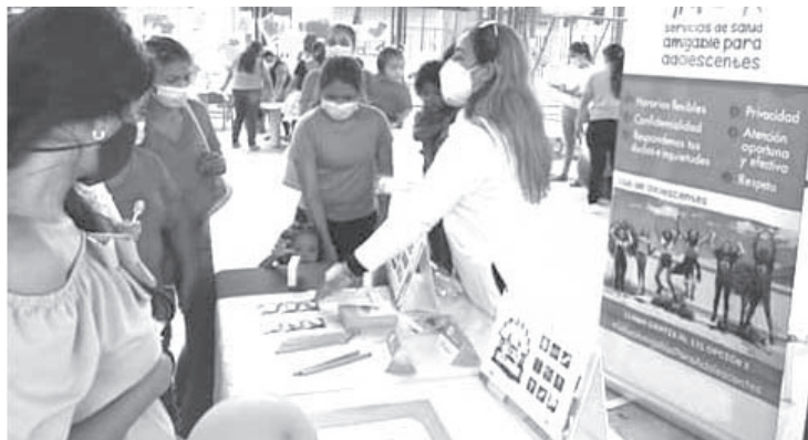
Las capacitaciones comprenden: un rally, periódicos murales y despejar todas las dudas de jóvenes en los temas de educación sexual y reproductiva.

Agregó que es vital que se prevenga este problema ya que representa un problema social que va en ascenso.