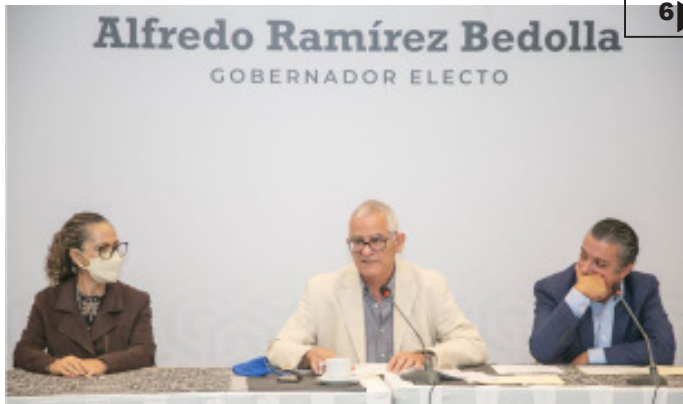
Alfredo Ramírez Bedolla GOBERNADOR ELECTO