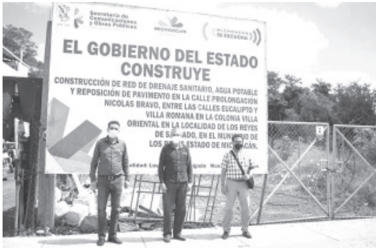
Entrega Gobierno estatal el acceso al Instituto Tecnológico Superior de Los Reyes, y diversas obras en la colonia Villa Oriental.

• Entrega Gobierno estatal el acceso al Instituto Tecnológico Superior de Los Reyes, y diversas obras en la colonia Villa Oriental