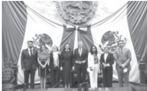
En próximas fechas comenzará una gira de trabajo para dar a conocer la apertura de su Casa de Enlace Legislativo y de igual manera impulsar el programa de servicios de gestión que tiene programado.

La nueva Legisladora dejó claro que desde su grupo parlamentario apoyará los consensos generados al interior del equipo por Michoacán a fin de que temas prioritarios que adolecen a la sociedad como la reactivación económica, la defensa de la mujer, la protección de niños, la seguridad, y el medio ambiente, entre otros puntos medulares, sean incluidos en la agenda legislativa a tratar en el próximo periodo ordinario de sesiones a comenzar.