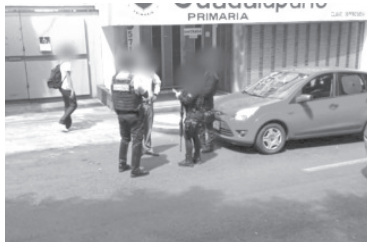
Cuando caminaba sobre Camelinas, en Morelia, después de retirar del banco 34 mil pesos, dos sujetos que viajaban en moto se los robaron.

Los uniformados le recomendaron a la víctima acudir ante un agente del Ministerio Público para denunciar la situación, a efecto de que se emprendan las investigaciones correspondientes.