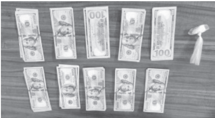
Los oficiales localizaron entre las pertenencias del investigado un envoltorio con la citada droga, así como 50 billetes de 100 dólares, que no pudo acreditar su legal procedencia.

Ante cualquier hecho que atente contra la seguridad y la tranquilidad, la SSP exhorta a la población a reportar a la línea de emergencias 911.