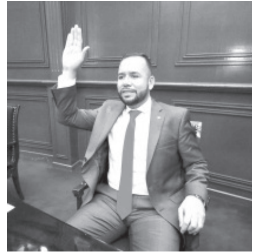
El Grupo Parlamentario del GPPT será un factor fundamental de la transformación en Michoacán desde el ámbito legislativo, afirmó su coordinador, Reyes Galindo.

Acompañaremos a nuestro gobernador Alfredo Ramírez Bedolla y las causas de las y los michoacanos, aseguró el legislador