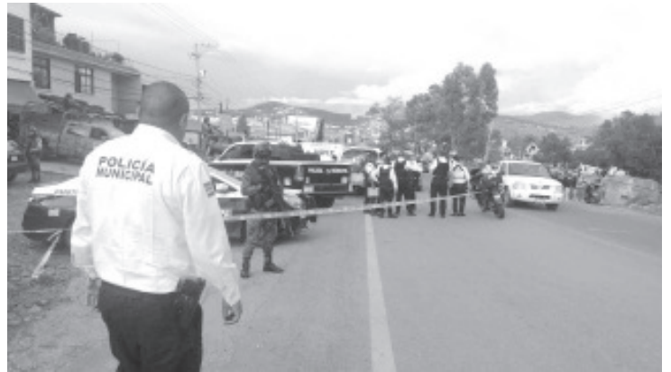
La camioneta Jeep, Patriot, negra con placas XKG 7212, presentaba orificios de bala en el parabrisas, los cristales laterales y el medallón.

Se desconoce quien o quienes perpetraron el crimen, así como su paradero y su móvil.