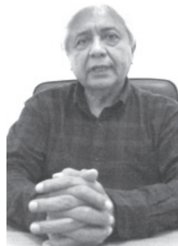
Se pretende sostener reuniones con todos los sectores de la economía local, como productores de: trucha, nochebuena, zarzamora, aguacate, guayaba, etc.

Destacó que los trabajos de la dependencia a su cargo comenzaron desde el primer día de septiembre, y continuarán de forma permanente. Se pretende sostener reuniones con todos los sectores de la economía local, como productores de: trucha, nochebuena,