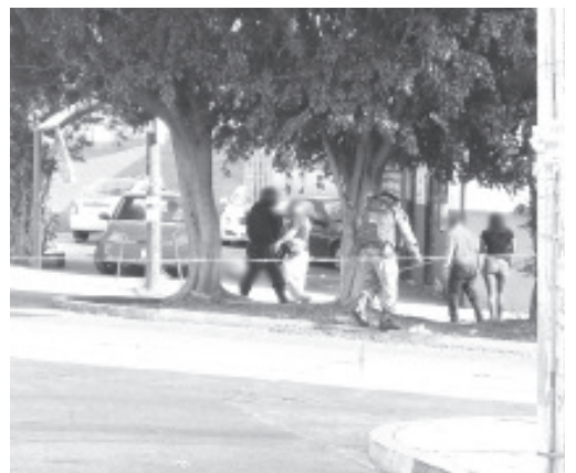
El móvil del homicidio es desconocido, así como la identidad de la víctima, misma que yacía a un lado de un coche color rojo.

Por último, el difunto fue trasladado a la morgue para la práctica de la necropsia de rigor. La Policía no reveló la media filiación del susodicho.