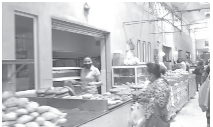
Es vital que todos cumplan con lo dispuesto por autoridades de salud y municipales, ya que esto ayudará a bajar el índice de contagios.

Dijo que en lo sucesivo se espera trabajar de la mano con la nueva administración municipal, la ventaja es que ya hay platicas, por lo que esperan que haya proyectos pronto, ya sea de mejora del lugar o de cualquier índole que beneficie a todos.