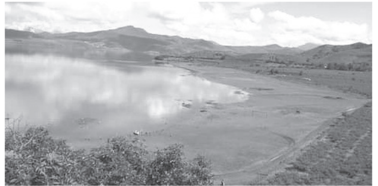
La Presa del Bosque fue construida en 1954 por la CFE y la Conagua, forma parte del Sistema Cutzamala, se encuentra a una altitud de 1,730 msnm y su profundidad es aproximadamente de 40 metros.

Desde su creación, además de ser fuente de ingresos para pescadores por la mojarra y la carpa que se produce, la presa del Bosque se ha convertido también en un espacio turístico al que vienen personas de otros municipios y de otros estados por el paisaje que ofrece a sus visitantes.