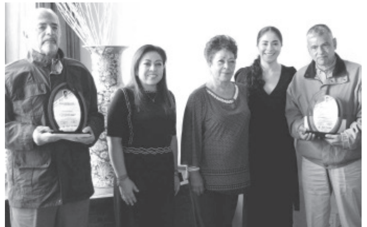
Para promover la vejez activa, saludable, plena, libre de prejuicios y discriminación finaliza el Concurso "Orgullo a la Persona Adulta Mayor, Michoacán 2021" organizada por el Sistema DIF Michoacán y el Coespo.

El concurso nació en el año 2020 en el marco de la contingencia por COVID-19, con el objetivo de enviar un mensaje de resignificación de la vejez y el envejecimiento, y al mismo tiempo un aliciente para las y los adultos mayores michoacanos.