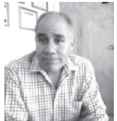
De acuerdo al convenio realizado por las notarías del país, al menos en Michoacán, el costo de un testamento no debe exceder los 1,740 pesos.

Luvianos Chávez, precisó que todavía falta mucha concientización en la población