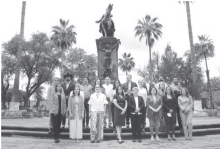
Por ello, los legisladores electos de los partidos PRD, PAN, PRI, PES, PVEM, condenaron las acciones instrumentadas, a través de un plantón, por Morena y el Partido del Trabajo.

Legisladores electos de PRD, PAN, PRI, PES y PVEM, condenaron las acciones instrumentadas a través de un plantón frente a Palacio Legislativo, que dolosamente ha buscado anular la labor del Poder Legislativo en Michoacán