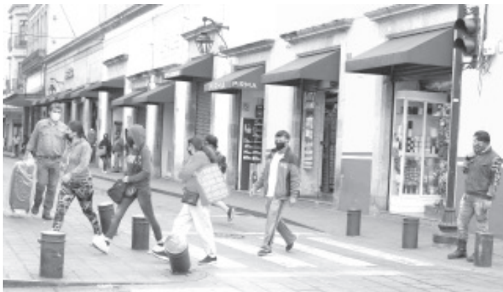
La SSM reitera a la población el llamado a no bajar la guardia en la implementación de medidas preventivas, principalmente aquellas personas que padecen diabetes, hipertensión u obesidad.

Asimismo, la institución mantiene a disposición de la población el 800-123-2890 con 11 líneas para resolver todas sus dudas, así como el microsítio bit.ly/MichCOVID-19