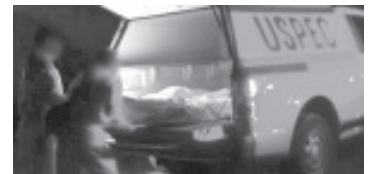
El cuerpo de un hombre maniatado fue encontrado en la vía pública de la colonia Medallistas Olímpicos, en la zona norte de Morelia.

Los uniformados acordonaron el área y alertaron a la Fiscalía General del Estado (FGE), cuyos elementos arribaron al sitio e iniciaron las investigaciones respectivas para esclarecer el asesinato. Por último, el cadáver fue trasladado a la morgue para la práctica de la necropsia de ley.