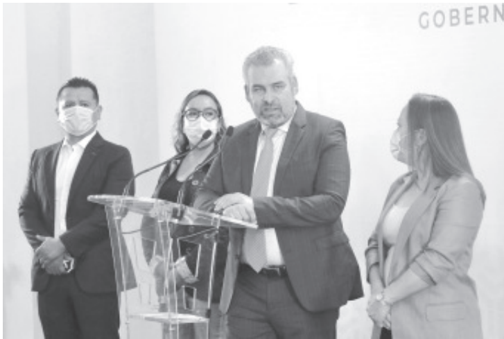
Bedolla dijo que el acuerdo establece que a partir de octubre y hasta diciembre del 2021 la federación enviará 2 mil 17 millones para el pago de quincenas, bonos y aguinaldos.

Morelia, Michoacán, 13 de septiembre del 2021.- El gobernador electo, Alfredo Ramírez Bedolla, convocó al magisterio michoacano a establecer una nueva relación con su gobierno a partir del primero de octubre, y trabajar juntos para superar los problemas de déficit presupuestal en el sector educativo.