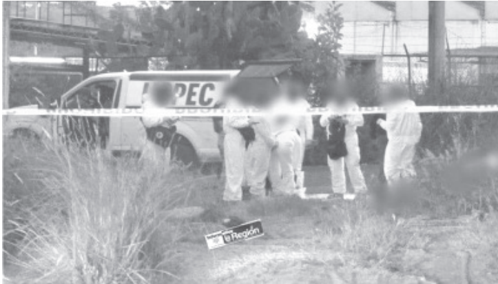
Cinco hombres ejecutados y maniatados fueron encontrados en la vía pública de la colonia Ciudad Industrial de Morelia

La identidad de los finados es ignorada y las autoridades policiales no proporcionaron la media filiación de los susodichos. Los especialistas de la Unidad de Servicios Periciales y Escena del Crimen (USPEC) realizaron las averiguaciones correspondientes y trasladaron los cadáveres a la morgue para la práctica de la necropsia de rigor.