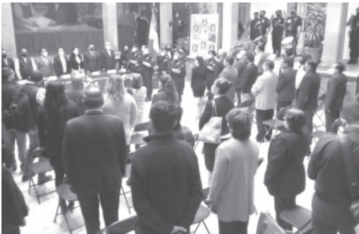
La oradora oficial recordó la hazaña que protagonizaron los jóvenes cadetes durante la defensa del Castillo de Chapultepec.

- Autoridades Municipales conmemoran el 174 aniversario de la Gesta Heroica de los Niños Héroes