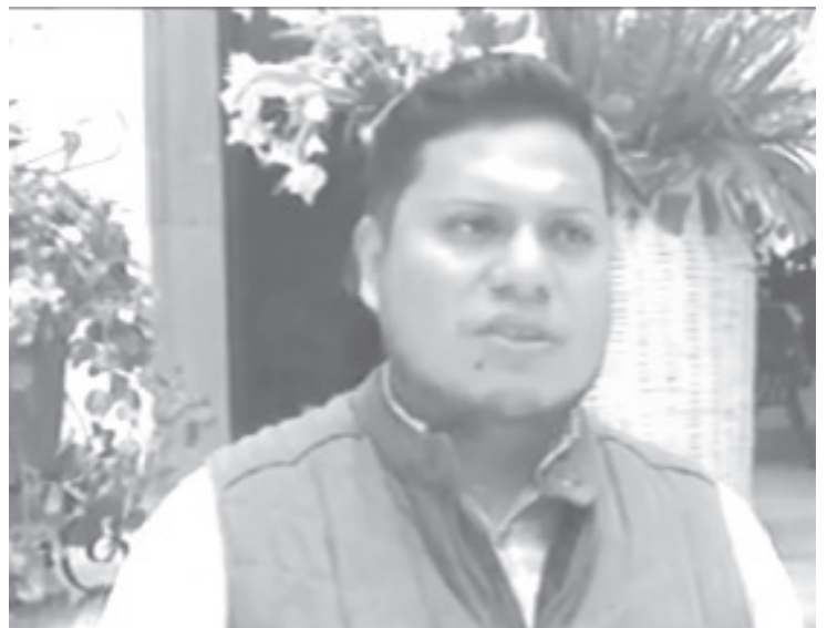
Pondrá en marcha talleres y conferencias, tanto virtuales como presenciales, para atender temas de orientación vocacional, sexual, adicciones, violencia.