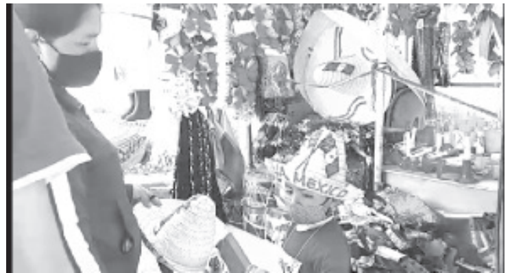
:Quienes más compran son los niños y maestros, así como padres de familia, pero al no haber clases no lo hacen, esto ya se ha visto reflejado en sus ventas de todos los días.

operación del rastro; no se ha hablado con ellos pero la solución de este tema es urgente, ya que la carne que consume toda la población sale de este lugar.