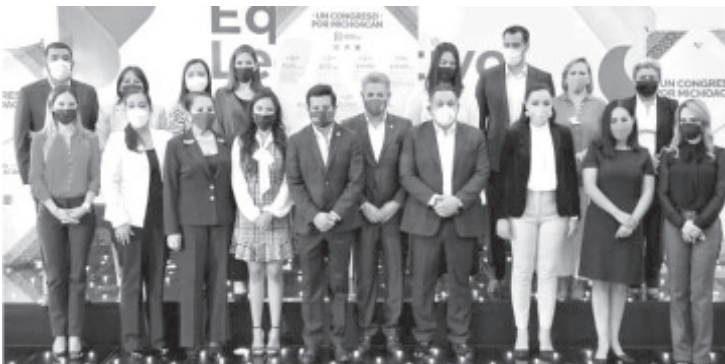
PRD, PAN, y PRI en el Congreso, serán el equilibrio y contrapeso responsable que requiere nuestro Estado, lo que representa una importante tarea y salir unidos con propuestas para superar las situaciones.

“Desde el Congreso del Estado, no dejaremos de alzar la voz, siempre abanderando las causas justas, en congruencia con nuestros principios, hoy estamos aquí, dando la batalla por el Michoacán que todas y todos merecen”.