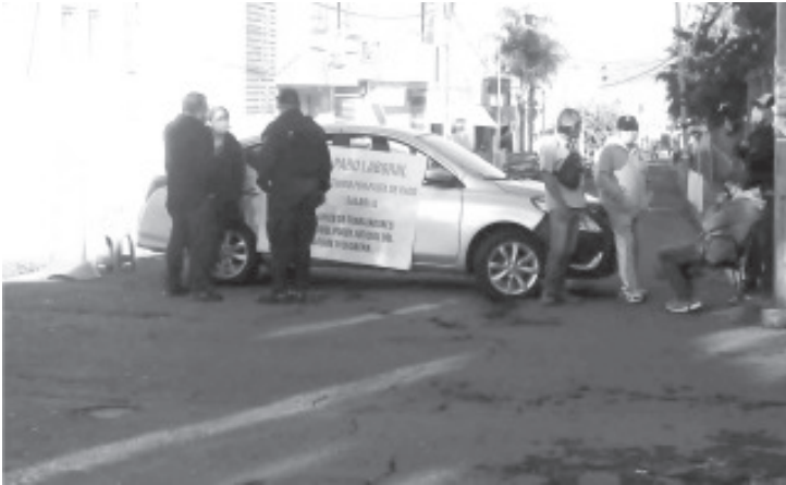
Desde las 9:00 de la mañana, hasta las 2:00 de la tarde, los inconformes se mantuvieron en el lugar, atravesaron vehículos y colocaron cartulinas dónde plasmaron su protesta.

- Sigue la falta de pago a los trabajadores