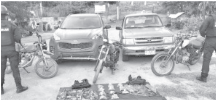
La secretaría de Seguridad Pública (SSP), aseguró 5 vehículos de los cuales 3 cuentan con reporte de robo y 2 con alteraciones en sus medios de identificación.

En caso de emergencias, a través de las líneas 911 y 089 se brinda apoyo las 24 horas del día.