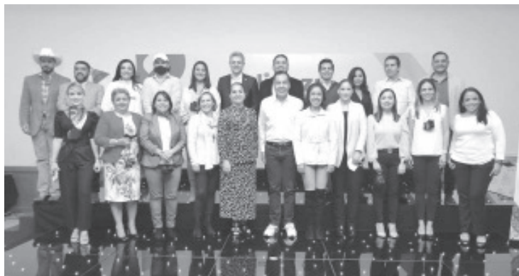
Los órganos directivos del PRI-PAN-PRD dieron respaldo, acogimiento y solidaridad al proyecto de gobernabilidad que planteó Herrera Tello, el cual está dividido en siete ejes.

confianza de su pueblo y además, tienen el conocimiento para lograrlo", finalizó el zitacuareño.