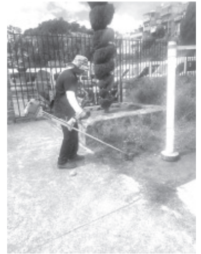
La mayoría de los espacios tienen un deterioro importante, eso es a causa de la falta de mantenimiento que ha persistido desde hace varios meses.

H. Zitácuaro Michoacán, 08 de septiembre municipal, la oficina de Parques y Jardines, de 2021.- Por: Guadalupe Solache Rebollo. comenzó el rescate de las áreas verdes del Desde el primer día de la actual administración municipio, se espera que estos primeros días