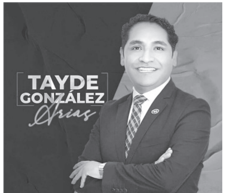
El evento sea transmitido mediante Facebook live, la página del FLO, evento gratuito y apto para todo el público.