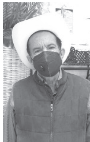
No es viable una rehabilitación, ya que esto sería más costoso y no habría certeza total de un cambio; lo más recomendable es un rastro TIF que funcione de forma regional.

En todos los trabajos, dijo que tomara en cuenta a las diferentes uniones de tableros y personas que están involucradas en la