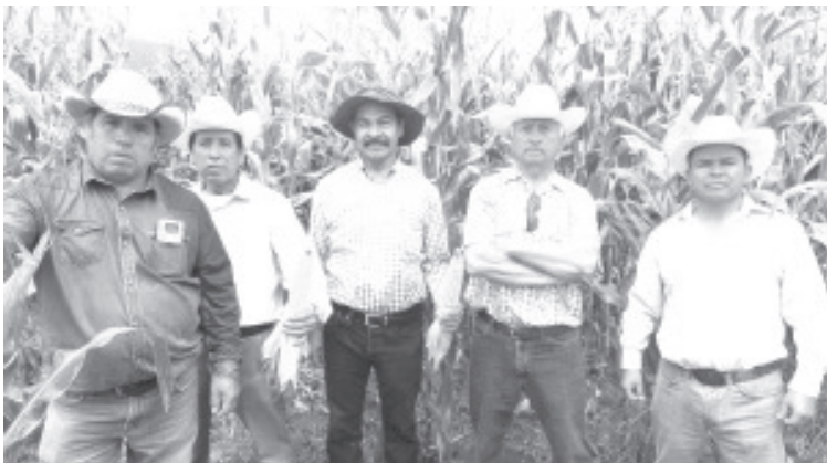
El Programa de Agricultura Sustentable ha impactado en más de 27 mil hectáreas de tierras agrícolas en Michoacán, las cuales han abarcado 43 cultivos de granos, frutos, hortalizas y flores.

Además de incrementar los volúmenes de producción, el Programa de Agricultura Sustentable contribuye de manera importante al cuidado y protección del medio ambiente, suelo, tierra y agua, pues los bio-insumos utilizados lejos de generar daños al entorno, recuperan la fertilidad de los suelos.