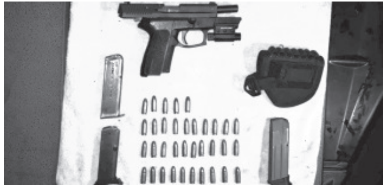
Encontraron un Cadillac con las puertas abiertas y en aparente estado de abandono, localizando en el interior un arma calibre .9 mm., 3 cargadores y los cartuchos útiles.

En caso de emergencias, a través de las líneas 911 y 089 se brinda apoyo las 24 horas del día.