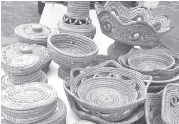
Este tipo de actividad representa la única oportunidad de los artesanos para poder vender los artículos que elaboran durante el año.

Confío en que las ventas sean buenas, pues artesanos han estado varios meses sin vender y esperan sacar al mercado un porcentaje importante de todo lo que han ido elaborando y que han mantenido guardado.