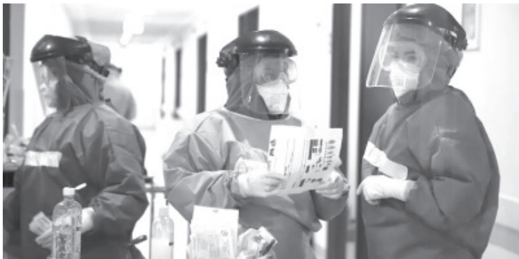
De acuerdo con el reporte epidemiológico con corte al 9 de agosto, Michoacán registra una letalidad de 7.88 por ciento, lo que representa 6 mil 169 defunciones.

A quienes no se han inmunizado, es importante que acudan a vacunarse al módulo que corresponda, para lo cual registrarse en la página https://mivacuna.salud.gob.mx/ , donde se les generará un expediente que deben presentar junto con una identificación oficial.