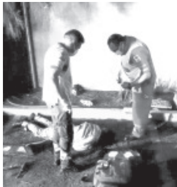
El hombre que sufrió traumatismo craneoencefálico, se presume que trató de meterse a hurtar a las instalaciones del Holiday Inn.

Los contactos añadieron que el lesionado