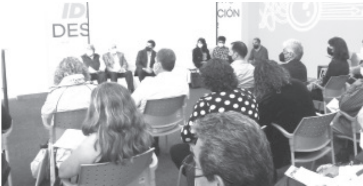
Hoy se tocó el tema del agua, el martes se abordará el foro: “Buenos servicios públicos”, el miércoles “Zitácuaro seguro” y el jueves “Agenda Económica.

- Pone en marcha “Fotos Consultivos Especializados”