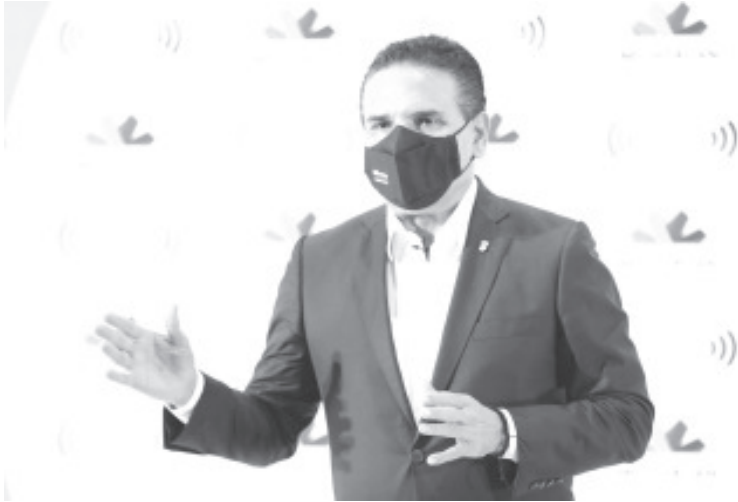
Las condiciones de contagio, y el propio semáforo naranja en el estado, indican que el regreso a clases sólo puede suceder en nivel de bachillerato y universidades.

Morelia, Michoacán a 9 de agosto de 2021.- El estado de Michoacán, registra cifras “nunca antes vistas” en esta tercera ola de contagios por COVID-19, advirtió el Gobernador, Silvano Aureoles Conejo, quien precisó que no hay condiciones para el regreso a clases presencial de niñas y niños.