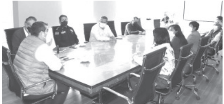
Se reducen actividades deportivas grupales, no habrá permisos para la extensión de horarios. Se cancelan todo tipo de eventos masivos, fiestas patronales, ferias, jaripeos y festividades en salones.