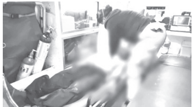
Un joven herido por proyectiles de arma de fuego, era llevado al área de urgencias de un hospital, pero falleció al llegar.

Cabe señalar que los policías implementaron una recorrido por la zona en busca de los agresores, sin que se tenga reporte de alguna detención relacionada con el caso.