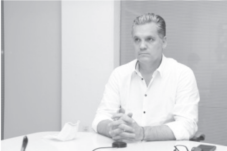
El titular de la Sedeco informó que Michoacán registra actualmente una Tasa de Desocupación Laboral de 2.5 %, el quinto mejor resultado a nivel nacional, de las entidades federativas.

-A pesar de los estragos ocasionados por la pandemia, asegura el titular de Sedeco