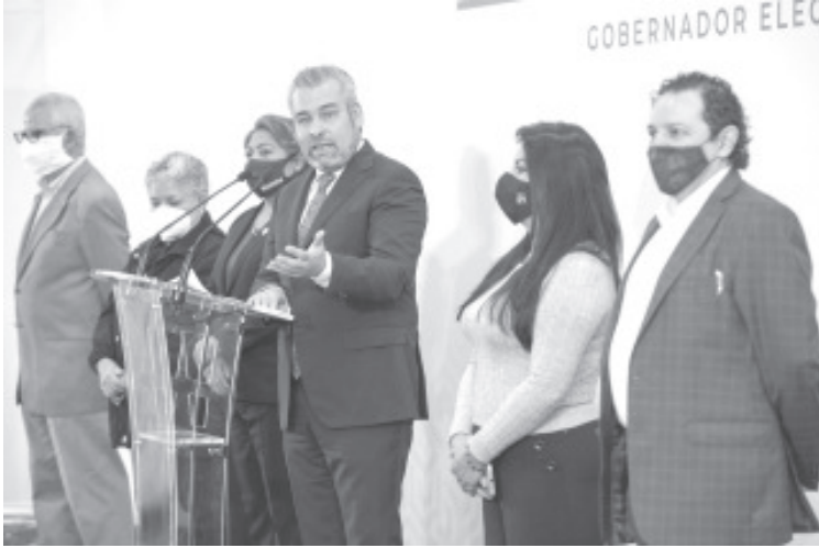
Ramírez Bedolla informó que promoverá una reforma a la Ley Orgánica de la Administración Pública de Michoacán, con el propósito de adelgazar la estructura de gobierno, disminuir el gasto corriente.

Morelia, Michoacán, a 9 de agosto del 2021.- Alfredo Ramírez Bedolla, gobernador electo de Michoacán, anunció que a partir del 1 de octubre se implementarán cambios en la administración estatal con la finalidad de disminuir los costos de operación del gobierno estatal, y mejorar la recaudación fiscal.