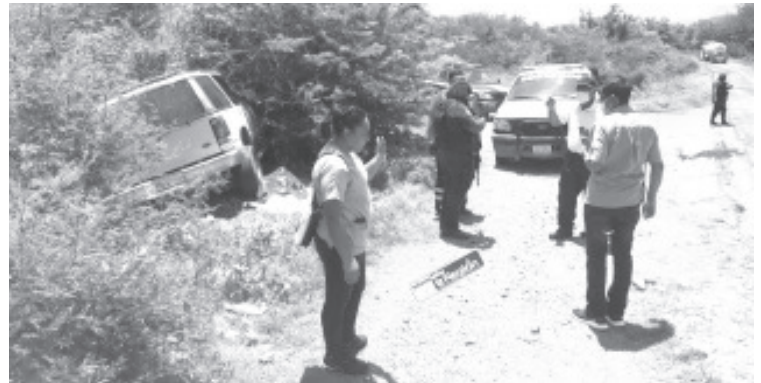
La camioneta chocó contra un árbol, teniendo como resultado el fallecimiento de una mujer adulta y una niña, además un hombre herido.