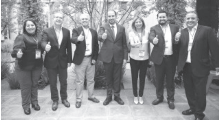
Salud, campo, atención a grupos vulnerables, economía, turismo y desarrollo social, principales temas que abanderarán los legisladores federales del PAN en el estado.