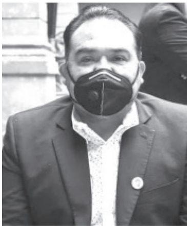
El juicio político debería ser para quienes han permitido que la delincuencia se fortalezca e instale en el país, ya que no se puede pretender contra quien está defendiendo a su estado.

Coincidieron que a diferencia del Ejecutivo Federal, el Gobernador Silvano Aureoles ha actuado con suma responsabilidad, al luchar por Michoacán y defender la entidad, y acudir ante diversas instancias.