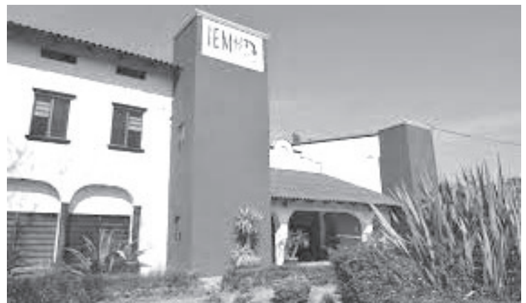
IEM aprobó la reasignación de una diputación plurinominal del PRI al Partido MORENA, en acatamiento a la sentencia del Tribunal Electoral del Estado de Michoacán.

Es de mencionar que, con la modificación de constancias a las fórmulas antes señaladas, no genera modificación alguna al principio de paridad en la integración del H. Congreso del Estado de Michoacán