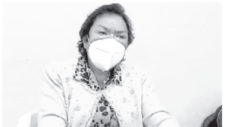
La Presidenta de la Unión de Contribuyentes Grupo Dos, señaló que esta situación no es nueva, han tenido este tipo de inconveniente desde que inició la actual administración.

Insistió que la gente está inconforme pero no se queja porque tiene miedo, lo único que quieren es salir adelante. “Por la pandemia debería haber apoyo del gobierno pero no es así”.