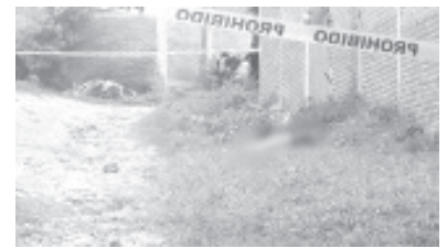
Hombre fue hallado en la vía pública de la colonia San Juanito Itzicuar, ubicada al poniente de Morelia, estaba maniatado.

De igual manera, en el área se presentaron los especialistas de la Unidad de Servicios Periciales y Escena del Crimen (USPEC), dependientes de la Fiscalía General del Estado (FGE), quienes iniciaron las investigaciones correspondientes y trasladaron el cadáver a la morgue para la práctica de la necropsia de rigor.