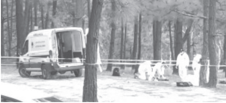
Un hombre fue asesinado de un escopetazo y su cadáver quedó tendido en un camino rural del Ejido de Barbechos, de la tenencia de Aputzio.

Zitácuaro, Mich.-julio de 2021.- Un hombre fue asesinado de un escopetazo y su cadáver quedó tendido en un camino rural del Ejido de Barbechos, el cual está en la Octava Manzana de la localidad de Aputzio de Juárez, perteneciente a este municipio de Zitácuaro, de acuerdo con la información obtenida por esta agencia de noticias.