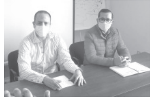
Ya rompimos la racha sin casos, la semana pasada se registraron 11 y esta son 6; en total 20 casos activos”, esta es en Zitácuaro.

“Debemos tener claro que la tercera ola de la pandemia va a llegar a todos los lugares, a nivel local ya está pasando, por varias semanas no subían los casos, se mantenían planos los datos, y ahora ya se está viendo una curva, ya rompimos la racha sin casos, la semana pasada se registraron 11 y esta son 6;