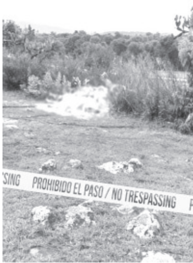
La policía confirmó que se trataba de los restos de 6 masculinos en avanzado estado de putrefacción y con huellas de violencia.

Las víctimas fueron trasladadas al Servicio Médico Forense local para que se les practique la necropsia de ley y continuar con los actos de investigación respectivos que permitan el pleno esclarecimiento de los hechos.