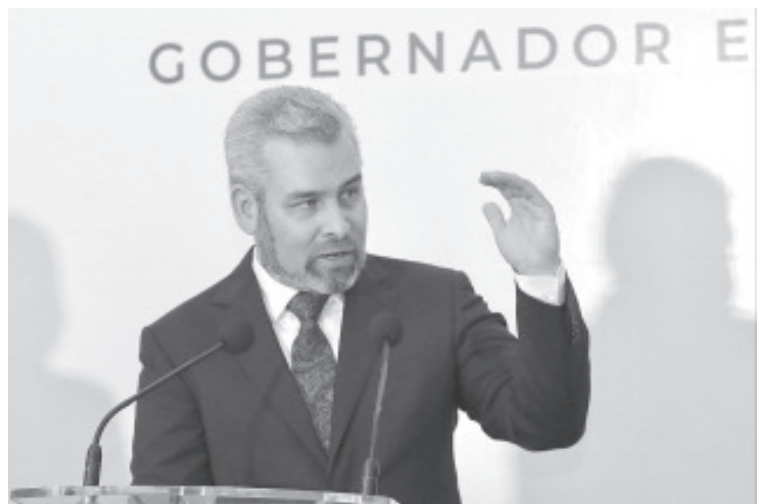
Ramírez Bedolla anticipó que su gobierno fortalecerá el combate a la delincuencia con labores de inteligencia financiera.

La Unidad de Inteligencia Patrimonial, abundó el gobernador electo, tiene como objetivo prevenir, detectar y combatir las operaciones con recursos de procedencia ilícita, por lo que su función será clave para debilitar las estructuras patrimoniales y económicas de la delincuencia.