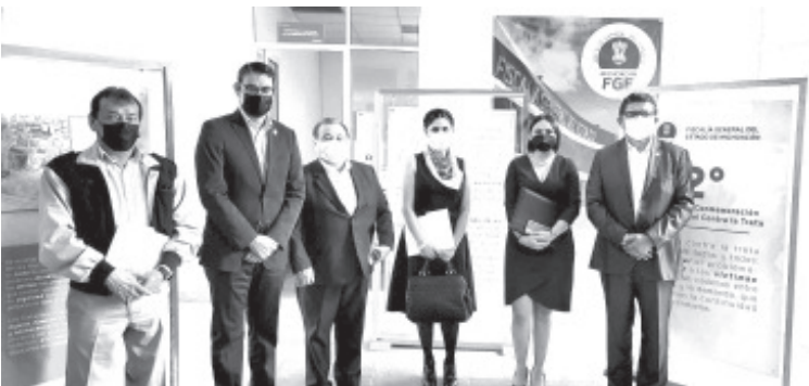
Participaron niñas, niños y adolescentes de 6 a 17 años de edad, quienes mediante estas imágenes expresaron cómo perciben este delito.