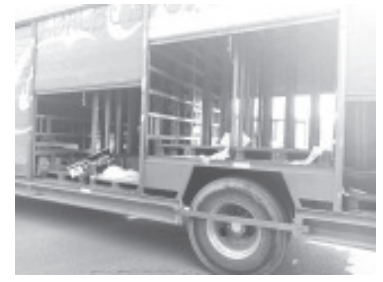
Los camiones pertenecen a las compañías Coca Cola y Pepsi que fueron saqueados por las estudiantes, después permitieron que los choferes se los llevaran.

Para evitar ser agredidos los choferes obedecieron. Los camiones pertenecen a las compañías Coca Cola y Pepsi, los cuales fueron saqueados por los estudiantes y minutos después los hombres permitieron que los pilotos de los automotores se los llevaran y se retiraran del lugar. Las compañías reportaron a la Policía una merma de casi 100 mil pesos por los productos robados a cada camión, es decir unos 200 mil pesos en mercancía hurtada.