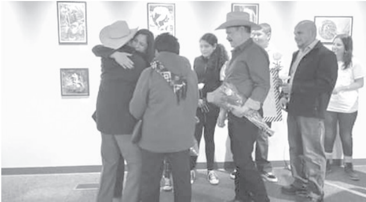
Ese anhelo, ese sueño de muchas personas no se concretó por la falta de organización y nos quedamos con ese pendiente, todavía esas personas que se quedaron varadas, han venido a preguntar.

- Cuando cerró la Oficina de Pasaportes se asignaría una persona responsable, no se hizo