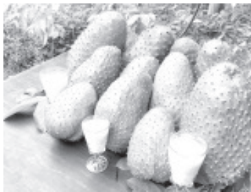
Los municipios de Coahuayana, Aquila, Nuevo Urecho y Taretan, son los que le dan el 3er lugar a Michoacán en el cultivo de este fruto, en el cual participan 79 familias productoras.

Es árbol pequeño, de 3 a 8 metros de altura y ramificado desde la base, despidiendo mal olor