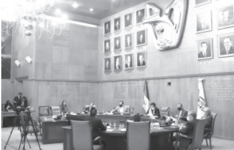
El Anteproyecto de Presupuesto 2022 se formuló considerando también la modernización operativa, con recursos destinados a atender el rezago tecnológico de los procesos sustantivos institucionales.

El H. Consejo Técnico del Instituto Mexicano del Seguro Social (IMSS) aprobó el Anteproyecto de Presupuesto para el Ejercicio Fiscal 2022, el cual considera como prioridad la atención médica, enfocándose en la recuperación de los servicios médicos postergados por la atención a la pandemia de COVID-19, garantizando el recurso financiero para brindar los insumos y servicios médicos a la derechohabencia.