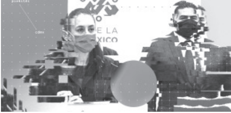
El 19 de marzo de 2020, la Secretaría de Seguridad Ciudadana de la Ciudad de México adjudicó de manera directa un contrato por 259 millones 979 mil pesos a Pixkítec.