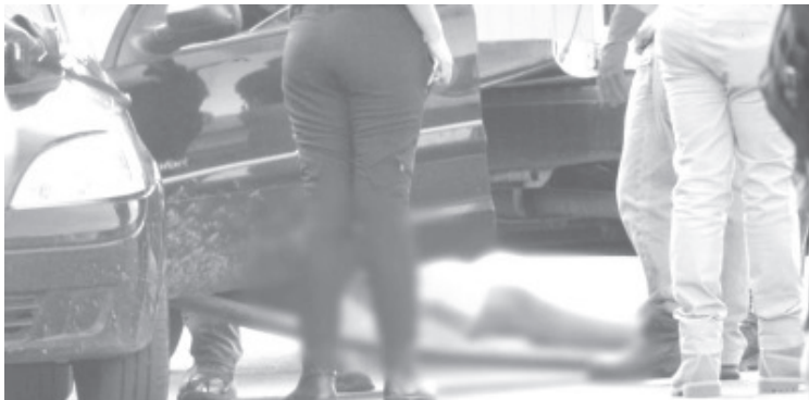
Un custodio del Cereso de La Piedad y Ex policía de Zamora, fue asesinado a balazos cuando viajaba a bordo de su automóvil sobre la zona Centro de Zamora.

Uniformados de los tres niveles de gobierno, Policía Michoacán, Policía Municipal, Guardia Nacional, se movilizaron al sitio y a bordo de un automóvil Chevrolet tipo Corsa, color negro, con placas PFZ-881-