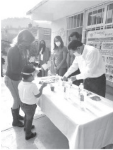
Se tienen destinadas 70 mil botellas de cloro, 70 mil frascos de gel antibacterial, 140 mil cubrebocas y 4 jabones por alumno. Se entregarán toallas sanitarias a niñas que ya las necesitan.