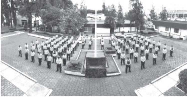
El Gobierno de México, a través de la Conafor, envía a un segundo contingente de 101 combatientes para contribuir con las tareas de extinción de los más de 300 incendios forestales activos.

101 personas combatientes y técnicos especialistas en fuego viajan de México a la provincia de Columbia Británica, Canadá, como parte de la colaboración binacional que tiene lugar dentro del Grupo de Trabajo de Bosques de la Alianza México-Canadá (AMC).