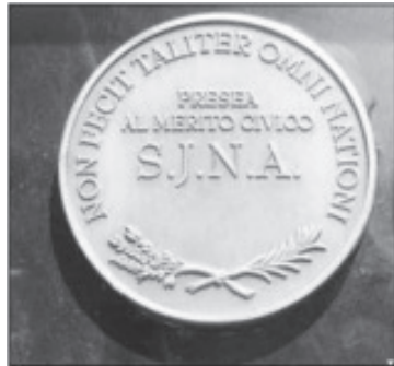
Se pueden recibir propuestas, tanto en las oficinas de la Secretaría del Ayuntamiento, como en la regiduría, con la Presidenta de la Comisión de Educación, hasta el 30 de julio.

Como cada año la Presea se entregará el 19 de agosto, durante la sesión solemne.