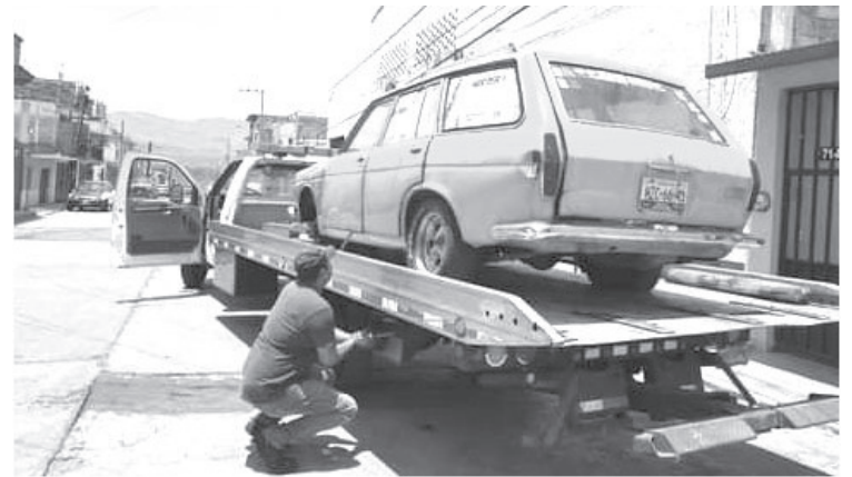
Antes de llevarse el vehículo se le notifica al dueño que tiene un plazo de 24, hasta 72 horas y si no hay respuesta, con una grúa se retira del lugar.

Agregó que la mayoría de carros que se han retirado han sido de las orillas de la zona urbana, uno de los principales lugares en los que han estado trabajando es en el FOVISSSTE, y estas acciones continuarán de forma permanente porque es una forma de dar seguridad a la población.