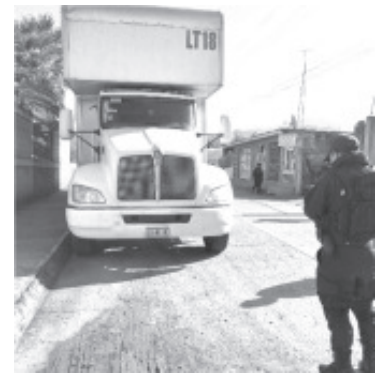
La acción operativa se registró en la tenencia de San Felipe, sitio donde el personal policial detectó un camión de la marca Kenworth, en aparente estado de abandono.

líneas 911 y 089 se brinda apoyo las 24 horas del día.