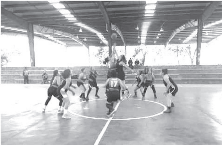
Se han retomado actividades deportivas en grupo como: el futbol, voleibol, basquetbol, frontón, y otras mas; en todo momento se acatan las medidas sanitarias.

-Las actividades casi están en la normalidad