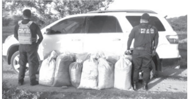
En la carretera Huetamo-Churumuco, fueron localizados 10 costales con la droga marihuana dentro de una camioneta.

A través de las líneas de emergencias 911 y 089 puedes denunciar cualquier hecho ilícito que atente en contra del bienestar de las y los michoacanos.