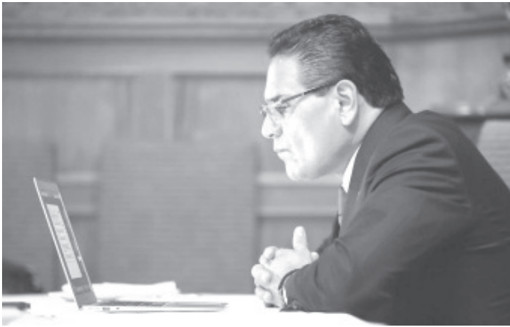
El gobernador explicó la necesidad de atender la violencia focalizada generada por los conflictos y presencia de grupos delincuenciales, de ahí que se ocupa urgentemente el respaldo de la federación.

• Grupo de Inteligencia Operativa desplegará refuerzos en zona de Zamora para abatir violencia