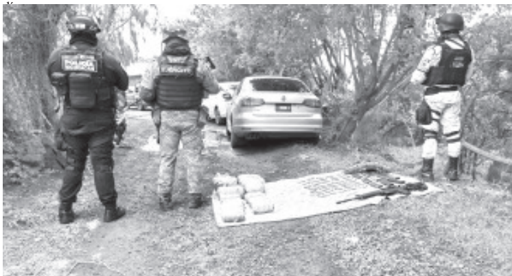
Fueron asegurados dos vehículos, donde fueron encontrados un fusil, 400 cartuchos útiles, 11 cargadores, 9.25 kilogramos de marihuana, así como 200 envoltorios con metanfetamina.

En caso de emergencias, a través de las líneas 911 y 089 se brinda apoyo las 24 horas del