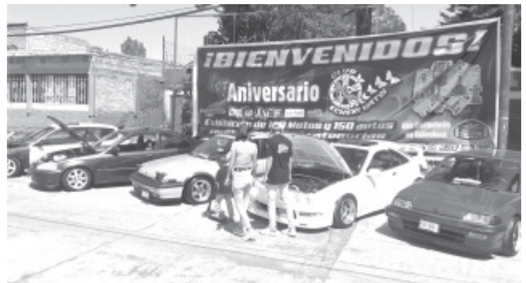
En total, participaron en exhibiciones un total de 100 motos y 150 autos multimarca y categorías, entre ellos femenil, clásicos y tuneados.

Apegados a los lineamientos que marcan las autoridades de salud en Michoacán, todos los y las participantes del evento portaron cubrebocas, tuvieron distancia social y convivieron de manera sana.