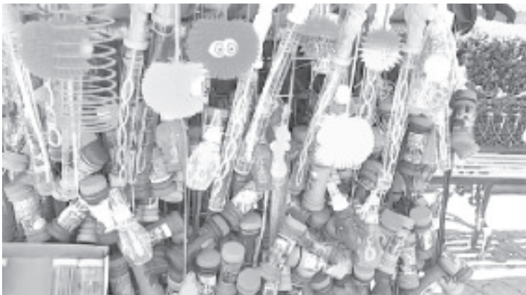
Actualmente muchos "globeros" siguen sin salir a vender, se han dedicado a otra forma de trabajar, pues no están seguros, temen que nuevamente se cierren plazas.

Entre los productos que venden hay todo tipo de globos, burbujas, pelotitas, figuras inflables, rehiletos, y otros juguetes. En total son 18 personas las que se encuentran en el padrón de esta unión