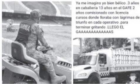
Ya me imagino yo bien bélico. 3 años en caballería 13 años en el GAFFE 2 años comisionado con licencia en cursos donde lloraba con lágrimas de triunfo en cada operativo... para terminar gritando ‘llegó el gaaaaaas’

Y me narró como era que a los militares de Chile comenzaron a llamarles “milicos”, haciendo una yuxtaposición de los términos militar y mico... de cómo les asignaban las tareas más infames, como la de barrer