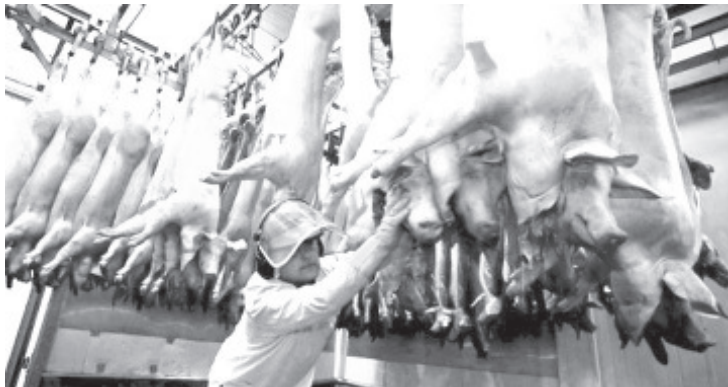
Fuentes oficiales de la Secretaría de Desarrollo Rural y Agroalimentario en el estado, dieron a conocer que en La Piedad se obtienen más de 20 mil toneladas, tanto en pie como en canal.

A nivel mundial, México se sitúa en el décimo quinto lugar con una producción de un millón 502 mil 523 toneladas en canal; en tanto que China es el líder en producción de carne porcina en canal con 52 millones 733 mil toneladas.