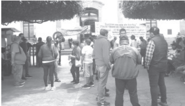
El magisterio democrático ha realizado acciones de protesta para exigir el pago de 6 bonos pendientes, así como la liquidación de la quincena que les adeudan.

En caso que la autoridad estatal siga sin atender sus demandas, advirtieron que en los siguientes días se tienen previstas otras acciones.