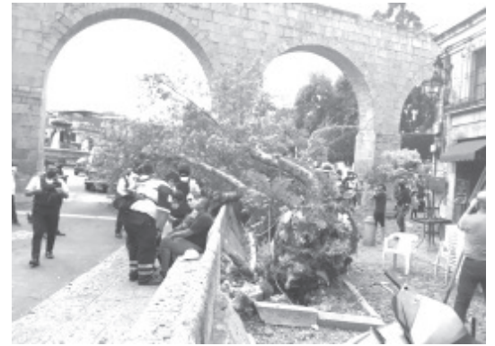
El hecho sucedió la tarde de este jueves a la orilla de la avenida Madero Oriente, a pocos metros del Callejón del Romance y de la Plaza de Villalongín.

En las labores de ayuda participaron civiles, patrulleros municipales y vigilantes del Agrupamiento Tigre.