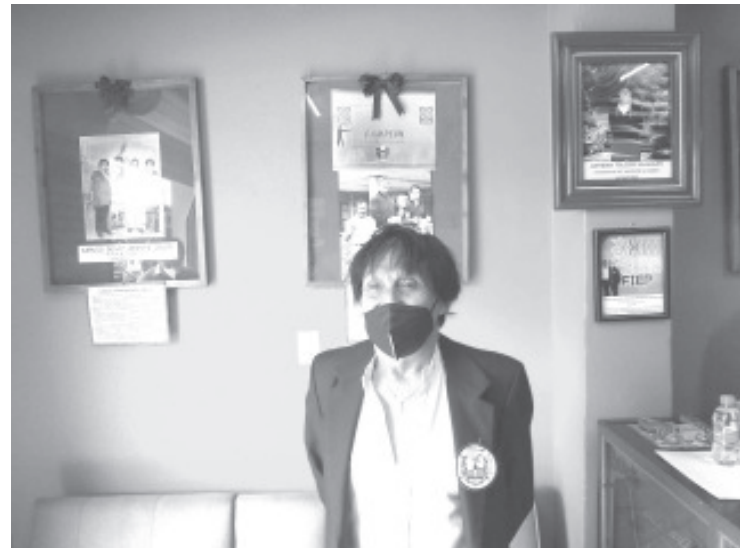
Este año ingresarán 2 deportistas internacionales, 2 nacionales, 2 locales, 2 populares y 2 entrenadores. La fecha límite para la recepción de expedientes será el 31 de agosto.