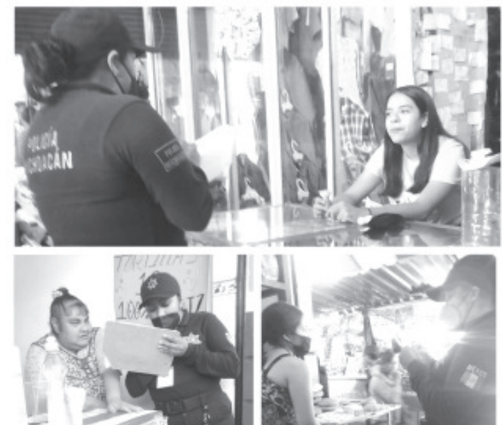
El Gobierno municipal a través de la Secretaría de Seguridad Pública, impulsa la conformación de redes de mujeres en distintos puntos de la ciudad.

Por medio de la proximidad social, las y los elementos de la Policía mantienen un acercamiento con la ciudadanía, no solo con mujeres, sino también con personas del sexo masculino para fomentar la igual y el respeto de los derechos humanos.