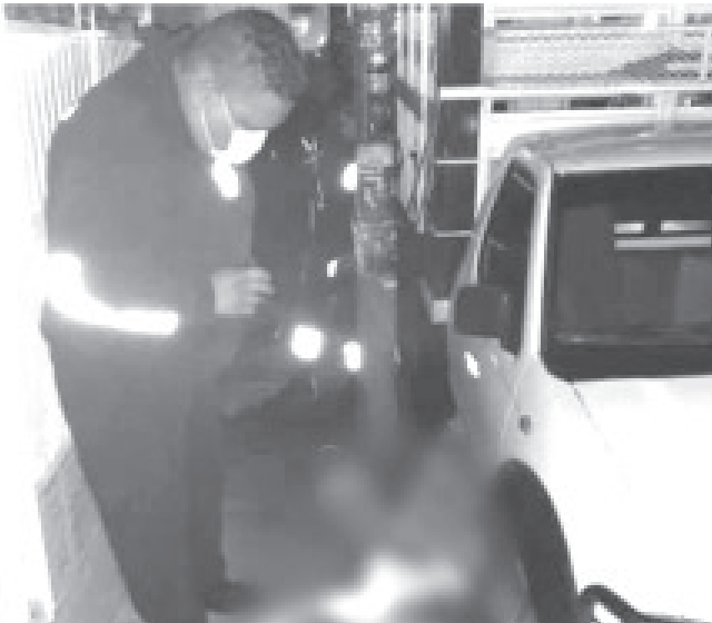
Los ahora occisos no fueron identificados en el lugar de los hechos, se trata de un hombre de entre 30 y 35 años de edad y una mujer de aproximadamente 30 años.

Al sitio arribó el personal de la Unidad de Servicios Periciales y Escena del Crimen, cuyos peritos procesaron el área de intervención y embalaron alrededor de 10 casquillos percutidos calibre 9 milímetros, después trasladaron los cadáveres a la morgue local en espera de que sean identificados por sus deudos.