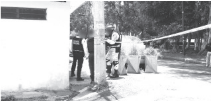
El hombre comenzó a sentirse mal y se desmayó, paramédicos llegaron y solo confirmaron que había fallecido.

Al enterarse del caso, la Fiscalía General del Estado (FGE) envió a sus elementos de la Unidad de Atención Inmediata para que se encargaran de las averiguaciones correspondientes. Del difunto solo se supo que tenía aproximadamente 70 años de edad.