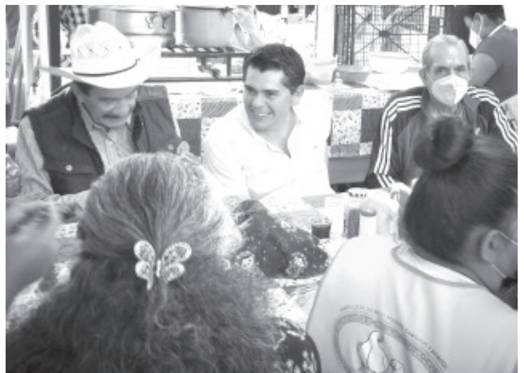
Zitácuaro necesita urgentemente un comercio fuerte, pues es la base de la actividad económica en el municipio, por eso seremos unos aliados como gobierno.

En ese mismo tenor, los locatarios del Mercado Melchor Ocampo, expresaron sus necesidades, pero también su voluntad de coadyuvar en las acciones de gobierno que sean necesarias para reactivar de forma definitiva al comercio zitacuarenses.