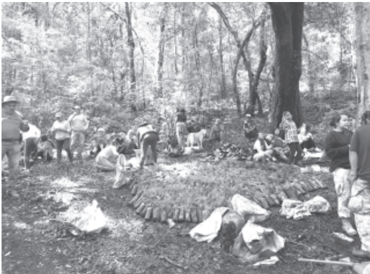
Los arbolitos son pino y oyamel, fueron donados por el municipio de Ocampo y particulares, que se sumaron a esta causa, Zitácuaro no produjo planta por falta de recursos.

“Es difícil, pero esperamos que un 70% de los arbolitos sobreviva, tomemos en cuenta que El Cacique es el principal pulmón del municipio, nos abastece de agua y de oxígeno, ojala todos le apostemos a este cerro”.