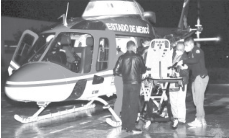
El donador fue un joven de 19 años que falleció en el Hospital General de León Guanajuato, de la SS y gracias a la generosidad de su familia que dió una esperanza de vida a un niño.

-El donador fue un joven de 19 años del estado de Guanajuato. -La exitosa procuración se realizó durante la madrugada de este viernes.