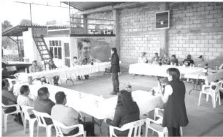
"Ahora me toca a mí agradecer y trabajar por sacar adelante a Nicolás Romero, les aseguro que será una tenencia que goce de un avance considerable en infraestructura".