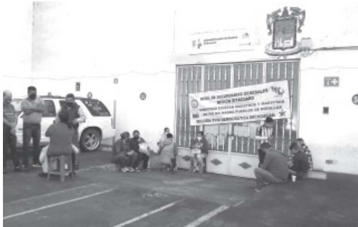
Un grupo tomó la Administración de Rentas, otro grupo, el denominado Poder de Base, se apostó en la autopista Zitácuaro-Lengua de Vaca y permitió el libre peaje a los vehículos.

Agregó que los afectados por esta falta de pago son más de 32 mil maestros que tienen plaza estatal. En los siguientes días se contemplan otras acciones más, pero se decidirán por parte de los Secretarios Generales, podrían ser toma de oficinas, carreteras y marchas.