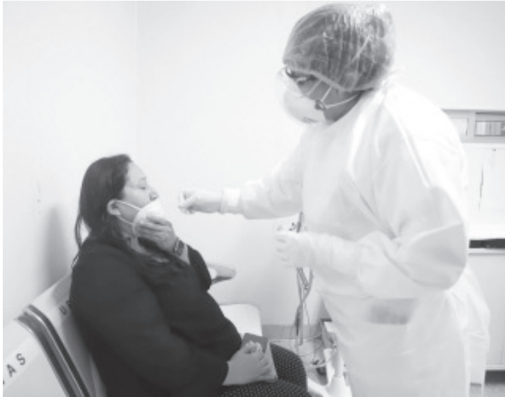
La importancia de los MARSS en el país ha sido lograr diagnósticos oportunos de esta enfermedad con el objetivo de cortar la cadena de contagio.