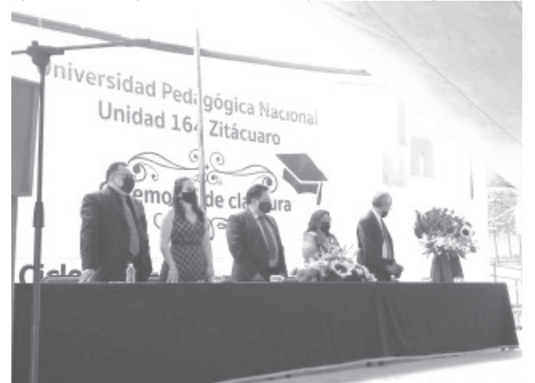
Martínez Maya resaltó que con más de 25 años de vida, la UPN es de las pocas instituciones cuyos alumnos egresan a la par de su formación.