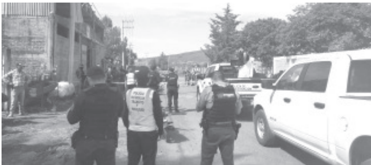
El quien también fuera integrante de las autodefensas, Fuerza Rural y mando de Seguridad Pública de Erongarícuaro, yacía sin vida afuera de su vehículo.

-La víctima, también fue autodefensa e integrante de la Fuerza Rural.