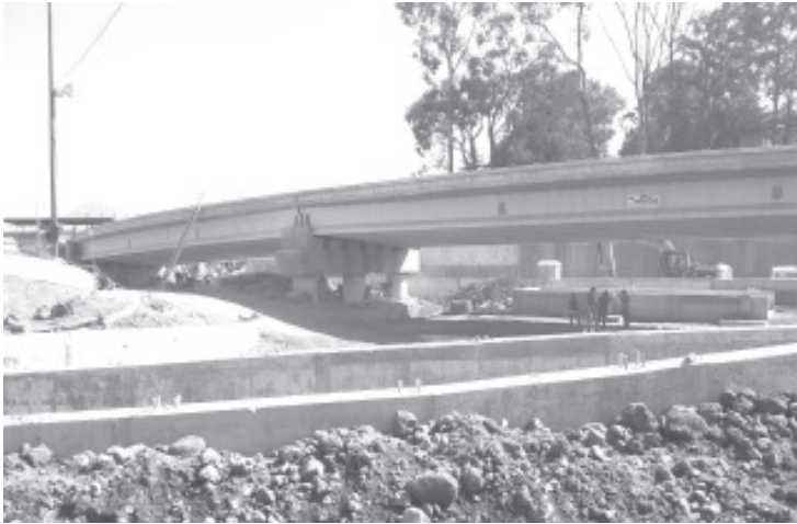
Por la obra las ventas bajaron más del 50%, actualmente se encuentran por los suelos, a la par muchos locales han cerrado sus puertas.

H. Zitácuaro Michoacán, 20 de julio de 2021.- Por: Guadalupe Solache Rebollo. El 31 de agosto del año pasado comenzaron los trabajos de la obra de modernización de la avenida Revolución Sur, en el tramo de Leandro Valle a la desviación a la salida a Toluca. La obra estaba planeada a terminarse en 10 meses