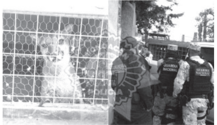
Inspectores Federales de la Vida Silvestre de la PROFEPA, hicieron del conocimiento que el puma sería trasladado para ser liberado al hábitat natural al que corresponde.

Por lo anterior este domingo, alrededor de las 16:40 horas, personal de la SSP Municipal, dieron acompañamiento junto con la Guardia Nacional a los Inspectores Federales de la Vida Silvestre de la PROFEPA, al inmueble donde fue recuperado el felino, al constatar del estado en el que se encontraba el Puma, fue asegurado e hicieron conocimiento que sería trasladado para ser liberado al hábitat natural al que corresponde.