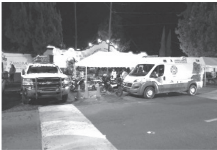
La Coordinación Estatal de Protección Civil mantiene atención permanente durante el periodo vacacional y hace un llamado a la población a la cultura de la prevención.

Morelia, Michoacán, 19 de julio de 2021.- La Secretaría de Gobierno a través de la Coordinación Estatal de Protección Civil mantiene atención permanente durante el periodo vacacional y hace un llamado a la población a la cultura de la prevención.