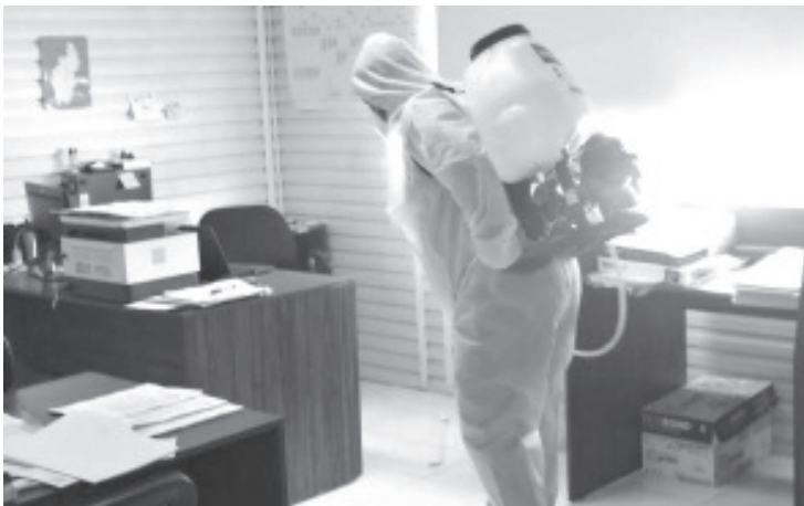
Dentro de los trabajos preventivos, se realizan trabajos de desinfección en oficinas administrativas y lugares donde se presentan mayor aglomeración de personas; asimismo, sitios de uso común.

Cabe destacar que en los inmuebles se mantiene la colocación de filtros sanitarios, la aplicación de gel antibacterial, el uso de cubrebocas, así como la difusión de las recomendaciones y medidas sanitarias a seguir para evitar contraer la enfermedad.