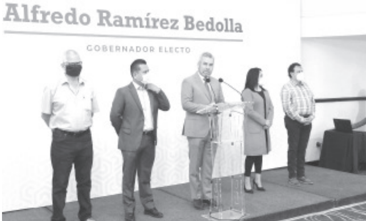
Bedolla dijo que ya se proyectaron posibles ubicaciones para traer las oficinas del IMSS a Morelia, donde se generarían alrededor de 2 mil 600 empleos en una primera etapa.

Morelia, Mich., a 19 de julio del 2021.-En menos de un mes, el gobernador electo de