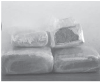
En la Central de Autobuses detectaron una mochila en aparente abandono, al revisar el interior encontraron cuatro paquetes con la droga.

En caso de emergencias, a través de las líneas 911 y 089 se brinda apoyo las 24 horas del día.