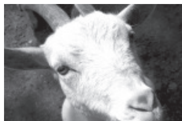
La producción de leche de cabra, se genera en 78 municipios y arroja 3 millones 888 mil litros anuales, con un valor de producción por los 25 millones 398 mil pesos.

Morelia, Michoacán, julio del 2021.- Nuestro estado se coloca en la novena posición nacional en cuanto a la producción de leche de cabra, la cual se genera en 78 municipios y arroja 3 millones 888 mil litros anuales, con un valor de producción que ronda los 25 millones 398 mil pesos.