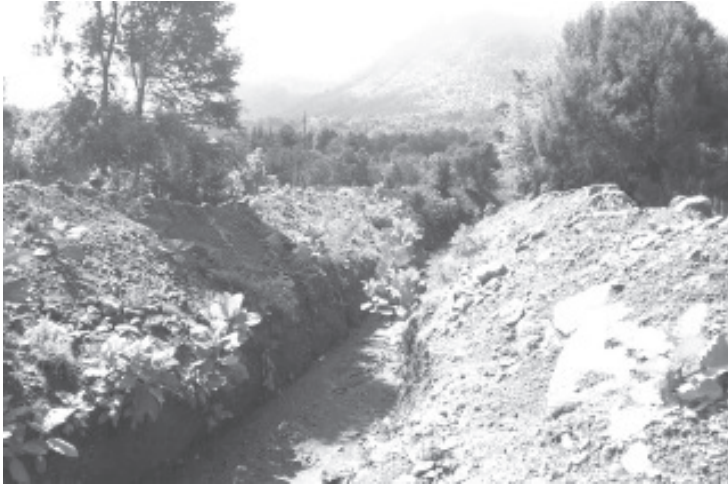
Este zanjón si ha logrado darles algo de seguridad, pero todos tienen miedo, en la lluvia de hace dos semanas cuando llovió mucho si hubo casas a dónde se metió agua.

- El año pasado construyeron una enorme zanja para el agua que baja del cerro cuando llueve