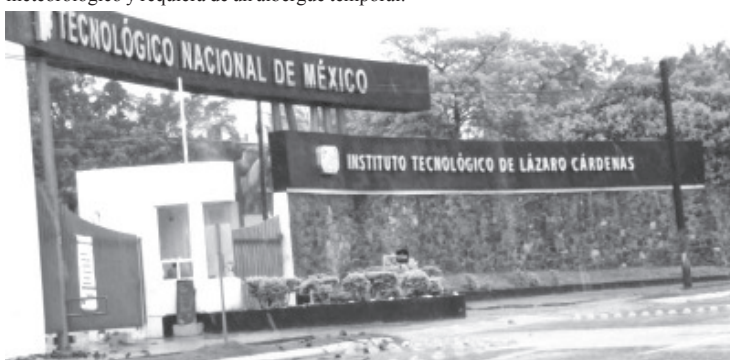
No han sido habilitados otros albergues, pero ya se cuenta con todo listo para recibir a la población en el tecnológico en caso de ser necesario.

Asimismo personal del DIF Municipal se encuentra a disposición para apoyar de manera coordinada con personal de la Secretaría de la Defensa Nacional (Sedena), Marina, Secretaría de Salud de Michoacán (SSM) y demás corporaciones que conforman el Comité Municipal de Protección Civil, para brindar apoyo a la población que resulte damnificada por el fenómeno meteorológico y requiera de un albergue temporal.