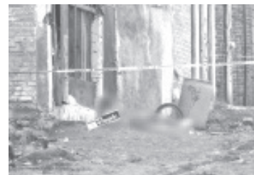
Un hombre que circulaba a bordo de una bicicleta fue asesinado en la colonia Ciudad Jardín, localizada al poniente de Morelia.

Los elementos de la Unidad de Servicios Periciales y Escena del Crimen (USPEC) se encargaron de las investigaciones correspondientes y trasladaron el cadáver a la morgue para la práctica de la necropsia de ley.