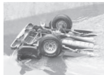
La camioneta cayó de "cabeza" y los cuerpos quedaron atrapados en su interior, situación que requirió la atención especializada de personal de Bomberos.

Al momento no se ha reportado cuáles son los generales de las víctimas del percance.