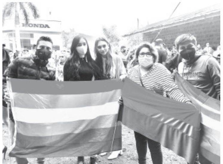
La comunidad LGBTTTIQ+ (Lésbico, gay, bisexual, transexual, transgénero, travesti, intersexual, Queer y más), es ejemplo de una lucha incansable, que ha dado resultados y frutos.

Entre otras acciones que se han impulsado desde el Partido de la Revolución Democrática (PRD) es el Matrimonio civil igualitario, la Ley de identidad de género, la asignación de candidaturas en los procesos electorales, etcétera.