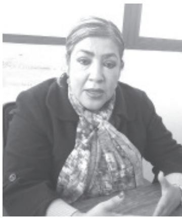
Solís Castro reconoció que el tema de la violencia es grave, sin embargo hay dependencias e instancias para que la mujer acuda, se oriente y reciba ayuda.