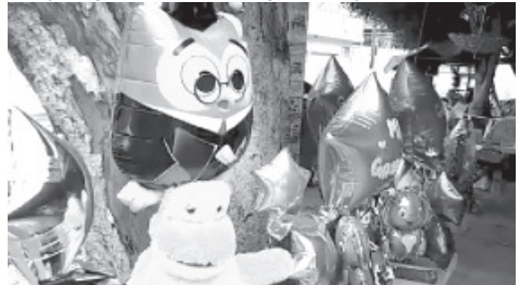
Muchos padres de familia que tienen hijos que este año concluyen un nivel educativo no han querido que este momento pase desapercibido y les compran un arreglo o un regalo.

En este lugar se puede encontrar todo tipo de arreglos para graduación, desde aquellos que son realizados a base de globos, así como los de flores artificiales; como novedad, desde hace algún tiempo se les coloca un muñeco de peluche o un regalo.