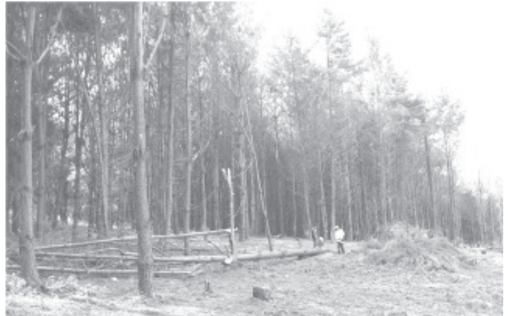
Esta superficie es una plantación forestal y se siguen todos los protocolos como la evaluación de cada árbol marcado, así como la detección de plagas.