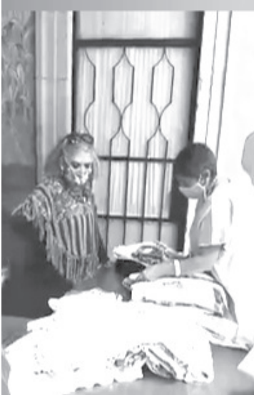
El concurso contempló las ramas textil, alfarería, y ocoshal, para ello 86 artesanos registraron en total 157 piezas, las cuales fueron exhibidas en el patio de la Presidencia Municipal.

Las categorías en las que participaron los artesanos de esta región, fueron: alfarería libre, textil de algodón bordado, deshilado; textil de lana, colchas, cobijas así como sábanas; también gabanes de telar de pedal, gabanes y rebocos de telar de cintura además de artículos a base de ocoshal