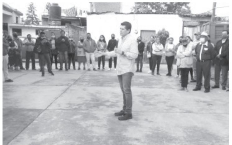
Hoy vengo a agradecerles la confianza que depositaron en mí y a decirles que estamos preparados para recibirlos con las puertas abiertas a partir de septiembre.