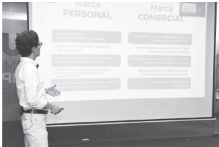
La marca personal, es considerarse uno mismo como una marca comercial, con el objetivo de diferenciarse y lograr éxito empresarial.

medibles, alcanzables, realistas y con tiempo establecido.