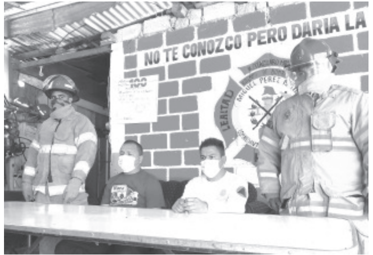
Para recibir el camión se tiene previsto un espectáculo musical, con la participación de grupos en la Unidad Deportiva La Joya.