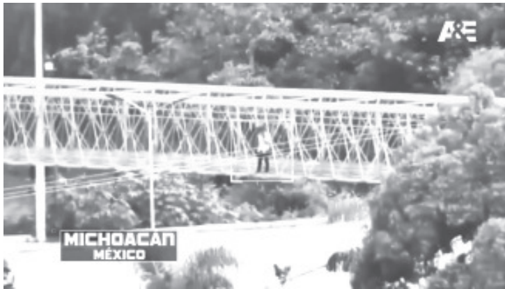
Las labores de los operadores, permitieron alertar a los policías para atender y evitar que un hombre lograra saltar de un puente peatonal, con intento de quitarse la vida