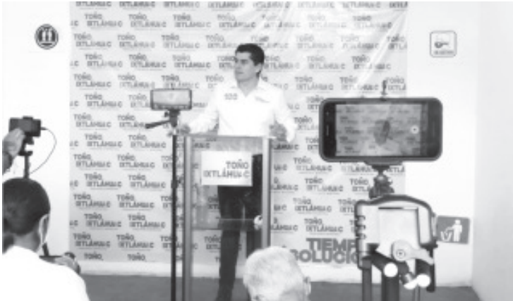
No puede haber vacío, ni división, debemos trabajar coordinadamente con Estado y Federación para conseguir los objetivos planteados en este rubro.

-La mejor política es invertir en la educación, para superar la violencia.