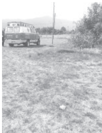
Una niña que jugaba con otros menores, cerca de un pozo de agua cayó dentro y cuando la sacaron ya no presentaba signos vitales.

El hecho se notificó al personal de la Fiscalía General del Estado para que se realizaran las diligencias correspondientes.