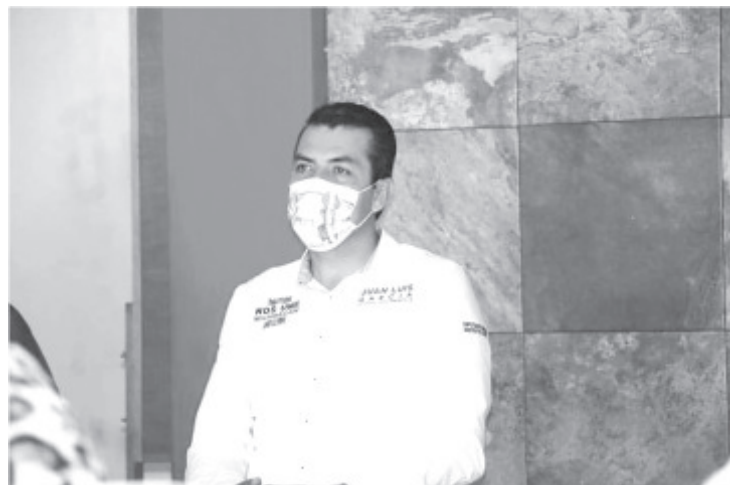
El candidato llamó a la estructura del tricolor a invitar a la gente a votar en libertad y a no permitir que los adversarios pretendan coaccionar el voto amenazando a la ciudadanía.

Puntualizó que el triunfo electoral será apenas el inicio del trabajo que, en equipo, seguirán realizando para que Michoacán se mantenga en la ruta del desarrollo, “para que nuestros campesinos, comerciantes y artesanos reciban apoyos a su altura; para que nuestras mujeres vivan seguras; para que nuestros jóvenes tengan oportunidades reales de salir adelante, no sólo dádivas gubernamentales”.