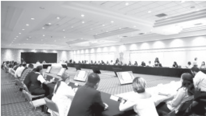
“Una súper ola se podría avecinar si no nos cuidamos. No bajemos la guardia, es muy importante revisar estas proyecciones porque si nos alertan”.

Llama Comité Estatal de Seguridad en Salud a reforzar medidas sanitarias. INE destaca las medidas sanitarias en las casillas para el día de la elección.