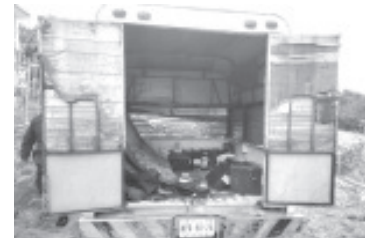
La acción se registró en Curungueo, sitio donde personal de la Policía Michoacán ubicó a dos personas al interior de las instalaciones de la compañía telefónica.

En caso de emergencia, a través de las líneas 911 y 089 se brinda apoyo las 24 horas del día.