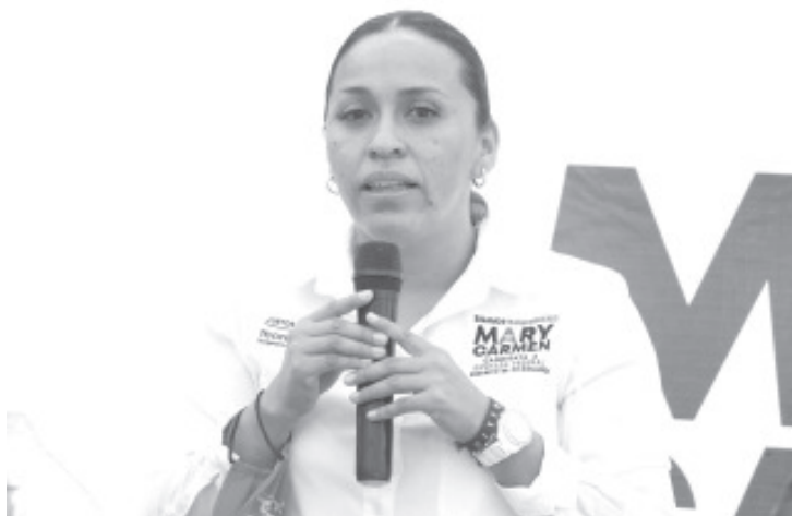
La candidata abordó una serie de compromisos, que aseguró, dará cumplimiento cuando los habitantes del distrito reafirman su apoyo a través del voto este 6 de junio.

5. Realizar gestiones en las diferentes dependencias de gobierno, ya que se eliminó el ramo 23 por falta de transparencia los legisladores no pueden etiquetar, de manera directa, obra pública, sin embargo será gestora ante los diferentes órdenes de gobierno correspondientes.