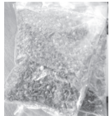
En la calle Lago Mitla, lograron los agentes de la Policía Michoacán efectuar la detención del implicado, a quien le fue localizado el mencionado enervante.

En caso de emergencias, a través de las líneas 911 y 089 se brinda apoyo las 24 horas del día.