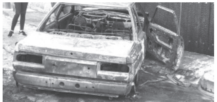
Varios desconocidos quemaron parcialmente una camioneta de la empresa Marinela, así como dos automóviles particulares y tres patrullas, en diferentes sitios de Morelia.

Distintas corporaciones policiales se mantienen en alerta y en la búsqueda de los individuos que han ocasionado las afectaciones ya relatadas. Cualquier situación favor de reportarla al número de emergencias 911.