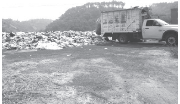
También este fin de semana se espera corregir el incidente en los terrenos de la feria, con apoyo de los carros del servicio concesionado se sacará toda la basura

Recordó que estos días han sido muy desgastantes en cuestión de trabajo, ya