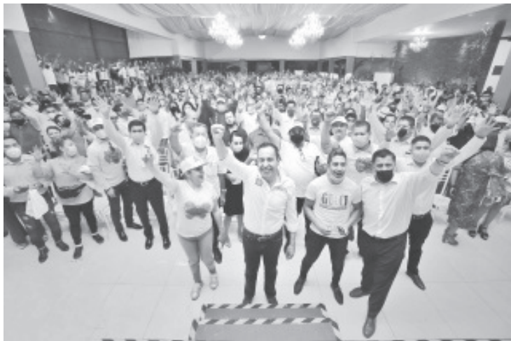
Carlos Herrera revaloró la noble labor de los educadores y se comprometió a garantizar sus derechos laborales, prestaciones de ley y preparación profesional.

-Mas de 3 mil profesores se reunieron con el candidato del Equipo por Michoacán para refrendarle su apoyo, en busca de una buena relación gobierno-maestros.