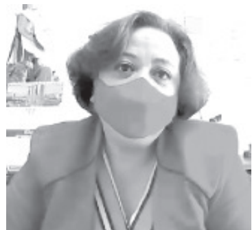
Ante la pandemia de Covid 19 que ha provocado un importante número de fallecimientos, a nivel regional, como en Zitácuaro, han aumentado las casas con servicios funerarios.

Arriaga Mondragón, recaló que por el momento se ha sancionado a 2 establecimientos por no cumplir con la Ley General de Salud, recientemente sostuvieron una reunión con propietarios de estos negocios y con representantes legales, para trabajar en conjunto y regular este sector. Estas acciones van a continuar, ya que sólo el 75% cumplen con todos los lineamientos.