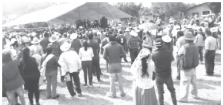
A pesar de la inconformidad de muchos e infinidad de acusaciones de unos a otros, gritos, así como pancartas, la asamblea se realizó.